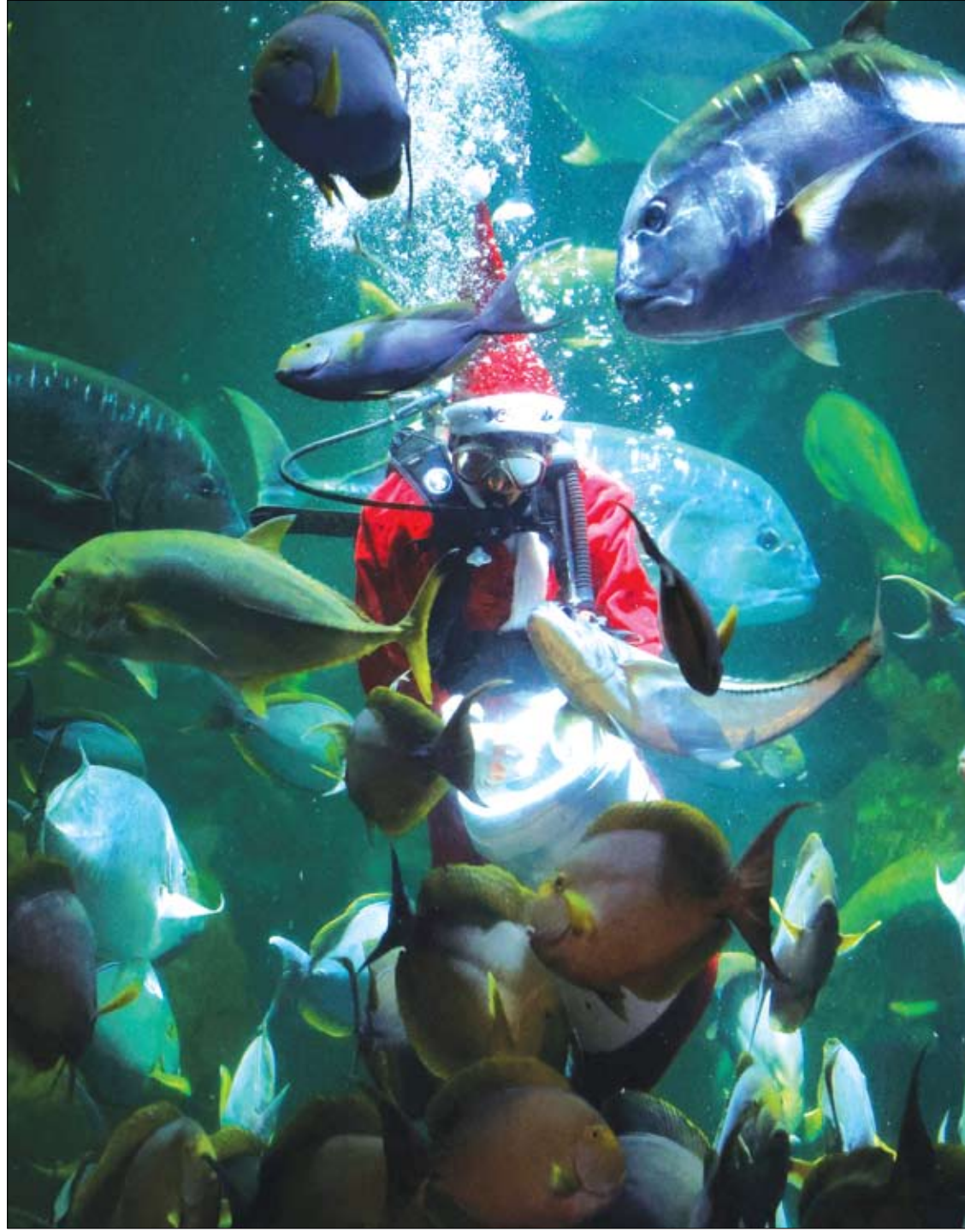
القواص فشري هاريانسيا ، 26 عاماً ، يرتدي زي بابا نويل ، يطعم الأسماك خلال عرض في احتفالات عيد الميلاد في حوض أسماك في جاكرتا، إندونيسيا.