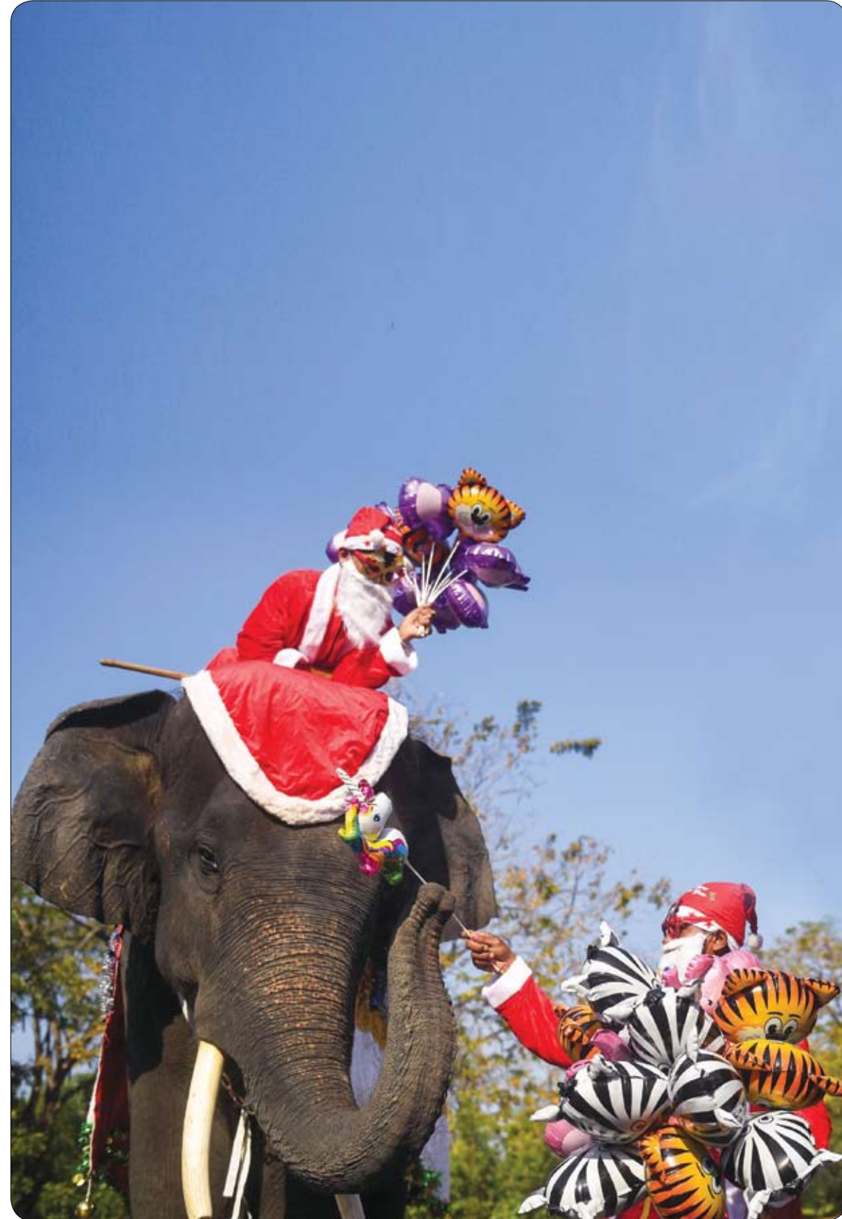
رجل يرتدي زي بابا نويل يقدم هدية لطفل ليسلمها للطلاب قبل احتفالات عيد الميلاد في مدرسة ابتدائية في أيوثايا ، تايلاند.

وقالت صحيفة "السن" البريطانية عن مدير أعمال التطوير في "مكدونالدز" ماكس كارمونا، قوله: "مع استمرار تغير احتياجات عملائنا، نحن ملتزمون بإيجاد طرق جديدة لخدمتهم بشكل أسرع". وأضاف كارمونا: "نبتكر دائما تحسين تجربة عملائنا، بغض النظر عن كيفية طلبهم أو استلامهم طعامهم. أنا فخور جدا بأن يكون لدينا هذا المفهوم الجديد في عالم المطاعم". من جانبه، قال المسؤولون عن حقوق الامتياز في الشركة كيث فانيسك: "لا نتيج لنا التكنولوجيا في هذا المطعم خدمة عملائنا بطرق جديدة ومبتكرة فحسب، بل تجعل التجربة أكثر إمتاعا للجميع".