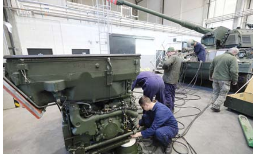
ميكانيكيون عسكريون أوكرانيون يتدربون على إصلاح مدافع الهاوتزر الألمانية في ليتوانيا.

الأمريكي جو بايدن هذا الأسبوع بإمادها بنظام دفاع جوي أمريكي من طراز باتريوت ووصف بوتين بنظام باتريوت بأنه قديم للغاية، وقال إن روسيا ستتكيف معه. وبعد تكبدها سلسلة من الهزائم ضمن ما تسميه موسكو عملية