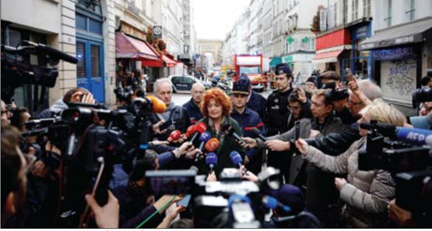
المدعية العامة في باريس تتحدث إلى الصحفيين بالقرب من الشارع حيث أطلقت الأعيرة النارية

تحت رعاية صاحب السمو الشيخ محمد بن زايد آل نهيان رئيس الدولة حفظه الله، تعقد النسخة الـ 15 من أسبوع أبوظبي للاستدامة 2023 في الفترة من 14 إلى 19 يناير المقبل. ويعد الأسبوع مبادرة عالمية أطلقتها دولة الإمارات، وتضمها شركة أبوظبي لطاقة المستقبل مصدر الرائدة عالميا في مجال الطاقة النظيفة، ومن المنتظر أن يضم الأسبوع سلسلة من الجلسات رفيعة المستوى التي تركز على الأولويات الرئيسية للتنمية المستدامة قبل انعقاد الدورة الثامنة والعشرين لمؤتمر الأطراف في اتفاقية الأمم المتحدة الإطارية بشأن تغير المناخ COP28، الذي يقام في دولة الإمارات في الفترة من 30 نوفمبر إلى 12 ديسمبر 2023. وسيعقد أسبوع أبوظبي للاستدامة تحت شعار معا تعزيز العمل المناخي وصولا إلى مؤتمر COP28. (التفاصيل ص3)