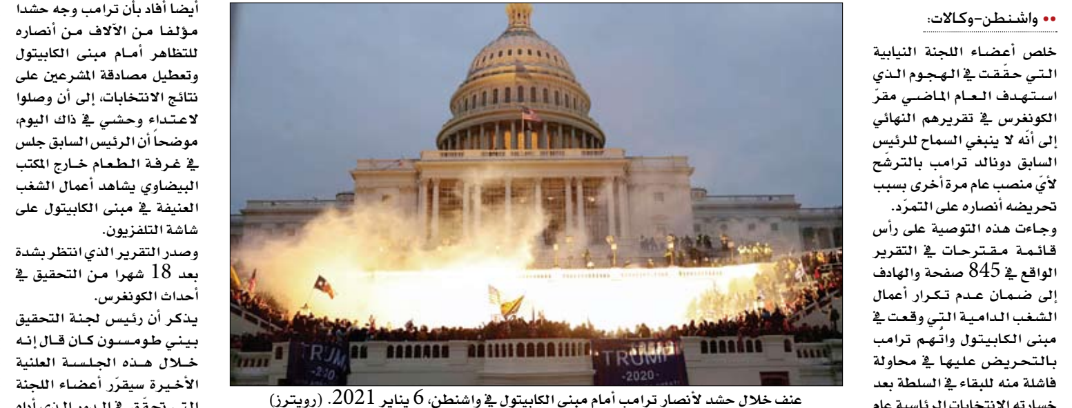
عنف خلال حشد لانصار ترامب أمام مبنى الكابيتول في واشنطن، 6 يناير 2021.

ومحاولة إبطال نتائج الانتخابات الرئاسية في نوفمبر 2020 والتحريض على الهجوم على مقر الحكومة. ويدل ذلك بدين التقرير الكامل ويلقي باللوم على الرئيس السابق بالهجوم، وفقاً لسلسلة جلسات الاستماع الصحفية للجنة ومخلصها التنفيذي، خصوصا وأن هناك شهودا أوضحوا أن من اقتحام الكونغرس. كما أضاف أن الرئيس السابق انخرط في مؤامرة لقب نتيجة انتخابات 2020. حيث تعقدت اللجنة برئاسة النائب الديمقراطي بيني طومسون، ونائبها وكومبيرا (وسط) وعلى الرحلات إلى الأقاليم. أن هناك أدلة كافية لوزارة العدل لقتاضة ترامب في 4 تمم محددة بينها عرقلة إجراء رسمي والتامر