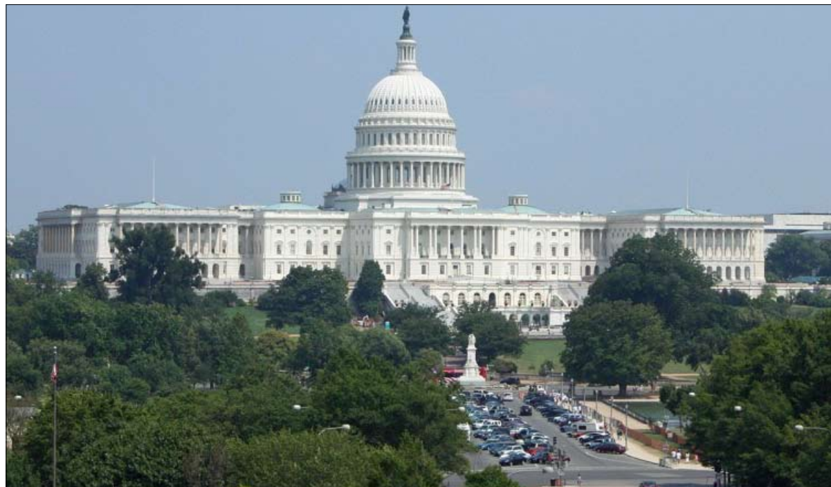
مجلس الشيوخ الأمريكي انقلاب في الأفق