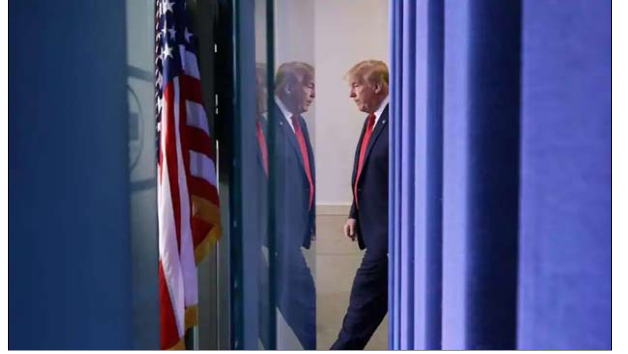
خسارة ترامب ستجني على مجلس الشيوخ

خاصة تجعل النتائج غير متوقعة تماماً. في ولاية أيوا، تحافظ السيناتور الحالية جودي إرنست على تقدم ضئيل في معظم استطلاعات الرأي، لكنها هشة، بسبب، ليس أقله، الانتشار السريع للوباء في تلك الولاية.