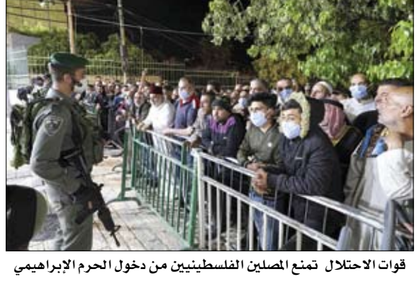
قوات الاحتلال تمنع المسلمين الفلسطينيين من دخول الحرم الإبراهيمي

ولم تفرض السويد حالة إغلاق تام في مدن البلاد بخلاف جيرانها الأوروبيين، لكنها طلبت من مواطنيها مراعاة مبدأ التباعد الاجتماعي. إلى ذلك، سُجّلت رسمياً أكثر من 5.5 مليون إصابة بفيروس كورونا المستجد في العالم، أكثر من ثلثها في أوروبا والولايات المتحدة، وفق تعداد أعدته وكالة فرانس برس استناداً إلى مصادر رسمية أمس الثلاثاء. وأحصى ما لا يقل عن 5.505.307 إصابة، بينها 346188 وفاة، خصوصاً في أوروبا، القارة الأكثر تضراً من الوباء مع 2.047.401 إصابة و172824 وفاة، والولايات المتحدة مع 1.662.768 إصابة بينها 98223 وفاة. وتضاعف عدد الإصابات المعلنة في العالم خلال شهر وسُجّلت