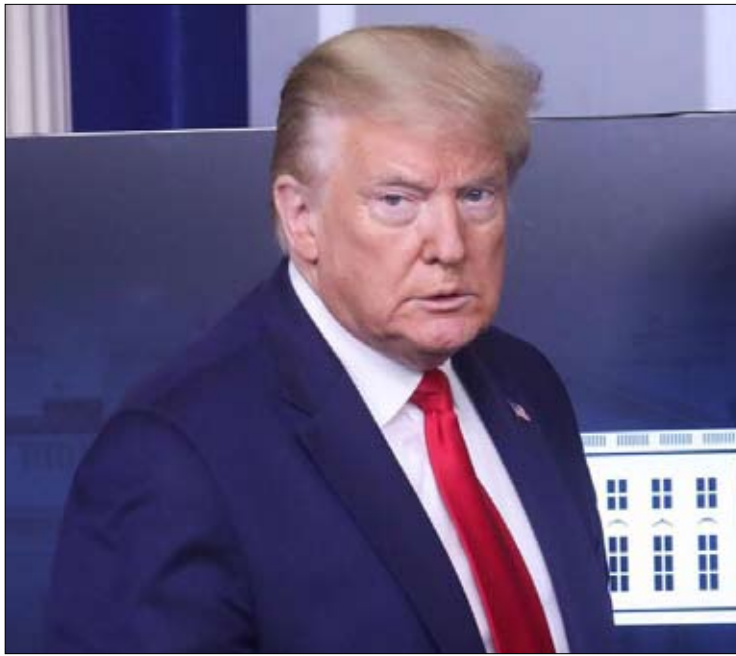
حرب على كل الجبهات