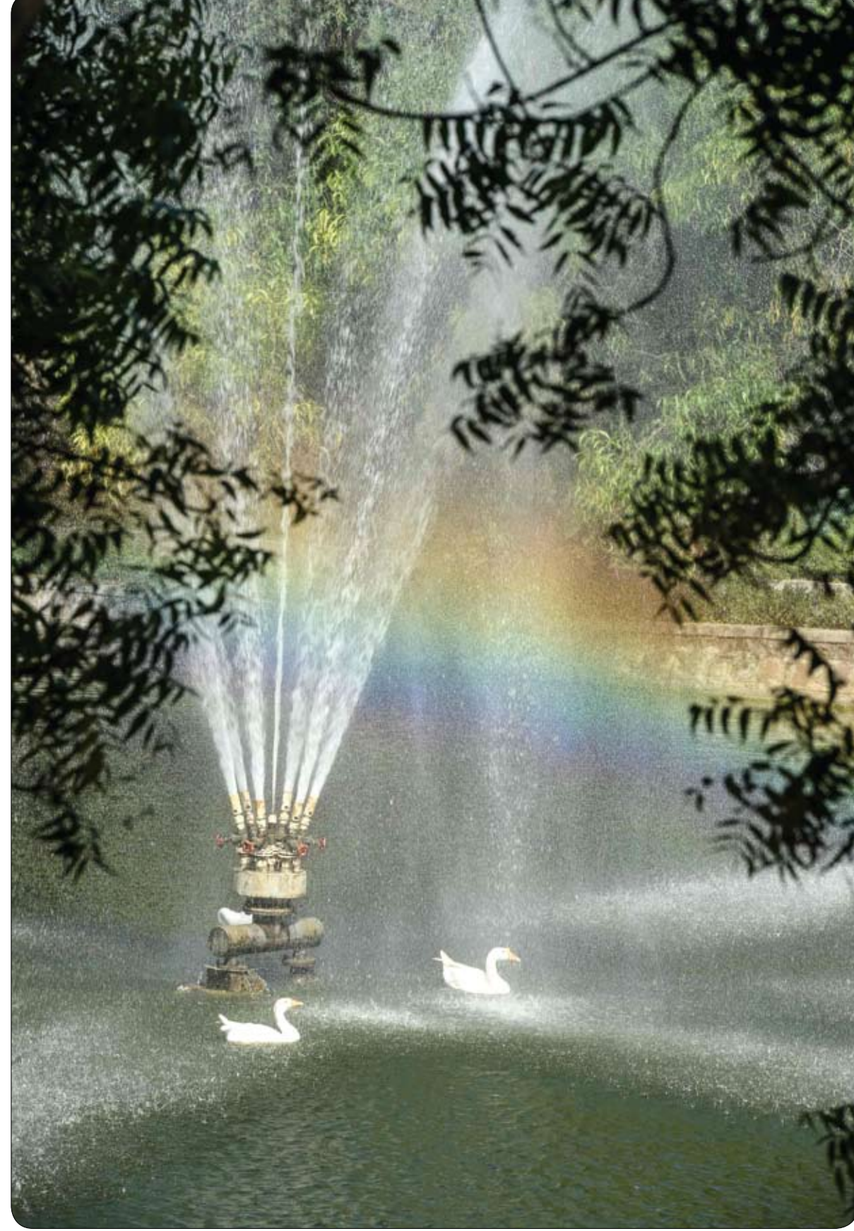
تظهر ألوان قوس قزح فوق الماء بينما تسبح البجع حول النافورة في بحيرة بحديقة لودهي في نيودلهي.

ذكرت تقارير صحفية، أن مغني الراب البريطاني، سوارمز، نجا من حادث سير، بعدما بدا حاضرا في موقع اصطدام سيارة فارهة من نوع فيراري بحافلة ركاب في العاصمة لندن. وبحسب موقع شبكة سكاى نيوز عربية، فإن المغني كان في موقع الحادث، ولكن لم يُعرف ما إذا كانت سيارة الفياري ملكه، ولا ما إذا كان يقودها. وكان سوارمز في الموقع الذي شهد الحادث بين مركبة من نوع فيراري تصل قيمتها إلى 250 ألف جنيه إسترليني وحافلة. وقام سوارمز الذي يحظى بمتابعة مليون شخص على موقع إنستغرام، بنشر صورة السيارة المحطمة وهي من طراز 488 جي تي بي، يوم الأحد. في غضون ذلك، لم يجر الإعلان عن أي إصابة من جراء الحادث الذي وقع في أحد شوارع العاصمة لندن. وتستطيع السيارة الرياضية الإيطالية التي تعرضت لأضرار كبيرة من الجهة الأمامية، أن تسير بسرعة تصل إلى 205 أميال في الساعة. وحضرت ثلاث فرق من الطوارئ، بشكل سريع، إلى المكان، لأجل معاينة الحادث الذي أثار فضول الكثيرين في الموقع.