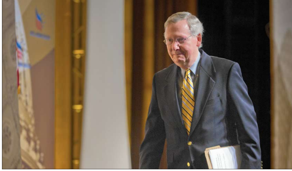
زعيم الجمهوريين في خطر