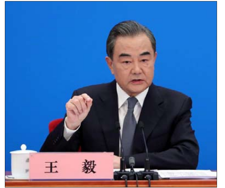
الصين... انها حرب باردة جديدة