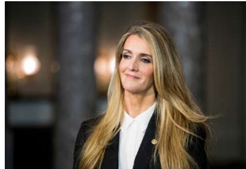
فضيحة تهز عرش السيناتور كيلي لوفلر

معظم المؤشرات العامة تتعارض مع إمكانية إعادة انتخاب دونالد ترامب