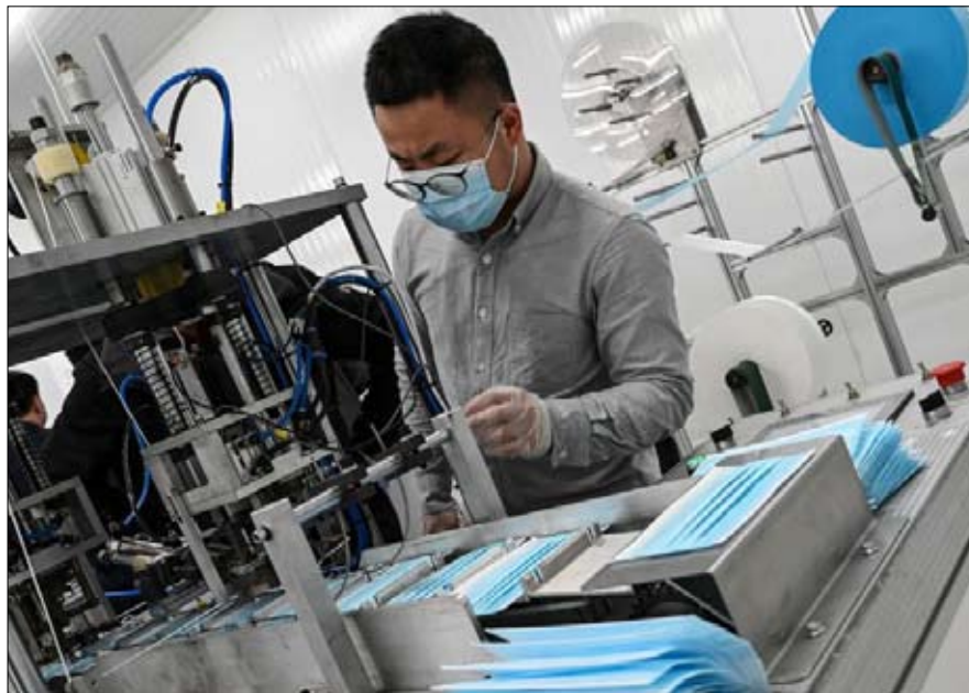
حرب تجارية سرعها فيروس كورونا

هذه «الحرب الباردة الجديدة» تحدث في سياق مختلف تماماً عن الأولى