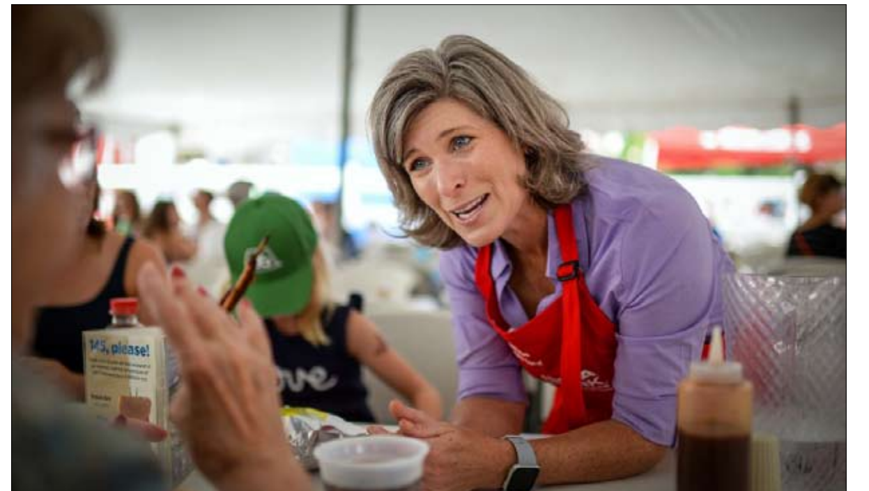
فيروس كورونا قد يهزم السيناتور الحالية جودي إرنست