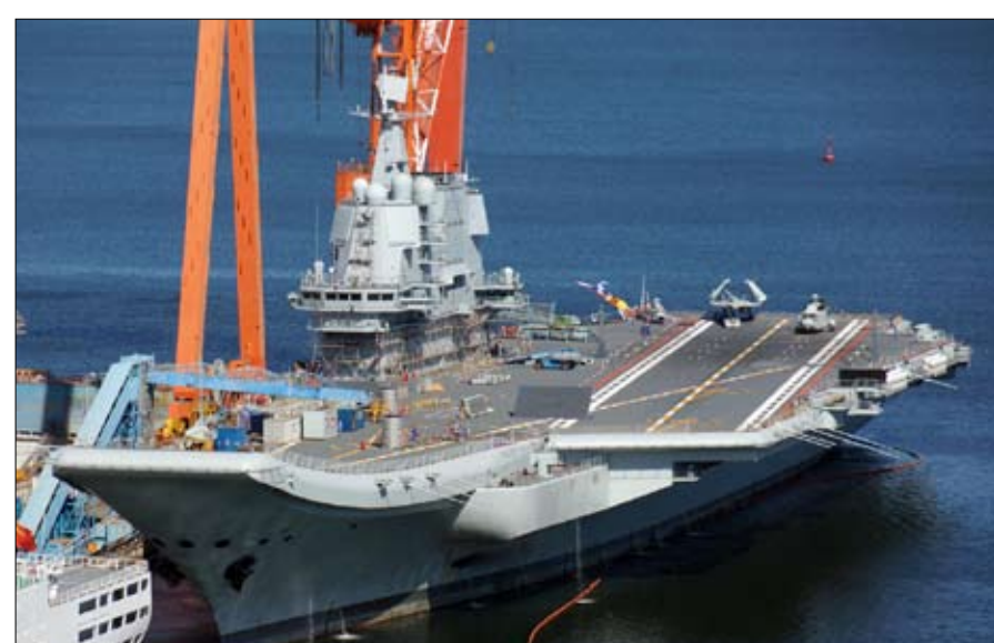
حرب باردة في بحر الصين تتجاوز البعد العسكري

رأساً على عقب "رأساً على عقب" هذه "الحرب الباردة الجديدة" تحدث في سياق مختلف تماماً عن الأولى، يضيف دومينيك مويسي، المستشار الخاص لمعهد مونتيني، ونائب مدير المعهد الفرنسي للعلاقات الدولية، مشيراً إلى أن "الحرب الباردة بين الاتحاد السوفياتي والولايات المتحدة كانت تنافسية فقط على المستوى العسكري، وليس على المستوى الاقتصادي إطلاقاً"، ويضيف "كنا في عالم منقسم وعميق ولم تكن معلولين. لم تكن أمريكا بحاجة إلى الاتحاد