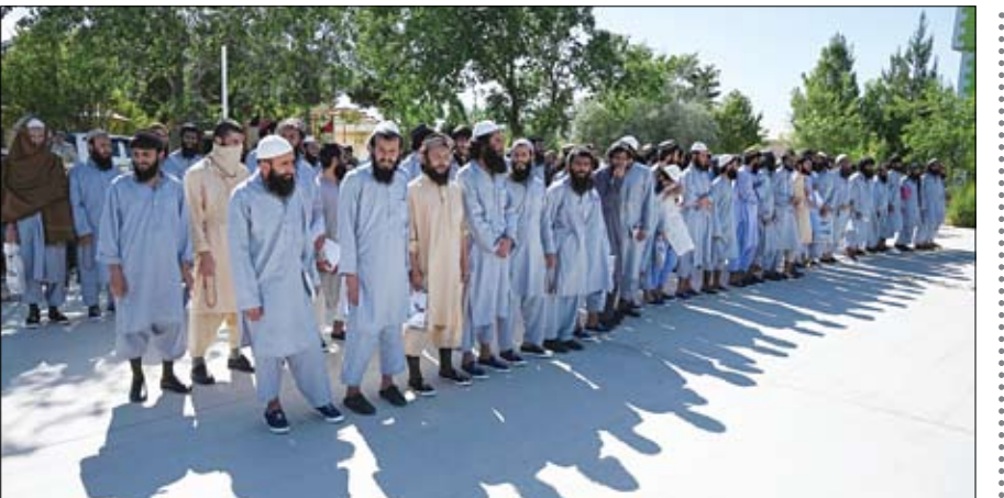
سجناء طالبان يقفون في الطابور أثناء إطلاق سراحهم من سجن باغرام

قررت الهيئة الاتحادية للضرائب تأجيل تطبيق منع توريد ونقل وتخزين وحيازة جميع أنواع تبغ الأرجبية المسعل وفائف السجائر التي تسخن كهربائياً في الدولة والتي لا تحمل طواع ضريبية رقمية إلى الأول من يناير 2021 وذلك في إطار مساندة ودعم الهيئة المستمر لقطاعات الأعمال المتأثرة بالإجراءات الاحترازية للوقاية من فيروس كورونا المستجد ولتمكينهم من القيام بالتزاماتهم الضريبية. (التفاصيل ص2)