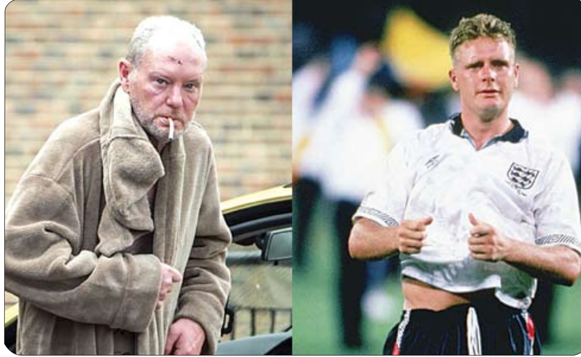
مع رينجرز، حين قاده للفوز بلقبين متتاليين في الدوري الاسكتلندي. وربما كانت أكثر فتراته إنتاجا، وفي وقت لاحق بنفس العام، ثم أصيب في كاحله مع

نفسه في مشاكل، وتلقى تهديدات بالقتل من الجيش الجمهوري الإيرلندي، بسبب طريقة احتفاله بهدف أثار جدلا بين المواطنين الكاثوليك في جلاسجو. وإذا كانت هناك لحظة تلخص مسيرة جاسكوين، فهي لحظة هدفه الساحر ضد اسكتلندا، في بطولة أوروبا 1996، واحتفاله الشهير الذي أغضب وسائل الإعلام، بعد السخريه من إفراطه في تناول المشروبات الكحولية في هونج كونج، قبل البطولة.