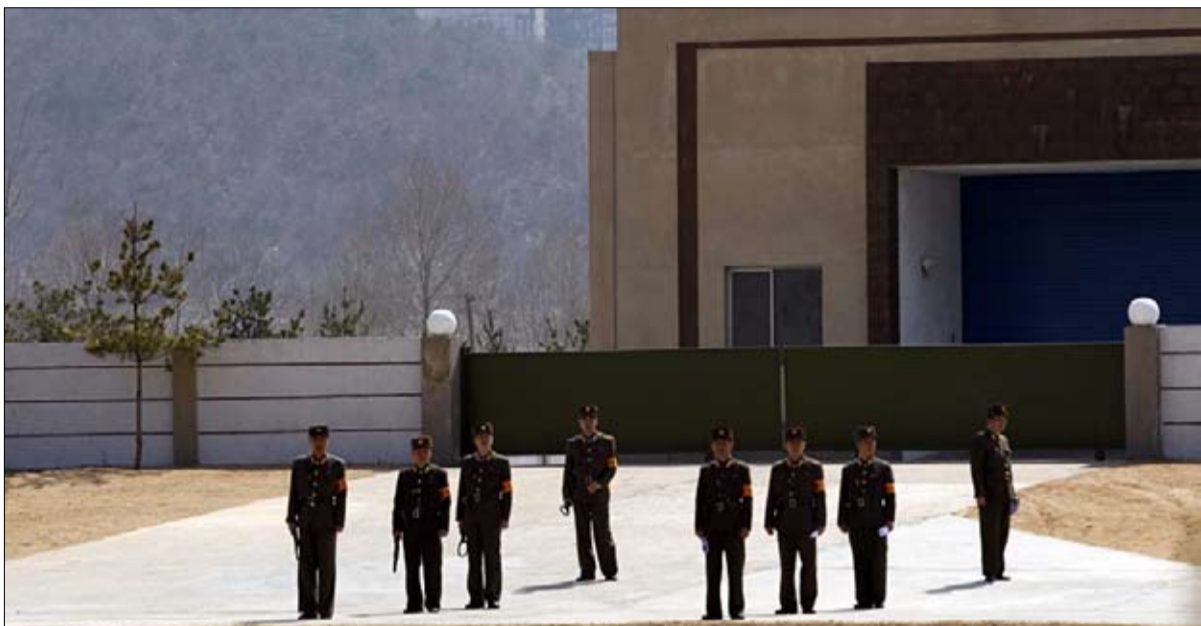
القاعدة التي من الوارد ان تكون هدفا امريكا