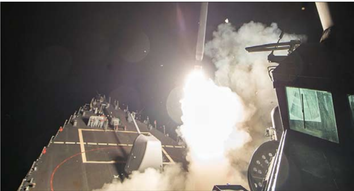
الضربة تغيير للمعادلة الداخلية