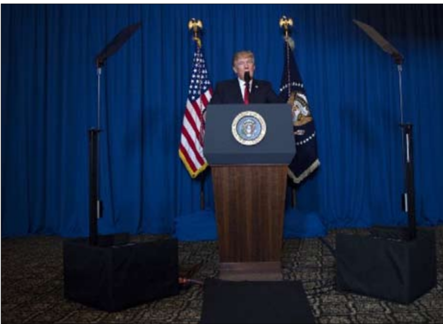
تحول في سياسة ترامب