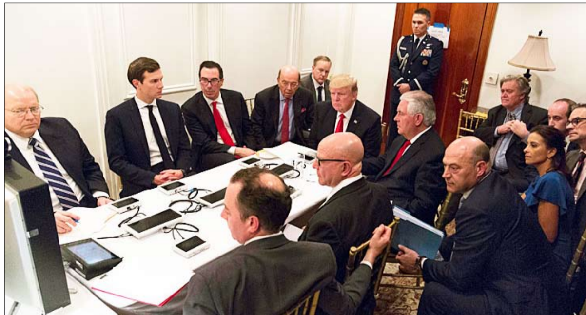
متابعة الضربة الأمريكية في سوريا