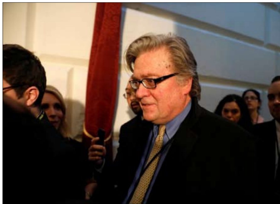
هل خسر بانون سطوته على القرار؟