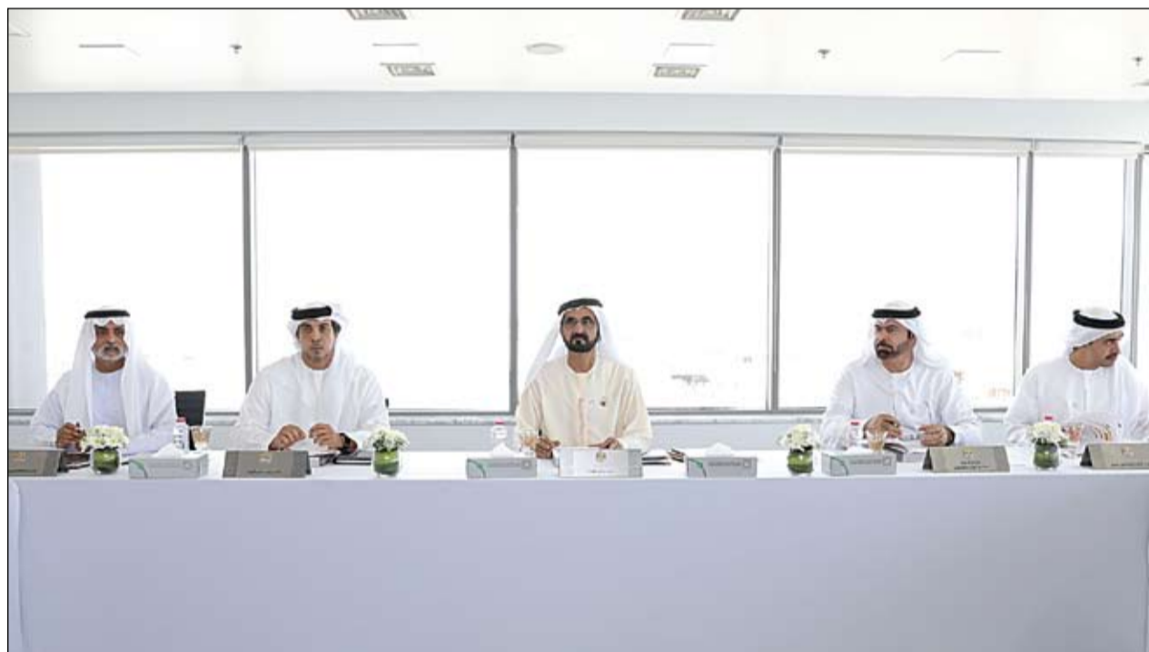
محمد بن راشد خلال ترؤسه جلسة مجلس الوزراء في موقع محطة بركة للطاقة النووية في منطقة الظفرة بأبوظبي