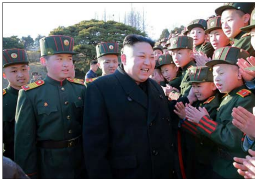
هل تكون الضربة القادمة من نصيب كوريا الشمالية؟

«نفس الأيديولوجية»، إذا كانت كوريا الجنوبية واليابان تملكان كل أسباب الخوف من ضربة، فكيف سيكون رد فعل الصين؟ إن بيونغ يانغ وبكين نظامان شقيقان يشتركان في نفس الأيديولوجية، تُذكر فاليري نيكيت. وتربط الكوريتين الشماليين والصينيين معاهدة صداقة وتعاون موقعة عام 1961 تنص على اتفاقيات للدفاع المشترك. "الصين منزعة جدا من اختبارات كوريا الشمالية ولكن ليس بما يكفي لتخاطر بخسارة حليف في حين يحتل الأمريكان شبه الجزيرة"، تقول المتخصصة.