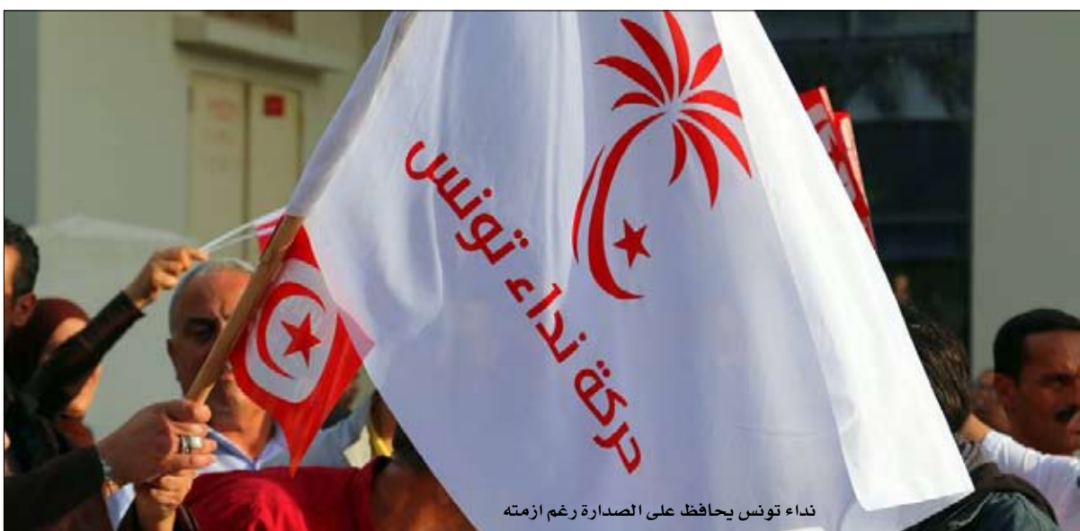
نداء تونس يحافظ على الصداقة رغم أزمة

في منتصف شهر مارس، أعرب ترامب عن أسفه من أن الصين لم تفعل شيئا يذكر للمساعدة في حلّ وجع الرأس الكوري الشمالي. وقال ترامب الاسبوع الماضي لصحيفة فاينانشال تايمز "إذا لم تحلّ الصين القضية الكورية الشمالية، فسوف نقوم بذلك... كان ذلك بضعة أيام قبل ضرب سوريا أمام اندهاض الجميع. عن ليبيراسيون الفرنسية