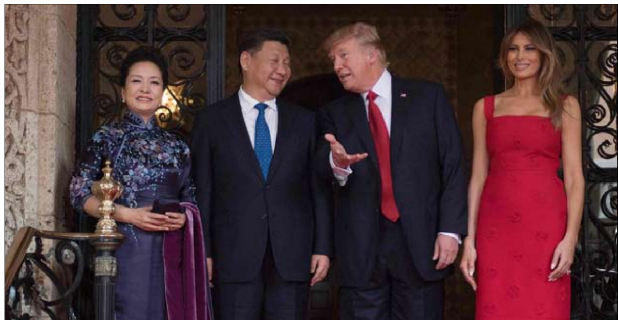
من الوادى إلى مواجهة محتملة

الكورية الجنوبية واليابانية الأهلة بالسكان. فيصاويح حاملة لرووس كيميائية وحتى بمدفعية متداعية جزئيا، سيلحق ضررا كبيرا. من جهة أخرى، فإن كوريا الشمالية تنشر 200 صاروخ رودونغ على كامل أراضيها يتسنى إطلاقها من مركبات متقلبة، وهذا يعقد كشفها واعتراضها.