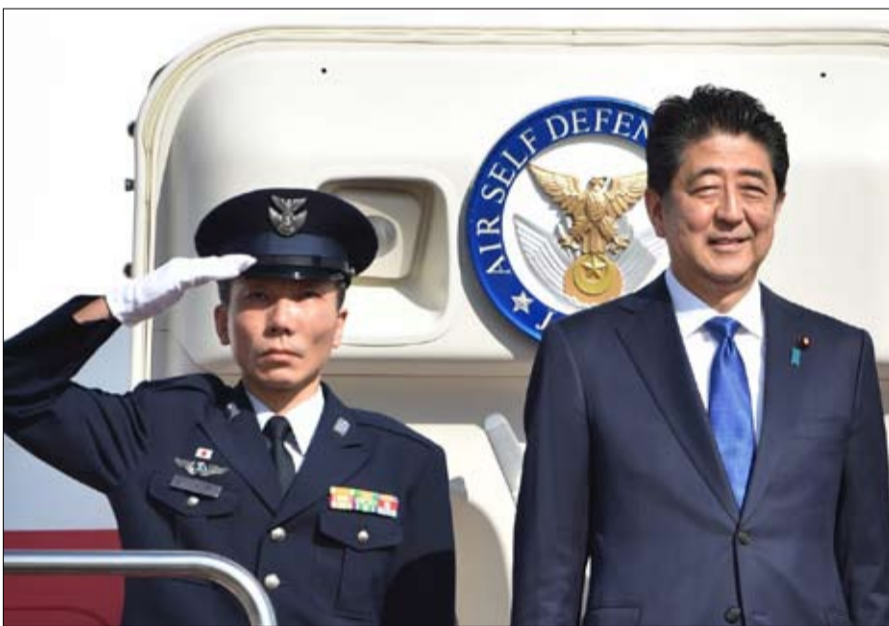
مخاوف يابانية من ضربة امريكية على حدودها