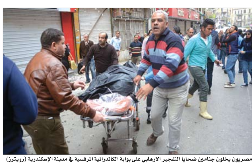
مصريون يخلون جثامين ضحايا التفجير الإرهابي على بوابة الكاتدرائية المرقسية في مدينة الإسكندرية

والضابطه وأمين شرطة من أمن الإسكندرية وعدد من المواطنين ووقوع العديد من الإصابات. وأورد المسؤول الأمني أن اليابا توأصروس الثاني بابا الإسكندرية وبيطريوس الكرارة المرقسية الذي كان يتراس الصلوات في الكنيسة بمناسبة أحد الشعانين لم يصب بسوء، لكن مصدراً كنيسياً أكد في وقت سابق أن اليابا توأصروس غادر الكنيسة قبيل الانفجار. وقبل ذلك بساعتين فقط، انفجرت قنبلة داخل كنيسة في طنطا، وقال محافظ الغربية اللواء أحمد ضيف ترؤيض إن الانفجار حدث داخل الكنيسة أثناء الصلاة. ونقلت وكالة أنباء الشرق الأوسط المصرية الرسمية عن مصدر مسؤول أن انتحارياً يشتبه في تنفيذ التفجير في الكنيسة، وأضاف المصدر أنه عُثر على أشلاء يشتبه في كونها لنتج العملية داخل قاعة الصلاة بالكنيسة، لكن ذلك لم يتأكد بعد. هذا ونفت وزارة الداخلية المصرية وقوع أي تفجيرات أخرى أمس.