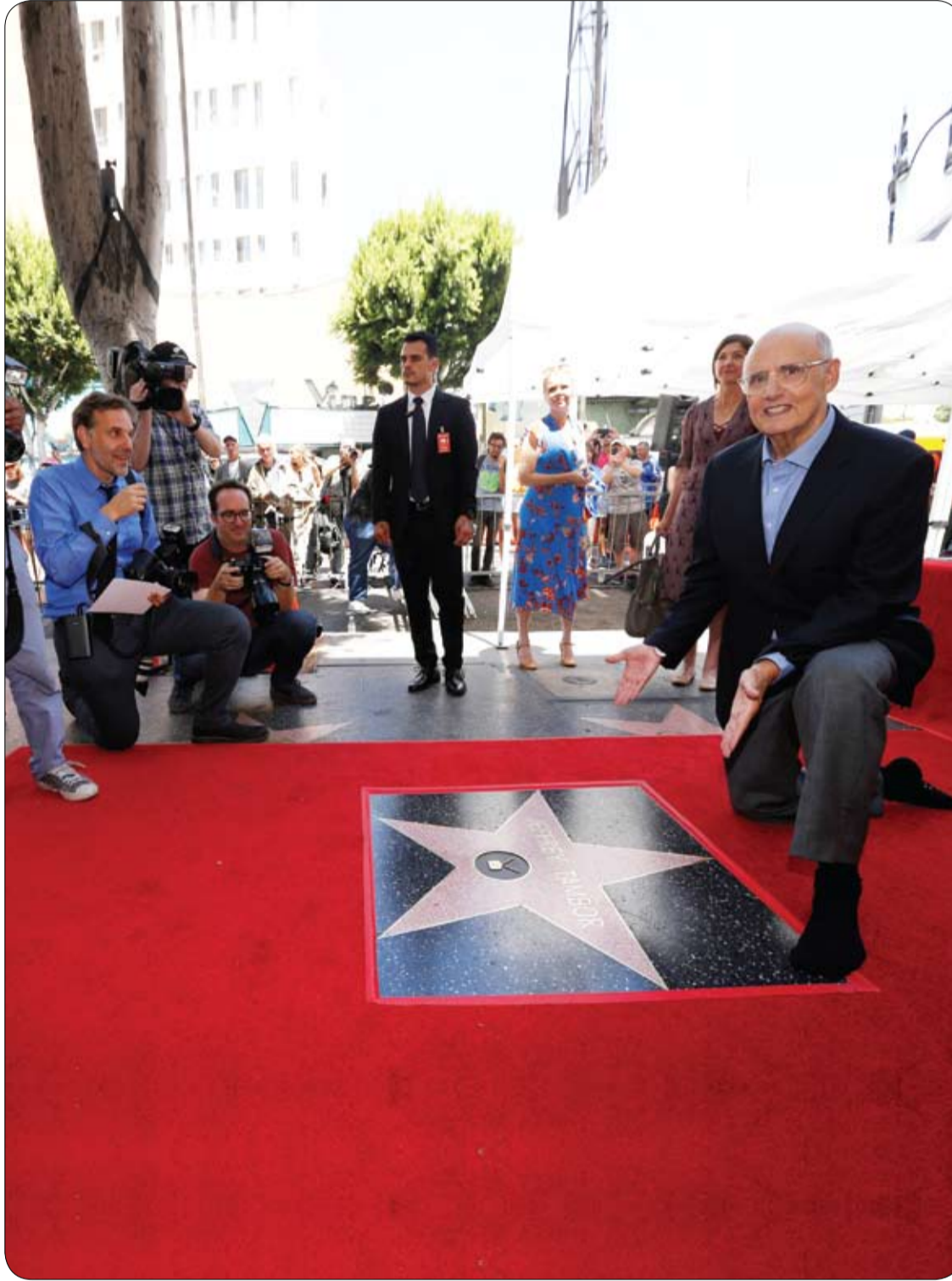
الممثل جيفري تامبور يعبر عن سعادته ببنيه نجمة على مشى المشاهير في هوليوود.

-مشروبات الطاقة: يعتبر السكر هو العنصر الأساسي في الكثير من مشروبات الطاقة، وبالتالي فإنها تساعد على تسوس الأسنان.