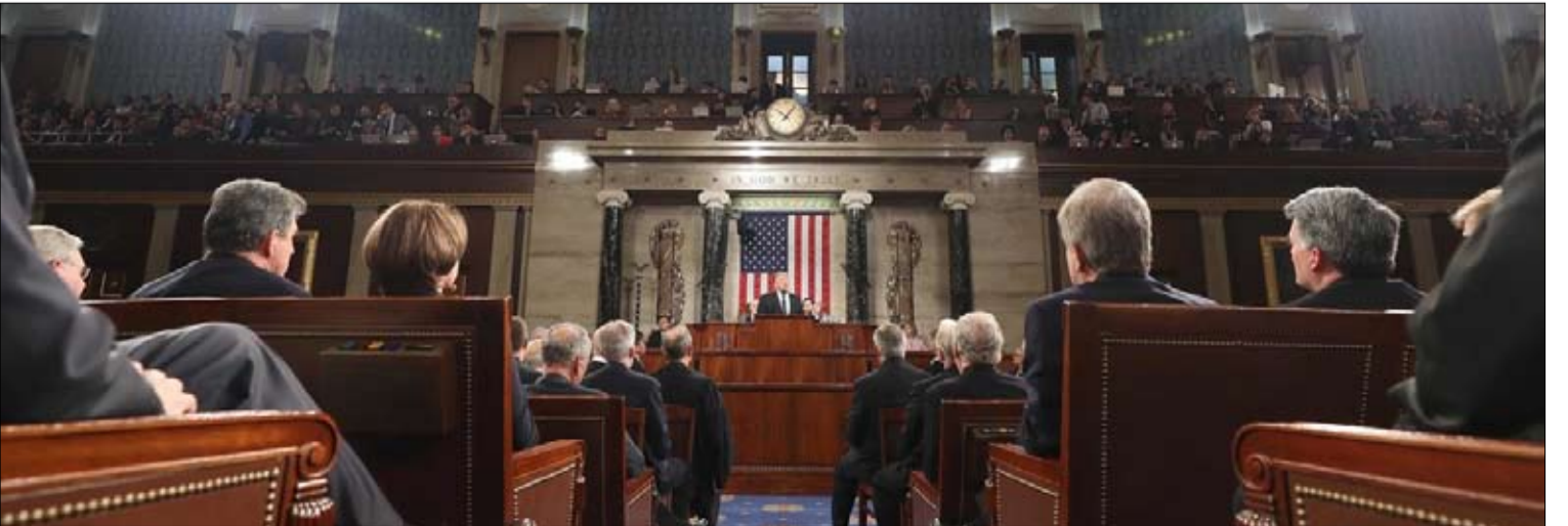
ترامب ممارسة السلطة شي آخر