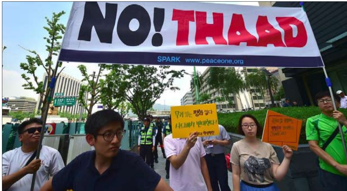
لا للدرع الصاروخي الامريكي