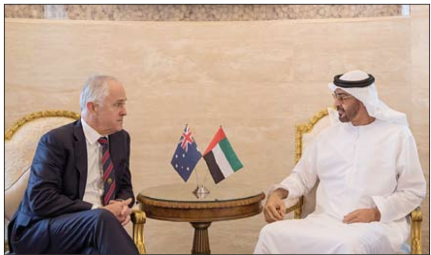
محمد بن زايد خلال استقباله رئيس الوزراء الأسترالي

استقبل وفداً من شركة أبوظبي للموانئ والرئيس التنفيذي لشركة بلاكستون الأمريكية محمد بن زايد يبحث مع رئيس الوزراء الأسترالي علاقات التعاون والمستجدات الإقليمية والدولية •• أبوظبي-وام: استقبل صاحب السمو الشيخ محمد بن زايد آل نهيان ولي عهد أبوظبي نائب القائد الأعلى للقوات المسلحة أمس بقصر الشاطئ معالي ماكتولم ترينول رئيس وزراء أستراليا الذي يزور البلاد حالياً. جرى خلال اللقاء بحث تعزيز علاقات الصداقة والتعاون بين دولة الإمارات العربية المتحدة وأستراليا في مختلف المجالات التجارية والاقتصادية. الجابر وزير دولة رئيس مجلس إدارة الشركة.