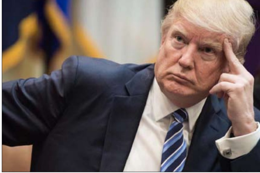
مائة يوم ومحارر شعبيته لم يرتفع