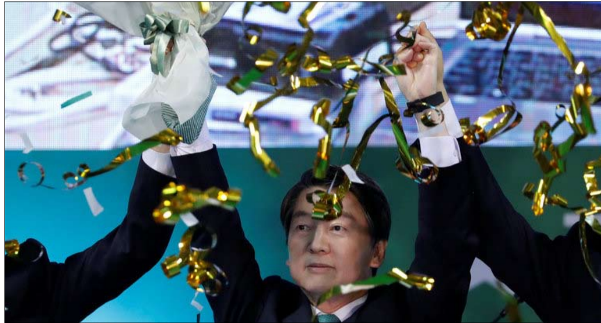
أهن سيول سوا انحطاف 180 درجة

لوت في مرمى النار ان بكين غاضبة من رؤية ثاد تنتصب في شبه الجزيرة، وتحشى أن يُستخدم نظام الرادار القوي هذا، لرصد أنشطتها العسكرية. وقبل فترة طويلة من وصول الدرع الصاروخي، تدخلت الحكومة الصينية على الميدان الاقتصادي لضرب الشركات الكورية الجنوبية. وأبرزت، في سيول، دراسة