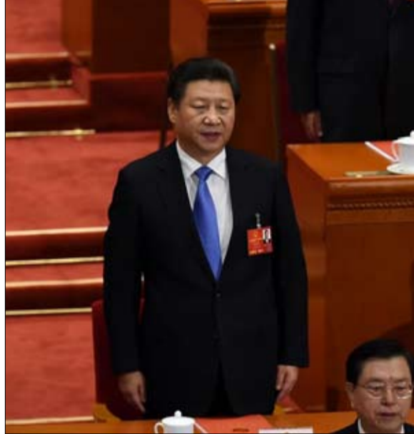
الصين السلاح الاقتصادي لتحقيق هدف سياسي

وتظهر مجموعة لوت، كأول مؤسسة في مصوب بكين. وكان هذا تشايبول الكبير مجمع شركات بالكونية، قد ارتكب خطأ كبيرا، من وجهة نظر بكين، بما انه وفر الأرض التي سيقام عليها نظام شاد. إن تطور مجموعة لوت في السوق الصينية يجب أن ينتهي، كتبت الصحيفة اليومية النظامية جلوبال تايمز العام الماضي. وقد علقت لوت 80 موقعا في جميع أنحاء الصين.