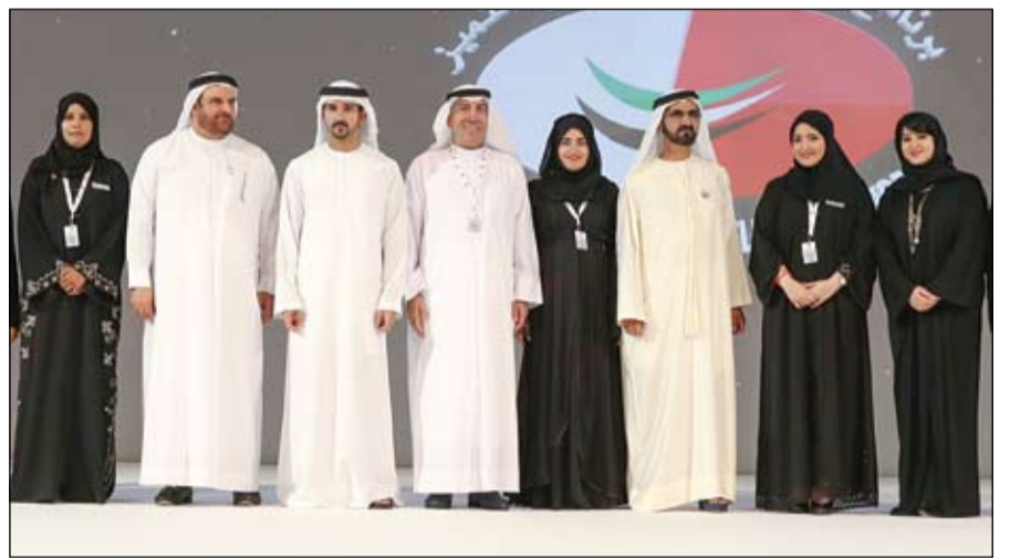
محمد بن راشد خلال تكريمه الفائزين بجوائز برنامج دبي للأداء الحكومي المتميز (وام)

استقبل وفداً من شركة أبوظبي للموانئ والرئيس التنفيذي لشركة بلاكستون الأمريكية محمد بن زايد يبحث مع رئيس الوزراء الأسترالي علاقات التعاون والمستجدات الإقليمية والدولية •• أبوظبي-وام: استقبل صاحب السمو الشيخ محمد بن زايد آل نهيان ولي عهد أبوظبي نائب القائد الأعلى للقوات المسلحة أمس بقصر الشاطئ معالي ماكتولم ترينول رئيس وزراء أستراليا الذي يزور البلاد حالياً. جرى خلال اللقاء بحث تعزيز علاقات الصداقة والتعاون بين دولة الإمارات العربية المتحدة وأستراليا في مختلف المجالات التجارية والاقتصادية. الجابر وزير دولة رئيس مجلس إدارة الشركة.