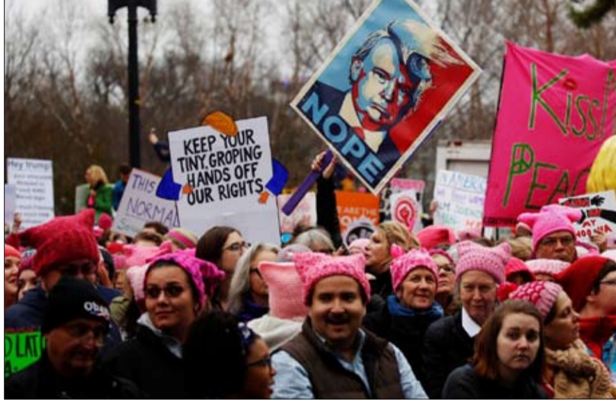
لم يتمكن من اقناع معارضيه