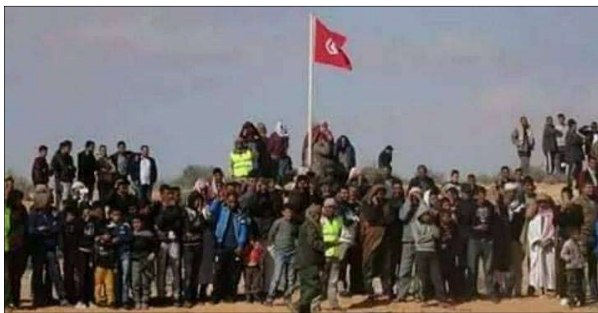
فرض حصار على المنشآت النفطية