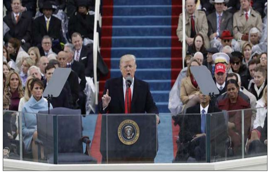
من حفل التصويب إلى متاهة ممارسة السلطة

ظهور بعض البواد: 6 من كل 10 أمريكيين يعتقدون أن ترامب في قطيعة مع مشاكل الناس، والاخطر، أن أقل من 4 على 10 يعتبرونه صادقا وجدرياً بالثقة.