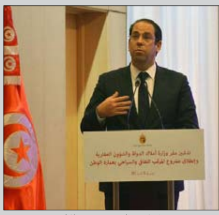
الشاهد في دور رجل المطافئ

للإشكالات المطروحة والاستجابة لمطالب المحتجين. في الاثناء، تواصل الأحزاب والمنظمات والجمعيات الاهلية تحديد مواقفها مما تعيشه البلاد من تطورات باتت تهدد جديا سلمها الأهلي وبانهيار اقتصادي شامل.