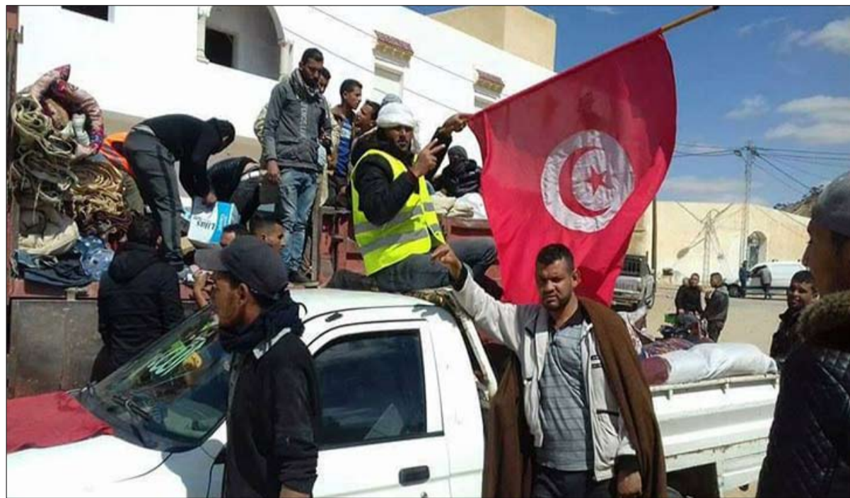
في الطريق الى صحراء تطاوين

مشارك، عن مساندها المطلقة للحراك الشبابي السلمي، داعية الحكومة الى رسم رؤية متكاملة لدفع عجلة التنمية الشاملة. وأهابت، في البيان ذاته، بشباب الجهة التمسك بسلمية الاحتجاج، داعية اياهم الى الثأب بحراكم عن كل توظيف مهما كانت أسبابه أو الاطراف الداعية اليه.