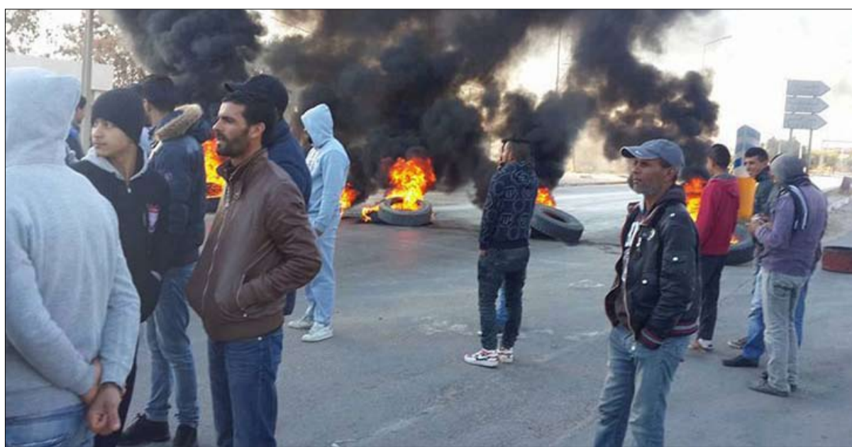
استمرار الاحتجاجات ومخاوف من اتساع دائرتها