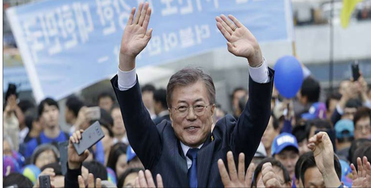
مون البراغمانية لنزع الفتيل