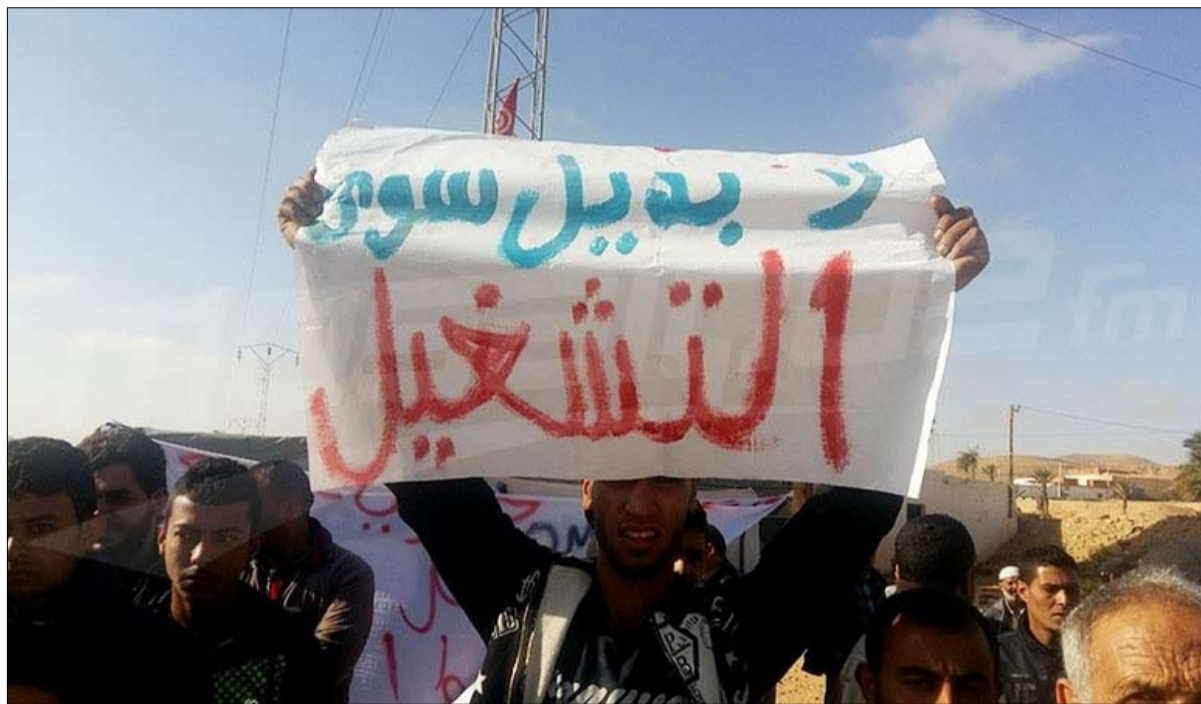
التشغيل مربط الفرس في تونس