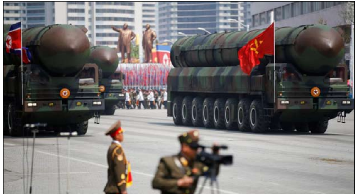
ترسانة الشمال ترهب الجنوب