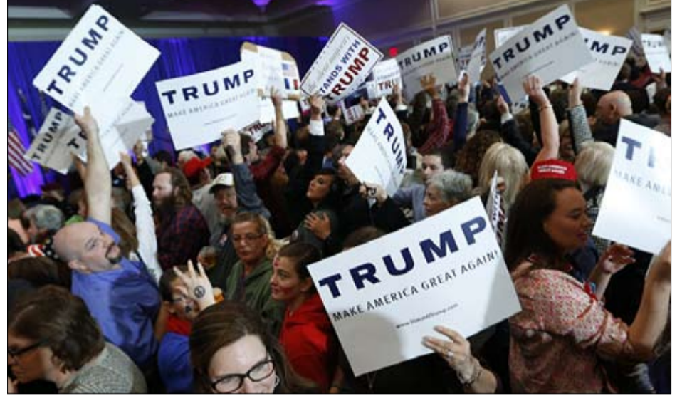
انتصار ترامب لا يشعرون بالملل