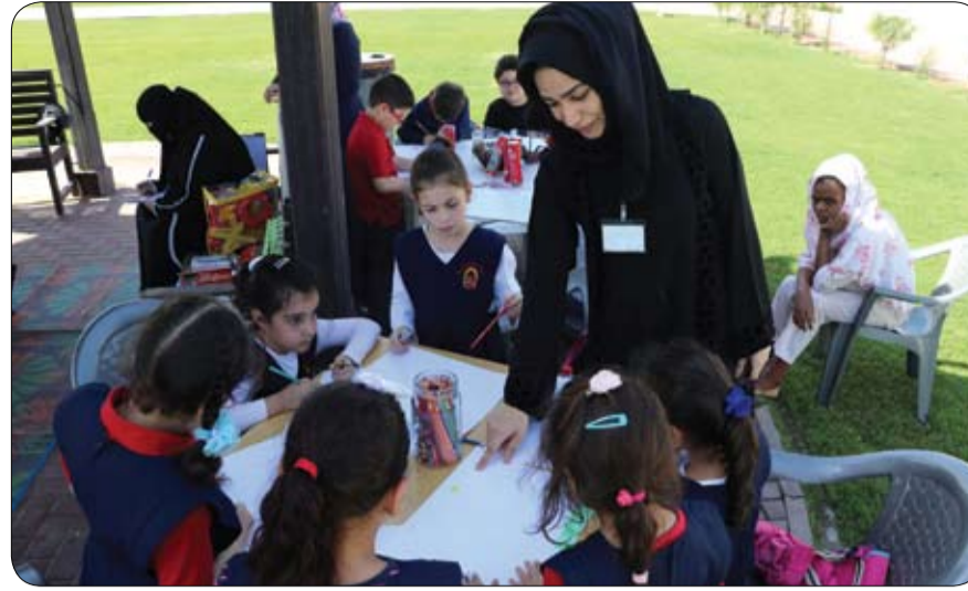
بمشاركة أكثر من 450 من طلاب المدارس