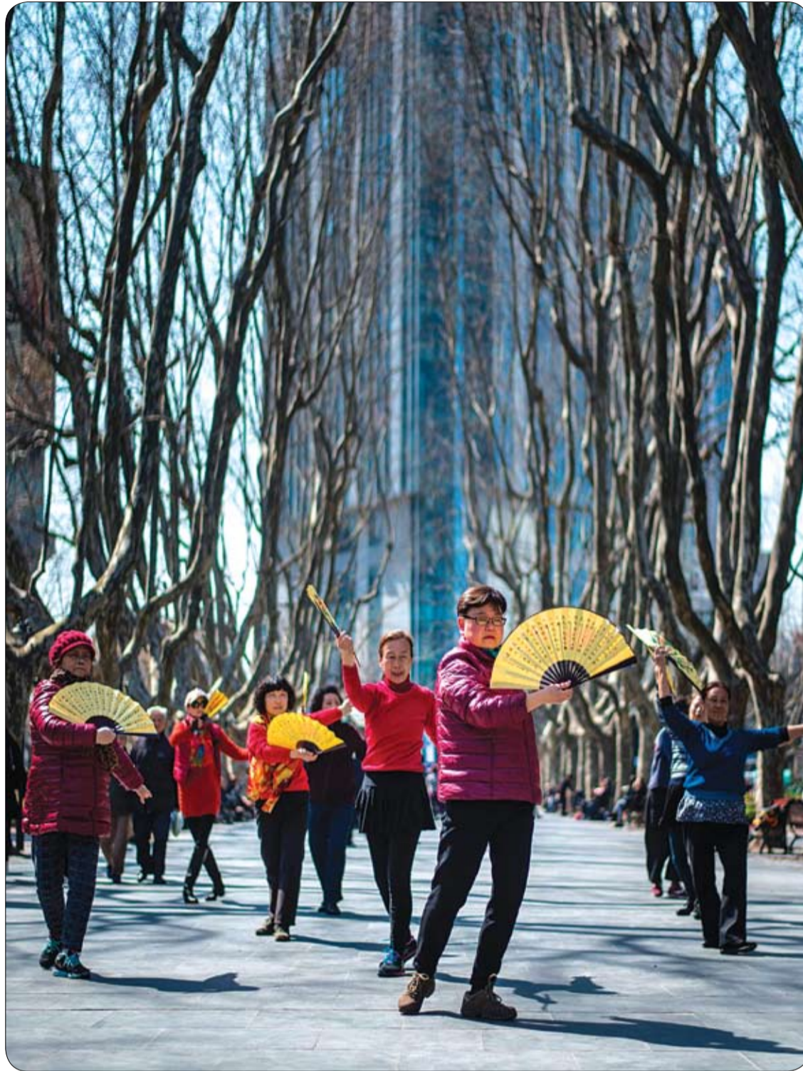
مجموعة من النساء يرقصن أمام عدد من المشجعين في إحدى الحدائق بشفنغهاي.

ارتفاع ضغط الدم وانسداد الشرايين واحد من أمراض العصر التي تصيب الكثيرين.. موقع h h yrecipes قدم وصفة طبيعية من ثلاثة مكونات يمكنك تناول 4 ملاعق منها ستساعدك سريعاً في محاربة نزلات البرد والالتهابات ومشاكل القلب والأوعية الدموية وكذلك ستقضي على ارتفاع ضغط الدم إلى الأبد. وأشار الموقع إلى أن هذه الوصفة الألمانية تعتبر الأقوي واستخدمت لقرون طويلة في تعزيز الصحة العامة للشخص ومكافحة ارتفاع ضغط الدم وانسداد الشرايين، والتي تتكون من الزنجبيل والليمون والثوم حيث تشكل تلك المكونات سوياً وقاية وعلاجاً للجسم. المكونات: - 4 سم زنجبيل طبيعي. - 4 ليمون غير مقشر. - 4 فص ثوم. - 2 لتر ماء. الطريقة: - يغسل الليمون ويقطع الى شرائح، ثم يقشر الزنجبيل والثوم والقرنفل وتضع جميع المكونات في الخلاط وتمزج جيداً حتى تتجانس. - ضع الخليط السابق على النار وأضيفي الماء ببطء حتى يبدأ في الغليان، يرفع من على النار ويترك حتى يبرد ثم يصفى ويصب في زجاجة ويحفظ في التلاجة. - تتناوله قبل ساعتين من أي وجبة مرتين يومياً، وعليك رج الزجاجة جيداً قبل استخدامها، لأن الزنجبيل يبرد في القاع. - يعد هذا المشروب علاجاً طبيعياً قوياً لمكافحة ارتفاع ضغط الدم وتنشيط الشرايين وتنظيفها وتحسين صحة القلب والصحة العامة.