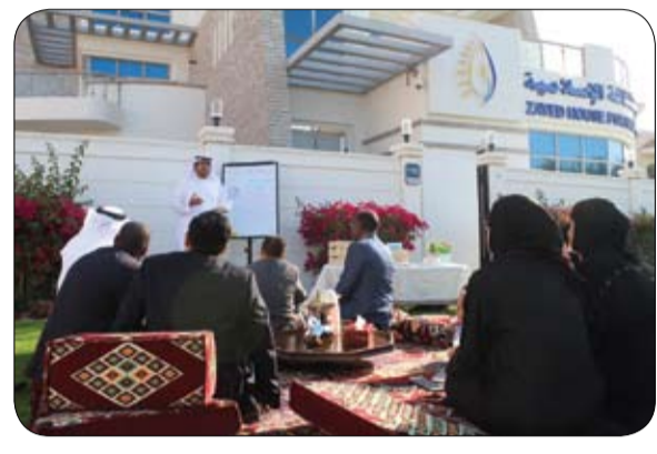
مبادرات ثقافية متنوعة