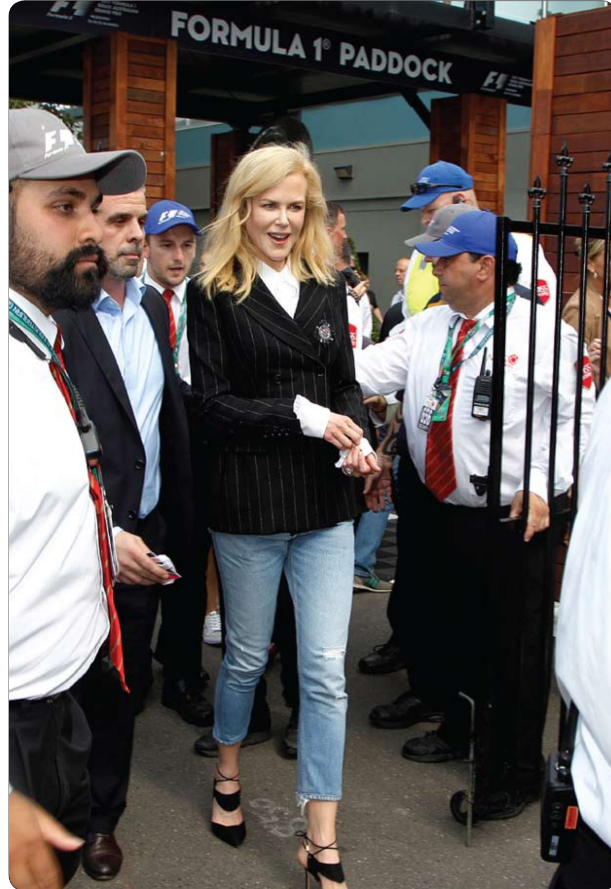
الممثلة الأسترالية نيكول كيدمان لدى وصولها الى حلبة الفورمولا واحد في ميلبورن.

لم تعد الكراسي المتحركة حكراً على البشر الذين يعانون من إعاقات، وخاصة بعدما قام عامل في متجر لبيع أسماك الزينة بصناعة كرسي متحرك لسمة زينة مريضة في أحد الأحواض لمساعدتها على السباحة. بعدما فشل ديريك في مساعدة إحدى سمكات الزينة في متجره على السباحة، خطرت له فكرة عتريها الكثيرون ضرباً من الجنون، وقرر أن يصنع لها جهازاً شبيها بالكرسي المتحرك يساعدها على السباحة. وقد استخدم ديريك بعض الأنابيب والصمامات ومادة الستيريوفوم لصناعة الكرسي المتحرك.