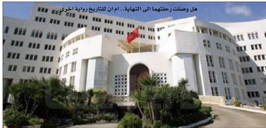
هل وصلت رحلتها الى النهاية.. ام ان للتاريخ رواية اخرى

• مدير تحرير مجلة لئونفال اوبسفاتور الفرنسية.