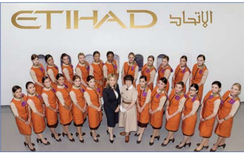
المرييات على متن الطائرة لتقديم يد مساعدة للعائلات والسماح للوالدين بالزيت من الوقت للأطفال.

احتفلت الاتحاد للطيران بتخرج المريية في الأجواء رقم 2000، في إطار استمرار تعاونها مع كلية (نورلاند)، مؤسسة التعليم العالي الرموقة بالملكة المتحدة المتخصصة في إعداد وتأهيل الكوادر العاملة في مجال تربية الأطفال في السنوات المبكرة.