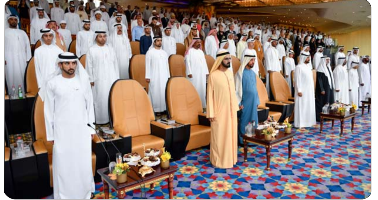
بحضور محمد بن راشد