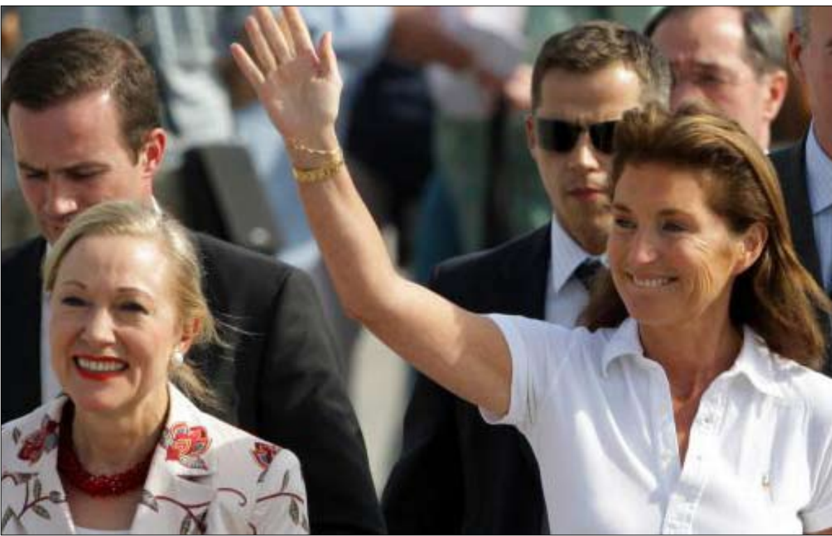
وراء سيسيليا ساركوزي في طرابلس