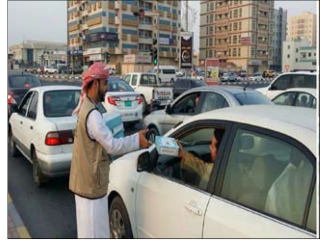
•• دبي - الضجر: