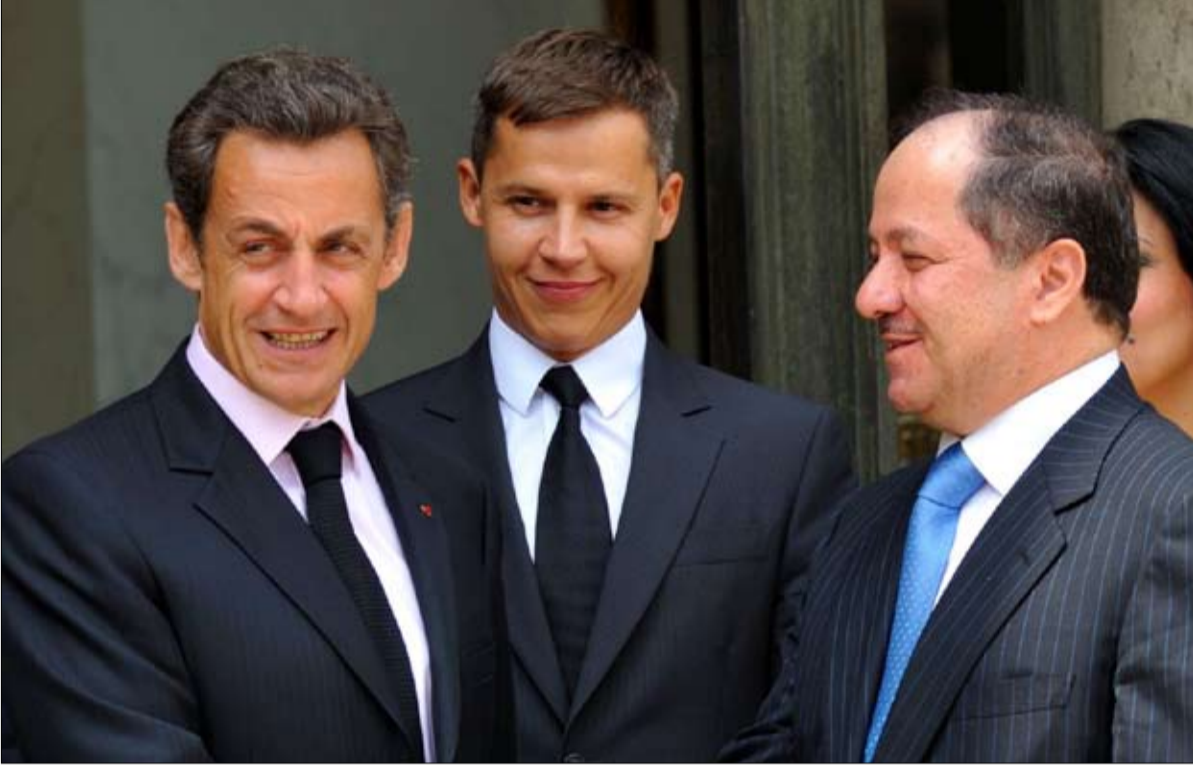
بويون لما كان سفيراً في العراق