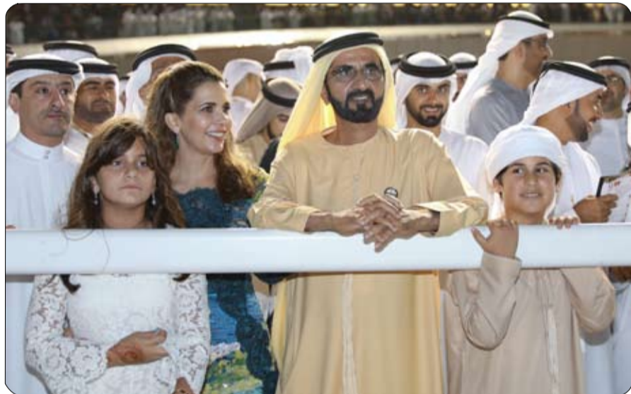
الذي بلغت مسافته متر واستطاع المهر (أروجيت) في اللحظات الأخيرة انتزاع الفوز والجائزة الأعلى والأهم على مستوى العالم.