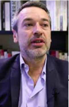
عنها بقوة. كارشر للتنظيف

العامل الآخر للانفجار، يعود طبيعاً إلى صعود الجبهة الوطنية، وهو ما يدفع الجمهوريين إلى الحسم نهائياً مع ما يسمى بخط بويسون. أما القبول بالأجندة التي تملأها الجبهة الوطنية، إن لم تقب التعامل معها، بحجة أن الفرق الوحيدة بين اليمين الجمهوري واليمين المتطرف غير المشيطن باتت مسألة شارة وامضة، وأما الابتعاد