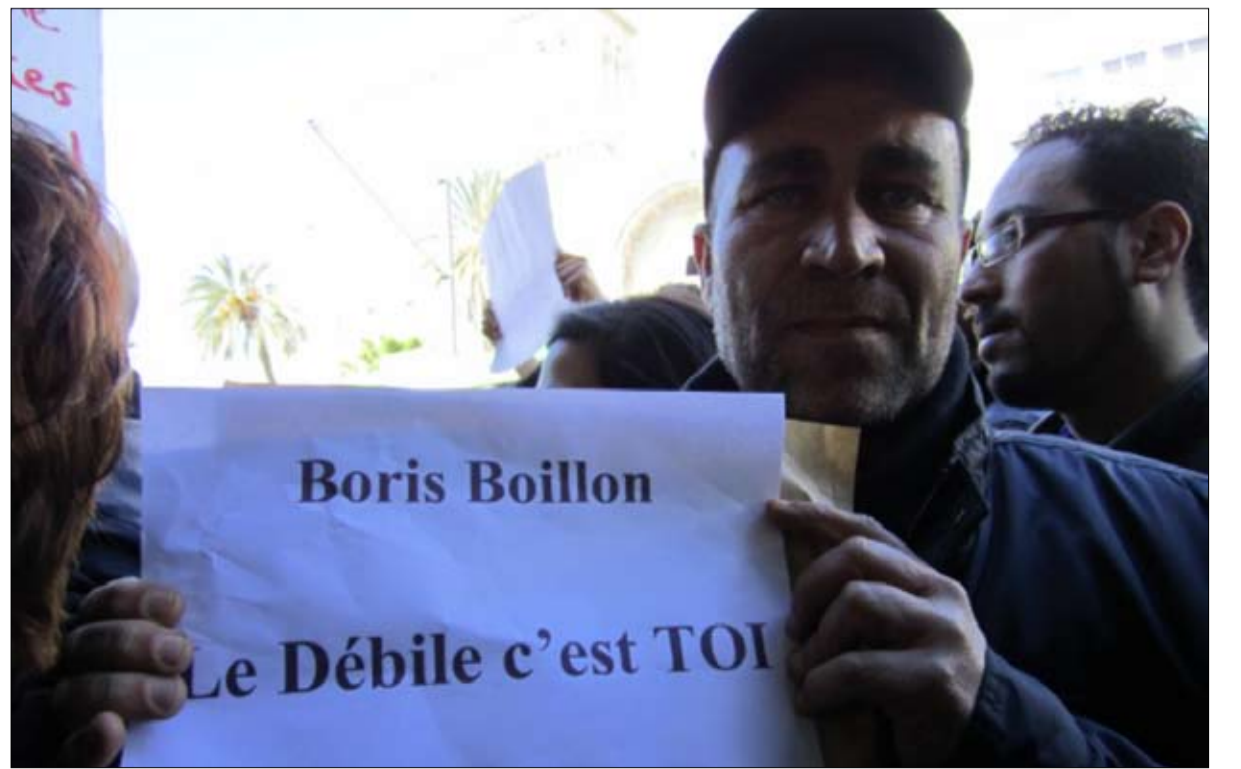
غضب التونسيين ضد بويون