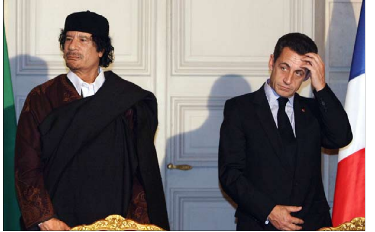
بويون ابن القذافي ام ابن ساركوزي