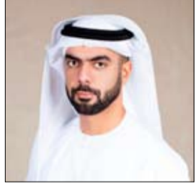
•• أبو ظبي-وام:

أكد سعادة سيف سعيد غباش مدير عام هيئة أبوظبي للسياحة والثقافة أن مهرجان أم الإمارات هو منصة تفاعلية واجتماعية تسهم في تسليط الضوء على قيم وعطاء سمو الشبيخة فاطمة بنت مبارك رئيسة الاتحاد النسائي العام الرئيسة الأعلى لؤسسة التنمية الأسرية رئيسة المجلس الأعلى للأمومة والطفولة من خلال تقديم العديد من الأنشطة والفعاليات التي تم تصميمها خصيصاً لتحتفي باهتمام الآلاف من الزوار على مدى عشرة أيام في كورنيش أبوظبي، وذكر غباش في تصريح خاص لوكالة أنباء الإمارات وأم من مهرجان أم الإمارات بعد الحدث الأضخم في أبوظبي من حيث عدد الأنشطة والفعاليات وأحد النجح المهرجانات إذ استقطب على مدار 10 أيام أكثر من 133 ألف زائر في دورته الأولى العام الماضي، وتوقع أن يفوق عدد زوار الدورة الجديدة خاصة أن المهرجان هذا العام يأتي بمفهوم مميز يتوخ نجاح العام الماضي