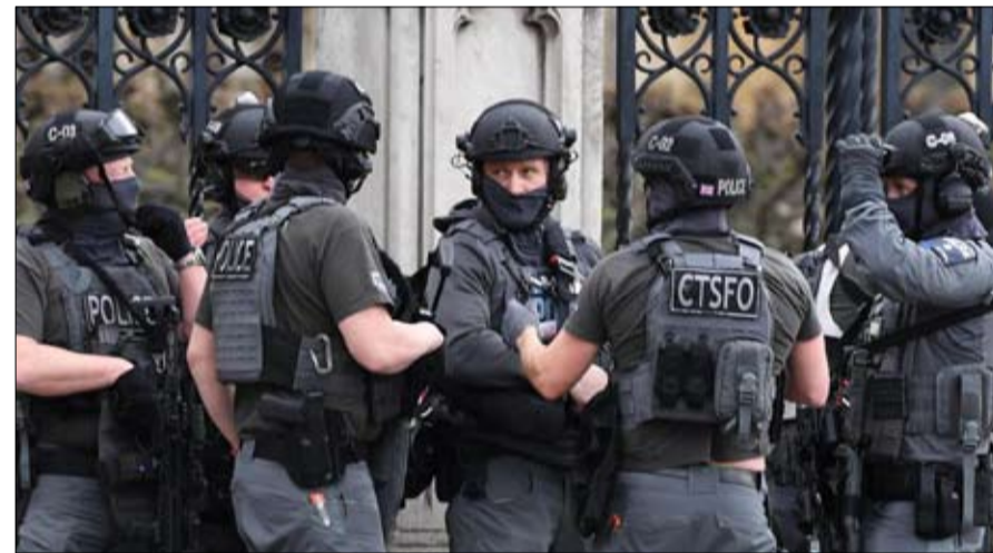
الأجهزة الامنية البريطانية مجبرة على اعادة النظر في طريقة عملها

لقبلا لا تحسد عليه «لندنستان». باختصار: بلد يشعر فيه المتطرفون أنهم في بلدهم. ومنذ ذلك الوقت، تدارك الانكليز، وتدعم تعاونهم بشكل كبير مع فرنسا والدول الأوروبية الرئيسية ومسيرة وتهاون مناهذه العاصمة