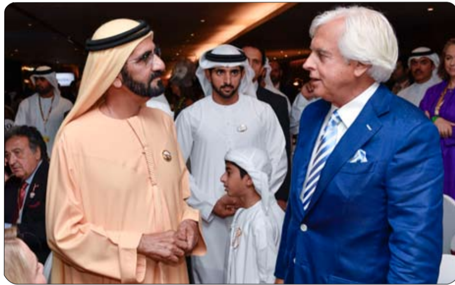
وقام سمو الشيخ حمدان بن محمد بن راشد آل مكتوم ولي عهد دبي وسمو الشيخ حمدان بن راشد آل مكتوم نائب حاكم دبي وزير المالية بتسليم الكأس

بحضور صاحب السمو الشيخ محمد بن راشد آل مكتوم نائب رئيس الدولة رئيس مجلس الوزراء حاكم دبي (رعاه الله) افتتح سمو الشيخ حمدان بن محمد بن راشد آل مكتوم ولي عهد دبي الدورة الثانية والعشرين من كأس دبي العالمية لسباق الخيل بمشاركة خيرة الخيول العربية والعالمية. حضر حفل الافتتاح والسباق على مضمار ميدان في منطقة ند الشبا في دبي مساء امس سمو الشيخ حمدان بن راشد آل مكتوم نائب حاكم دبي وزير المالية وسمو الشيخ محمد بن سعود بن صقر القاسمي ولي عهد رأس الخيمة والفريق سمو الشيخ أحمد بن راشد آل مكتوم نائب رئيس الشرطة والأمن العام في دبي وسمو الشيخ أحمد بن سعيد آل مكتوم رئيس هيئة دبي للطيران الرئيس الأعلى لمجموعة طيران الإمارات وسمو الشيخ أحمد بن محمد بن راشد آل مكتوم رئيس مؤسسة محمد بن راشد آل مكتوم للمعرفة وسمو الشيخ منصور بن محمد بن راشد آل مكتوم ومعالي الشيخ نهيان بن مبارك آل نهيان وزير الثقافة وتنمية المعرفة وعدد من الشيوخ والوزراء وكبار المسؤولين في الدولة وأكثر من ثمانين ألف مدعو غصت بهم جنبات ومراقف مضمار ميدان ومساحاته الخضراء. وقد فاز المهر "أروجيت" ذو الأربع سنوات مالكة الأمير خالد بن عبدالله آل سعود من المملكة العربية السعودية بكأس دبي العالمي لسباق الخيل في دورتها الثانية والعشرين.