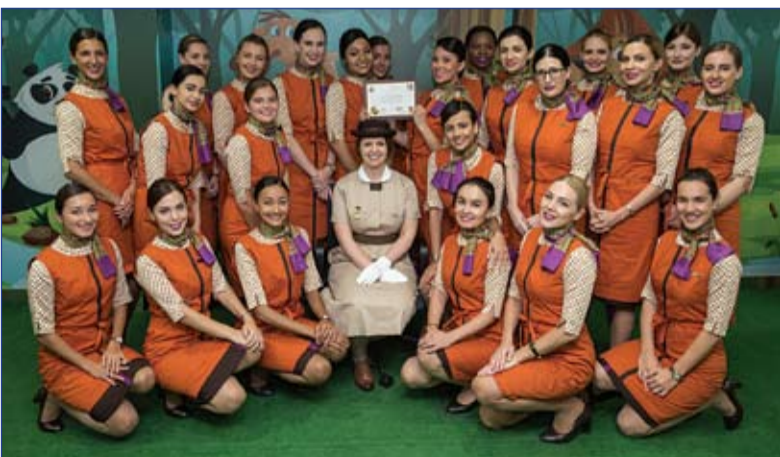
المرييات على متن الطائرة لتقديم يد مساعدة للعائلات والسماح للوالدين بالزيت من الوقت للأطفال.