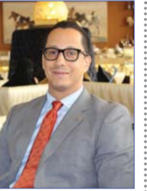
فندق خالدية بالاس ريجان من روتانا يعين مديراً جديداً لإدارة المبيعات

فور هابنيس) لتشجيع الرفاه والتقدم من خلال نشر السعادة والبهجة، وهو ما يتماشى كذلك مع توجهات حكومة دبي لترسيخ السعادة في المجتمع لكافة مواطنيها. ووفقاً لأبحاث جرت حديثاً، فإن فقد اختارت إيكيا عشوائياً مجموعة من المتسوقين لتفاجئهم بهدايا بقيمة تقارب 20,000 درهم إماراتي لتضي البهجة على يومهم. وكان ذلك ضمن نشاطات العلامة لإحياء اليوم العالمي الذي صممه (أكشن