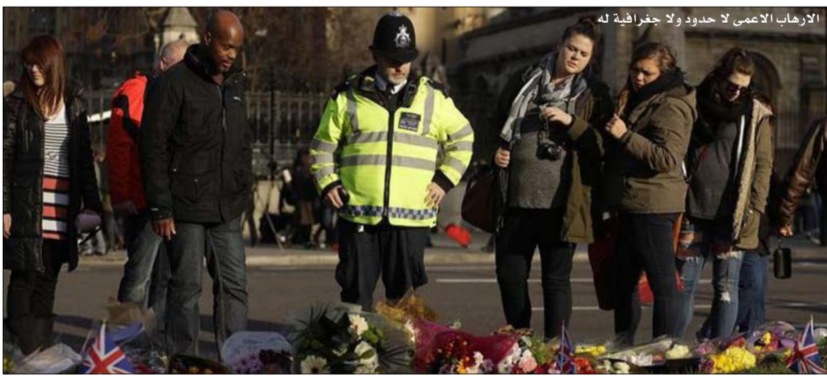
الإرهاب الامعي لا حدود ولا جغرافية له