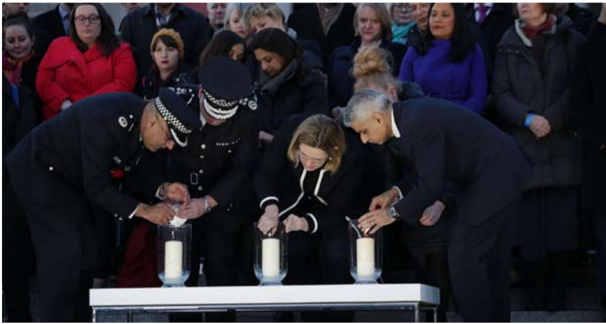
الإرهاب في قلب لندن

لقبلا لا تحسد عليه «لندنستان». باختصار: بلد يشعر فيه المتطرفون أنهم في بلدهم. ومنذ ذلك الوقت، تدارك الانكليز، وتدعم تعاونهم بشكل كبير مع فرنسا والدول الأوروبية الرئيسية ومسيرة وتهاون مناهذه العاصمة