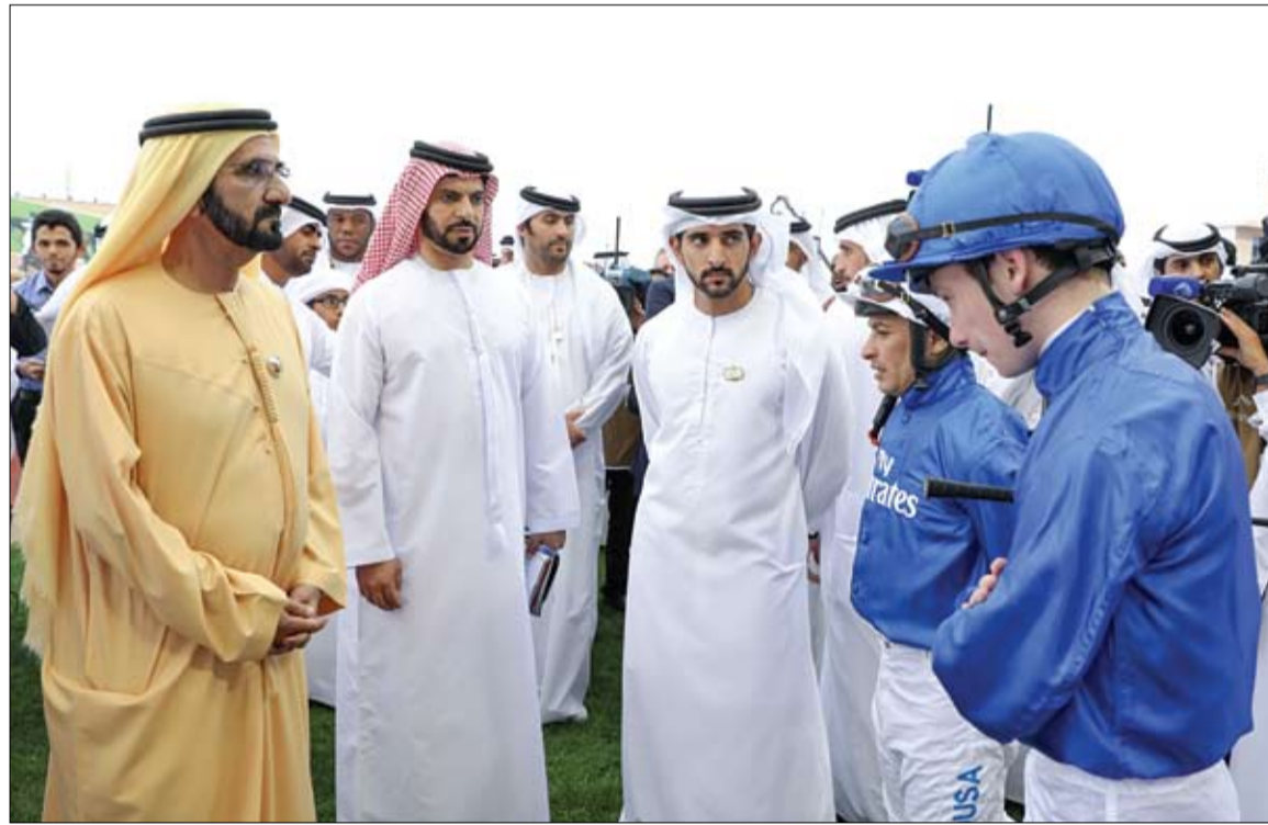
بحضور محمد بن راشد حمدان بن محمد يفتتح الدورة الثانية والعشرين من كأس دبي العالمية لسباق الخيل

بِحضور محمد بن راشد .. ولي عهد دبي يفتتح كأس دبي العالمية لسباق الخيل دبي-وام: بحضور صاحب السمو الشيخ محمد بن راشد آل مكتوم نائب رئيس الدولة رئيس مجلس الوزراء حاكم دبي رعاه الله افتتح سمو الشيخ حمدان بن محمد بن راشد آل مكتوم ولي عهد دبي الدورة الثانية والعشرين من كأس دبي العالمية لسباق الخيل بمشاركة خيرة الخيول العربية والعالمية. حضر حفل الافتتاح والسباق على مضمار ميدان في منطقة ند الشبا في دبي مساء امس سمو الشيخ حمدان بن راشد آل مكتوم نائب حاكم دبي وزير المالية والفريق سمو الشيخ أحمد بن راشد آل مكتوم نائب رئيس الشرطة والأمن العام في دبي (التفاصيل ص16)