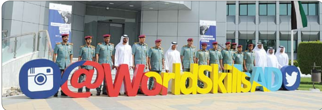
•• أبوظبي - الفجر

وعدت القيادة العامة لشرطة أبوظبي، ومركز أبوظبي للتعليم والتدريب التقني والمهني، اتفاقية للشراكة الاستراتيجية والتعاون في تنظيم فعاليات مسابقة المهارات العالمية، التي سيقومها "أبوظبي التقني" في العاصمة أبوظبي لأول مرة بمنطقة الشرق الأوسط، في أكتوبر المقبل، تحت رعاية صاحب السمو الشيخ محمد بن زايد آل نهيان، ولي عهد أبوظبي نائب القائد الأعلى للقوات المسلحة. وكان معالي اللواء محمد خلفان الرميثي، القائد العام لشرطة أبوظبي، شهد مراسم الاتفاقية، التي وقعها سعادة مبارك سعيد الشامسي، مدير عام مركز أبوظبي للتعليم والتدريب التقني والمهني، وسعادة اللواء مكتوم علي الشريقي، مدير عام شرطة أبوظبي. حضر مراسم توقيع الاتفاقية، في مقر شرطة أبوظبي العميد الشيخ محمد بن طحون آل نهيان، مدير قطاع شؤون الأمن والمنافذ، والعميد سالم شاهين النعيمي، مدير قطاع شؤون القيادة، والعميد سعيد سيف النعيمي، مدير قطاع المالية والخدمات، والعميد مبارك المهيري، مدير قطاع الحراسات والمهام الخاصة، والعميد حماد الحمادي، مدير قطاع أمن المجتمع، وعلى محمد المرزوقي، رئيس مبادرات الإمارات في "أبوظبي التقني"، وعدد من الضباط والمسؤولين. وأكد معالي اللواء محمد خلفان الرميثي، حرص شرطة أبوظبي على تقديم أفضل الخدمات الشرطية لدعم جميع الفعاليات المحلية والإقليمية والدولية، لتعزيز سمعة إمارة أبوظبي، كوجهة عالمية مفضلة، بما تتميز به من مؤشرات إيجابية، ومقومات متنوعة على المستوى الأمني والتقني والسياحي والترفيهي والثقافي