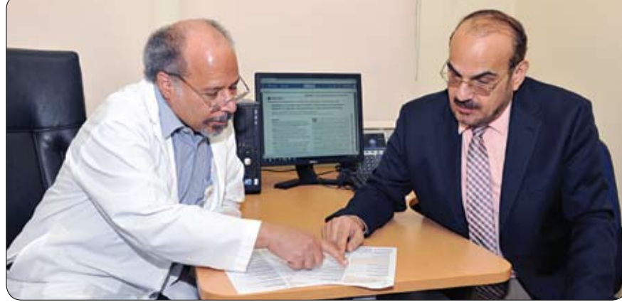
•• العين - الفجر

بصفة عامة، وتضمنت الدراسة على عدد من الإعاقات التي قد تسببها السمعة هي: الإعاقة في أداء الواجبات الدنيوية حيث احتلت النسبة الأكبر ب 39%، تليها الإعاقة في الحياة الاجتماعية ب 36% والإعاقة في المنزل وفي الحياة الأسرية والتي شكلت 35%، بالإضافة إلى