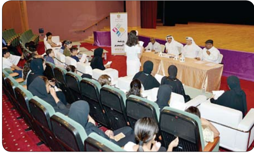
بهدف تقديم التوصيات والتقارير النهائي