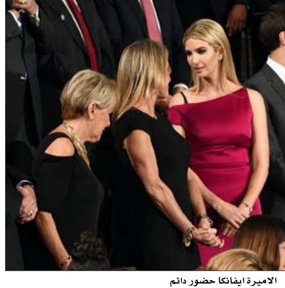
الأميرة إيفانكا حضور دائم

المعلومات السرية، وستخضع لقواعد السرية التي تنطبق على المستشارين الموظفين: ستكون عين الرئيس وأذنه، وفي نفس الوقت، تقدّم له النصيحة في المسائل الكبرى،