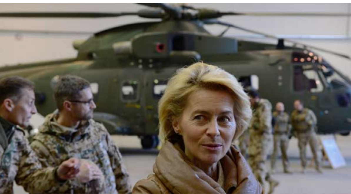
وزيرة الدفاع الألمانية تذكر وتصوب