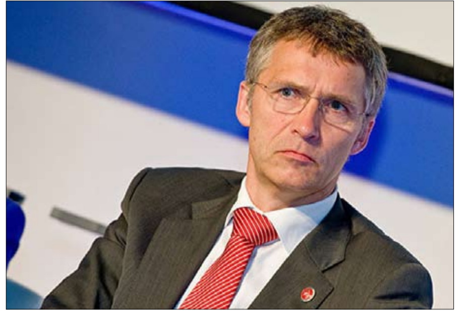
الامين العام للحلف الاطلسي يعترف