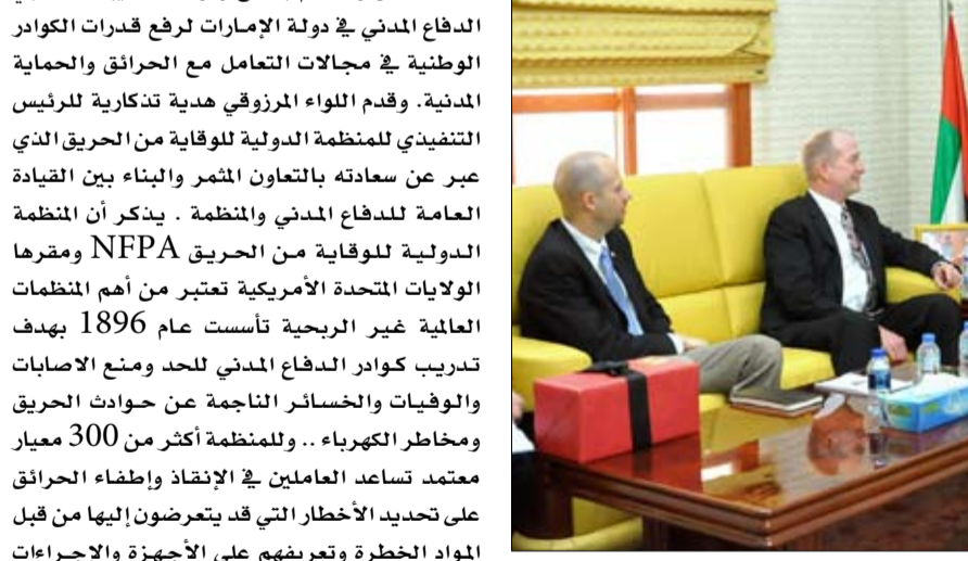
السبل لمواجهة الحرائق حال وقوعها والوقاية منها. واتسق الطرفان على تبادل الوفود من ذوي

المدني في وزارة الداخلية وجيم باولي الرئيس التنفيذي للمنظمة الدولية للوقاية من الحريق NFPA والوفد المرافق له ..التعاون في مجالات الوقاية والسلامة للحماية من الحريق وسبل تعزيزها على نحو يخدم الصالح المشتركة ويسهم في المساعدة المتبادلة للارتقاء بخدمات الدفاع المدني المقدمة.