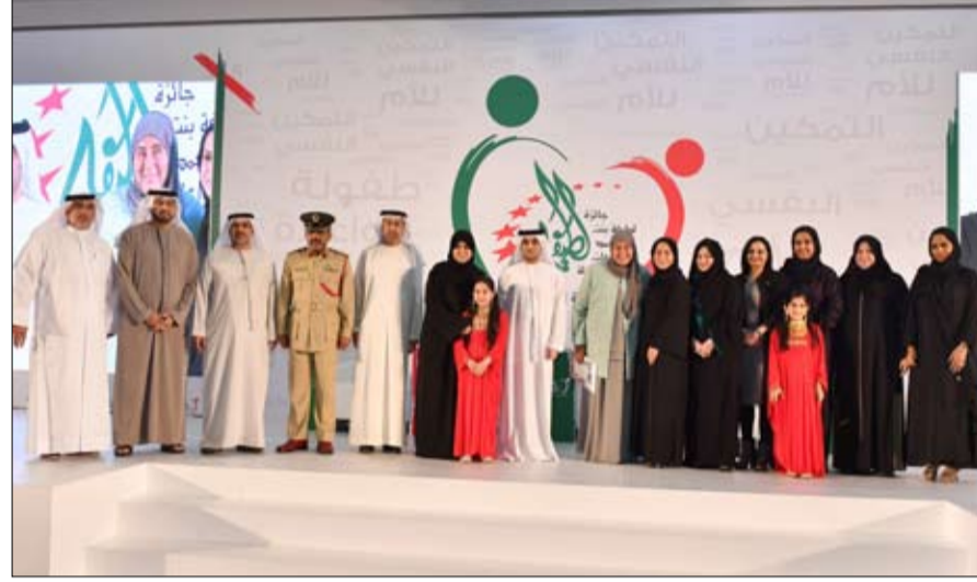
من كلام المغفور له الشيخ زايد بن سلطان آل نهيان زايد الخير

افتتح سمو الشيخ سعيد بن محمد بن راشد آل مكتوم ظهر امس، مؤتمر الطفولة الخليجي الثالث تحت شعار التمكين النفسي للأولاد - طفولة واعية، والذي يأتي برعاية كريمة من سمو الشيخة هند بنت مكتوم بن جمعة آل مكتوم حرم صاحب السمو الشيخ محمد بن راشد آل مكتوم نائب رئيس الدولة رئيس مجلس الوزراء حاكم دبي رعاه الله، ورئيسة جائزة الشيخة لطيفة بنت محمد بن راشد آل مكتوم لإبداعات الطفولة والشباب، والتي تستمر فعاليتها إلى غد بمقر جمعية النهضة