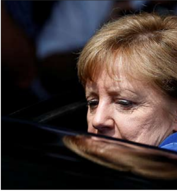
ميركل واستفزات الشريك الأمريكي