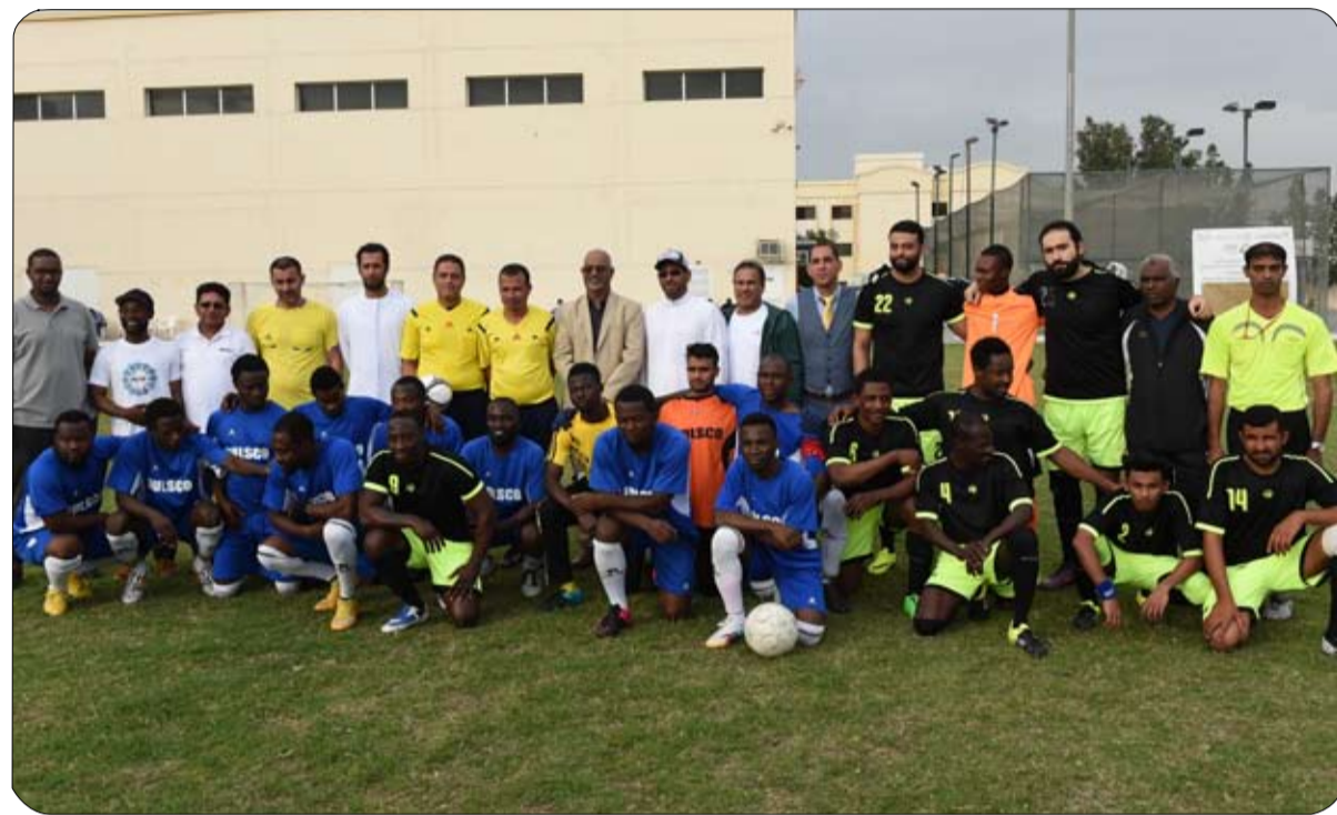
ضمن مبادرة حمدان بن محمد للرياضة المجتمعية