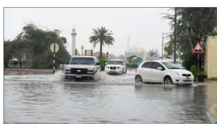
مع أهداف النظام البلدي لإمارة أبوظبي في تقديم خدمات للمجتمع والعلاء بما يعزز جودة الحياة في إمارة أبوظبي

تحتسباً لأي تداعيات، كما وتم التأكد من فتح جميع شبكات تصريف المياه المتجمعة في الشوارع وعلى جانبي الطرقات، تجنب عرقلة حركة المركبات والسكان. وأضاف المنعي، كما تم تجهيز الصهاريج عالية القدرة للتعامل مع تجمعات برك المياه وسحبها من المناطق والشعبيات التي لا يوجد بها شبكات تصريف مياه أمطار، وتم توزيع عدد 15 من الصهاريج في مختلف مناطق مدينة العين التي لا تتوفر بها شبكات صرف مياه أمطار والمتوقع تجمّع الأمطار بها للتعامل السريع مع حالات وبلاغات تجمع مياه الأمطار، حيث استقبل مكتب طوارئ مدينة العين أكثر من 90 بلاغا لتجمع مياه الأمطار، حيث باشرت فرق الطوارئ الميدانية بعمليات