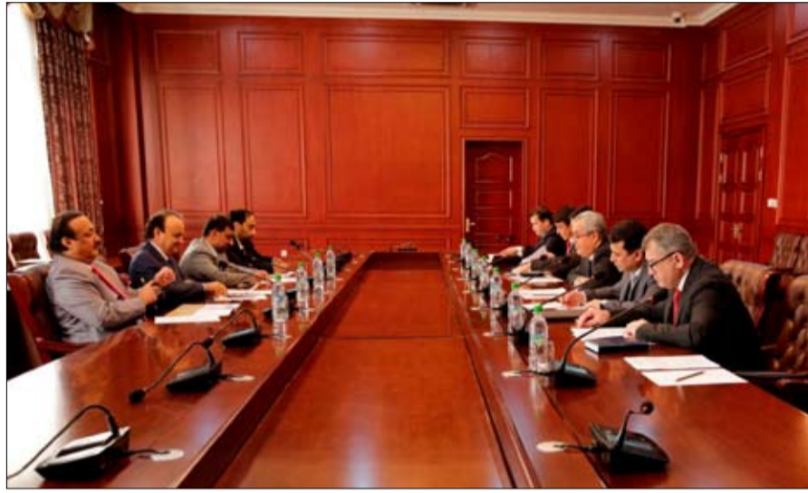
سيما التنسيق على مستوى الأمم المتحدة ووكالاتها المتخصصة لأنها تشكل دعامة التعاون الفعال المتعدد الأطراف.. وشدد على أهمية تضافر الجهود الدولية والإقليمية للتصدي لهذه التحديات والمهدات الأمنية لمواجهة أفة الإرهاب والتطرف والمخدرات والجريمة المنظمة والاتجار بالبشر وإيجاد حلول ناجمة للالتزامات المتأظمة بالمنطقة بما يرسخ الأمن والاستقرار الإقليمي والدولي.

من الميزات التنافسية والنمو المميز الذي يحققه اقتصاد البلدين من أجل توسيع قاعدة التعاون المشترك والسبل الكفيلة بتعزيزها وتطويرها في جميع المجالات خاصة الاقتصادية والتجارية والسياحية والثقافية فضلا عن تشجيع تبادل زيارات الوفود الرسمية للاستفادة من الإمكانيات المتطورة والمحفة بشكل يخدم مستقبل البلدين والشعبين الصديقين. وفي ختام اللقاء أكد مساعد الوزير للشؤون السياسية أهمية التنسيق والتشاور المستمر بين البلدين فيما يخص القضايا ذات الإهتمام المشترك في مختلف المحافل الإقليمية والدولية ولا