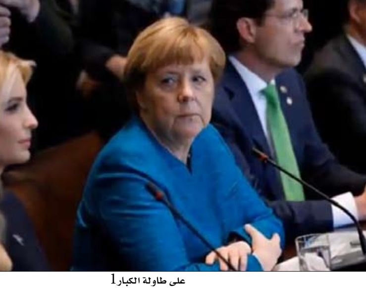
على طاولة الكبار

بزنس عائلي وعدت إيفانكا، صاحبة علامة تجارية في الأحذية والملابس والمجوهرات تحمل اسمها، بالوقوف بعيدا عن أعمالها قدر