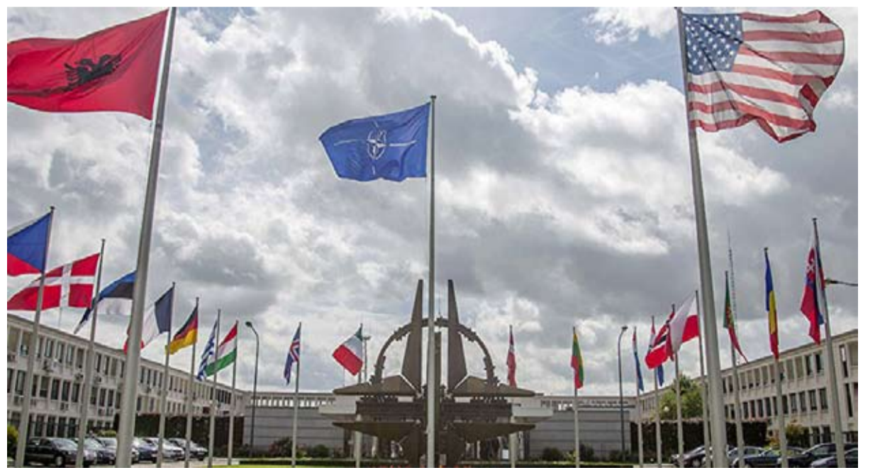
الاطلسي التوازن المختل