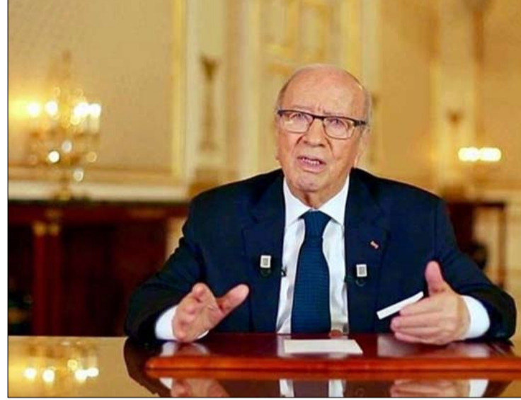
السبسي يكشف جديد المصالحة

واعتبر أن تلك الوثيقة هي لكل الليبيين دون استثناء أو إقصاء أو تدخل أجنبي، ملاحظا أنه لولا تقديم تلك المبادرة لكانت ليبيا مهددة بالانقسام وكان مستقبل هذا البلد المجاور أصعب، وفق تقديره. وحشد قائد السبسي على أن تونس اتصلت بجميع الأطراف الليبية المختلفة لتوجهاتهم من ذلك المجلس الأعلى للمدن والقبائل الليبية، معنيفا أنها تمت دعوة قائد الجيش اللواء خليفة حفتر لزيارة تونس.