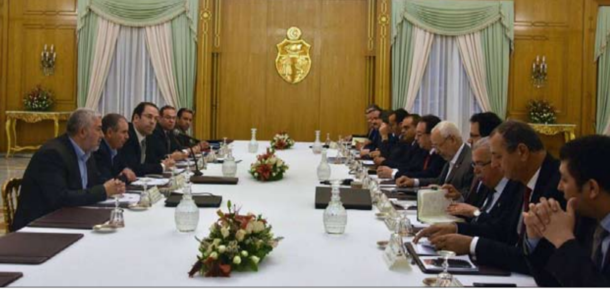
وثيقة قرطاج لا تزال قائمة

الصدد أن أي قرار عسكري هو قرار تونسي مستقل، وأن السيادة هي كل لا يتجزأ وهي بيد الشعب يمارسها عبر الأفراد الذين ينتخبهم... وجيشنا تموله أساسا ميزانية الدولة.