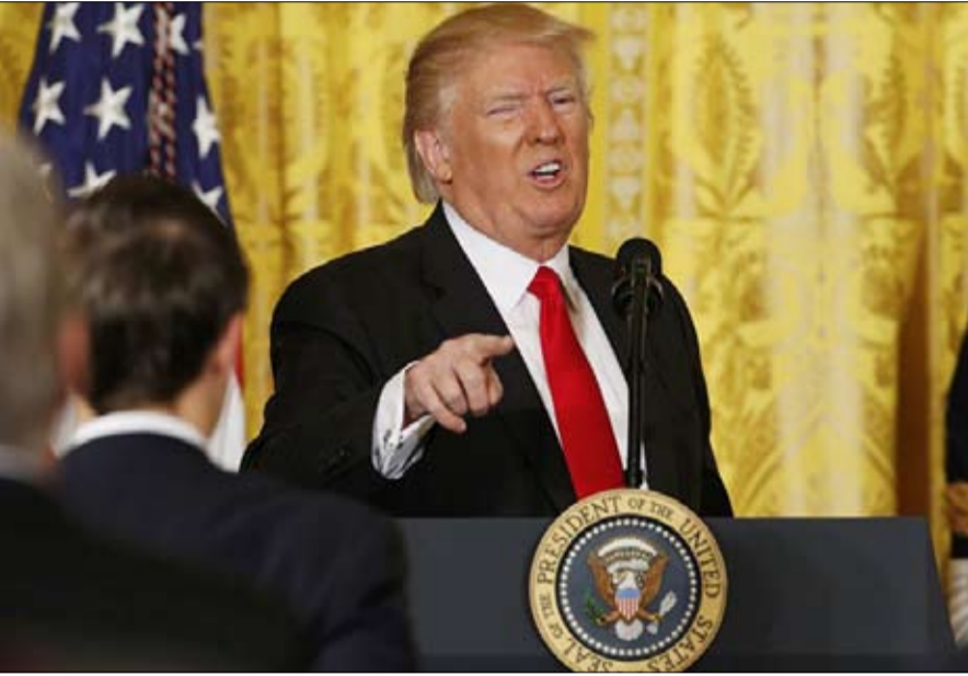
ترامب: على ألمانيا ان تدفع