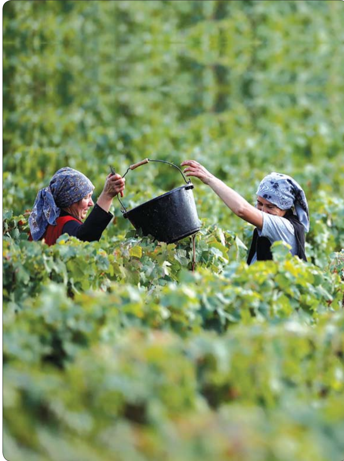
عاملتان تجمعان العنب في مزرعة في تايينجر أثناء الحصاد التقليدي في بييري، بالقرب من إبيرناي، فرنسا.

ويأشر مشفى شاريتيه وجامعة برلين التقنية ومعهد ماكس بلانك للوراثة الجزيئية البحث في هذا المجال، وتمول الدراسة وزارة الصحة الألمانية و"المعهد الاتحادي للأدوية والأجهزة الطبية".