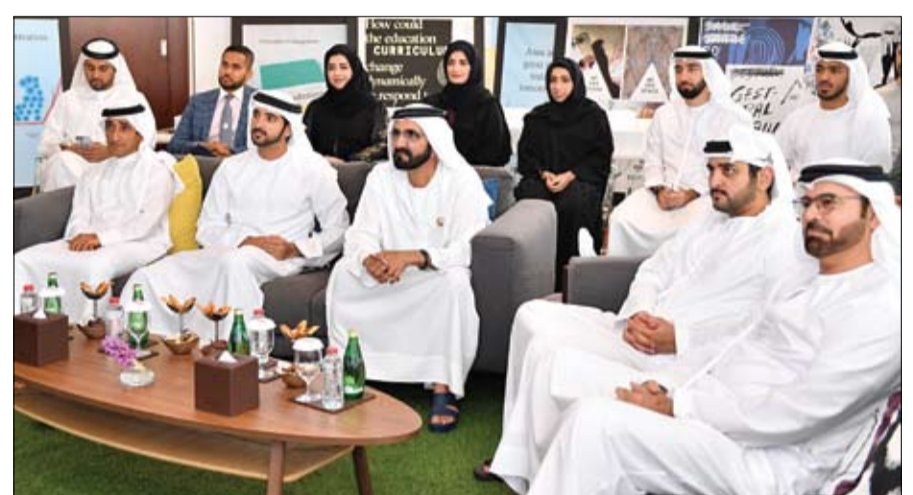
محمد بن راشد خلال إطلاقه منطقة 2071 (وام)

العلاقات الاستراتيجية بين دول مجلس التعاون والولايات المتحدة الأمريكية وسبل تعزيزها وتطويرها بما يحقق الصالح المشترك. ونقل صاحب السمو الشيخ محمد بن زايد آل نهيان