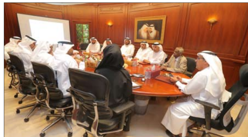
•• دبي - الفجر:

اجتمعت اللجنة العليا للشؤون القضائية، برئاسة سعادة طارش عيد المنصوري مدير عام محاكم دبي، حيث أوضح أن اللجنة العليا للشؤون القضائية، تجسد الجهود الدؤوبة التي تبذلها محاكم دبي في سبيل تطوير المنظومة القضائية، وتوفير خدمات قانونية تخدم المجتمع المحلي، مشيراً إلى أن إطلاق خدمات جديدة تواكب التطور المتسارع الذي تشهده إمارة دبي، يأتي تماشياً مع الرؤية الثاقبة والتوجيهات السديدة لصاحب السمو الشيخ محمد بن راشد آل مكتوم نائب