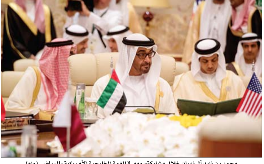
محمد بن زايد آل نهيان خلال مشاركة سموه في القمة الخليجية الأمريكية بالرياض

تأنيب القائد الأعلى للقوات المسلحة في اللقاء التشاوري السابع عشر لقادة دول مجلس التعاون لدول الخليج العربية في العاصمة الرياض. واستقبل في الرياض أمس بجناح سموه في مركز الملك عبدالعزيز الدولي للمؤتمرات على هامش أعمال قمته الرياض صاحب السمو الملكي الأمير محمد بن سلمان بن عبد العزيز ولي ولي العهد النائب الثاني لرئيس مجلس الوزراء وزير الدفاع بالملكة العربية السعودية الشقيقة.. كما بدأت أمس أعمال القمة العربية الإسلامية - الأمريكية في الرياض بالملكة العربية السعودية برئاسة خادم الحرمين الشريفين وفخامة الرئيس دونالد ترامب رئيس الولايات المتحدة الأمريكية ومشاركة صاحب السمو الشيخ محمد بن زايد آل نهيان ولي عهد أبوظبي نائب القائد الأعلى للقوات المسلحة.