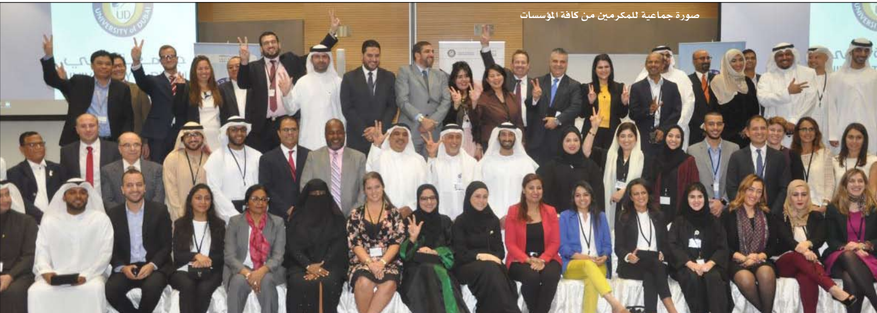
صورة جماعية للمكرمين من كافة المؤسسات