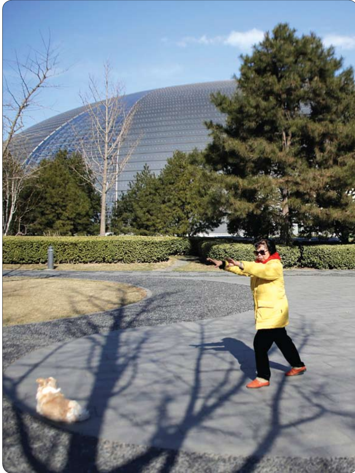
امراة صينية تمارس أحد التمارين التقليدية في فنون الدفاع عن النفس خارج المسرح الوطني الكبير في يوم شمس وسط بكين.

حقق العلماء الأمريكيون تقدماً مهماً في ابتكار نوع جديد من المضادات الحيوية، يستطيع التعامل مع البكتيريا والجراثيم التي تقاوم المضادات الحيوية الأخرى، وذلك بعد أن احتار العلماء مع حالة مرضية في ولاية نيفادا الأمريكية، أصيبت ببكتيريا انتشرت في جميع أنحاء الجسم وجربوا معها 26 نوعاً من المضادات الحيوية ولم يفلح أي منها في القضاء على البكتيريا وتوفيت السيدة. ووفقاً للعلماء، فإن العدوى التي كان من السهل علاجها من قبل تطورت بشكل كبير للتوافق مع البيئة التي تعيش فيها فيها لذلك طور العلماء الجزيء ليهاجم الإنزيم الذي يتسبب في مقاومة البكتيريا للمضادات الحيوية. قال أحد الباحثين بروس جيلر من جامعة ولاية أوريغون للعلوم إن "هذا الجزيء يمكن أن يسمح لنا باستخدام الأدوية التي لا جدوى منها حالياً بعد أن فقدت هذه المضادات فعاليتها في معالجة كثير من الحالات الطبية". وتابع أن الخطوة المقبلة ستكون في محاولة لتطوير عقاقير جديدة مقاومة للبكتيريا وذلك من خلال إجراء تغييرات الكيميائية مع الأخذ في الاعتبار ما تم اكتشافه من قبل العلماء فيما يخص الجزيء الجيد والبق يتحور والآن هم مقاومة لمضادات حيوية جديدة، معدلة كيميائياً. واعتبرت هذه الجراثيم "تهديداً أساسياً" من قبل الأمم المتحدة، وتوقعت أنها سوف تقتل 300 مليون شخص بحلول عام 2050.