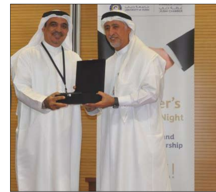
خلال تكريم رئيس الجامعة لـ موارد للتمويل

نظمت جامعة دبي مؤخرًا حفل تكريم لـ 50 مؤسسة حكومية وخاصة ، كانت موارد للتمويل ضمن تلك المؤسسات الراعية والداعمة ، والذين تقدمهم الجامعة شركاء النجاح لها وطلالها في كافة أنشطتها، كما توفرت تلك المؤسسات فرص التوظيف والتدريب لخريجي جامعة دبي. ومن خلال هذا الحدث الذي أقيم في حرم جامعة دبي في مدينة دبي الأكاديمية، قامت إدارة الجامعة بتكريمهم وتوزيع الدروع وشهادات التقدير لأكثر من 50 شركة وجهة من جميع أنحاء الدولة من ضمنها موارد للتمويل ، ودبي للسياحة ، وبنك الإمارات دبي الوطني، وطيوان الإمارات ، وغرفة دبي ، ودائرة التنمية الاقتصادية.