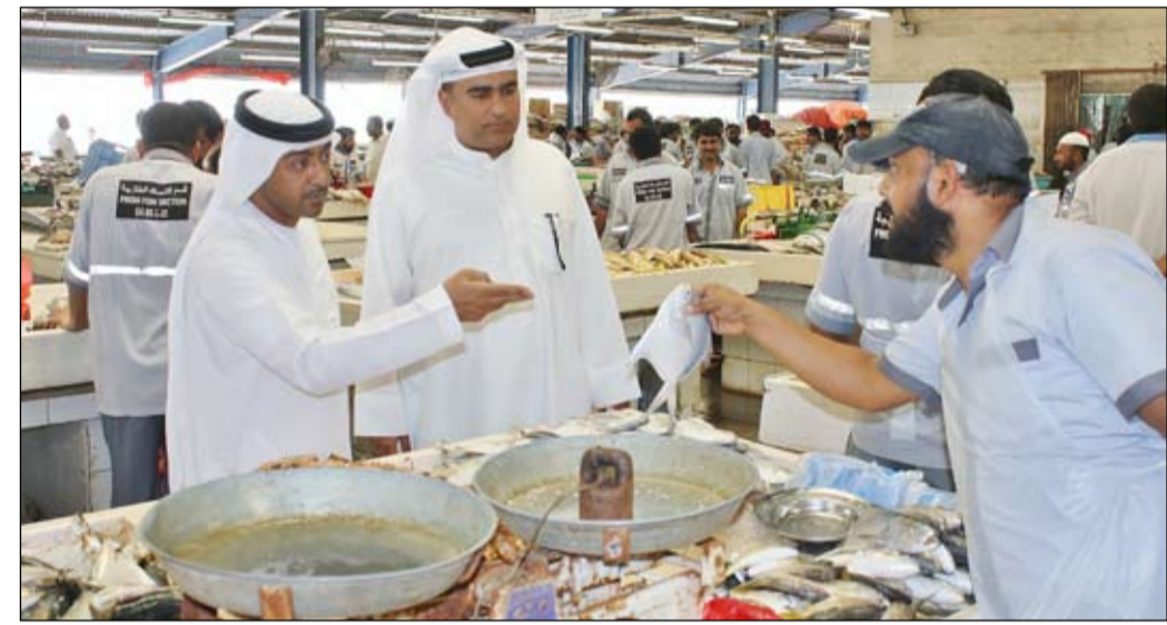
تعريف المستهلك بالمنتجات البحرية أثناء الزيارة. نظراً للإقبال الغفير في شهر رمضان المبارك الذين تشهد معظم إزدحاماً كبيراً من قبل المستهلكين. وأسلاف العوضي: "مهتد الزيارة سلسلة من اللقاءات مع عدد من التجار وذلك حرصاً على تعزيز مبدأ الشراكة مع القطاع الخاص، والتأكيد على أن قطاع الرقابة