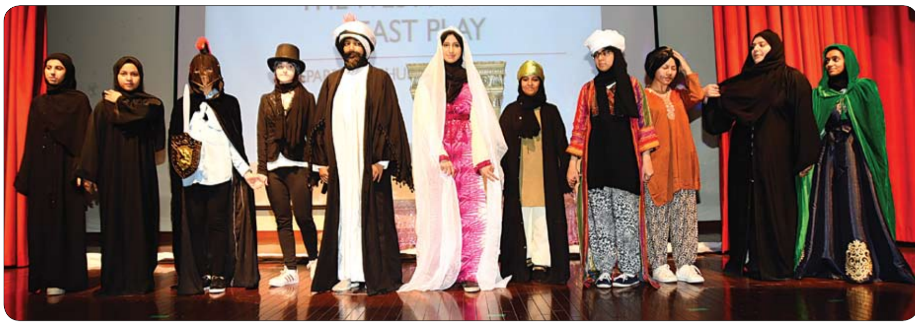
تضمن 23 عرضاً مسرحياً

مؤكداً أن دار زايد للثقافة الإسلامية تساهم في إظهار صورة متميزة لدولة الإمارات في التعاضد السلمي والتسامح الديني بين المسلمين وغيرهم، تحقيقاً لأهدافها الإستراتيجية، ولرؤيتها وقيمتها ورسالتها في أن تكون مؤسسة رائدة ومتميزة في التعريف بجوهر الثقافة الإسلامية واستيعاب المهتمين الجدد.