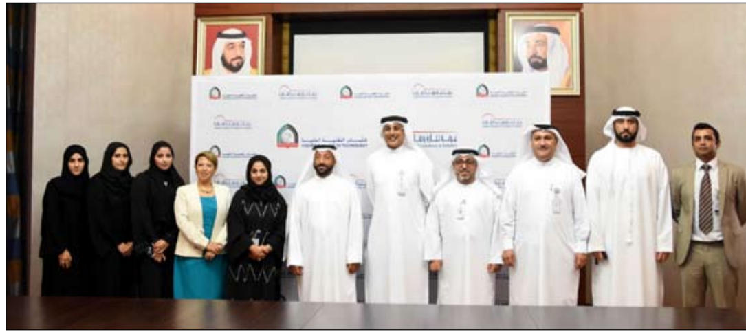
من خلال تأسيس «حاضنة أعمال»

أعلنت طيران الإمارات عن زعمها استبدال طائرات البوينج 777 التي تسيرها حاليا على رحلاتها اليومية الثانية إلى بيرمنغهام وبكين وشنغهاي بطائرات إيرباص ايه 380 لتلبية الطلب القوي على هذه الخطوط. ومن المقرر أن تشغل الناقل هذه الطائرات العملاقة على جميع رحلاتها إلى بيرمنغهام لتتحوّل الرحلة في كيه 39 40 للعمل بهذا الطراز اعتبارا من 29 أكتوبر المقبل في حين تعمل على كيه 308 309 و في كيه 304 305 إلى بكين وشنغهاي بطائرات إيرباص ايه 380 اعتبارا من أول يوليو المقبل. ومن المقرر أن توفر طيران الإمارات أكثر من 615 مقعدا في كل اتجاه بين دبي وبيرمنغهام بتقسيم درجتين 58 مقعدا تتحول إلى سرير مستو في درجة رجال الأعمال و 557 مقعدا في الدرجة السياحية و 519 مقعدا على خطي بكين وشنغهاي يتقسيم الدرجات الثلاث.