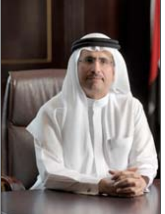
العالم ويؤكد سعي الجميع نحو تعزيز مفهوم التنمية المستدامة.

التجارية وحماية المستهلك حرص على ضمان سير مزاولة الأعمال وفق أرقى المعايير المتبعة، وأن الغرض من هذه الزيارات والحملات المستمرة هو توعية التجار، والعمل على توطيد علاقتهم بالمستهلكين، الأمر يساهم في تطبيق مبدأ الشفافية والحيادية بين التاجر والمستهلك، وبالتالي عدم تراكم المخالفات والتجاوزات من قبل منافذ البيع والتجار.