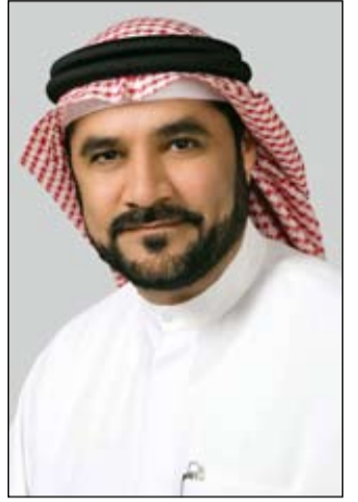
•• الشارقة - و.ام:

كشفت هيئة كهرباء ومياه الشارقة عن انتهائها من تنفيذ 38 مشروعاً في مجال تطوير شبكات النقل وإنشاء محطات توزيع الكهرباء في إمارة الشارقة خلال العامين الماضيين مما حقق الثبات والاستقرار للشبكات الكهربائية وتخفيض نسبة الانقطاعات خلال الصيف الماضي بنسبة 60 في المائة ومن المخطط الانتهاء من 8 محطات جهد 33 كيلو فولت وأربع محطات 132 كيلو فولت نهاية العام الحالي.