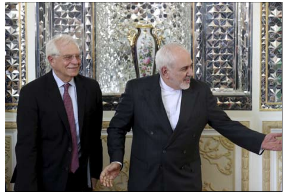
الوزير بوريل ووزير الخارجية الفرنسي لوران فابيوس في باريس.

واليوم، وفي مقابل تعهد جديد بالالتزام، تريد طهران من الاتحاد الأوروبي أن يشتري نضطها، أو أن يعطيها مليارات الدولارات عبر قروض، وخطوط ائتمانية للتهرب من تأخير عقوبات ترامب.