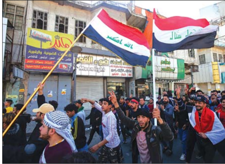
استمرار المظاهرات العراقية الراضة لواقف السياسيين

ساحة الحويبي ضد أنصار زعيم التيار الصدري، مقتدى الصدر، بعد خطبة السيستاني.