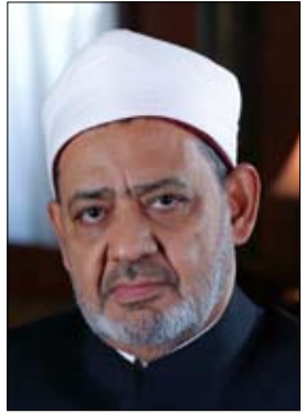
•• القاهرة- وام:

أعرب مجلس حكماء المسلمين برئاسة الإمام الأكبر الدكتور أحمد الطيب شيخ الأزهر الشريف رئيس مجلس حكماء المسلمين عن تقديره لقرار خادم الحرمين الشريفين الملك سلمان بن عبد العزيز آل سعود ملك المملكة العربية السعودية بدخول الحجاج القطريين دون تصاريح إلكترونية واستضافتهم بالكامل على نفقته الخاصة وتوفير الاحتياجات كافة لهم ضمن برنامج ضيوف خادم الحرمين الشريفين للحج والعمرة إضافة إلى إرسال طائرات خاصة تابعة للخطوط الجوية السعودية إلى مطار الدوحة لإركاب الحجاج القطريين كافة على نفقته الخاصة.