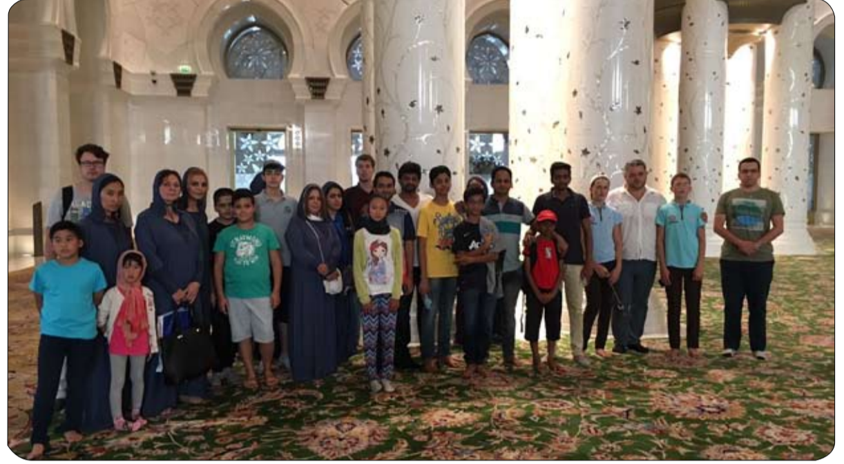
تواصل فعاليات مهرجان أبو ظبي الدولي للشطرنج 2017