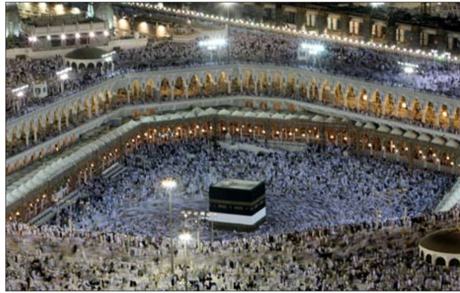
•• مكة المكرمة- وام:

أكملت المملكة العربية السعودية استعداداتها لاستقبال أكبر موسم حج في تاريخها هذا العام بعد صدور أمر خادم الحرمين الشريفين الملك سلمان بن عبد العزيز آل سعود بزيادة أعداد الحجاج 800 ألف حاج من خارج وداخل المملكة مع قرب انتهاء أعمال توسعة الحرمين الشريفين ليصل مجموع الحجاج إلى 2.6 مليون حاج. وكانت السعودية استقبلت العام الماضي 1.862 مليون حاج وحاجة منهم 1.325 مليون من خارج المملكة وأكثر من 537 مليوناً من الداخل الغالبية العظمى منهم من القيمين غير السعوديين.