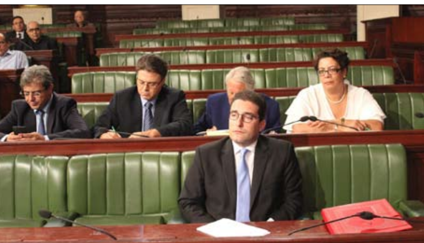
ممثل الرئاسة تونس في حاجة الى المصالحة