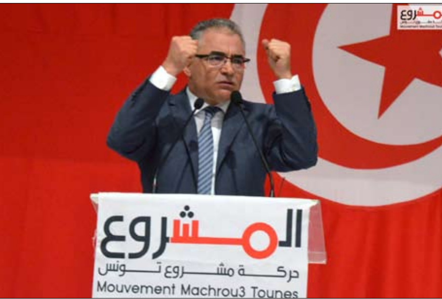
مرزوق في صميم العدالة الانتقالية