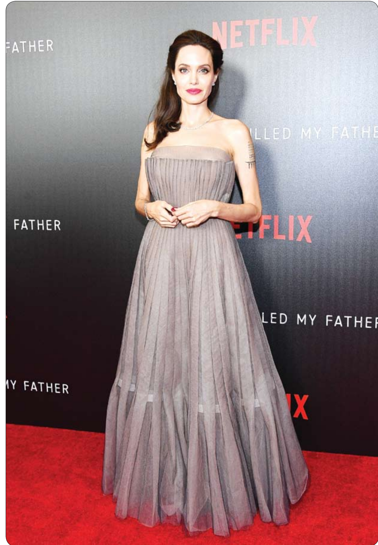
أنجلينا جولي خلال حضورها العرض الأول لفيلم "قتلوا أبي أولاً" في مدينة نيويورك.

كشفت صحيفة ديلي ميل البريطانية، كيف اتخذ حدث خيري لمكافحة الانتحار منحني درامياً، عندما تحررت بقرة معروضة في المزد خارج مبنى البرلمان في مدينة بيرث الأسترالية. وتم عرض البقرتين وينستون وكليمنتين، خارج مبنى البرلمان اليوم كجزء من الترويج لمبادرة الصحة النفسية لمنظمة RUOK لمكافحة الانتحار. ولكن فجأة أصيبت البقرة وينستون، بالهلع أثناء لفها بالشريط، وهربت من حارسها أمام المترجمين الدهوليين إلى الشارع. وبحسب الصحيفة، ركضت البقرة وينستون، حول مبنى البرلمان بينما كان حارسها يطاردتها مع مجموعة من وسائل الإعلام، وفي النهاية تمكن الحارس من إعادتها إلى الموتر، ولكن ليكتمل المشهد المرحج بدأت البقرة كليمنتين بالتبول على العشب.