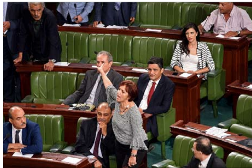
تشنج تحت قبة البرلمان