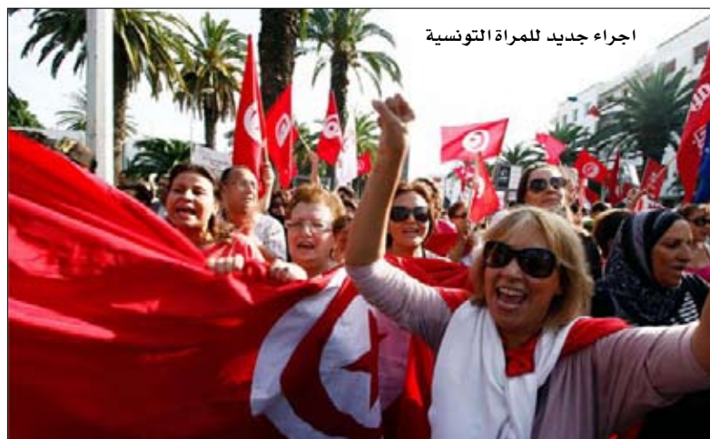
اجراء جديد للمرأة التونسية

أضى وزير العدل التونسي العمل بملشور عام 1973 المتعلق بزواج المرأة التونسية المسلمة بغير المسلم وأغى كل من وزير الشؤون المحلية ووزير الخارجية جميع المناشير المتعلقة بالحد من حرية التونسية في اختيار قريبها استناداً إلى مخالفة المناشير المذكورة للدستور وتعارضها مع الاتفاقيات الدولية المصادق عليها من الدولة التونسية، لاسيما وأن المناشير لا يمكن لها بحكم طبيعتها أن تنشئ حقوقاً أو تفسر من الوضعية القانونية لأن دورها يقتصر على تفسير النصوص التشريعية والترتبية.