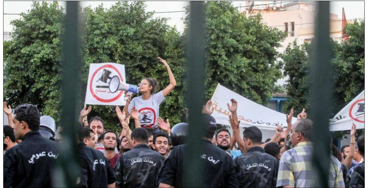
حركات احتجاجية في الشارع

تعلقت بهم تهم الفساد في عهد نظام الرئيس الأسبق زين العابدين بن علي.