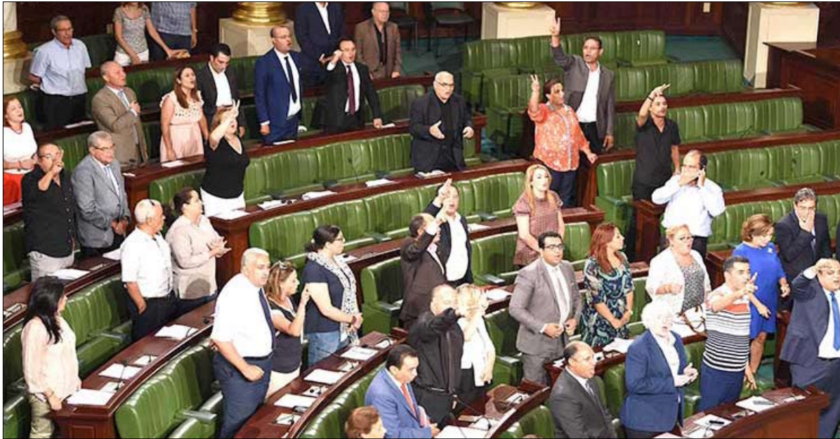
المنتصرون بعد التصويت