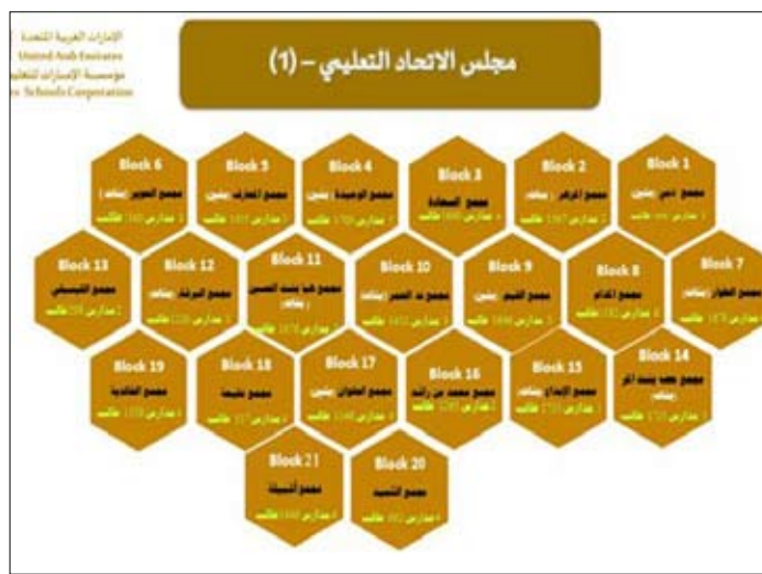
مبادرة المجالس والمجمعات المدرسية