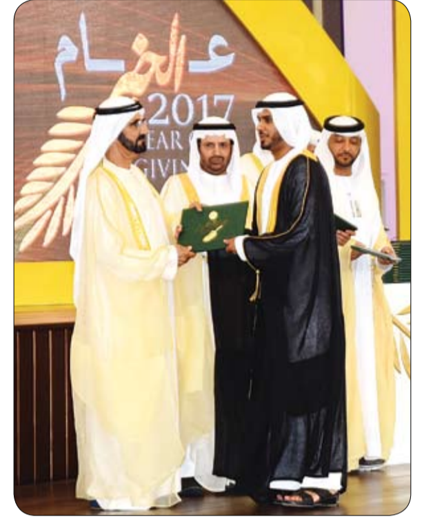
•• العين - وام - محمد جاهين: تصوير محمد معين

والاقتصاد والقانون والأغذية والزراعة والهندسة وتقنية المعلومات والطب والعلوم الصحية ثم طلبة الدراسات العليا وصافحهم سموه وسلمهم شهادتهم العلمية وهنأهم على نجاحهم وتخرجهم وانتقالهم الى عالم جديد ومرحلة جديدة في مسيرتهم المباركة نحو المجد والاستقرار وتحقيق الذات من خلال إثبات وجودهم في مواقع العمل الوطني والإبداع كل في مجال تخصصه وموهبته.