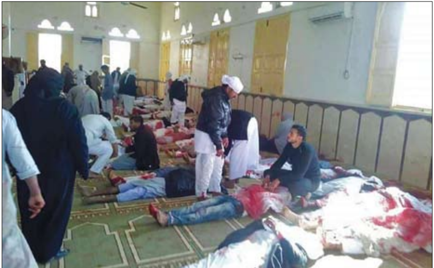
الارهابيون يرتكبون مجزرة بحق المصلين في مسجد الروضة في بئر العبد شمال سيناء