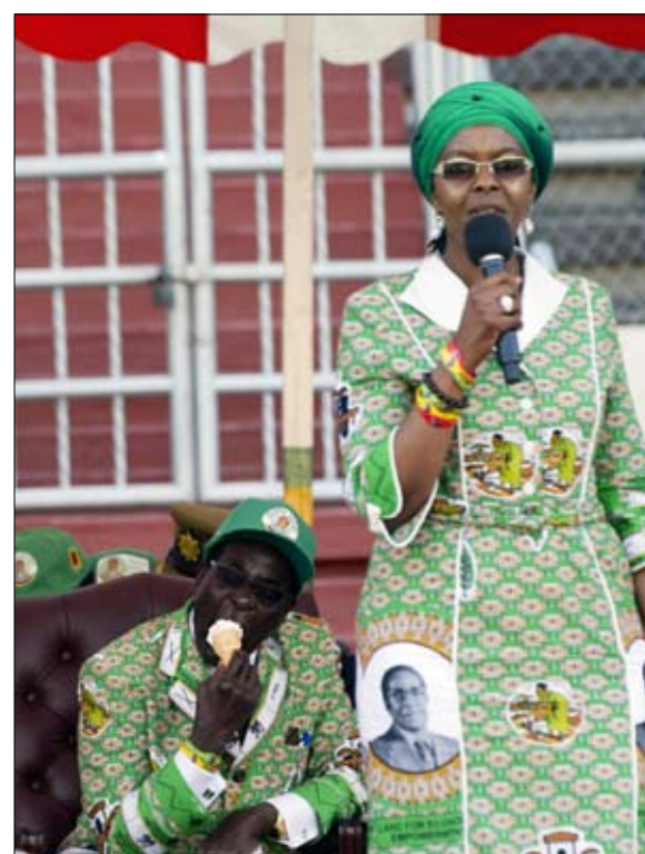
زوجته عجلت بنهايته واجبرته على تجرع الدواء المر

إن "أخوة السلاح" لهذه الجماعات المسلحة وقادتها لم تمنع التنافس والانقسامات السياسية، وأحياناً الاختلافات العرقية. كان الزيمبابويون في الواقع