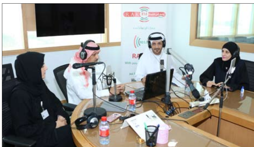
السراقات، وحرص شرطة رأس الخيمة على تعزيز الامن والامان