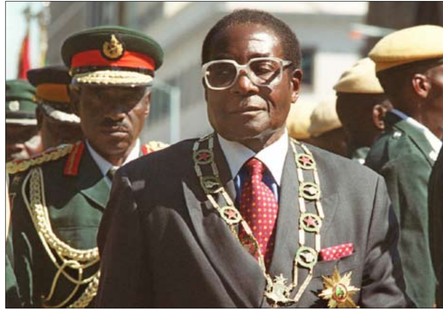
جرد من نياشينه واورت الخراب