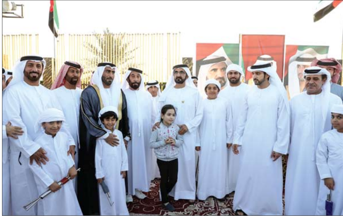
محمد بن راشد خلال حضوره أفراح الحميري والفلاسي