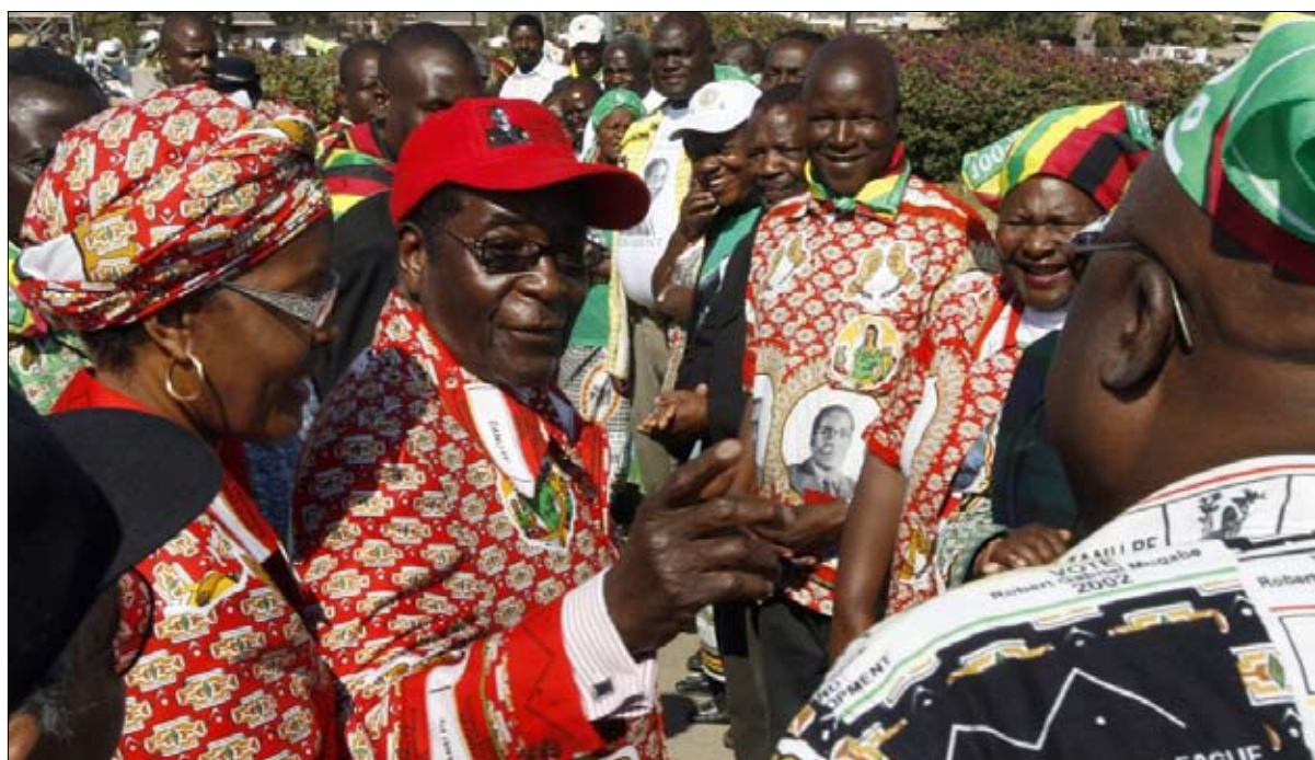
وانفضت الجموع من حوله

ففي فورت هير، وبالتواصل مع الجيل الجديد من السود ما بعد الحرب، حيث سيطر نيلسون مانديلا ورفاقه على رابطة شباب حزب المؤتمر الوطني الافريقي، ودفعه باتجاه حركة أكثر حزماً