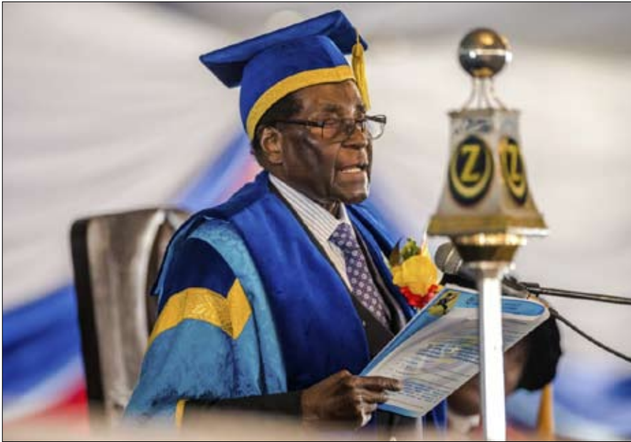
نهاية مؤسسة لبطل

"بنظرة إلى الوراء، أدرك مع أشخاص آخرين من ذوي النوايا الطيبة، ربما كنت قد ساهمت في تحويل روبرت موغابي إلى الرجل الذي أصبح اليوم. فلو واجهنا أولى علامات البارانويا التي ظهرت عليه، هل كان بإمكان زيمبابوي أن تتجنب هذا النزول إلى الجحيم؟، وإذا كان بيض هذا البلد أكثر واقعية واعترفوا باستحالة المرور السلس من دولة بوليسية أشاؤها إلى ديمقراطية موهومة ربما كانوا أكثر تواضعاً وأقل استغرافاً؟، أم أن روبرت موغابي مجرد نموذج لقدرة