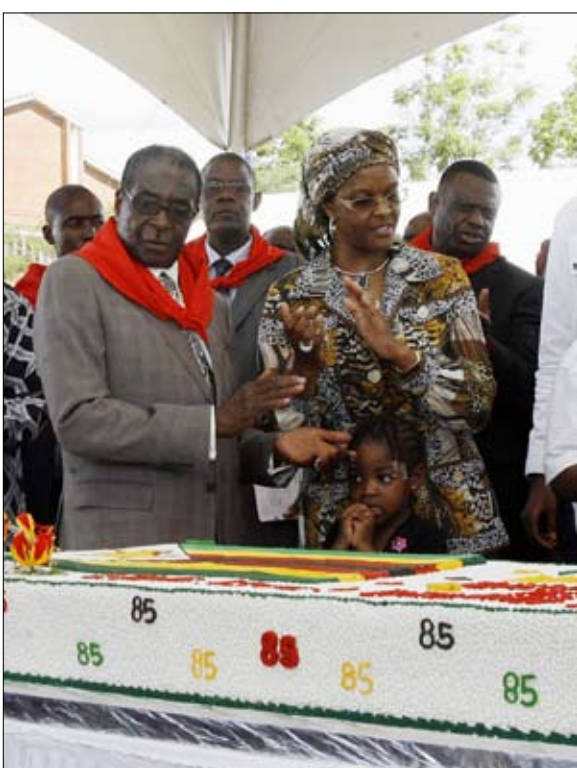
احتفاء باحد اعياد ميلاده

في انتخابات 1980، تقدم روبرت موغابي ويوشوا نكومو بهالة قادة حرب التحرير، ولكنهما واجها مرشحين اثنين آخرين من السود كانا يتمتعان بمساندة البريطانيين والمستوطنين البيض: الأسقف الميثودي أنيل موزورويو، رئيس شكل من الطريق الثالث، ومنشق من زانو أصبح معارضا يسنده المستعمرون، نادابينجي سيثول. كانت الحملة الانتخابية شرسة، حيث استطاع كل مرشح جمع حشود ضخمة من المؤيدين. ولكن يوم النتائج، كانت المفاجأة