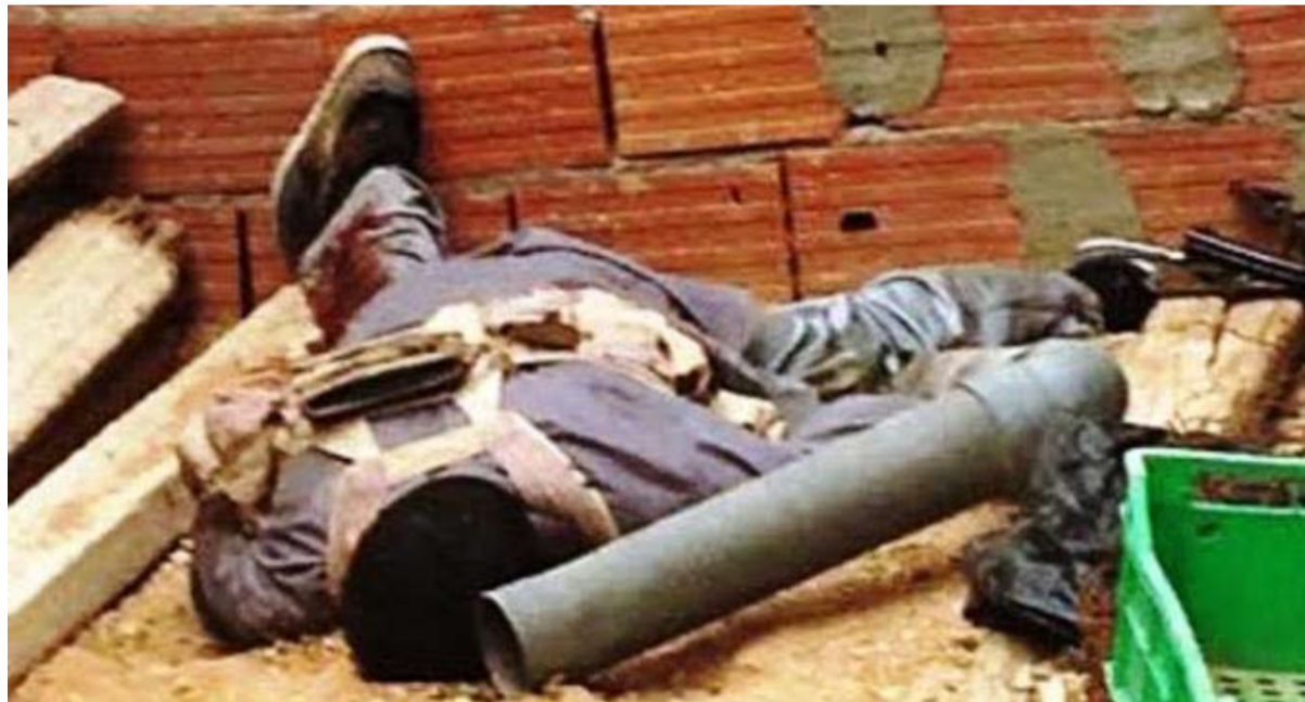
جثة احد الارهابيين