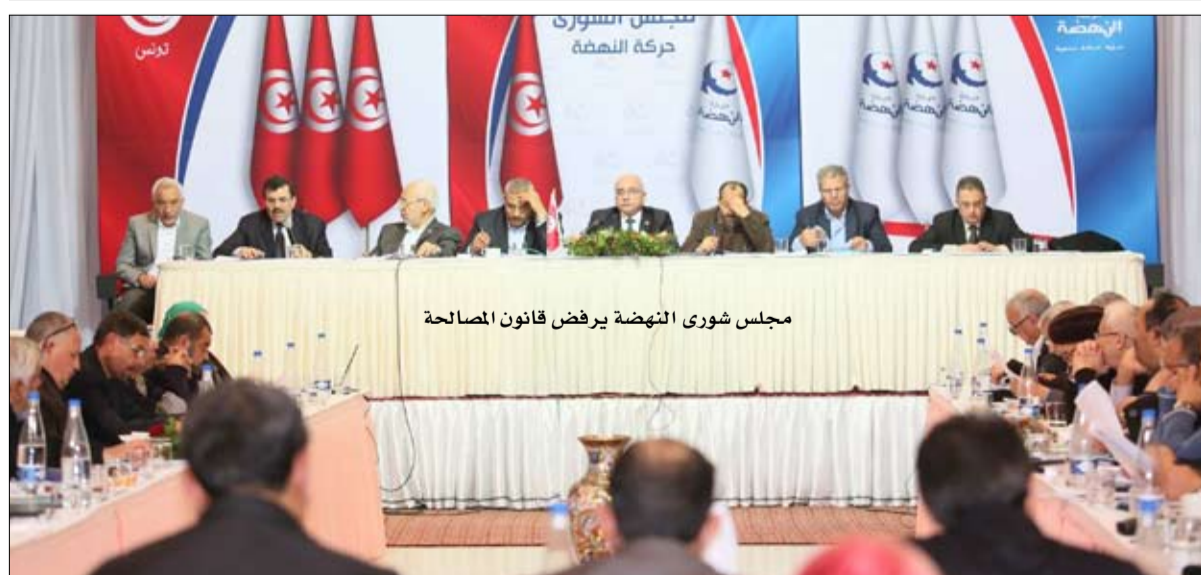
مجلس شوري النهضة يرفض قانون المصالحة