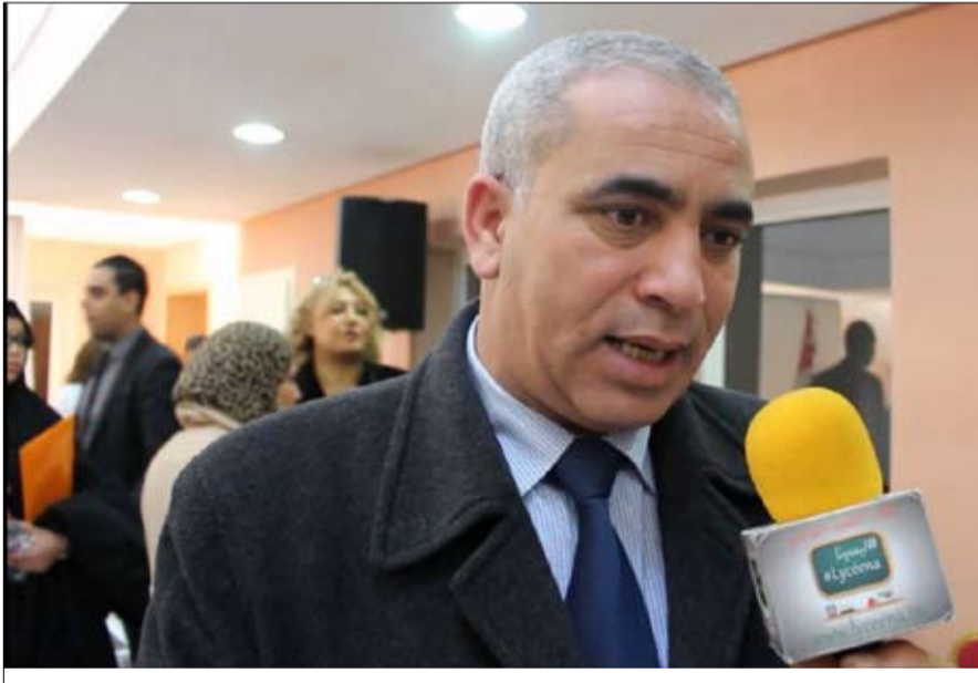
لسعد البعقوبي إقالة جلول تمت بالاتفاق بين الاتحاد والحكومة