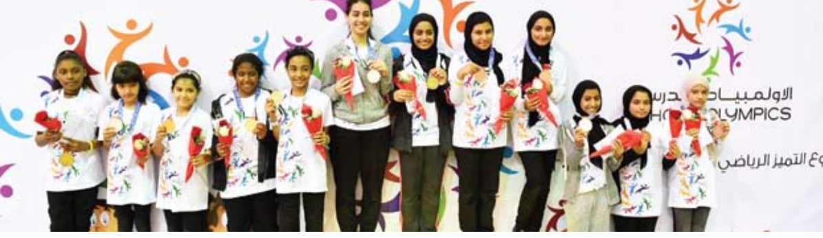
الأولمبياد المدرسي في دبي - الريشة الطائرة

سجلت لعبة الريشة الطائرة أول حضور ناجح لها في المرحلة النهائية للأولمبياد المدرسي الخامس التي أقيمت الأسبوع الماضي بمشاركة 173 لاعباً (89 بنين و84 بنات)، تنافس جميعهم في فئات تحت 11 و13 و15 سنة، وذلك على مدى يومين، 24 و25 أبريل الماضي. وتم في أكتوبر الماضي الإعلان عن إدراج رياضة الريشة الطائرة ضمن ألعاب الأولمبياد المدرسي، لتكون أول لعبة مضارب تدخل الأولمبياد إلى جانب ألعاب القوى والسباحة والرمماية والمبارزة والتايكواندو والجودو والفوس والسهم والجوجيتسو. وعقب هذا الإعلان وسع برنامج وقت الريشة دبي، الذي انطلق في دبي منذ ثلاث سنوات، فعالياته وعمل مع اللجنة الوطنية الأولمبية ووزارة التربية لتقديم الدعم في إنشاء 18 مركزاً تدريبياً لأولمبياد الريشة الطائرة المدرسي في جميع أنحاء الدولة. وتلقت مراكز التدريب الوطنية دبي التي تأسست في عام 2015 دعماً إضافياً من اللجنة الأولمبية الوطنية ووزارة التربية والتعليم لإعداد المعلمين وفرضهم بالمهارات اللازمة لتدريب الأطفال المشاركين