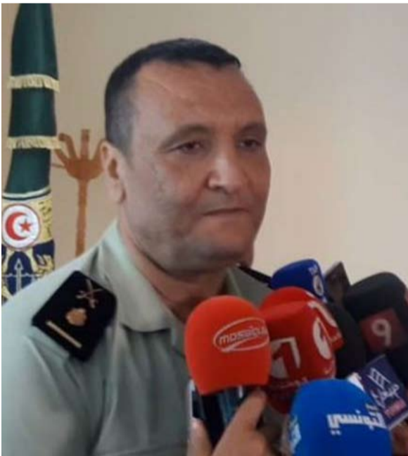
خليفة الشيباني الناطق الرسمي باسم الحرس الوطني

وأضاف الشيباني أنه تم رصد العنصرين وتحليل المعلومات الواردة حولهما، وتم التأكد من المنزل الذي تحصنا به، وبدأت العملية بمسوحات مسلحة حوالي منتصف نهار يوم الأحد، وشدد على أن أصوان الحرس الوطني حاولوا إيقاف العنصر الأول حيا لكنه فجر نفسه بعد تعرضه للإصابة في حين تواصلت المواجهات لأكثر من ساعة مع العنصر الثاني إلى حين القضاء عليه، وهو أصيل سيدي بوزيد ومعروف لدى الأمن.