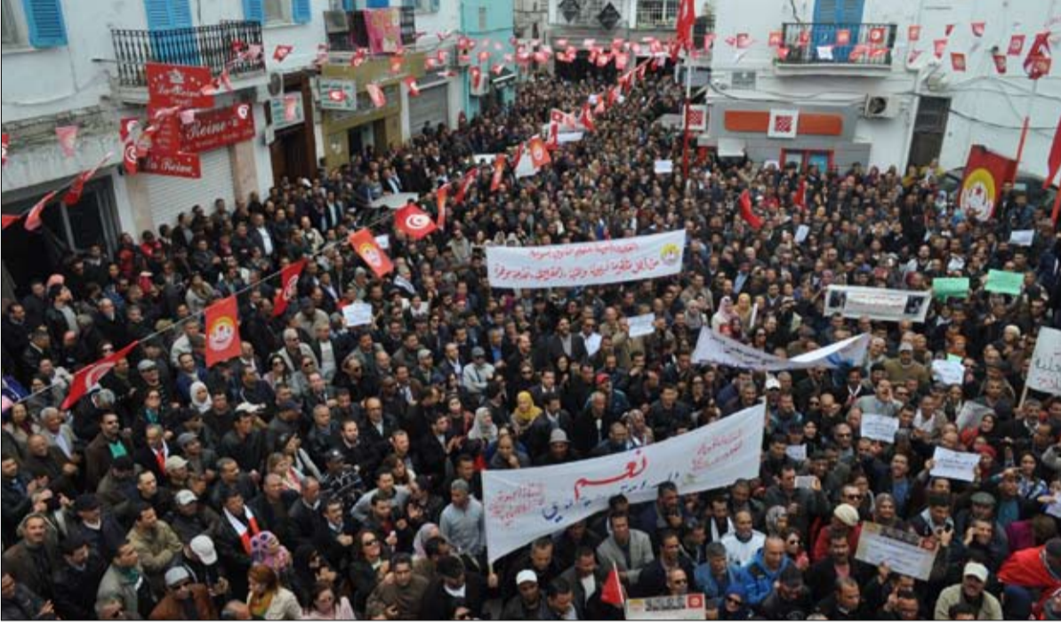
من مسيرات رجال التعليم المطالبة برحيل جلول