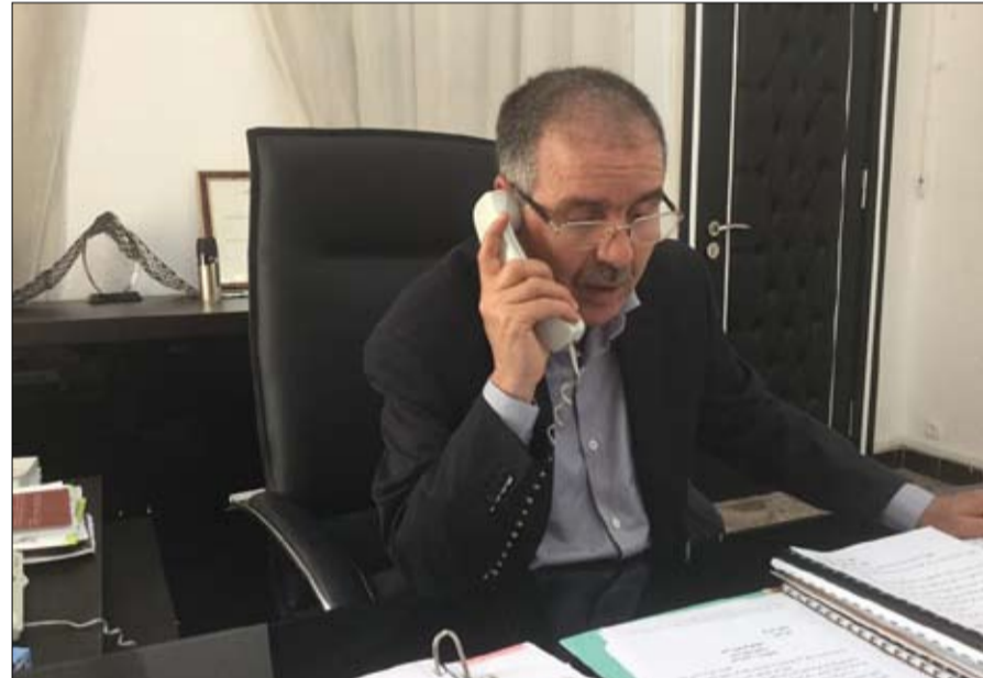
الطوبوي يشكر الشاهد.