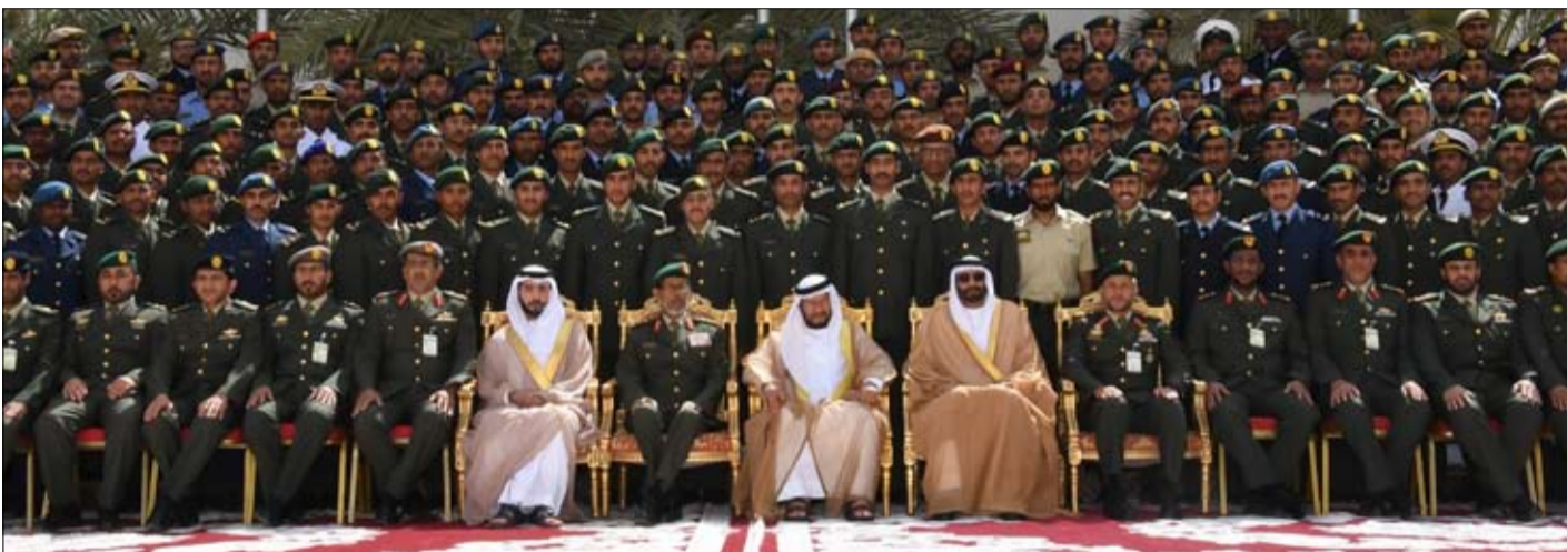
سلطان بن زايد يشهد تخرج دورة ضباط جامعيين في كلية زايد الثاني العسكرية

عقد فريق إدارة الطوارئ والأزمات والكوارث المحلي في رأس الخيمة تمرين طاولة مشترك على مجموعة فرضيات متعلقة بقطاع الطاقة. شارك في التمرين ممثلون عن جميع الجهات المحلية والاتحادية المعنية وهي .. الهيئة الاتحادية للكهرباء والماء والقيادة العامة لشرطة رأس الخيمة وإدارة الدفاع المدني ومنطقة رأس الخيمة الطبية ومواصلات الإمارات وبلدية رأس الخيمة ودائرة الأشغال العامة والهلال الأحمر وهيئة تنظيم قطاع الاتصالات وهيئة البيئة والتنمية والمركز الوطني