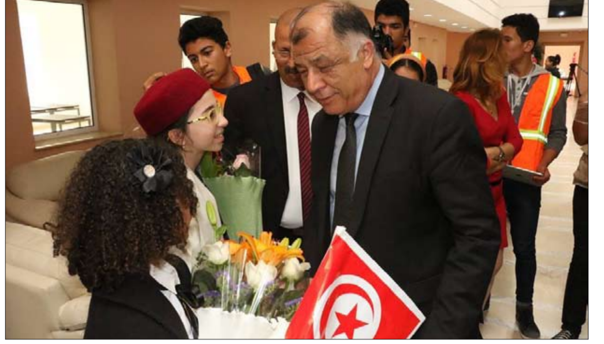
ناجي جلول إقالة الوزير الأكثر شعبية

الإصلاح يحتاج إلى رؤية موحدة بين مختلف مراحل التعليم. في حين اعتبر الأمين العام للاتحاد العام التونسي للشغل نور الدين الطوبوي، أن إقالة وزير التربية ناجي جلول من منصبه انتصار للمدرسة العمومية وللشعب التونسي عامة، مؤكدا بأن التجاذبات حول ملف التعليم دامت أكثر من سنة وطالت أكثر من اللازم، وفق تقديره.