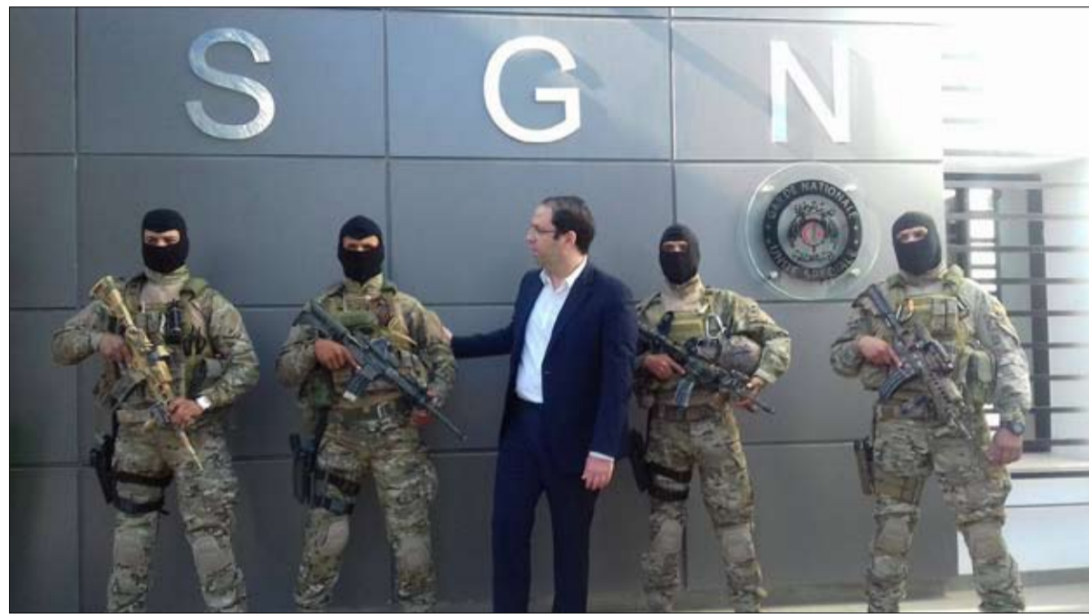
الشاهد يتوّه بالقوات الامنية