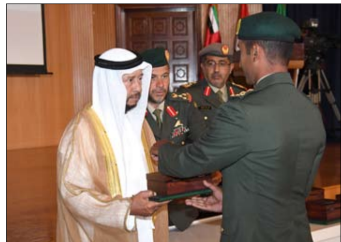
سلطان بن زايد يشهد تخرج دورة ضباط جامعيين في كلية زايد الثاني العسكرية

قدم سمو الشيخ سلطان بن زايد آل نهيان ممثل صاحب السمو رئيس الدولة واجب العزاء في وفاة المغفور له كحيد بن ضاحي العميمي وذلك خلال زيارة سموه اس خيمة العزاء جوار منزل الفقيد في مدينة العين والتقى خلالها أولاده حمد وعبد الله ومحمد وعتيق وعدد من أهله وأقاربه. كما قدم العزاء إلى جانب سموه .. معالي الفريق ضاحي خلفان تميم نائب رئيس الشرطة والأمن العام في دبي وجمع غير من المواطنين والمقيمين الذين عبروا عن صادق مواساتهم في المصاب الجل.. سائلين الله العلي القدير أن يتغمد الفقيد بواسع رحمته وأن يسكنه فسيح جناته وأن يلهم أهله الصبر والسلوان.