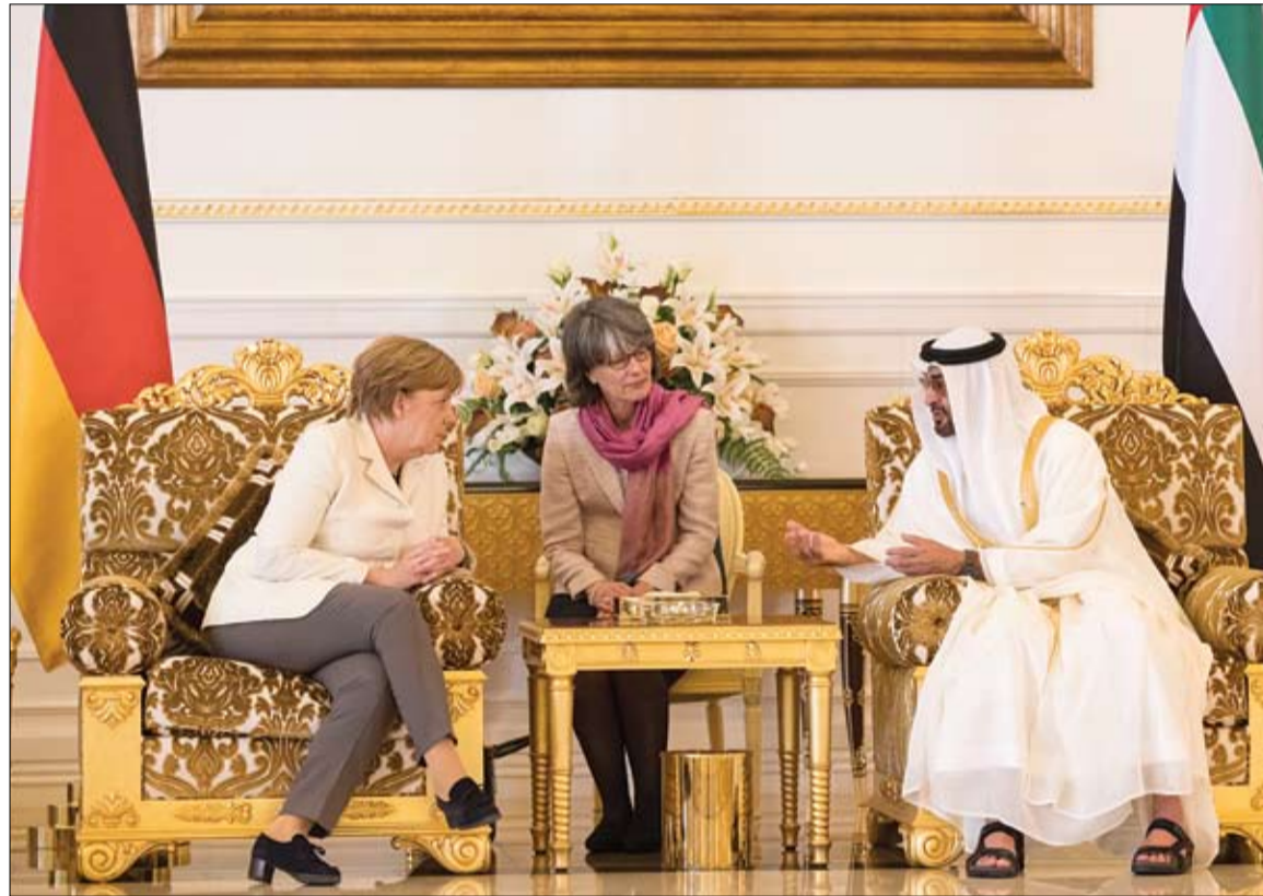
محمد بن زايد خلال محادثاته مع ميركل

•• أبوظبي-وام: بحث صاحب السمو الشيخ محمد بن زايد آل نهيان ولي عهد أبوظبي نائب القائد الأعلى للقوات المسلحة مع السيدة أنجيلا ميركل مستشارة الجمهورية ألمانيا الاتحادية.. تعزيز العلاقات الوثيقة بين البلدين والقضايا الإقليمية والدولية ذات الاهتمام المشترك. جاء ذلك خلال جلسة المحادثات التي عقدت امس بين الجانبين في أبوظبي. ورحب صاحب السمو الشيخ محمد بن زايد آل نهيان في بداية اللقاء بزيارة المستشار الألمانية للدولة.. مشيراً إلى أن الزيارة تأتي في إطار علاقات الصداقة المتينة التي تربط بين الشعبين والبلدين الصديقين. وجرى خلال اللقاء - الذي حضره سمو الشيخ طحون بن زايد آل نهيان مستشار الأمن الوطني - استعراض مجمل العلاقات الثنائية في المجالات السياسية والاقتصادية والتنموية والشركات القائمة بين البلدين والسبل الكفيلة بتنميتها وتطويرها. من جهة أخرى أكد صاحب السمو الشيخ محمد بن زايد آل نهيان، ولي عهد أبوظبي، نائب القائد الأعلى للقوات المسلحة أن دولة الإمارات العربية المتحدة بقيادة صاحب السمو الشيخ خليفة بن زايد آل نهيان رئيس الدولة حفظه الله تولي أهمية كبيرة للثقافة والأدب والعلم والمعرفة، وتضعها في سلم أولوياتها، وهي تحرص على رعاية وتشجيع المثقفين والأدباء من الدول العربية ومن مختلف دول العالم. جاء ذلك خلال استقبال سموه في قصر البحر الفائزين بجائزة الشيخ زايد للكتاب بمختلف فروعها بتقديمهم شخصية العام الثقافية للفترة الحادية عشرة 2016-2017 المؤرخ والمفكر المغربي الأستاذ الدكتور عبد الله العروي والفائزين في مسابقة أمير الشعراء ولجان التحكيم والناشرين ومنظمي معرض أبوظبي للكتاب والوفد اللبناني ضيف شرف المعرض (التفاصيل ص2-3)