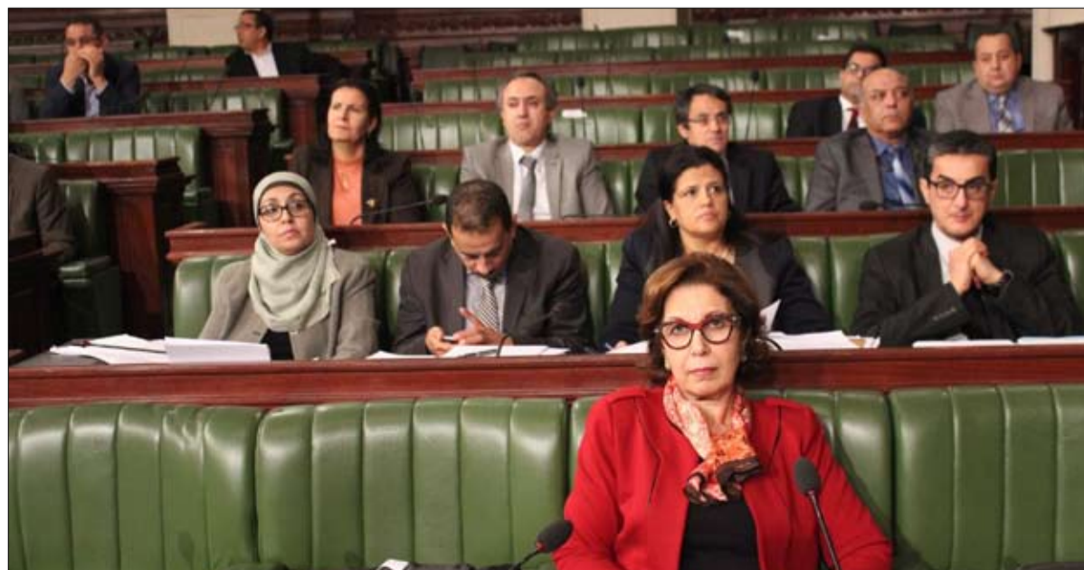
وزيرة المالية ضحية الدينار

المركزية النقابية تنوه بخطوة الشاهد ولا تعتبرها هدية عيد الشغل