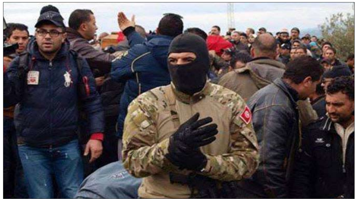
اجهاض مخطط ارهابي