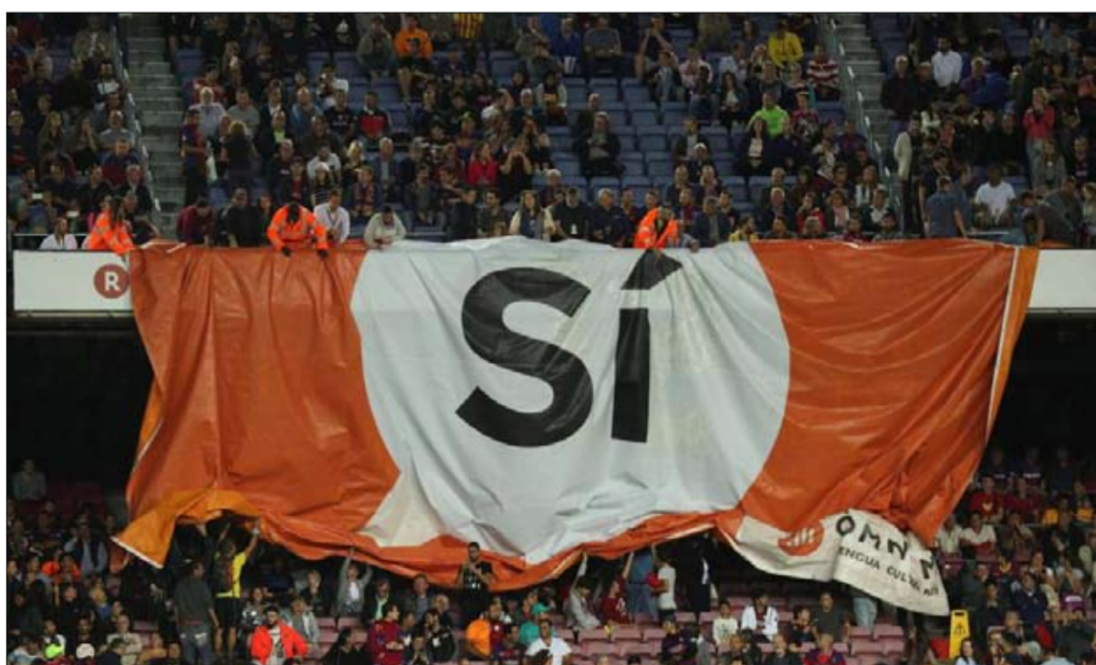
تبشير بانتصار نعم