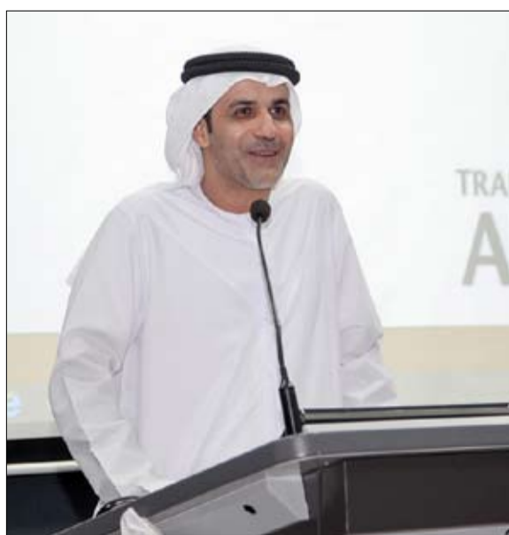
لوفرينج المتخصصة في تطوير وبناء نماذج الرعاية التمريضية والتي تتناسب مع حاجات مجتمع دولة الامارات بتنوعه الثقافي.

•• الشارقة-وام: نظمت وزارة الصحة ورشة عمل نموذج تحديد القوى العاملة التمريضية للتعريف بنموذج العمل الموحد للرعاية التمريضية والذي بدأ العمل الفعلي به في مايو 2017 وذلك بالتعاون ومشاركة رؤساء هيئات التمريض في المستشفيات والمؤسسات الصحية التابعة للوزارة. تعد الورشة - التي افتتحها سعادة الدكتور يوسف محمد السركال الوكيل المساعد لقطاع المستشفيات أمس قبل الأول - ورشة تعليمية لاستخدام أفضل الممارسات في معرفة متطلبات الكادر التمريضي من حيث العدد والمؤهلات لتقديم أفضل الخدمات. وسيتم تطبيق النظام في المستشفيات ومراكز الرعاية الصحية الاولية بالإضافة الى الطب الوقائي ليتناسب مع التباين في نوعية تلك المستشفيات واستخدام الأسرة التمريضية وعدد الساعات التي يحتاجها كل قسم لتقديم العناية التمريضية. تهدف الورشة بصفة عامة إلى وضع نظام يضمن حصول جميع المرافق على العدد الكافي والمناسب من الموظفين ذوي المؤهلات المناسبة وتطوير نطاق الممارسة التي من شأنها ضمان أن الكوادر التعليمية تعمل ضمن حدود تعليمهم، تضمنت الورشة عددا من المحاضرات التي ركزت على تحسين بيئة العمل للكوادر التمريضية ما ينعكس ايجابيا على جودة العناية التمريضية بمشاركة عدد من الخبراء المحليين والخارجيين مثل الخبيرة ساندري