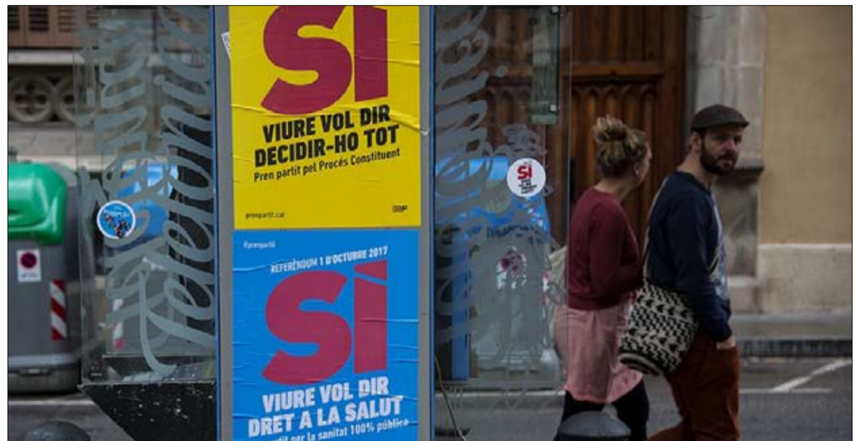
استفتاء على صفيح ساخن