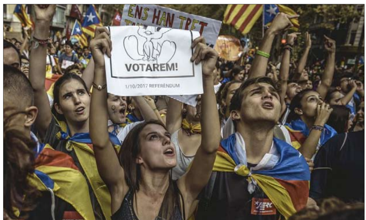
اصرار على التصويت مهما كان الثمن