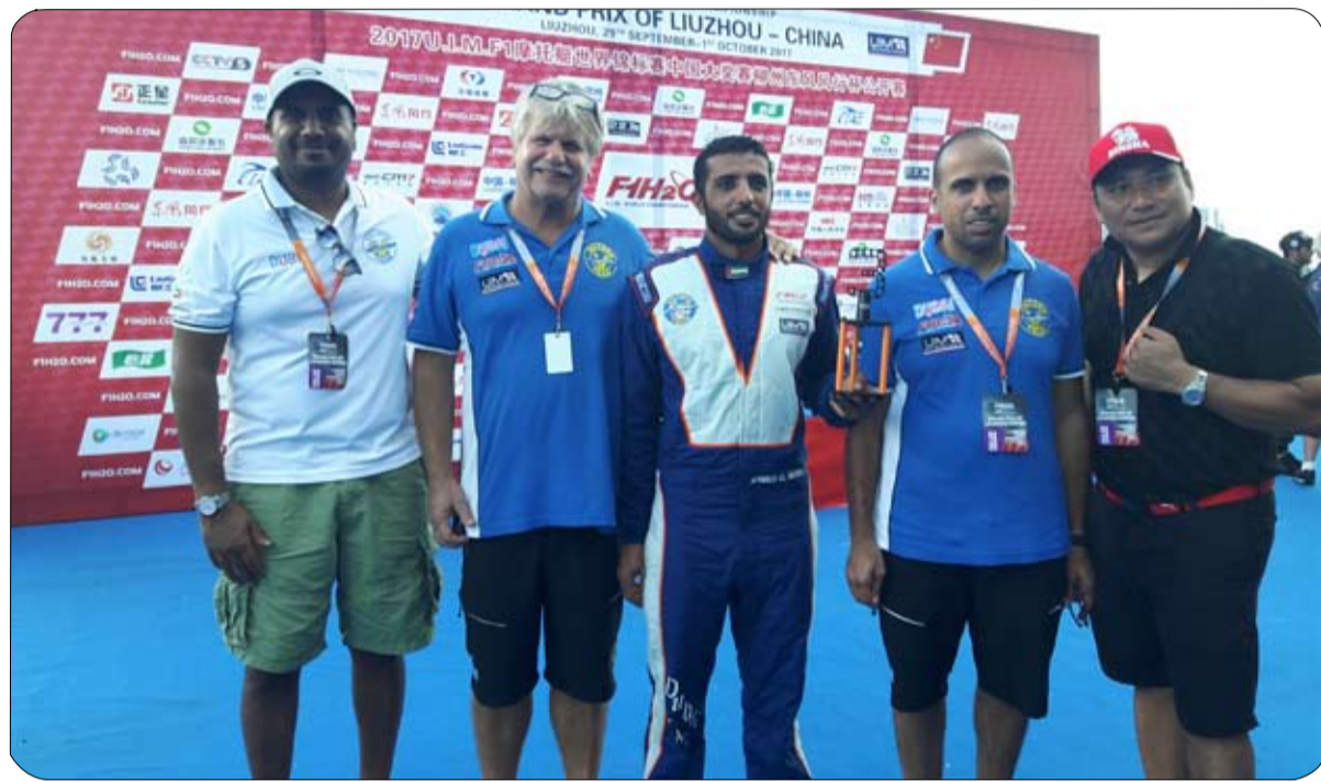
تقطعة مطروحة في ساحة المنافسة وأود أن احصد المزيد حتى أعود إلى دائرة الضوء من جديد.

وأضاف الجبثور أن المشروع يهدف إلى تعزيز رياضة البولو في دبي حيث استضاف منتجع ونادي الجبثور للبولو عدداً من البطولات العالمية، واستقطب الكثير من المواهب من مختلف أنحاء العالم. وعبر عن اعتزازه بإطلاق معلم جديد في دبي، مشيراً إلى أن منتجع ونادي الجبثور للبولو لا مثيل له بين المنشآت المملوكة من مجموعتها، وأنه معلم فريد من نوعه في الإمارات العربية المتحدة، ويشكل فندق سانت ريجيس دبي محور المنتجع، وهو محاط بمساحات خضراء وأربعة ملاعب بولو عالية الطراز، فضلاً عن استiplات فاخرة تتسع لأكثر من خمسمئة جواد.. وتقدم مدرسة ركوب الخيل العديد من الاختصاصات بدءاً من البولو والترويض والقفز الاستعراضى وصولاً إلى ركوب الخيل التقليدي.