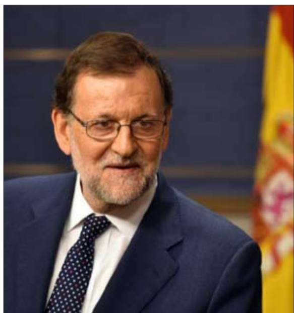
ماريانو راخوي مهزوم حتى وان انتصر

الناخبون الكاتالونيون من ايداع بطاقات الاقتراع في الصندوق؟ هل سيكونون قادرين على التعامل مع مكاتب الاقتراع، أساسا في المدارس، موزعة في جميع أنحاء كاتالونيا، تم مصادرة بعضها وربط الانفصاليين في أخرى لمنع غلقها؟ وما معنى هذا الاستفتاء، في غياب تعداد رسمي؟