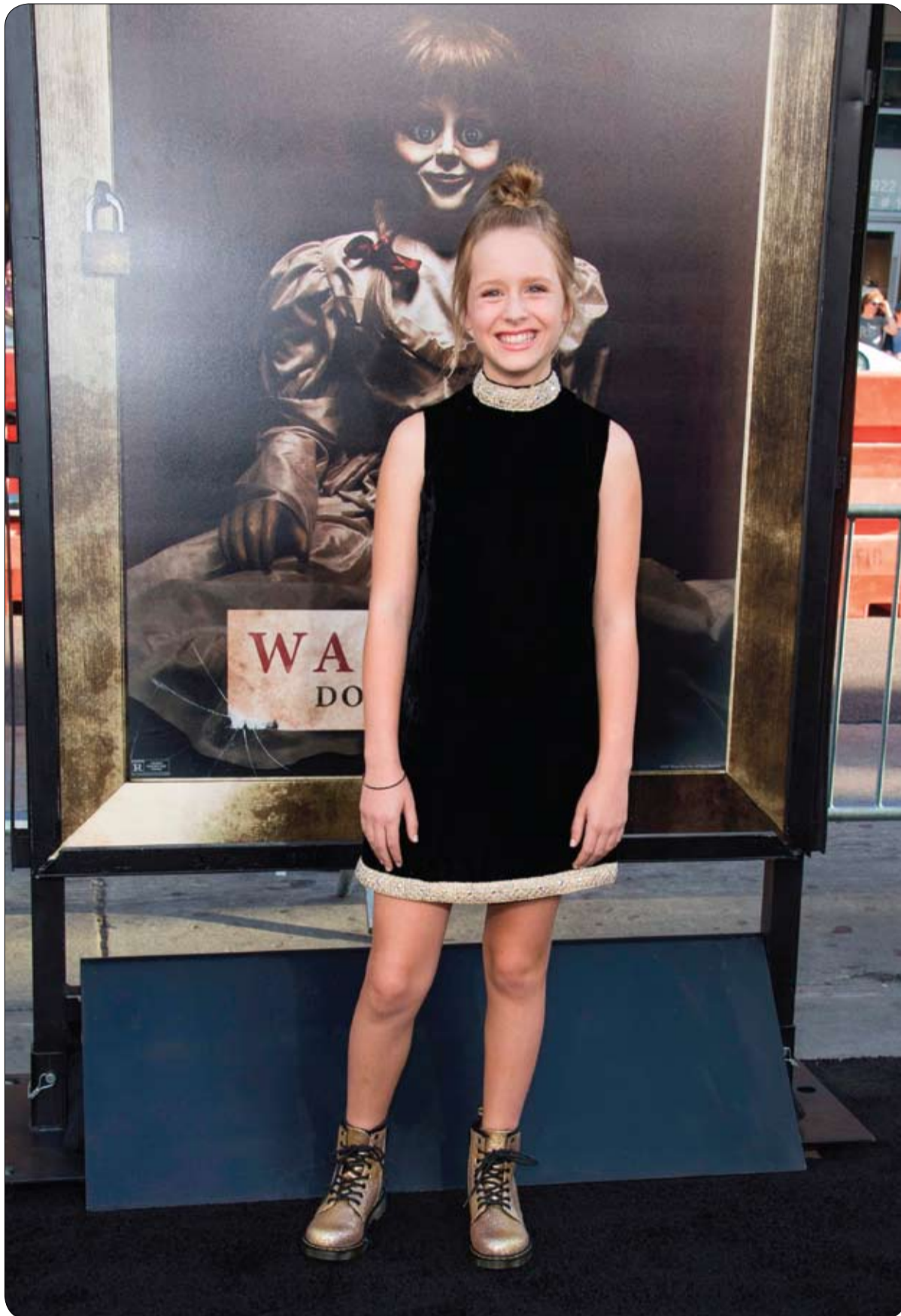
الممثلة لولو ويلسون لدى حضورها العرض الأول لفيلم أنابيل، 'Annabelle: Creation' في هوليوود.

ويؤكد الرجل الستيني منصور حسين هذه وصمة عار على المجلس التقليدي الذي أصدر الحكم.