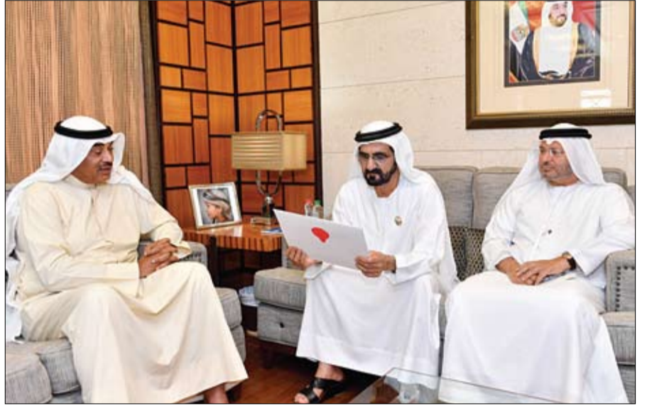
رسالة رئيس الدولة يتسلمها محمد بن راشد من وزير الخارجية الكويتي

•• العين-وام: قدم صاحب السمو الشيخ محمد بن زايد آل نهيان ولي عهد أبوظبي نائب القائد الأعلى للقوات المسلحة واجب العزاء إلى خليفة محمد بن شاهين فطر وأخويه سهيل وسعيد وفي وفاة والدتهم بخيطة خميس سعيد الكتبي وذلك خلال زيارة سموه مساء امس مجلس العزاء بمدينة العين. وأعرب سموه عن خالص تعازيه ومواساته لذوي أسرة الفقيدة.. سائلا المولى عز وجل أن يتغمدهم بواسع رحمته وأن يسكنها فسيح جناته وأن يلهم أهلها وذويها الصبر والسلوان. (صور أخرى ص2)