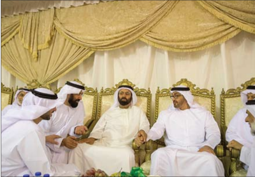
محمد بن زايد خلال تقديمه واجب العزاء لعائلة الفقيدة

الهلل الأحمر يقدم مساعدات إغاثية عاجلة للأسر العوزة بالامكلا •• المكلا-وام: قدمت هيئة الهلال الأحمر الإماراتي امس مساعدات إغاثية عاجلة للأسر العوزة بـ جول الزبيق بمنطقة قوة العشواتي بمديرية المكلا بمحافظة حضرموت في إطار الدعم المتواصل الذي تقدمه دولة الإمارات العربية المتحدة للأشقاء في اليمن. جاء ذلك استجابة من الهيئة للنداءات العاجلة التي أطلقها أهالي تلك المنطقة المحرومة من أسس الخدمات الأساسية حيث توجه فريق ميداني تابع للهيئة لتلمس احتياجاتهم وتم توزيع مساعدات إغاثية على مئات من السكان الذين يعانون من نقص مياه الشرب النقية. (التفاصيل ص10) أبناء اللاجئين السوريين بالمخيم الإماراتي الأردني في مريجيح الفهود يحققون معدلات نجاح مشرفة •• مريجيح الفهود - الأردن-وام: أشاد إداريون ومسؤولون في جامعة الزرقاء الأردنية الخاصة بالمعدلات التراكمية المرتفعة التي حصل عليها أبناء اللاجئين السوريين بالمخيم الإماراتي الأردني في مريجيح الفهود الدارسين فيها. جاء ذلك أثناء زيارة مدير المخيم سعادة مبارك محمد الخبيلي للجامعة حيث اطلع على معدلات الطلبة الذين تتكفل بدراستهم هيئة الهلال الأحمر الإماراتي. (التفاصيل ص2)