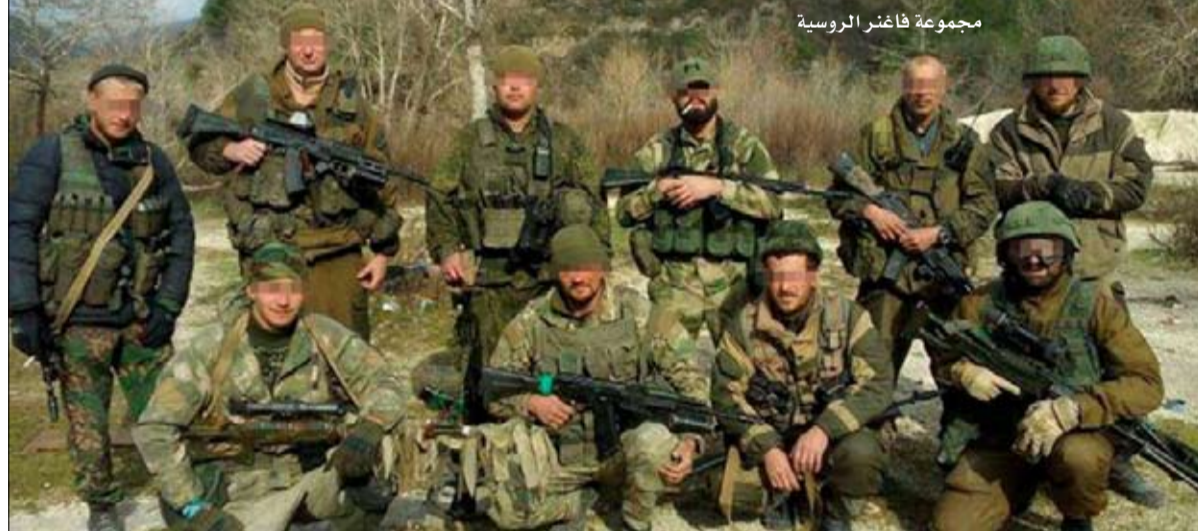
مجموعة فاغنر الروسية

وكما أشار المحلل ميكاه زينكو عام 2016، "في عهد أوباما، كان عدد القتلى من موظفي شركات التعاقد من الباطن العسكرية في العراق وأفغانستان، يفوق عدد القتلى في الجيش الأمريكي المنتشر في تلك البلدان. و"لن تعهد جميع المترشحين الديمقراطيين