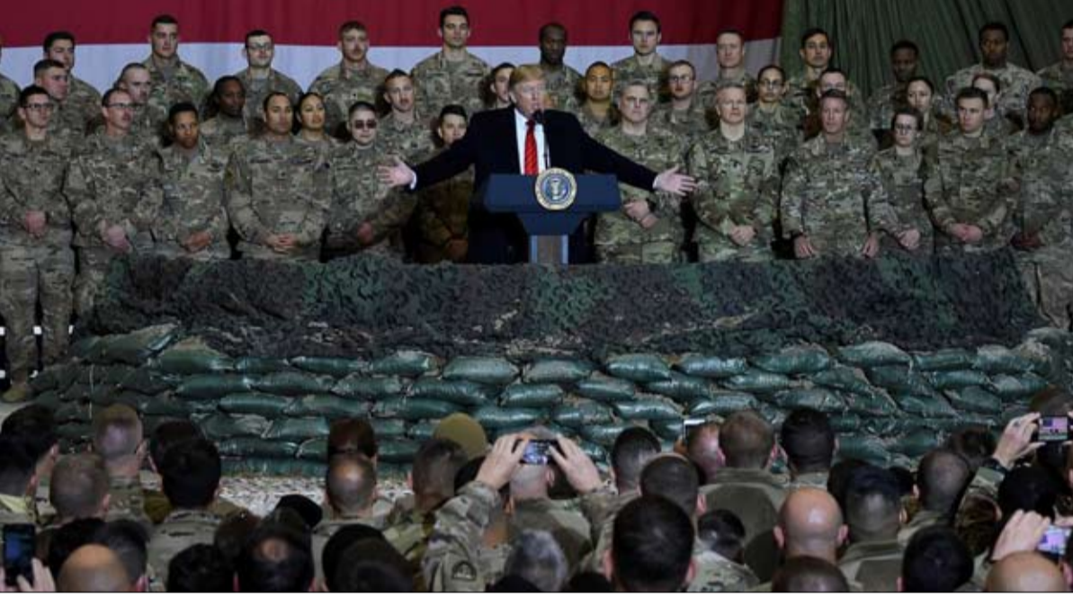
لا يفهم ترامب الفرق بين الجنود والمرتقة