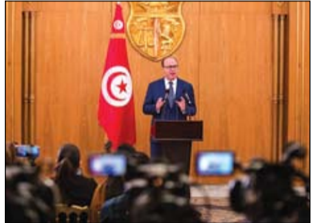
الفخفاخ... تحت ضغط مرتفع

•• بغداد-وكالات: التقى رئيس الوزراء العراقي المكلف محمد علاوي عشرا من ممثلي الاحتجاجات المطالبة التي تشهدها بغداد ومدن جنوبية ذات الغالبية الشيعية، منذ الأول أكتوبر، حسيما نقل أحد الحضور أمس، ويطالب المحتجون بإصلاحات سياسية أبرزها تغيير الطبقة السياسية الحاكمة، كما رفضوا ترشيح علاوي لرئاسة الوزراء كونه مرشحا عن الأحزاب التي يحتجون ضدها منذ أشهر. وقال المحلل الأمني هشام الهاشمي الذي حضر الاجتماعات عقد محمد علاوي منذ بداية الأسبوع، سلسلة اجتماعات مع عشرا الممثلين عن التظاهرات في المحافظات الثماني المشاركة في الاحتجاجات. وتعهد علاوي بإطلاق سراح جميع المتظاهرين المحتجزين بسبب التظاهر، وتعويض عائلات القتلى خلال أعمال عنف مرتبطة بالاحتجاجات، والعمل مع الأمم المتحدة لتنفيذ مطالب المتظاهرين، وفقا لهاشمي.