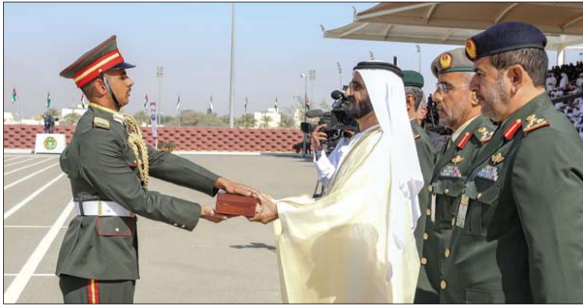
محمد بن راشد خلال تكريمه أحد أوائل الخريجين

حكومة أذربيجان تمنح عبد الله بن زايد ميدالية الذكرى المئوية لتأسيس الخارجية الأذربيجانية •• أبوظبي-وام: منحت حكومة جمهورية أذربيجان سمو الشيخ عبدالله بن زايد آل نهيان وزير الخارجية والتعاون الدولي ميدالية جمهورية أذربيجان للذكرى المئوية لتأسيس وزارة الخارجية الأذربيجانية وذلك تقديراً لجهود سموه في تعزيز وتنمية العلاقات الثنائية بين البلدين. وقد تسلم سموه الميدالية من سعادة ماهر محمد علييف سفير جمهورية أذربيجان لدى الدولة وذلك خلال اللقاء المشترك الذي عقد أمس في ديوان عام الوزارة بأبوظبي. (التفاصيل ص4) تضمنت الغذاء ومواد الإيواء والتدفئة ومعينات الدراسة التهلال الأحمر تواصل تقديم المساعدات الإنسانية للاجئين الروهينجا في بنجلاديش •• دكا-وام: واصلت هيئة التهلال الأحمر الإماراتي، تقديم المساعدات الإنسانية للاجئين الروهينجا في جمهورية بنجلاديش، بناء على توجيهات القيادة الرشيدة، وبمتابعة من سمو الشيخ حمدان بن زايد آل نهيان ممثل الحاكم في منطقة الظفرة رئيس الهيئة وتضمنت توزيع المواد الغذائية المتنوعة، التي استقادت منها في هذه المرحلة، 45 ألف لاجئ في المخيمات المنتشرة في مدينة كوكس بازار وشملت الطرود الغذائية، ومواد الإيواء والتدفئة، والملابس ومواد النظافة والمكملات الغذائية للأطفال، إضافة إلى مستلزمات تعليمية ومعينات دراسية. (التفاصيل ص7)