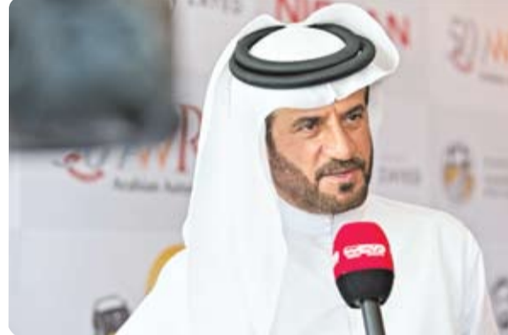
وأى خلال الفترة من 10 - 14 في هذا السياق، قال محمد بن سليم، رئيس منظمة الإمارات

أكد محمد بن سليم أن أول بطولة مينا كأس الأمم للكارتينج والتي تقام خلال عطلة نهاية الأسبوع المقبل تمثل مرحلة مهمة ومثالية لأفضل سائقي الإمارات العربية المتحدة للارتقاء لمستوى آخر. وتعد دولة الإمارات العربية المتحدة من بين 14 دولة معتمدة في البطولة الافتتاحية المدعومة من الاتحاد الدولي للسيارات (فيا)، وتديرها الجمعية العمانية للسيارات وتقام في مسقط سييد