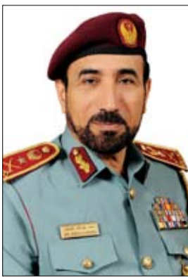
•• أبو ظبي - وام:

متمنياً جهود اللجان وفرق العمل وتقديم الأعمال التي تمت. يذكر أن هذا التمرين هو التمرين الثاني من نوعه الذي تنفذه أجهزة الشرطة والأمن بدول مجلس التعاون تفعيلاً لقرارات أصحاب السمو والمعالي وزراء الداخلية بدول المجلس، حيث نفذ التمرين الأول في اخر عام 2016 في مملكة البحرين الشقيقة لتعزيز التعاون المشترك بدول المجلس وتبادل الخبرات والتطوير المستمر في التعامل الامني مع الاحداث والتحديات المشتركة.