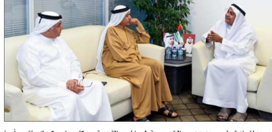
•• دبي - وام:

قدم سمو الشيخ حمدان بن راشد آل مكتوم نائب حاكم دبي وزير المالية راعي هيئة آل مكتوم الخيرية تبرعاً مالياً لجامعة الامارات وذلك في إطار دعم سموه للطالبات المشاركات في دورات برنامج التعددية الثقافية ومهارات القيادة الشتوية والصيفية بكتلة آل مكتوم للتعليم العالي في أسكتلندا. وقام سعادة ميرزا الصايغ مدير مكتب سمو الشيخ حمدان بن راشد آل مكتوم عضو مجلس أمناء هيئة آل مكتوم الخيرية بتسليم التبرع إلى سعادة الدكتور غالب الحضرمي مدير عام جامعة الإمارات بالإذابة وذلك ضمن دعم سموه السنوي للجامعات و دعم المسيرة التعليمية في الدولة. وقال الصايغ إن هذا التبرع يترجم