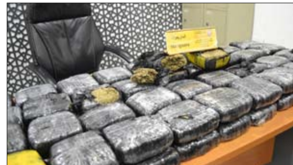
•• أبو ظبي - وام:

أحبطت جمارك أبو ظبي محاولة تهريب 40 كغم من الماريجوانا المخدرة في جمرك مطار أبو ظبي. وأشادت الإدارة العامة للجمارك ابو ظبي بالخبرة والكفاءة التي يمتاز بها مفتشوها، وبدورهم الحيوي في حماية الوطن من كافة المخاطر المحتملة التي قد تسببها التجارة العابرة للحدود في ظل الاستراتيجية التطويرية التي تنتهجها الإدارة والمتمثلة في تكليف المفتشين القدامى ودوي الخبرة بتدريب وتطوير مهارات المفتشين الجدد في الكشف عن المواد المنوعة وقرعارة لفة الجسد وغيرها من التقنيات.