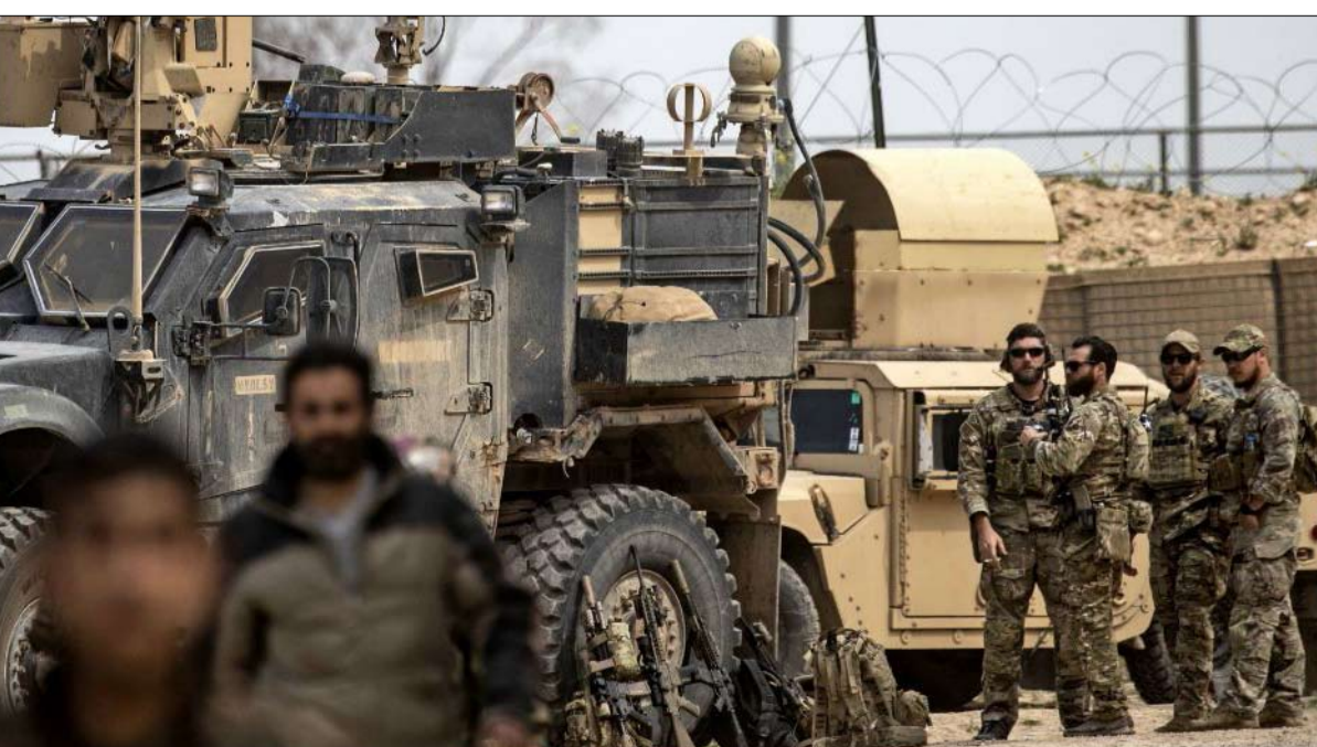
عودة الجيوش نعمة لشركات الخدمات الامنية

يخفي هذا الاستخدام المدى الحقيقي للامتداد العسكري الأمريكي، ويخلق العديد من المخاطر الجديدة