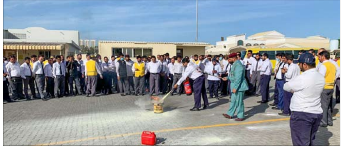
•• عجمان - الفجر

نظمت الإدارة العامة للدفاع المدني بعجمان ورشة عمل توعوية حول مهارات التعامل مع الحريق، ضمن حملة داركم أمانة والواردة ضمن الخطة التوعوية للدفاع المدني 2020، واستهدفت الورشة سائقي الحافلات المدرسية والمشرفات البالغ عددهم 350. وتضمن البرنامج التوعوي للورشة أحدث معارف الإطفاء والإرشادات التثقيفية لتشمل التعريف بأنواع الحرائق وأسبابها الرئيسية، وفنون التعامل