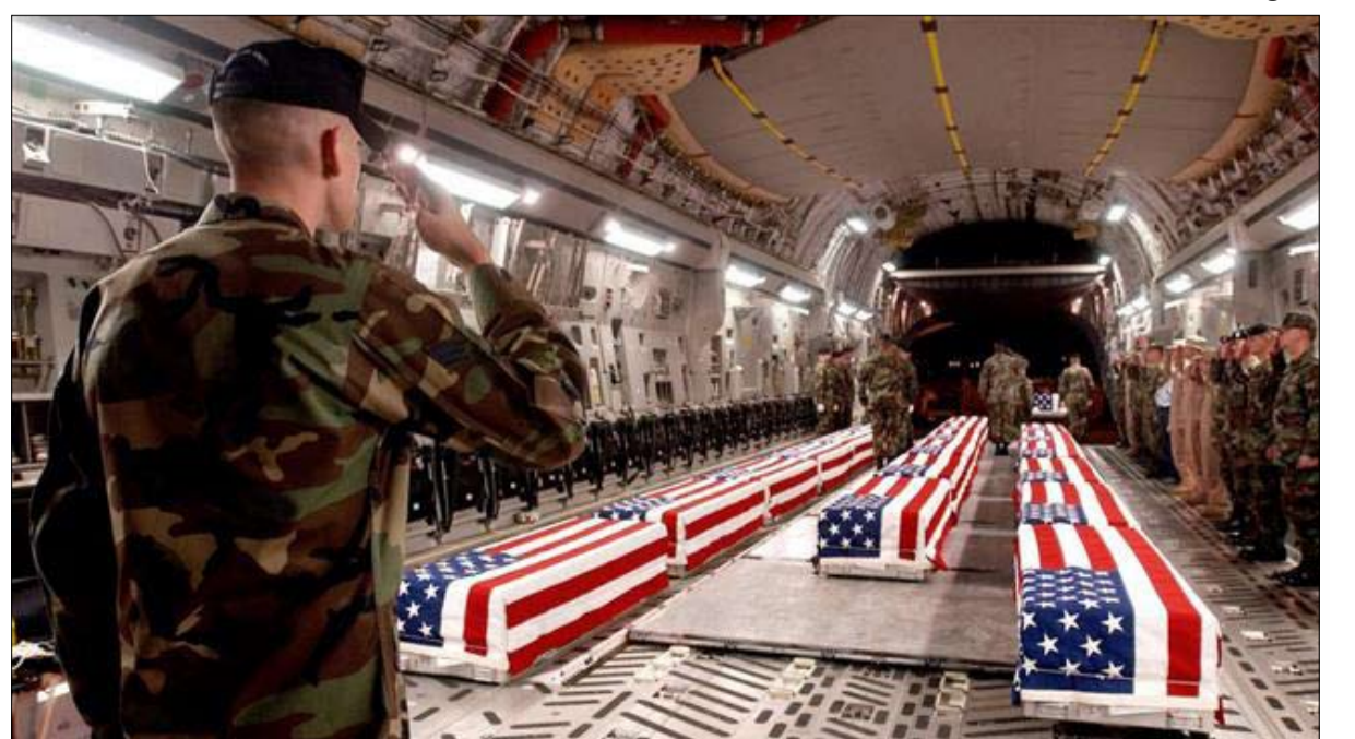
توابيت المارينز تزعج أكثر من موت المرتقة