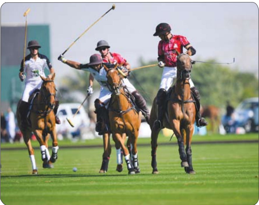
الختم الفضي من خلال خطأ في ليصيدي لها نجم فريق غنوتوت كاكو بعد فوزه على الحيتور و بنتيجة 11 هدف مقابل 10 أهداف . ويخطف فورا صعبا ويتأهل للنهائي