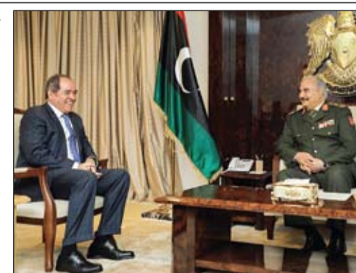
حفتر خلال لقائه بوقادم في بنغازي

•• موسكو-وام: يعمل الخبراء الروس في مؤسسة الأبحاث الواعدة على تصنيع وانتاج صاروخ لا مثيل له في العالم أطلق عليه اسم كريلو-إس. ويتمكن صاروخ كريلو-إس في العودة إلى الأرض بعد إطلاقه ليستخدم مرة ثانية وثالثة ورابعة حيث يتميز بسرعه الهائلة والتي ستبلغ 6 ماخ أي 6 أمثال سرعة الصوت تقريبا وطوله 7 أمتار وقطره 0.8 متر.