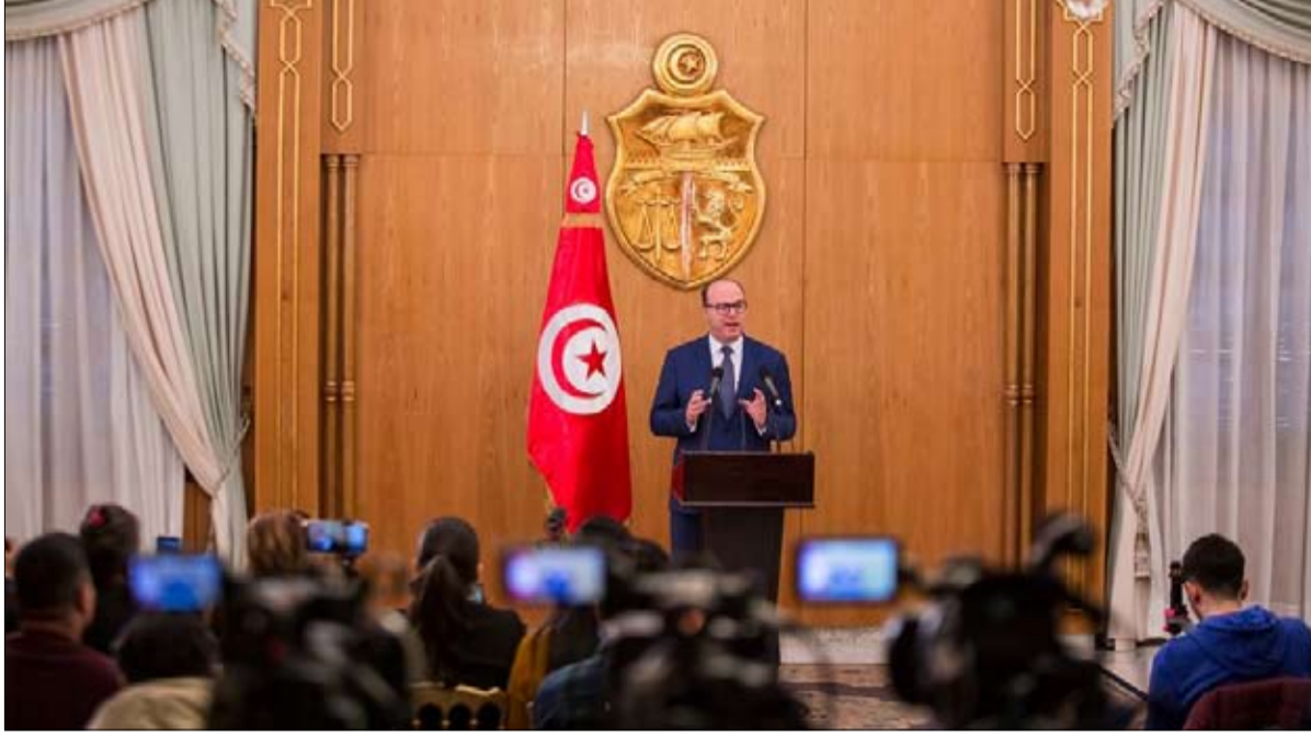
الفخفاخ تحت ضغط مرتفع

لم يشهد مناخ المشاورات الحكومية انفراجا، بل ان مجموعة من التصريحات في الساعات الأخيرة، تؤكد أن الوضع يتجه إلى مزيد التعقيد، وأن عملية لي الذراع الجارية تزداد قسوة، وأن رئيس الحكومة المكلف إلياس الفخفاخ على بعد خطوة من