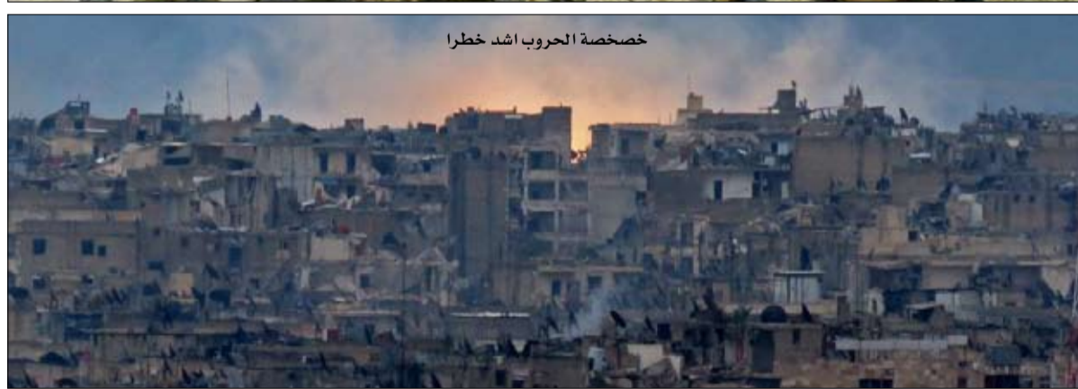
خصخصة الحروب اشد خطراً

الولايات المتحدة ليست الدولة الوحيدة التي تعتمد بشكل متزايد على المرتقة، فروسيا تستخدم ذات البرهجية