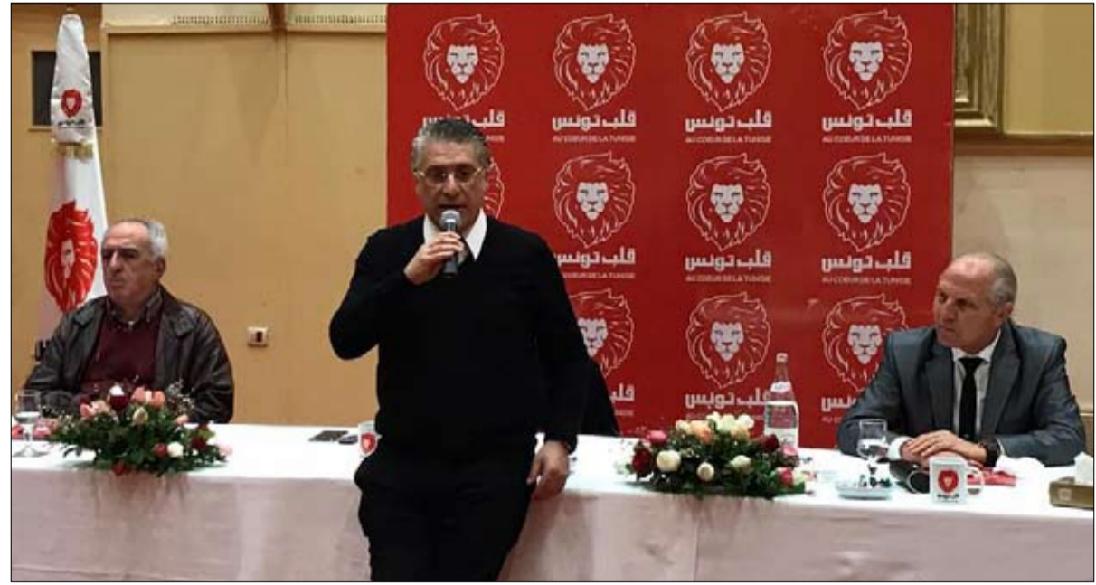
قلب تونس... جزء من المشكلة أم من الحل؟