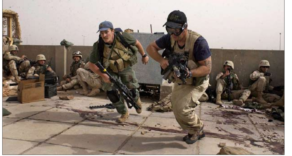
بلاك ووتر شركة الخدمات الامنية

حرب غير رسمية مثل الصومال، فإن الوضع أكثر ضبابية.