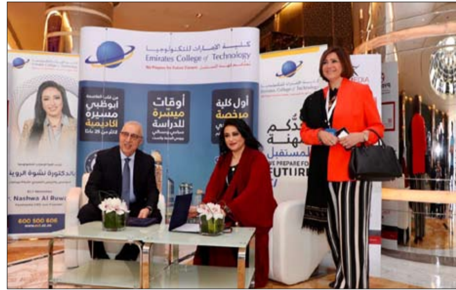
•• أبو ظبي - الفجر:

مجال تدريب الطلاب والطالبات واكتسابهم المهارات والخبرات العملية في مجال الإعلام والإنتاج الإعلامي، وإعادة هم للتلاحق بسوق العمل بكل كفاءة واقتدار. راق خال من التميز والعنصرية والكراهية. واختتم قائلاً: ونحن على يقين بأن توقيع هذه الاتفاقية الهامة سوف يعود بنتائج إيجابية ملحوظة في