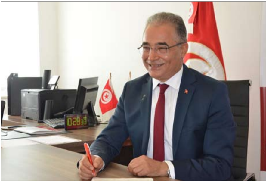
مرزوق: على الفخفاخ تعديل الأوتار