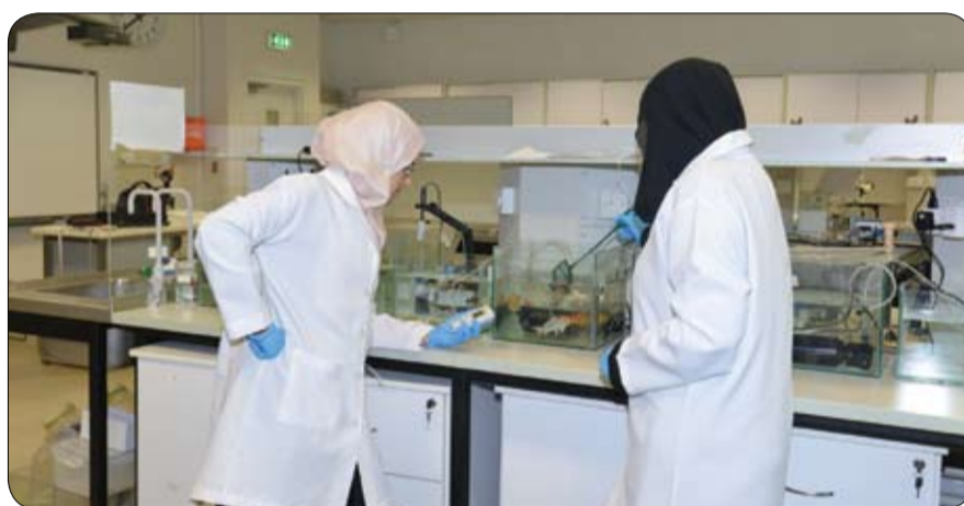
باشراف ديفيد تومسون