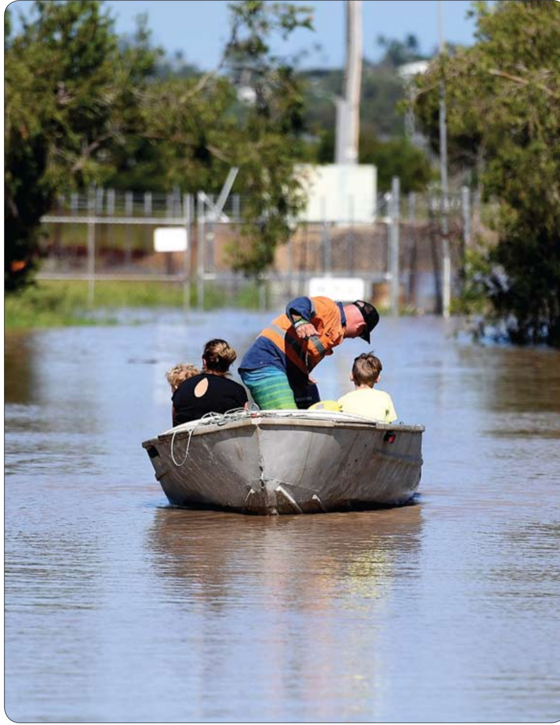
عائلة تستخدم قارباً للوصول إلى منزلهم حيث غمرت الشوارع مياه الفيضانات الناتجة عن

ولذات السبب يجب وضع الصلصة في الثلاجة بعد الفتح، بالإضافة للخردل للحفاظ عليه بشكل أطول، والمربى التي يمكن أن تظهر عليها علامات العفن في حال إبقائها بعيداً عن الثلاجة، فيما يجب إبقاء الزبدة، في درجة حرارة الغرفة لمدة أقصاها يوم واحد، وفي حال استمرت لفترة طويلة خارج الثلاجة تصبح نتنة، لذا ينصح بإخراجها قبل ساعة من استخدامها للحصول على القوام الناعم.