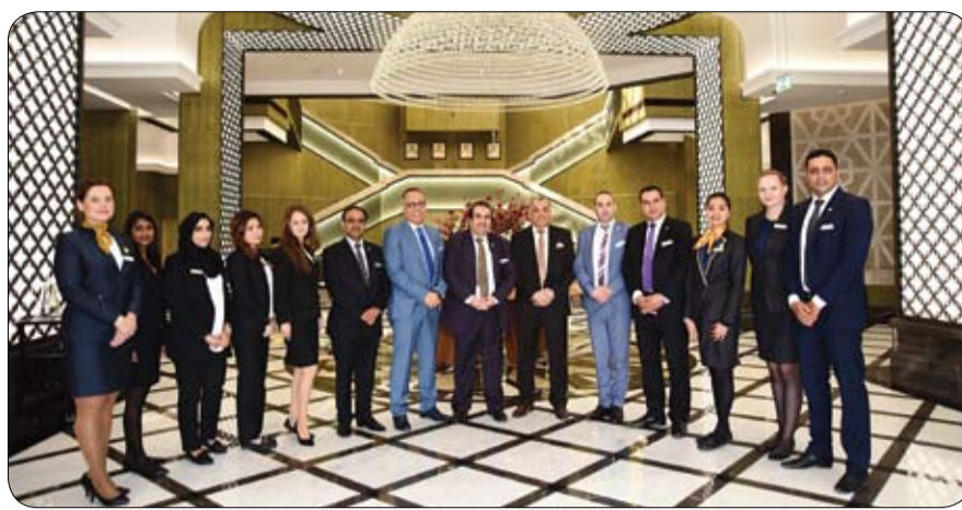
تنشيط السياحة في مدينة العين