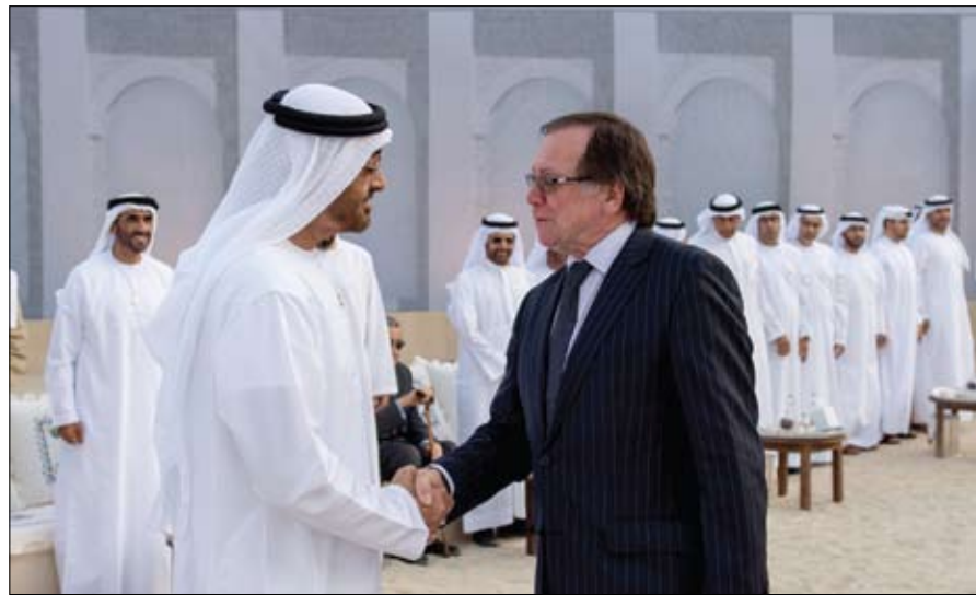
محمد بن زايد خلال استقباله وزير خارجية نيوزيلندا

يومية - سياسية - مستقلة www.alfajrnews.ae