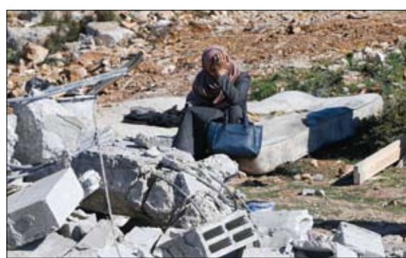
امرأة فلسطينية تبكي لهدم سلطات الاحتلال منزلها في الخليل

وضع وزراء الخارجية الأوروبيون أمس في بروكسل أسس أول مقر عسكري عام للاتحاد الأوروبي على أن يجمع اعتباراً من الربيع قيادات عدد من المهمات العسكرية الخارجية غير القتالية.