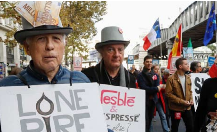
العولمة بيت الداء حسب الوزير الفرنسي السابق

•• كاتب وصحفي من أحدث كتبه، الانتصار المسموم