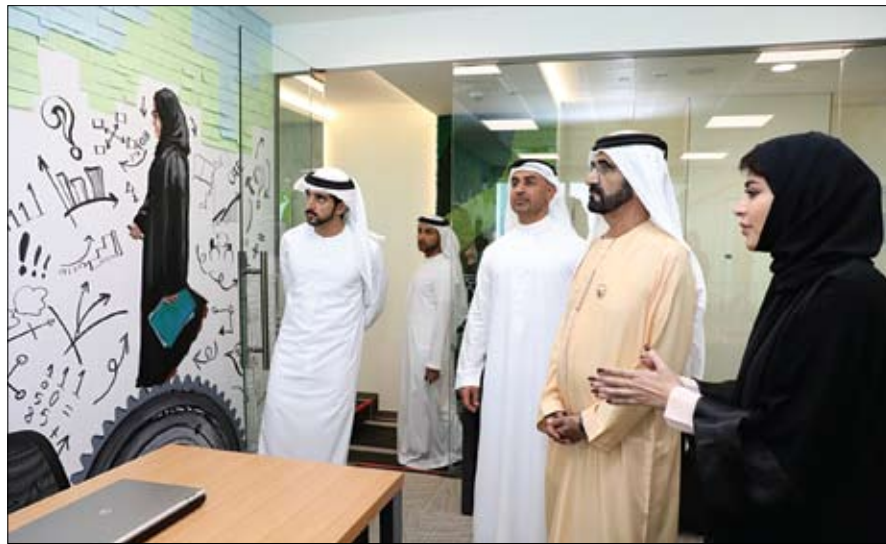
محمد بن راشد خلال زيارته المقر الجديد للهيئة الاتحادية للتنافسية والإحصاء في دبي

زايد آل نهيان ولي عهد أبوظبي نائب القائد الأعلى للقوات المسلحة إن منظومة التدريب والتأهيل في القوات المسلحة هي ركيزة أساسية في جاهزية قواتنا الباسلة لمواجهة كافة التحديات المحتملة. جاء ذلك خلال زيارة سموه لمعهد تدريب حرس الرئاسة في مسكر محوي نيوزيلندا . حيث افتتح سموه جناح النيران المشتركة في مدرسة التدريب المتقدم.