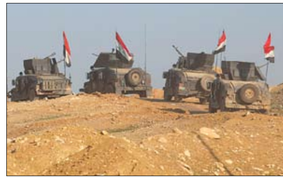
الآليات العسكرية العراقية تتوغل في غرب الموصل