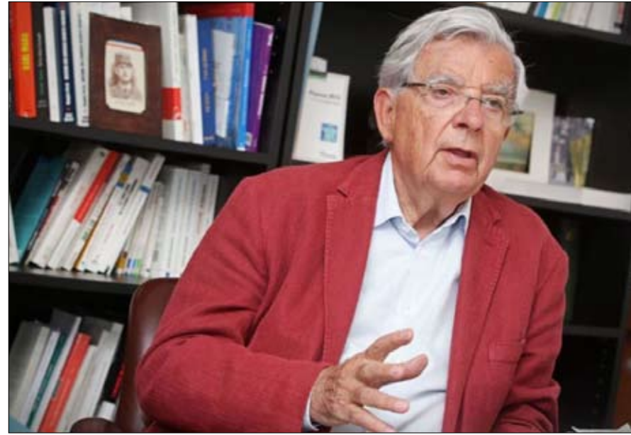
جان بيير شوفينمان

•• الفجر - اريك دوبان ترجمة خيرة الشيباني غالباً ما أعطى مسار الأحداث الحق لجان بيير شوفينمان، فقد حذر من الفوضى التي ستنتج عن التدخل الغربي في العراق .. وتوقع أن اليورو من شأنه أن يقصد الصناعة الفرنسية وسيوسع اختلالات داخل أوروبا، واستبق أيضاً، منذ أمد بعيد، العودة إلى قيم الجمهورية في فرنسا التي بات الجميع يقتسل بها اليوم. لهذا السبب، هناك أكثر من فائدة في قراءة أثره الأخير. في ما يقارب 500 صفحة، لم يكتفي شوفينمان فقط بتقديم ملخص للتحليلات التي سبق أن وضعها، مدعومة بدراسات تاريخية وجيوسياسية مثيرة للاعجاب، فالوزير السابق، 77 عاماً، يقترح أساساً شكلاً من الوصية السياسية، مصحوبة بسلسلة من التحذيرات التي يجب أن تُسمع.