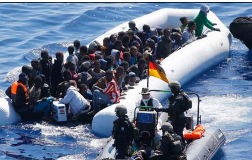
تدفق المهاجرين سيستمر