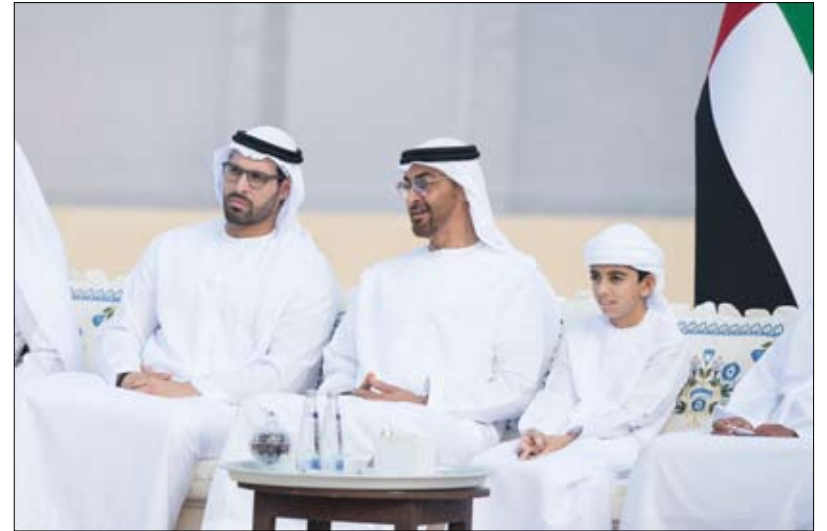
شهد إطلاق مشروع تطوير قصر الحصن