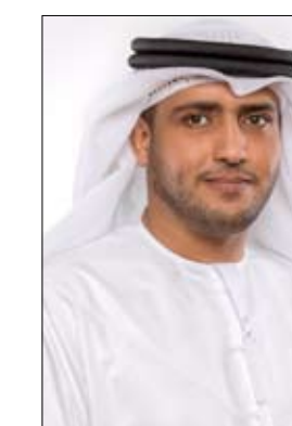
•• عجمان - الضجر

المعرض الذي يشهده معرض التوظيف عاماً بعد عام، مثنياً على جهود الجهات المشاركة في تنظيم هذا الحدث الذي يحظى باهتمام مؤسسات القطاعين العام والخاص والشباب الإماراتي على مستوى الدولة والإمارة، وعلى دعمهم الواضح لجهود التوظيف في الدولة. وأكد مدير المعرض أنه تماشياً مع إعلان صاحب السمو الشيخ خليفة بن زايد آل نهيان رئيس الدولة عام 2017م الخبير وبناء على توجيهات صاحب السمو الشيخ محمد بن راشد آل مكتوم نائب رئيس الدولة رئيس مجلس الوزراء حاكم دبي بإلءاء بتنفيذ ووضع إطار عمل شامل لتفعيل عام الخير وتحديد المستهدفات وصياغة المبادرات الاتحادية والمحلية لترجمته إلى واقع ملموس، فإننا خصصنا مساحات للجهات التوعوية في الدولة للمشاركة في