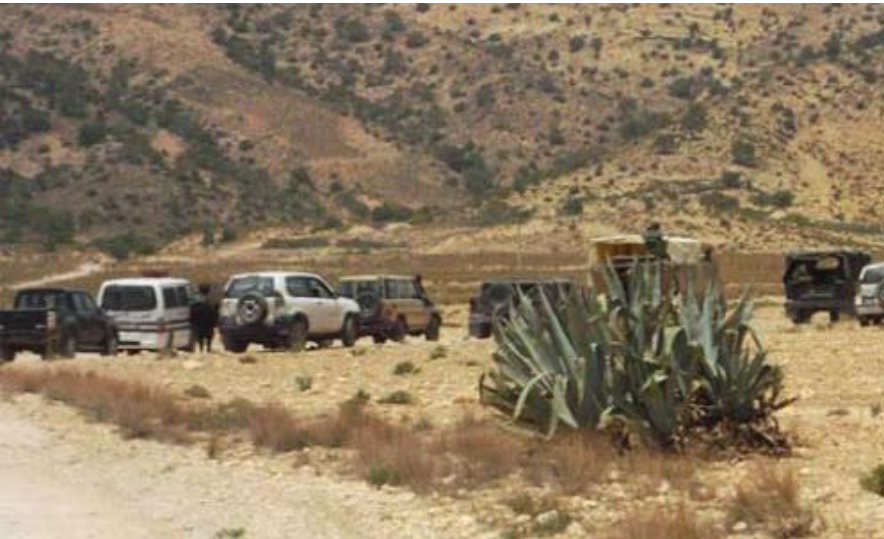
مكافحة الارهاب مستمرة