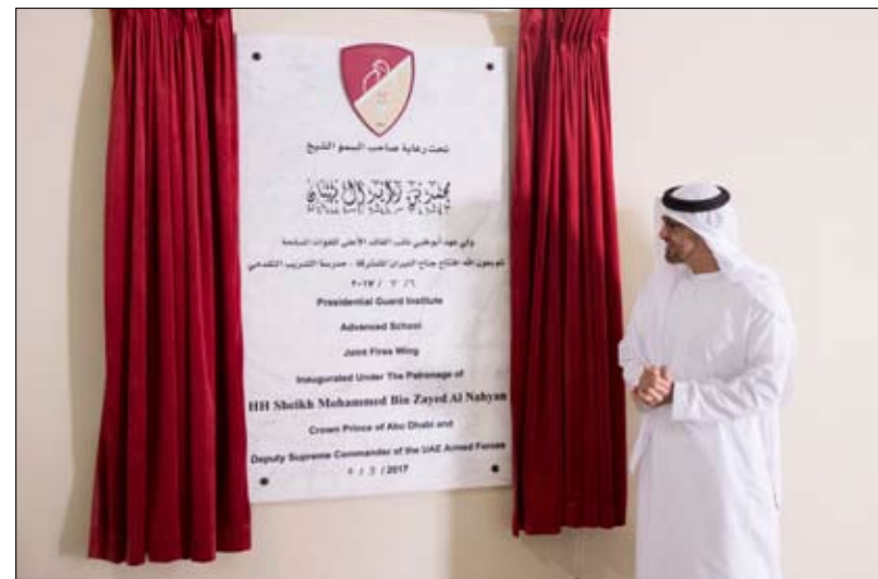
زار مركز تدريب حرس الرئاسة