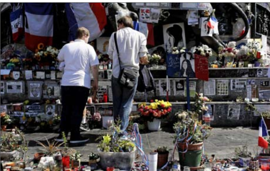
الارهاب الحل الامني وحده لا يكفي