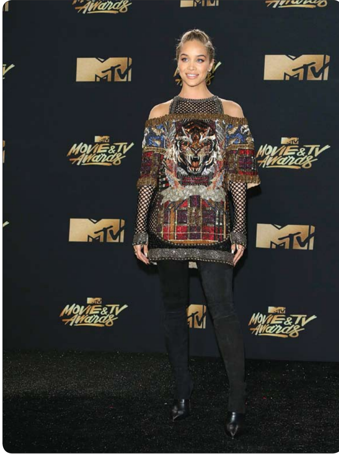
الممثلة ياسمين ساندرز لدى وصولها لحضور جوائز الفيليم والتلفزيون 2017 في لوس أنجلوس بكاليفورنيا.

المعدة المنتفخة والشعور بالامتلاء وعدم الراحة من العلامات غير الصحية لانتفاخ المعدة، وهناك العديد من الأسباب التي تؤدي إلى هذه المشكلة، لذا قدم تقرير نشره الموقع الهندي "بولد سكاى"، 6 حيل تساعد في التغلب على مشكلة انتفاخ المعدة وتشمل الآتي: 1. التركيز على طعامك أثناء الأكل.. لأن من الظواهر الشائعة في الآونة الأخيرة مشاهدة التلفيزيون أثناء تناول وجبات الطعام، ما ينتج عنها ابتلاع الطعام دون مضغه بشكل سليم، فهذا يسبب انتفاخ المعدة فينتفخ التركيز على تناول الطعام. 2. مضغ الطعام بشكل صحيح.. فعند تناول الطعام يجب المضغ بشكل سليم، حتى لا يسبب الضغط والتوتر على الأمعاء، وهذا يساعد في الوقاية من انتفاخ المعدة. 3. تناول قضمات صغيرة من الطعام.. عند تناول قضمات كبيرة تتعرض لابتلاع نصف الطعام في فمك دون مضغه بشكل صحيح، لذا ينصح دائما تناول الطعام على قضمات صغيرة فهذا يساعد في الوقاية من انتفاخ المعدة. 4. تجنب تناول الطعام الساخن للغاية.. فعند تناول الطعام الساخن للغاية لا يمكن مضغه بشكل سليم وهذا واحد من العوامل الرئيسية التي تسبب الانتفاخ في المعدة. 5. إضافة الفاكهة إلى نظامك الغذائي.. لأنها غنية بالألياف وتساعد في تحسين عملية الهضم، وتناول فاكهة كالبرتقال والتفاح أو حسب ما يوجد في الموسم، فإنها تساعد على منع انتفاخ المعدة. 6. تجنب تناول الأطعمة المصنعة.. لأنها تحتوي على الكثير من المواد الحافظة والملح الذي يعيق عملية الهضم الصحيح، وبالتالي يسبب الانتفاخ.