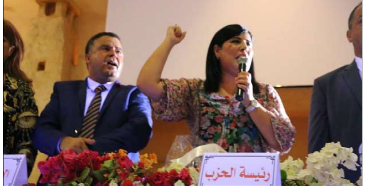
الحزب الدستوري الحر في تحركات احتجاجية