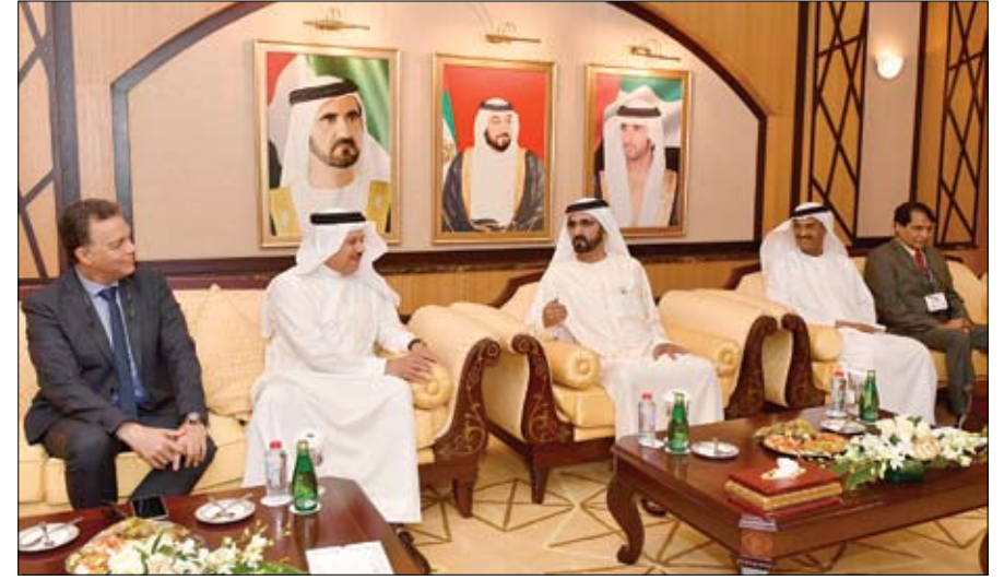
محمد بن راشد خلال استقباله عدد من وزراء النقل والمواصلات المشاركين في مؤتمر الشرق الاوسط للسكك الحديدية

بحث مع هولاند هاتفا العلاقات ونتائج مؤتمر حماية التراث الثقافي المهدد بالخطر محمد بن زايد يبحث مع وزير خارجية سنغافورة تعزيز التعاون الثنائي أبوظبي-وام: التعاون الاستراتيجي بين دولة الامارات العربية المتحدة وجمهورية فرنسا في مختلف المجالات. من جهة اخرى استقبل صاحب السمو الشيخ محمد بن زايد آل نهيان ولي عهد أبوظبي نائب القائد الأعلى للقوات المسلحة أمس في مركز أبوظبي الوطني للمعارض أدنيك .. معالي الدكتور فييان بالاكراشان وزير خارجية سنغافورة. (التفاصيل ص4) تلقى صاحب السمو الشيخ محمد بن زايد آل نهيان ولي عهد أبوظبي نائب القائد الأعلى للقوات المسلحة اتصالا هاتفيا من فرانسوا هولاند رئيس جمهورية فرنسا. تم خلال الاتصال بحث تعزيز علاقات الصداقة