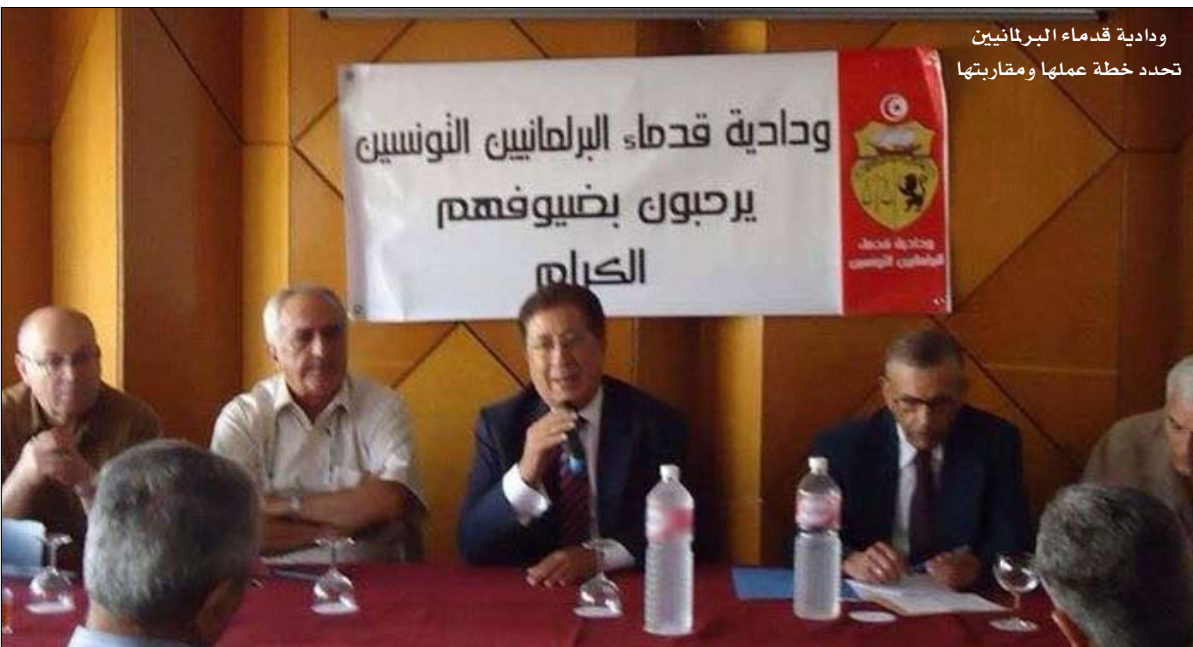
ودادية قدماء البرلمانيين تحدد خطة عملها ومقاربتها

وقررت الخلية القيام بحملة واسعة وذلك لدى مختلف العائلات السياسية بغية ترميز مشروع قانون المصالحة في اقرب وقت، بما يكفل إحداث مصالحة حقيقية ينتفع بها المسؤولين اللذين قاموا بتنفيذ تعليمات رئاسية دون أن ينجوا لأنفسهم أي فائدة، وأوصى الحاضرون باتباع