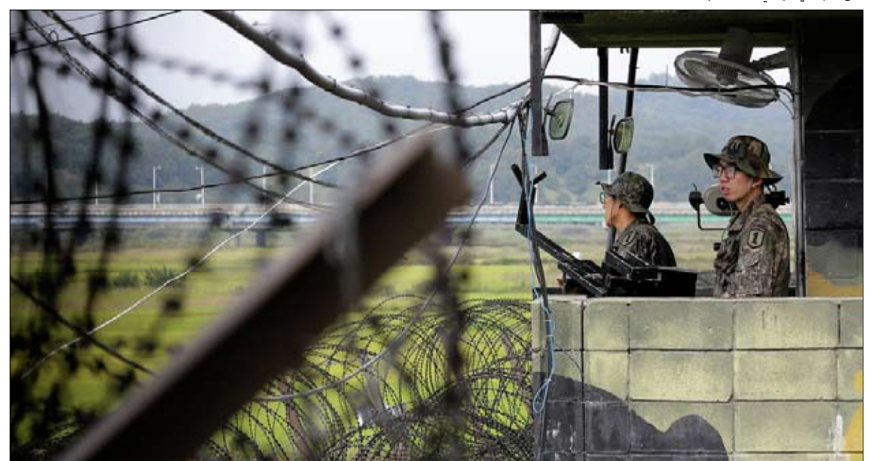
اليد على الزناد جنوبا وشمالا