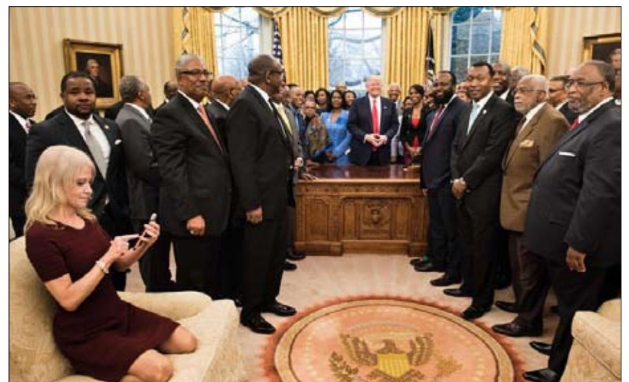
مصطلح الوقائع البديلة من صنع هذه الحستا