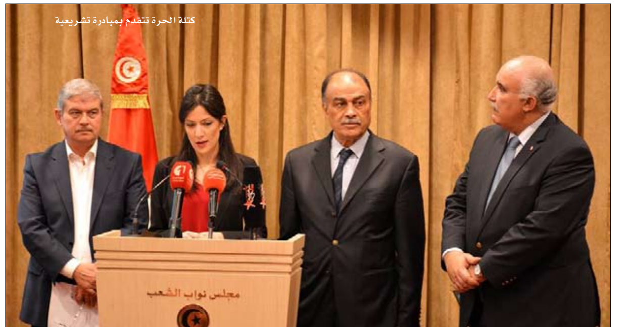
كتلة الحرة تتقدم بمبادرة تشريعية