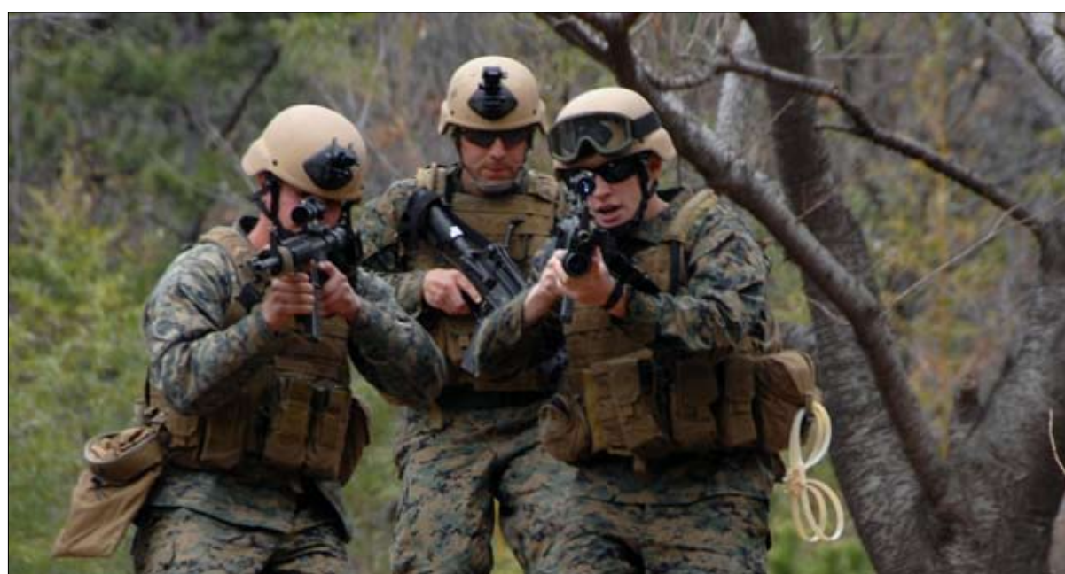
المناورات المشتركة استقرت بيونغ يانغ

الصواريخ التي أطلقت الاثنين، كانت من موقع قريب من سوهاي، وهي قاعدة لإطلاق