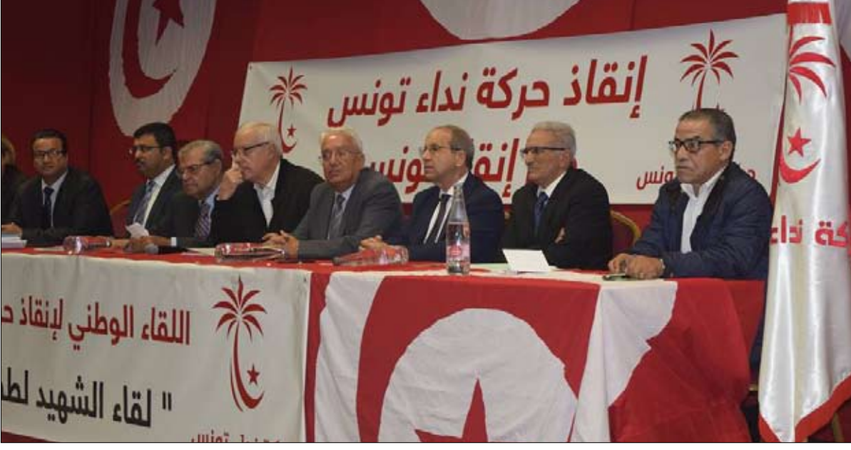
الهيئة التسييرية للنداء تطالب بتفعيل المبادرة الرئاسية للمصالحة