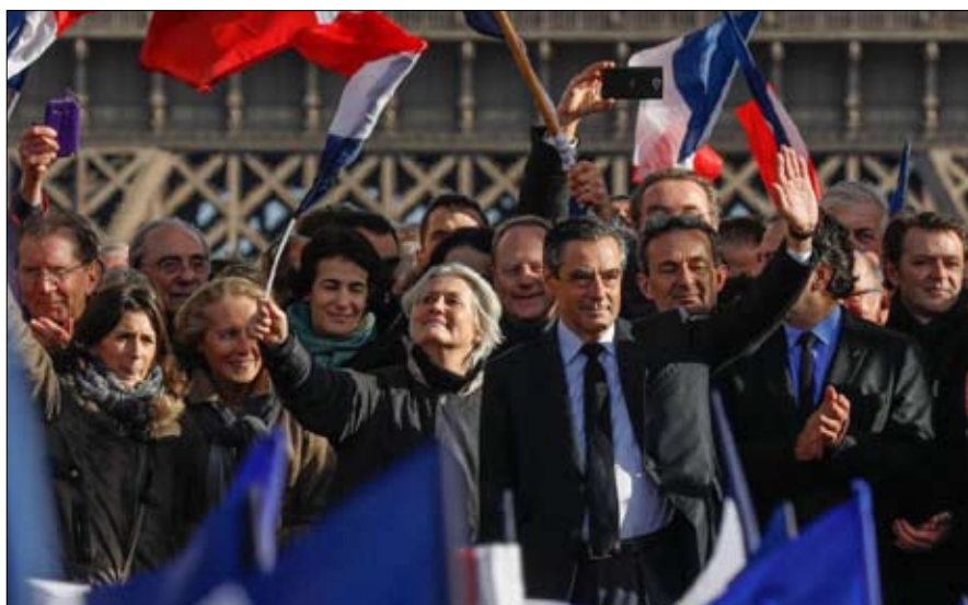
فيون وتجمع التروكادير