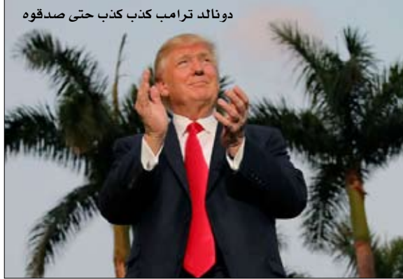
دونالد ترامب كذب كذب حتى صدقوه

قالت المنظمة الدولية للهجرة امس الثلاثاء إن معارك بين عصابات تهريب بشر متنافسة في ساحل ليبيا المطل على البحر المتوسط أسفرت عن مقتل 22 شخصا. وقال المتحدث باسم المنظمة جويل ميلمان إنه يعتقد أن القتلى مهاجرون وليسا مهربين لأنهم من منطقة أفريقيا جنوب الصحراء. وأضاف خلال مؤتمر صحفي نقلا عن معلومات من زملاء في ليبيا أن أكثر من مئة شخص أصيبوا. وتأتي الوفيات الأحدث إلى جانب أكثر من 140 جثة عثر عليها على الشواطئ الليبية حتى الآن هذا العام فضلا عن 477 حالة وفاة في البحر في الطريق من ليبيا. وقال ميلمان إنه حتى الآن هذا العام وصل 15760 مهاجرا إلى إيطاليا بالمقارنة مع 9101 في الفترة ذاتها من 2016 بينما جرى إنقاذ قرابة ثلاثة آلاف مهاجر في البحر وإعادتهم إلى ليبيا. وزاد عدد المهاجرين الذين ينطلقون إلى إيطاليا في قارب من أفريقيا بواقع أكثر من 50 في المئة حتى الآن هذا العام بعد أن وصل نصف مليون شخص خلال الأعوام الثلاثة الماضية. وتعد إيطاليا بإعادة المزيد من المهاجرين الذين لا تطبق عليهم شروط اللجوء إلى مواطنهم بإرادتهم أو بالقوة. وقال ميلمان هذا يعطي دفعة لجمع أنواع الأنشطة في قطاع التهريب ويبدو أن هذا النشاط وصل إلى حد تبادل إطلاق النار بشكل عنيف الأمر الذي خلف 22 قتيلًا خلال الوبين الماضيين. وذكر أيضا أن 62 سوريا ظهروا بين المهاجرين الذين يصلون إيطاليا. ويتوجه اللاجئون السوريون إلى أوروبا بشكل أساسي عن طريق تركيا واليونان وهو مسار ألقق بشكل فملي العام الماضي بموجب اتفاق بين الاتحاد الأوروبي وتركيا. وقطع أقل من 200 سوري الرحلة من ليبيا إلى إيطاليا العام الماضي.