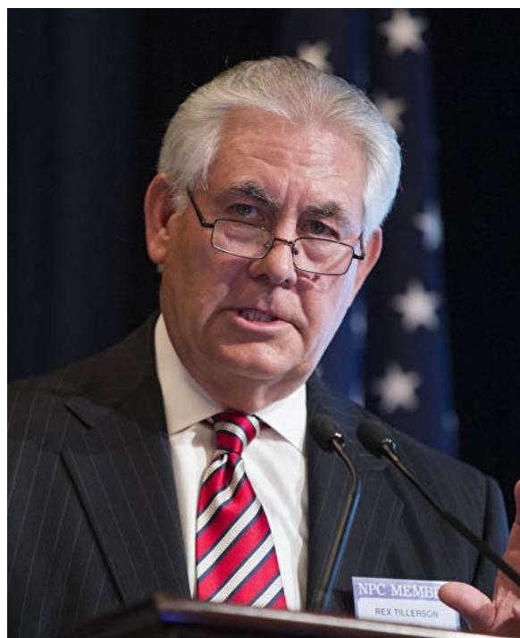
وزير الخارجية الأمريكي زيارة ساخنة في الافاق

تأمل في انتزاع بعض التنازلات. في عهد أوباما، استبعدت الولايات المتحدة التفاوض مع الشمال ما لم يتم ببادرة ملموسة نحو نزع السلاح النووي، على أمل أن تثير التوترات الداخلية في هذا البلد المعزول التغيير. ولكن بالنسبة للبعض، هذه السياسة المسماة الصبر الاستراتيجي، سمحت بدلا من ذلك لبيونغ يانغ بالضي قدماء نحو برنامجها النووي.