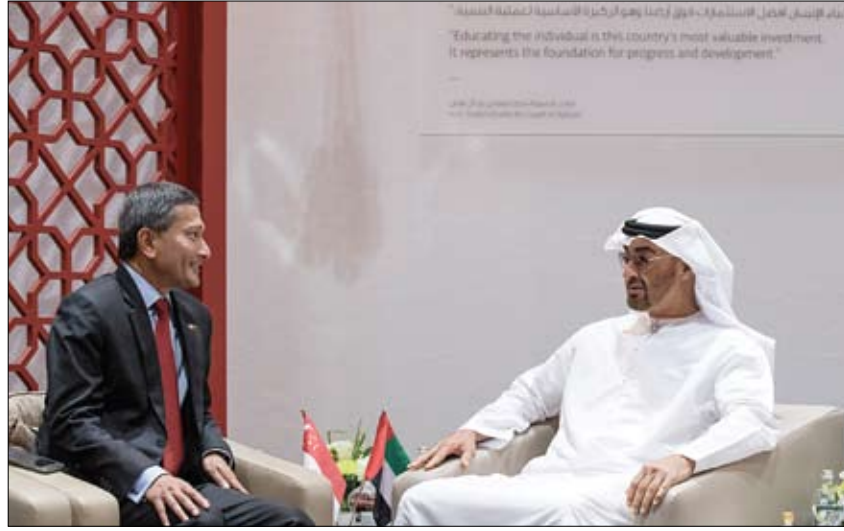
محمد بن زايد خلال استقباله وزير خارجية سنغافورة (وام)

بحث مع هولاند هاتفا العلاقات ونتائج مؤتمر حماية التراث الثقافي المهدد بالخطر محمد بن زايد يبحث مع وزير خارجية سنغافورة تعزيز التعاون الثنائي أبوظبي-وام: التعاون الاستراتيجي بين دولة الامارات العربية المتحدة وجمهورية فرنسا في مختلف المجالات. من جهة اخرى استقبل صاحب السمو الشيخ محمد بن زايد آل نهيان ولي عهد أبوظبي نائب القائد الأعلى للقوات المسلحة أمس في مركز أبوظبي الوطني للمعارض أدنيك .. معالي الدكتور فييان بالاكراشان وزير خارجية سنغافورة. (التفاصيل ص4) تلقى صاحب السمو الشيخ محمد بن زايد آل نهيان ولي عهد أبوظبي نائب القائد الأعلى للقوات المسلحة اتصالا هاتفيا من فرانسوا هولاند رئيس جمهورية فرنسا. تم خلال الاتصال بحث تعزيز علاقات الصداقة