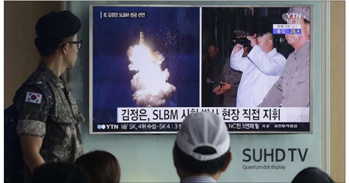
استمرار التجارب الكورية الشمالية رغم العقوبات