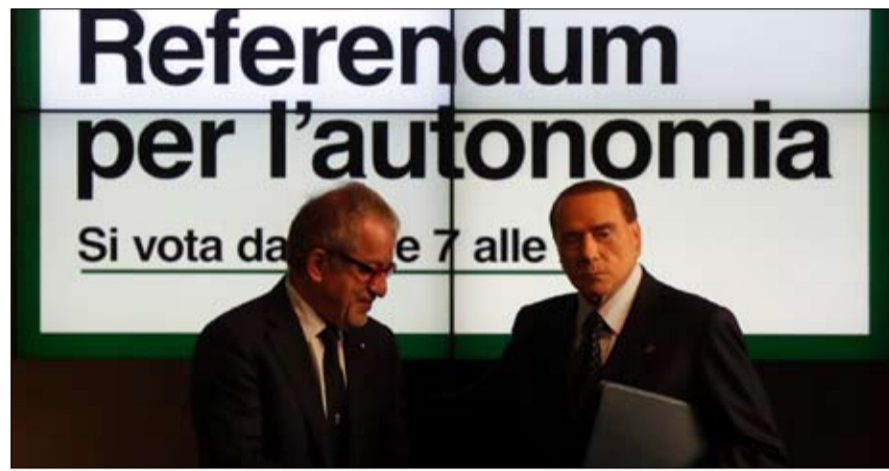
سيلفيو بيرلسكوني يدعم الفكرة