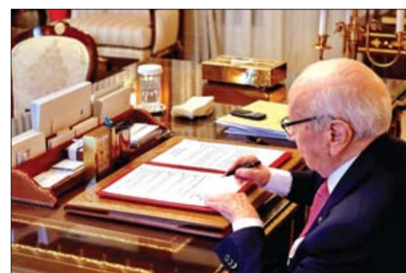
السبسي يتوقيع يعلق القوس

اعتقل الإنقلابيون الحوثيون، في صنعاء، 13 مسلحاً من عناصر نجل شقيق المخلو علي عبدالله صالح، حليف الحوثيين في الانقلاب على الحكومة الشرعية، في خضم خلافات سياسية تعصف بالطرفين. وأفادت مصادر صحافية أن العاصمة صنعاء تشهد توتراً عسكرياً كبيراً بين طرفي الانقلاب، انتشرت على إثره قوات تابعة للرئيس المخلو علي عبد الله صالح وميليشيات الحوثي في ميدان السبعين ومناطق متفرقة. ويأتي هذا التوتر بعد انباء تقيد بأن الحوثيين اعتقلوا حراس منزل نجل صالح في صنعاء، ويتهمون نجل شقيقه بالتنطيط لاعتقال القيادي الحوثي صالح الصامد.