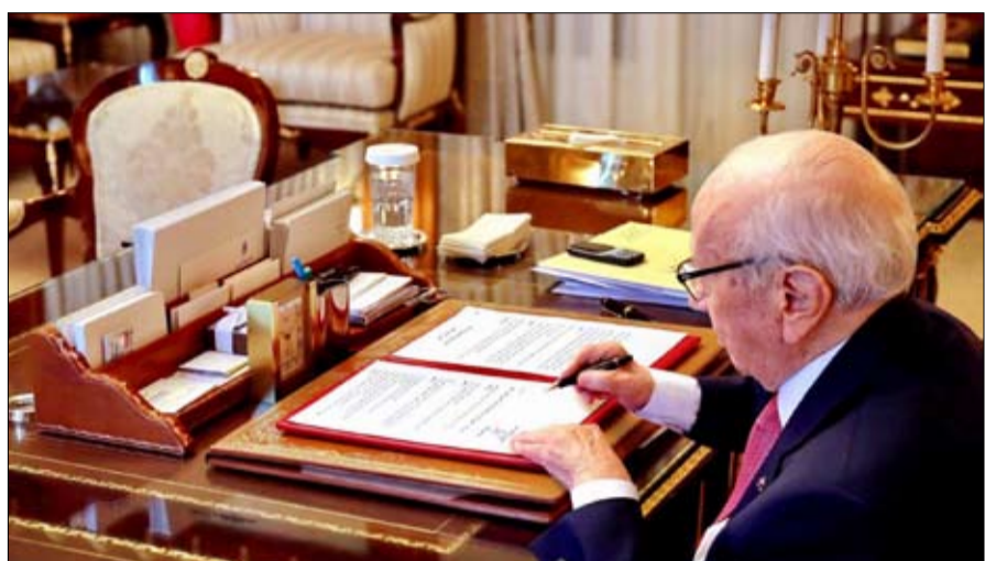
السبسي بتوقيعه يغلق القوس

التي صادق عليه مجلس نواب الشعب يوم الأربعاء 13 سبتمبر الماضي، يهدف إلى تهيئة مناخ ملائم يشجع على تحرير روح المبادرة في الادارة والنهوض بالاقتصاد الوطني وتعزيز الثقة في مؤسسات الدولة.