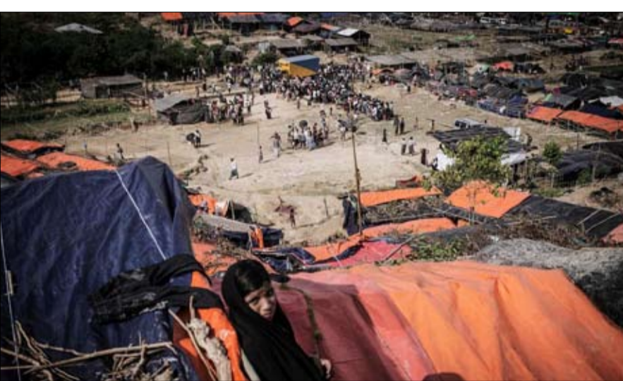
بنغلاديش مخيمات في بلد يعاني اصلا

للحكومة، ولكن تناسى الجميع أن أونغ سان سو كي لا تزال بعيدة عن النجاح في افتكاك رافعات السلطة الحقيقية من أيدي الجيش، كما تم أيضا النظر إلى افتتاح بورما على أنه فرصة اقتصادية لا يجب تفويتها من أجل مصير اقلية تخلى عنها الجميع. وحتى وان لم تقل سيدة رانجون كلمتها الأخيرة، فإن الانتقال البورمي في خطر، فإن جانب خطر آخر، يتمثل في ان مأساة الروهينجا تقدم تربة خصبة جديدة للجهادية الدولية.