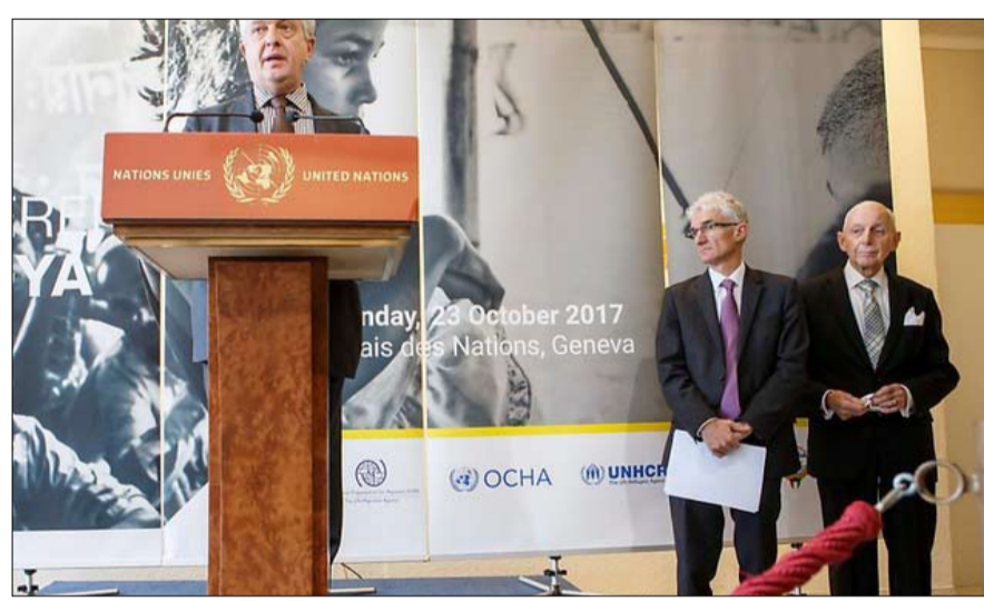
الامم المتحدة تكتفي بالتبرعات

المتحدة، منذ فترة طويلة، أكثر أقلية مضطهدة في العالم، محرومون من الجنسية، ولا حق لهم في التعليم والصحة، وهدف لعمليات ابتزاز متكررة من جانب الجيش البورمي والبوذيين