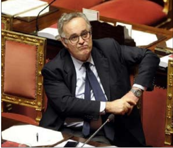
جيانكلوديو بريسبا: لن نتحدث عن الاستقلال المالي