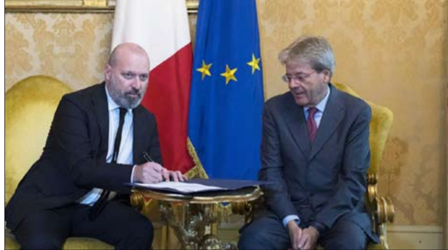
ستيفانو بوناتشيني.. مقاربة اخرى للحكم الذاتي