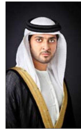
التنمية السياحية وبالتزامن سيكون رفع العلم في عدد من

بهذه المناسبة ينبع من إيمانها العميق بأهمية العلم، وللتعبير عن محبتنا لوطننا، وهي عرفان منا بالجميل، في ظل الإنجازات القياسية الرائدة التي تحققت في جميع المجالات والميادين، لما ليو العلم من وقع عظيم في قلوبنا مواطنين ومقيمين، على السواء. وأشار الشيخ عبدالعزيز النعيمي أن الدائرة أعدت فعاليات وأنشطة عدة "أشارك فيها بشكل مباشر كرفع العلم مع عدد من مدراء عموم ومسؤولي الدوائر الثلاث -الأراضي والتنظيم العقاري، مجموعة عجمان القابضة، ودائرة