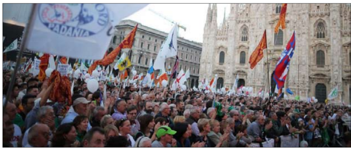
رابطة الشمال.. كسب ثمين

يطلب إقليم إميليا رومانيا إدارة أربعة مجالات فقط، منها العمل والصحة. ويشير إعلان النوايا المختزل إلى أن المفاوضات ستعقد في شكل ثنائي مع الوزراء المعينين. وتأمل المنطقة من خلال الحكم الذاتي الحصول على موارد مؤكدة، كما يجب أن يكون تمويل الصلاحيات الجديدة جزء من المناقشات، من الممكن أن تكون بضعة مليارات يورو، يقول ستيفانو بوناتشيني. مطالب منطقة إميليا رومانيا المالية أقل بكثير من مطالب لومبارديا وفينيتو. تريد الأولى أن يبقى في خزائنها 27 مليار يورو، أي نصف الخلفيات الضريبية، وهو الفرق بين ما يدفعه المواطنون للدولة، وما يتفوقه في المقابل كإناقص عمومي. وتسبب الثانية إلى الحفاظ على تسعة أعضار الضرائب، علما ان الضرائب لا تُسدرج في المفاوضات المنصوص عليها في الدستور. وقد حذر جيانكلوديو بريسبا وكيل وزارة الشؤون الإقليمية لن تتحدث عن الاستقلال المالي. هذا يتطلب