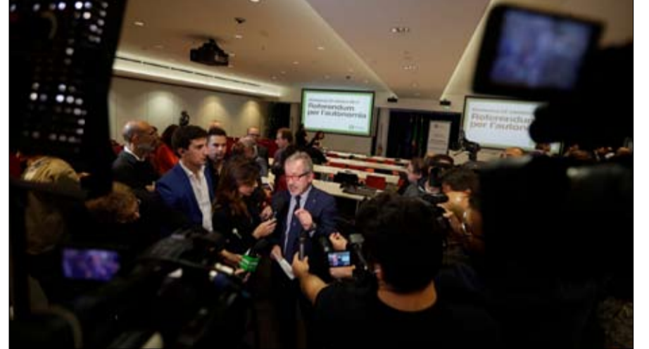
رئيس لومبارديا، روبرتو ماروني: الانتصار يعزز قوتنا