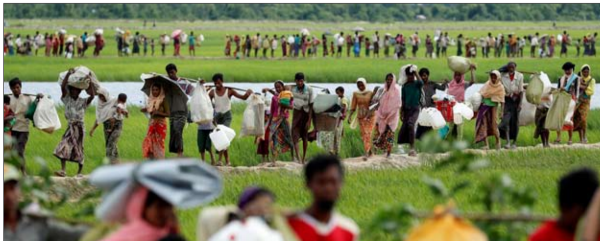
محنة الروهينغا وصمت العالم

وأشارت إلى أن القانون المذكور يمنح بالعفو العام الموظفين وأصحابهم الذين تمت مواخبتهم على أفعال متصلة بمخالفة الترتيب أو الأضرار بالإدارة لتحقيق منفعة لا وجه لها للغير، ويستثنى منه الأفعال المنسوبة إليهم والتي تتعلق بقبول رشاوي أو الاستيلاء على أموال عمومية. وتصف المعارضة ومنظمات تونسية القانون المذكور بالتطبيق مع الفساد والفاستين، وتعتبر ان تمريره يمثل تبييضاً لفترة استبداد وفساد عاشتها تونس طيلة عقود وتكريسا لسياسة الإفلات من العقاب.