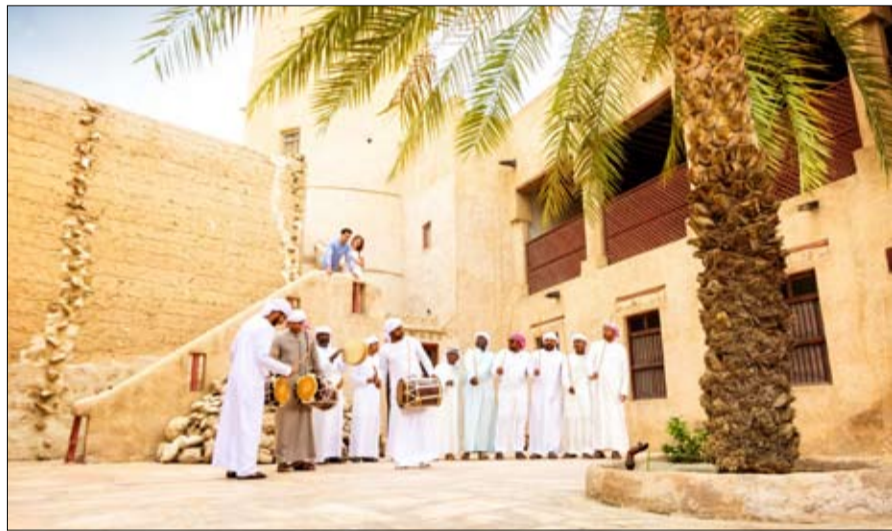
الشعبية 7 فرق يمتحن عجمان سري عجمان، الباهي قصر وبنات ريسورت، الزوراء، عروضها الفنية. عجمان رامادا، وذي أوبيروي

القناتح. وتحفل الدائرة بيوم العلم صباح الخميس في مقر متحف عجمان، بحضور الشيخ عبدالعزيز بن حميد بن راشد النعيمي ومدراء العموم ومدراء الإدارات وكافة المسؤولين والعاملين في دائرتي التنمية السياحية والأراضي والتنظيم العقاري ومجموعة عجمان القابضة، وجمعية عجمان للفنون الشعبية، وشبكة رؤية الإمارات الإعلامية، المنضوين تحت رئاسة الشيخ عبدالعزيز. وستشهد الاحتفالية مجموعة متنوعة من الفعاليات المميزة التي