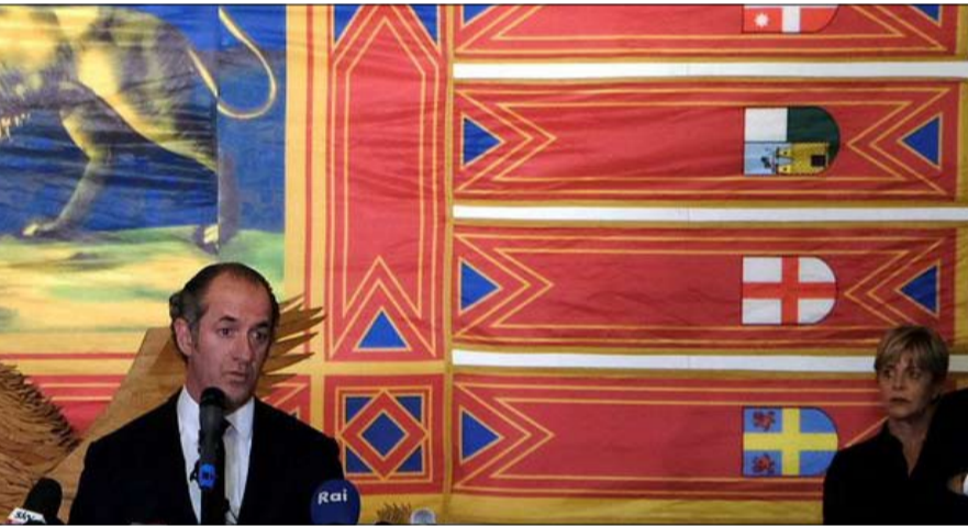
لوكا زايا، رئيس فينيتو: التاريخ يتغير