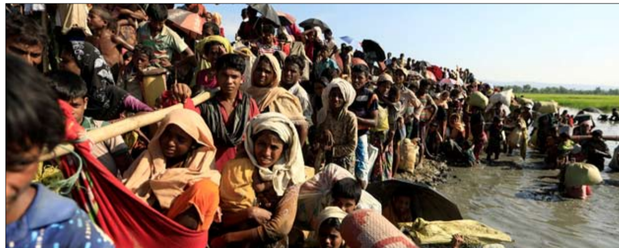
تطهير اقلية وزيف الديمقراطية