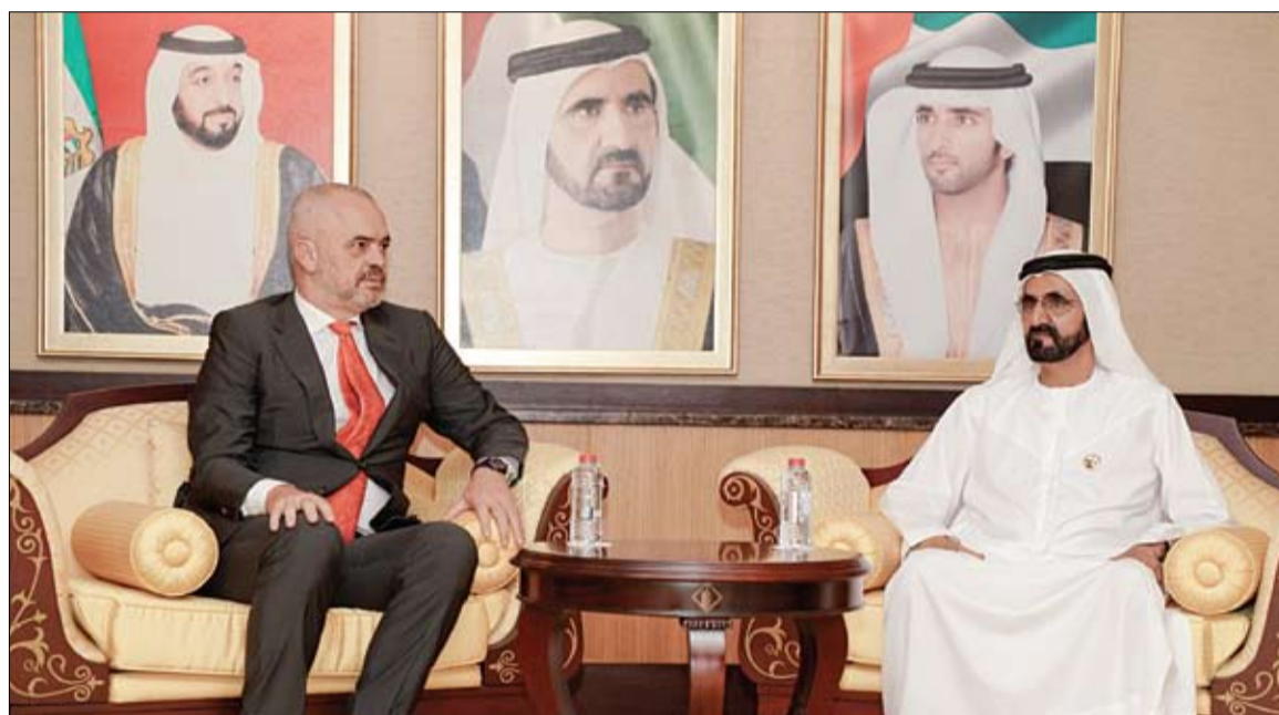
محمد بن راشد خلال استقباله رئيس الوزراء الألباني

استقبل صاحب السمو الشيخ محمد بن راشد آل مكتوم نائب رئيس الدولة رئيس مجلس الوزراء حاكم دبي رعاه الله في دبي ظهر امس دولة السيد إيدي راما رئيس الوزراء في جمهورية ألبانيا. وقد رحب سموه بحضور سمو الشيخ حمدان بن محمد بن راشد آل مكتوم ولي عهد دبي بالضيف واستعرض معه العلاقات الثنائية بين دولة الامارات وألبانيا وسبل تعزيزها في ضوء الفرص المتاحة لدى الجانبين خاصة في قطاعات الاستثمار السياحي والتجاري والصناعي وكذا في قطاع البنية التحتية مؤكدا سموه أن دولة الإمارات ترحب بالدول الصديقة التي ترغب في بناء شراكات استثمارية معها. من جهة أخرى أطلق صاحب السمو الشيخ محمد بن راشد آل مكتوم نائب رئيس الدولة رئيس مجلس الوزراء حاكم دبي رعاه الله، مبادرة مليون مبرمج عربي ضمن مبادرات محمد بن راشد آل مكتوم العالمية، كأكبر مشروع برمجة يسعى إلى تدريب مليون شاب عربي على البرمجة وتقنياتها وسبل التطور المتسارع في علوم الحاسوب وبرمجياته وذلك لتمكين الشباب العربي وتسليحهم بأدوات المستقبل التكنولوجية وبناء قدراتهم وتوفير فرص عمل تمكنهم من استغلال مهاراتهم وتوجيهها بما يخدم الاحتياجات المستقبلية والمساهمة في تطوير الاقتصاد الرقمي الذي يشكل اقتصاد المستقبل. وقال صاحب السمو الشيخ محمد بن راشد: أطلقنا بحمد الله مشروعاً عربياً جديداً.. ومبادرة للشباب العربي.. نسعى من اليوم لتدريب مليون شاب عربي على البرمجة. في ذلك رعى صاحب السمو الشيخ محمد بن راشد آل مكتوم نائب