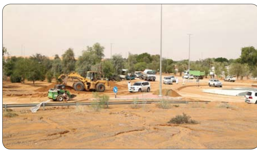
استعداداً لموسم الأمطار