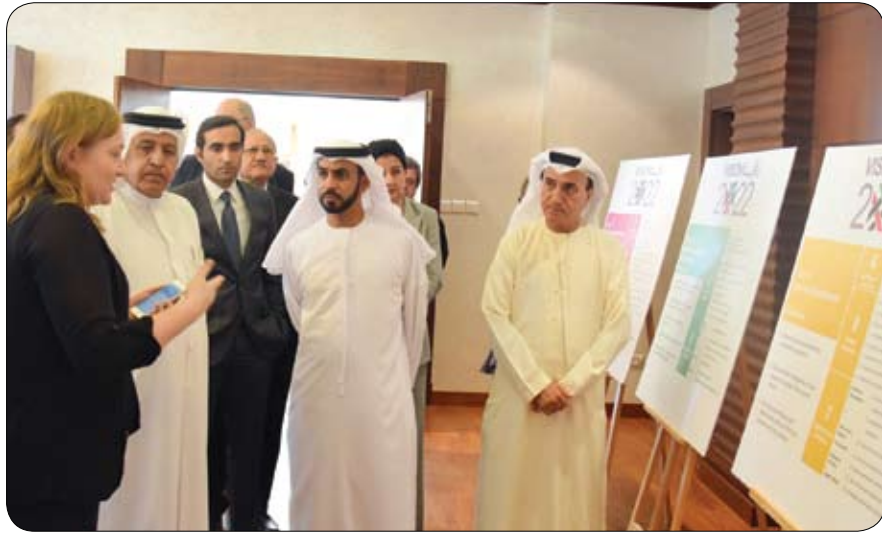
تتضمن 6 محاور رئيسية أبرزها الطالب