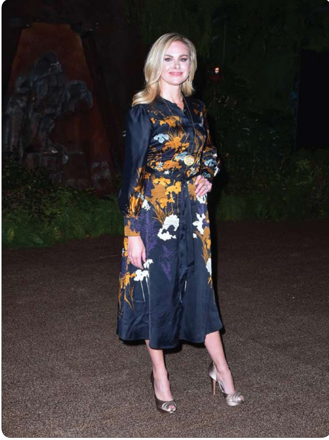
نورا بيل باندي لدى وصولها لحضور العرض الأول لفيلم "جوماتجي: مرحبا في الأدغال" في هوليوود.

تتحده خطوط المعركة فيما يقترب أول علاج جيني من السوق الأمريكية ويقدم الأمل لمن يعانون من نوع نادر من العمى ولكنه يخلق معضلة لمقدمي خدمات الرعاية الصحية فيما يتعلق بالتكلفة. وأبلغت شركة سبارك ثيرابيوتيكس، التي صدرت توصية بالموافقة على علاجها (الذي يحمل الاسم لوكستورنا) في الولايات المتحدة، المستثمرين الأسبوع الماضي أن هناك سبباً لتقييم العلاج يكثر من مليون دولار للمريض الواحد رغم أنها لم تحدد سعراً فعلياً بعد. لكن المعهد الأمريكي للمراجعة الإكلينيكية والاقتصادية قال هذا الأسبوع إن هذا يجعل من الصعب أن يكون ذلك علاجاً فعالاً من ناحية التكلفة. غير أن التحليل الذي أجراه المعهد أقر بأن العلاج قد يكون فعالاً من حيث التكلفة بالنسبة للمرضى الأصغر سناً. وتمثل الموافقة الأمريكية المتوقعة على لوكستورنا في 12 يناير كانون الثاني دفعة للقطاع بعد مبيعات محبطة لأول علاجين جينيين في أوروبا. ويسعى مزيد من الشركات مثل بلو بيرد بيو وبيو مارين وسانجامو إلى العلاجات التي تعتمد على إصلاح الجينات المعيبة باستخدام فيروسات لحمل الحمض النووي إلى الخلايا. وقال ستيفن ويستير المدير المالي لشركة سبارك يوم الخميس إن العلاج الجيني يغير طريقة التفكير التقليدية بتقديم علاج مرة واحدة فقط بدلاً من تكرار الوصفات لسنوات لكن الأنظمة الصحية لا تزال تكافح لتتحقق بالربح. وأضاف في مؤتمر بشأن الرعاية الصحية في لندن أن سبارك تود أن تقول "إذا نجح (العلاج) فادفعوا لنا وإذا لم ينجح فلا تدفعوا".