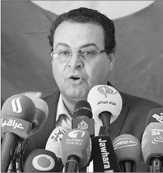
حركة الشعب تعارض مشروع السبسي