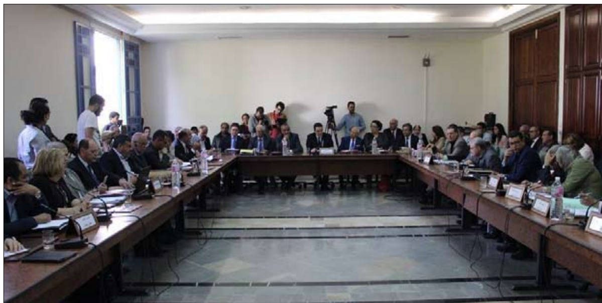
هل يحصل التوافق داخل لجنة التشريع العام؟

وكان المعارضون قد باشروا تحركهم المناهض للمبادرة الرئاسية في الشارع بتنظيم شباب حملة "مانيش مسامح" (لن اسامح)