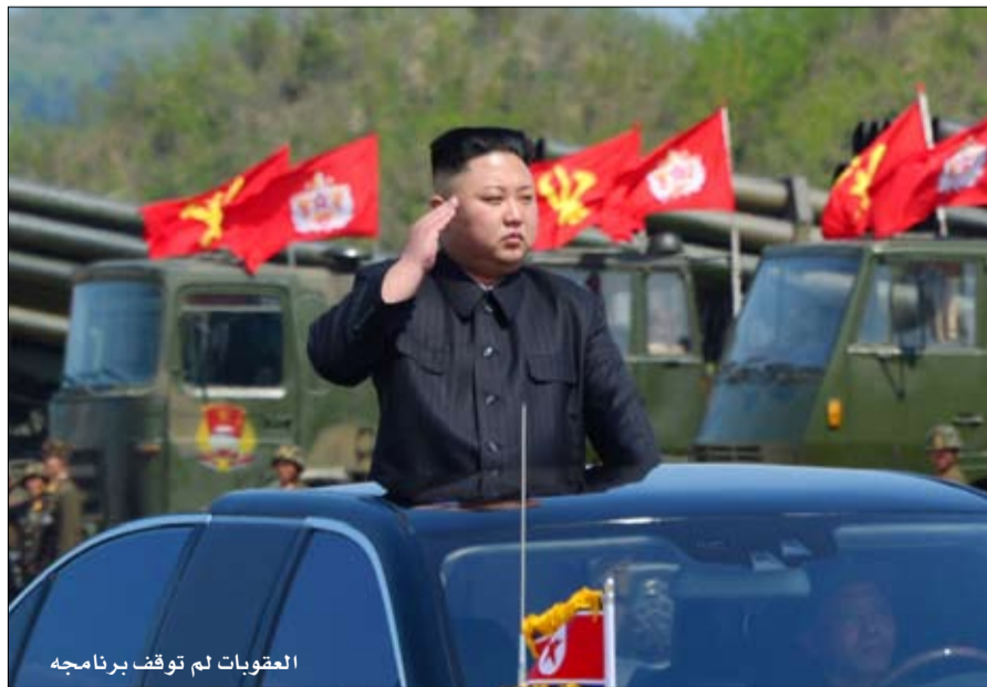
العقوبات لم توقف برنامجها

لم تطبق الصين الحظر التجاري الذي يساهم بأكثر من 80 بالمائة من موارد البلاد جميع العقوبات المتخذة منذ عام 2006، فشلت في دفعها للتخلي عن برنامجها النووي والباليستي