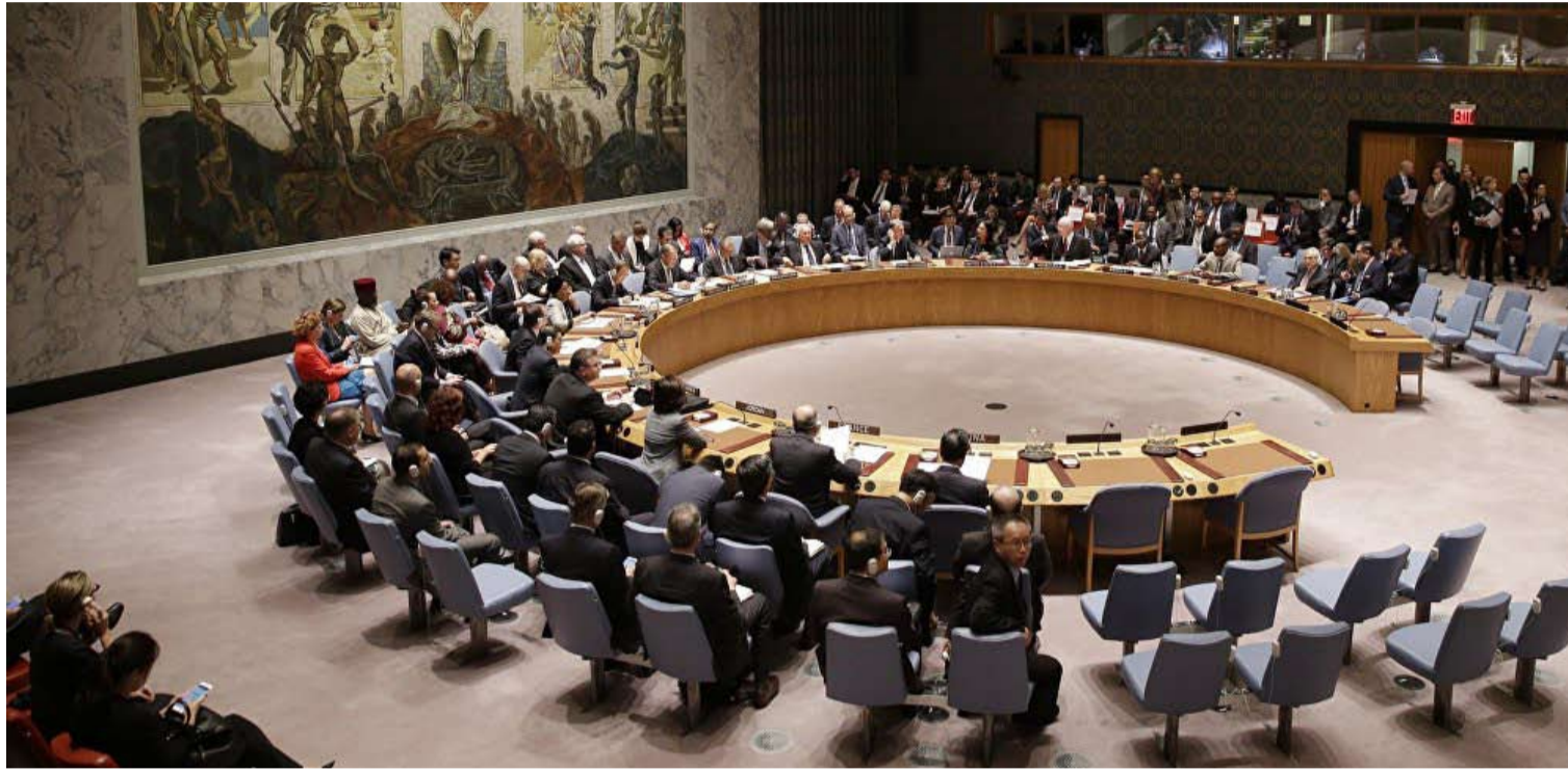
مجلس الامن.. تالتت القرارات والنتيجة صفر