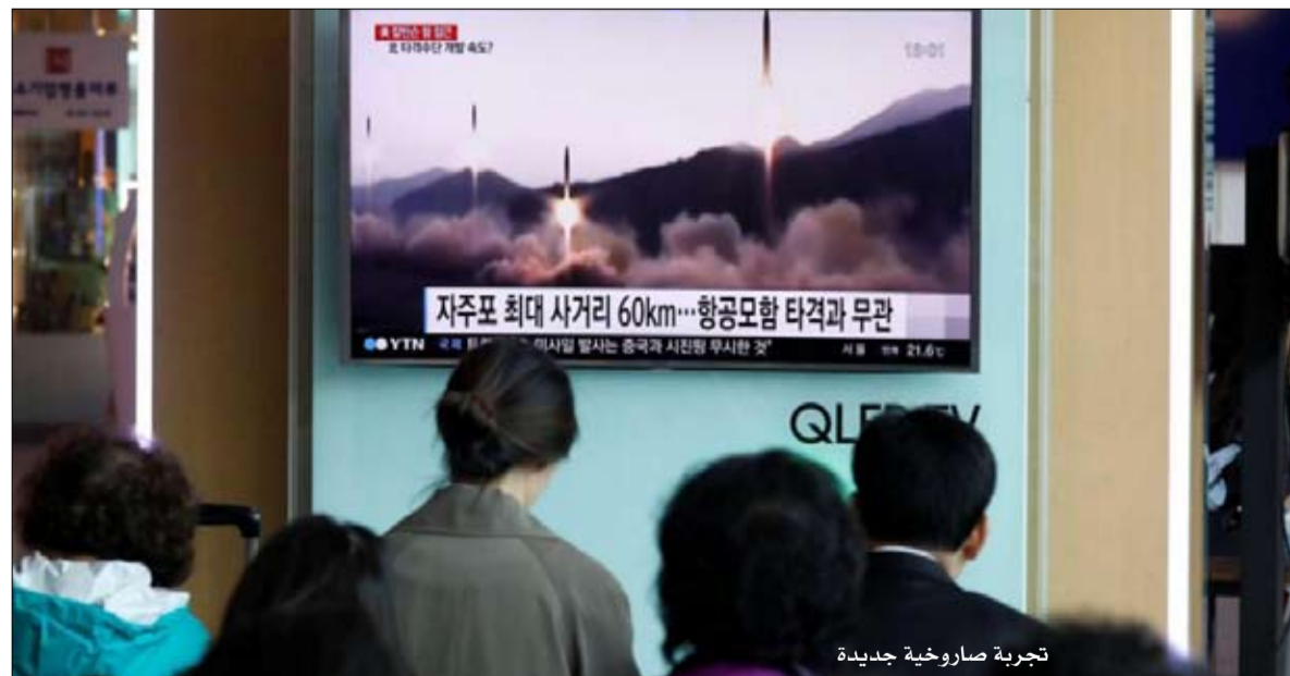
تجربة صاروخية جديدة

والماوى والخدمات الطبية، وقالت المفوضية إن طائرة بضائع تحمل شبكات للوقاية من البعوض وأغطية وأدوات صحية أُلقت من دبي وهبطت بالقرب من دندو على بعد نحو 100 كيلومتر من الحدود بين أنجولا والكونجو الديمقراطية حيث أقامت المفوضية مراكز مؤقتة لإيواء اللاجئين. وأشارت الأمم المتحدة إلى أنها ستسأل المزيد من مواد الإغاثة إلى أنجولا في الأيام المقبلة. وأصبح نمرد ميليشيا كامبونجا نسابو في منطقة كاساي بوسط الكونغو الديمقراطية الذي اندلع في أغسطس أب الماضي أخطر تهديد لحكم الرئيس جوزيف كابيلا الممتد منذ 16 عاما. وتفاقت أعمال العنف في أنحاء ثاني أكبر بلد أفريقي في عقب قرار كابيلا البقاء في السلطة بعد انتهاء مدة ولايته الدستورية في ديسمبر كانون الأول.