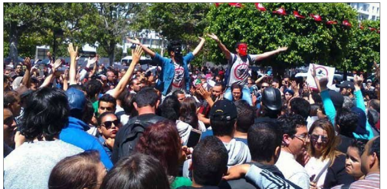
مسيرة احتجاجية في العاصمة التونسية