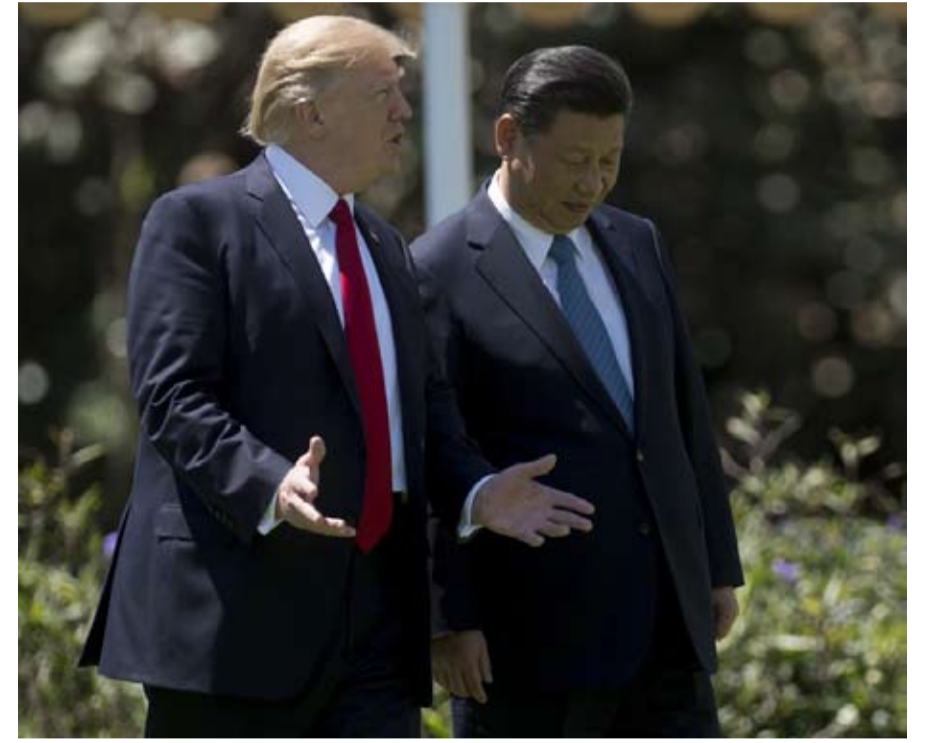
انزعاج مشترك ومقاربة مختلفة

الشمالية، وتزد جارتها بالأجهزة الكهربائية، والبلاستيك، والألياف الصناعية.