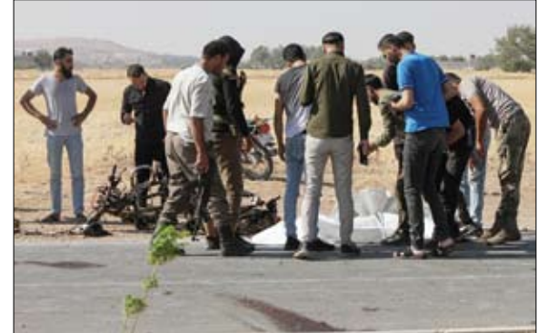
المرأة والمسلحون يتجمعون حول جثة في موقع هجوم بطائرة بدون طيار في حلب

ونقلت وسائل الإعلام الروسية عن مصدر عسكري القول: حاولت قوة أوكرانية التوغل في منطقة أوبورنيك، حيث طُفوا على ما يبدو أن بمقدورهم التوغل في المنطقة لاستخدامها نقطة انطلاق لشن هجوم إضائي، لكننا اكتشفناهم.. تم الكشف عن القوات الأوكرانية عن طريق رجال الاستطلاع والسيرات الروسية، وبعد تحديد الأهداف قصفت مدفييتا القوة المتسللة وقضت عليها. هذا وأفاد رئيس المكتب الصحافي لمجموعة قوات المركز بالجيش الروسي، أمس الأحد، أن الطيران الروسي قصف ثلاث نقاط انتشار مؤقتة ومستودعا للذخيرة