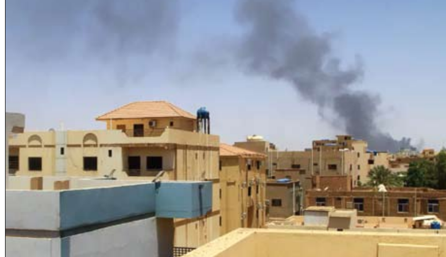
الدخان يتصاعد من أحد المواقع في العاصمة الخرطوم

وشهدت مدينة الأبيض عاصمة ولاية شمال كردفان ليل السبت اشتباكات بين قوات البرهان وقوات دقلو، بحسب ما أفاد شهود عيان. والجمعة وأفاد سكان من مدينة بارا التي تبعد 50 كيلومترا شمال شرق الأبيض، وكالة فرانس برس أن (قوات) الدعم السريع تهاجم مدينة بارا وتهاجم البنوك والمتاحات الحكومية. وكان طرفا النزاع أبرما أكثر من هدنة، غالبا بوساطة الولايات المتحدة والسعودية، سرعان ما كان يتم خرقها.