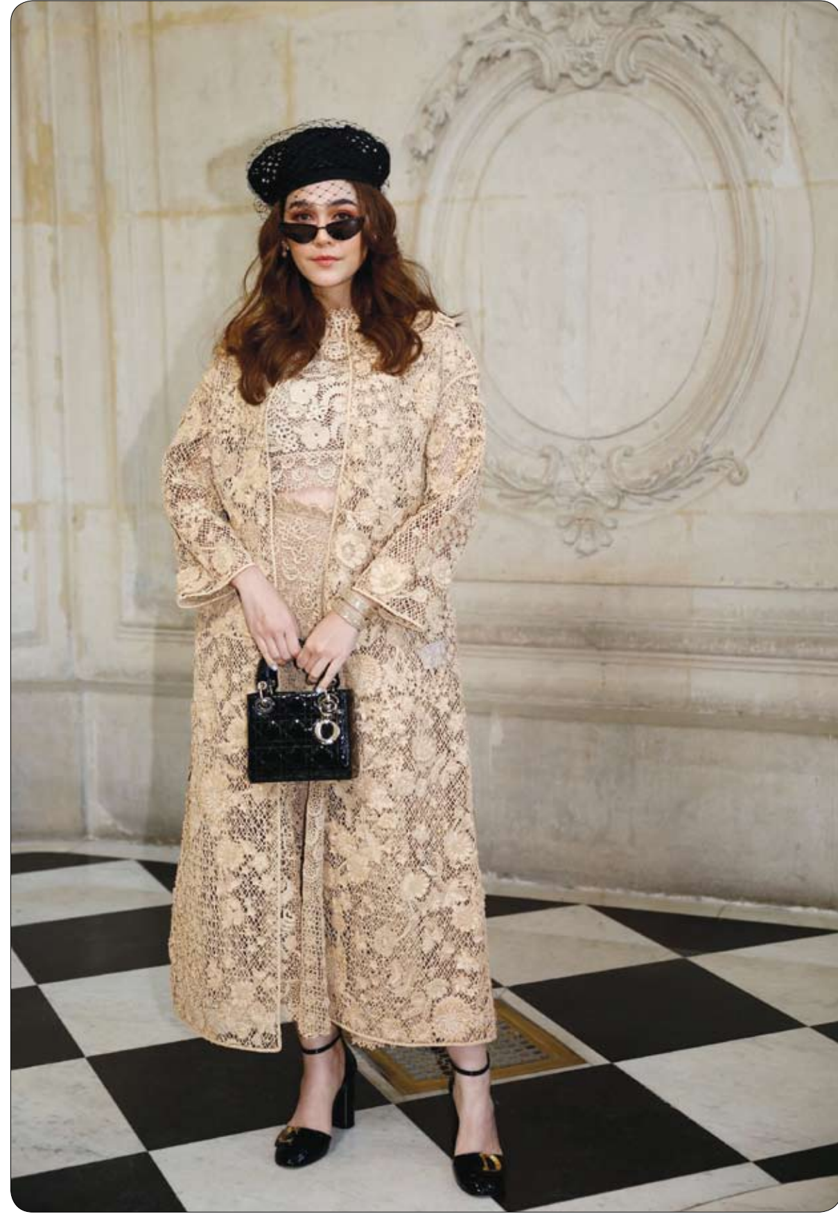
أرايا هارجيت خلال عرض مجموعة Dior Haute Couture لخريف وشتاء 2023-2024 في باريس.

اكتشف فريق علمي نوعاً جديداً من الضفادع يسمى بـ "أوستوسيفاليس فاسكيزي" في محمية داخل غابة مركزية في البيرو، على ما أفادت الهيئة الوطنية للمناطق الطبيعية المحمية من الدولة (سيرناناب). وأشارت الهيئة في بيان إلى أن "منتزه ياناشاغا شيميلان الوطني الواقع في منطقة باسكو شهد اكتشافاً علمياً حديثاً يتمثل في العثور على نوع جديد من الضفادع". ويتميز هذا النوع من الضفادع بظهر شوكي فيما ينتمي إلى سلالة "أوستوسيفاليس" التي تعيش في المنتزه الطبيعي الواقع على المنحدرات الشرقية لجبال الأنديز في البيرو، في حوض نهر الأمازون وسط غابة البيرو.