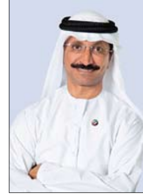
سلطان أحمد بن سليم