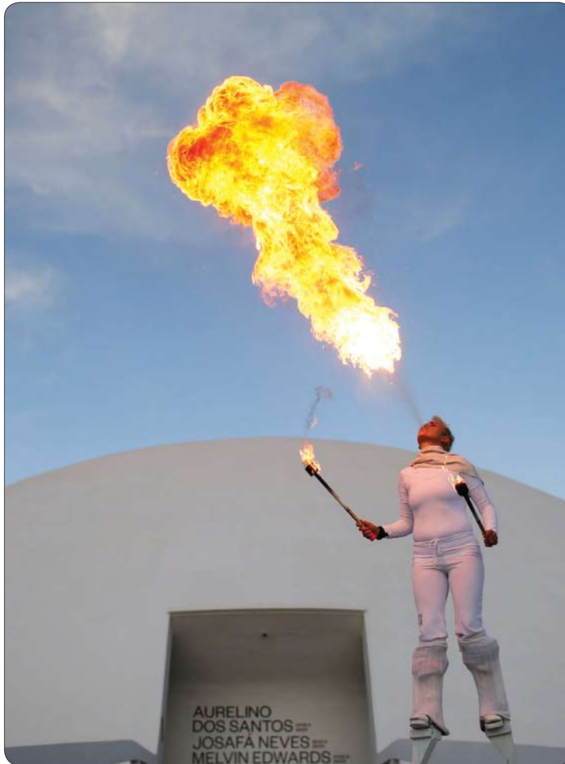
فنان يخرج النار من فمه خلال احتجاج لتكريم الأشخاص الذين ماتوا من فيروس كورونا خلال تفشي المرض في البرازيل.