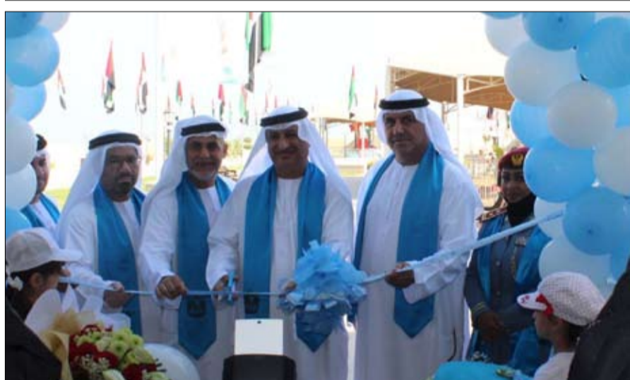
الاسنان وقاع العين ) بمنطقة شعاع رأس الخيمة بمشاركة دائرة الخدمات العامة ومستشفى شعاع ونادي التعاون الثقافي الرياضي وأهالي المنطقة. وعدد من المدارس وأولياء الأمور