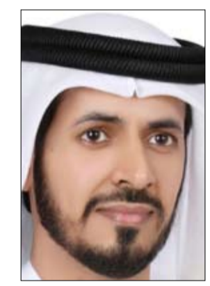
واشار رئيس مجلس ادارة الجمعية: لأن التسامح هو قيمة تتعلق بشكل وثيق بالحقوق التي يتميز بها النظام الديموقراطي كحرية التعبير عن الرأي، وتنظيم المجتمع ومسواته أمام القانون، وحقوق أسرى الحرب، واحترام رأي الأقلية وعدم تهميشهم أو

سوية، بعيدة عن الحقد والكراهة والأمراض النفسية. وقال بن حم بمناسبة احتفالات العالم بيوم التسامح: التسامح مبدأ إنساني يدفع الشخص إلى نسيان الأحداث الماضية، والتي سببت له الألم والأذى بكامل إرادته، وكذلك التحلي عن فكرة الانتقام، والتفكير بالأمور الإيجابية لدى الناس وعدم الحكم عليهم وإدانتهم، والعلم بأن كل البشر خطائون، وهو الإحساس بالرحمة والعطف والحنان، كما أن التسامح هو القدرة على العفو عن الناس، وعدم رد الإساءة بالإساءة، والتخلي بالأخلاق الرفيعة التي دعت لها كافة الديانات والأنبياء والرسول، وهذا كله يسعود على