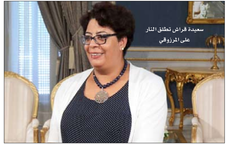
سعيدة قراش تطلق النار على المرزوقي

قالت الناطق الرسمي باسم رئاسة الجمهورية التونسية سعيدة قراش، ان الرئيس المؤقت السابق المنصف المرزوقي متطفل وليس رجل دولة ويجب عليه تحمل مسؤولية أقواله، حسب تصريحها لإذاعة محلية. وأضافت قراش ان تصريحات المرزوقي تدل على غياب