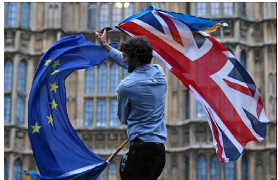
الانسحاب من الاتحاد وجمع راس داخل المحافظين