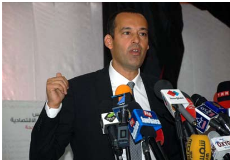
افاق تونس مصادرة حق دستوري مشروع