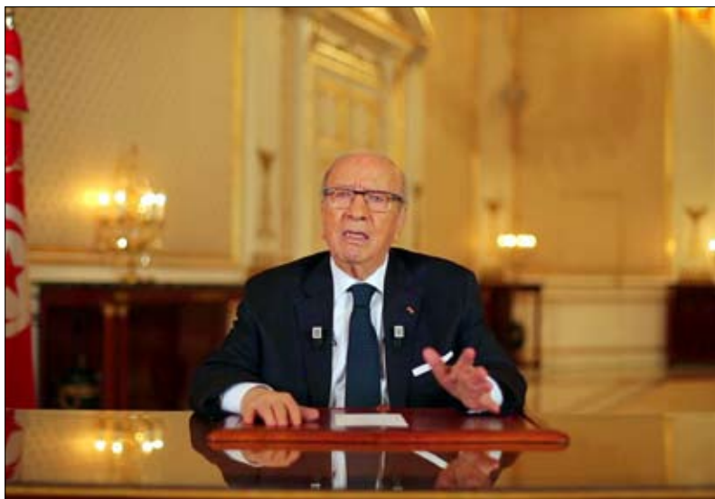
الرئاسة تتبرأ من دعوة الغنوشي