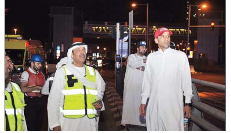
محمد بن راشد وسيف بن زايد يتابعان حريق برج الشعلة