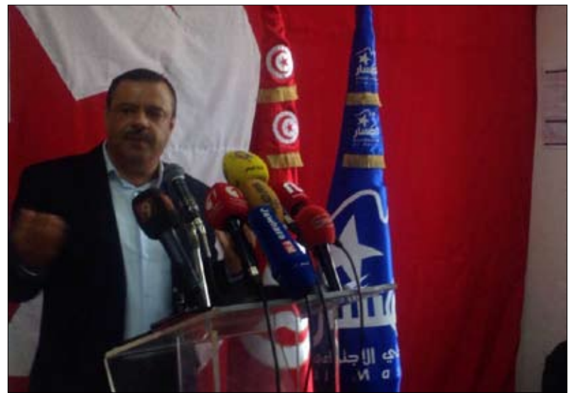
المسار ارباك للحكومة والدولة