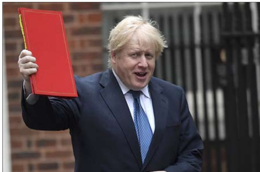
بوريس جونسون ليس هذا ما ألقننا عليه

أدانت كوريا الشمالية امس الجمعة قرار الولايات المتحدة حظر السفر إليها، وتهدت بأن بابها سوف يظل مفتوحاً أمام الزائرين الأمريكيين. ووصف المتحدث باسم وزارة الشؤون الخارجية في كوريا الشمالية حظر السفر بأنه إجراء سيء يهدف إلى الحد من التبادل بين الشعوب من أجل عدم السماح للأمريكيين برؤية الصورة الحقيقية لجمهورية كوريا الشعبية الديمقراطية، حسبما أفادت وكالة الأنباء المركزية الرسمية في كوريا الشمالية. وأضاف أن حظر السفر دليل على أن واشنطن تنظر إلى كوريا الشمالية باعتبارها عدوتها. وأعلنت وزارة الخارجية الأمريكية 21 يوليو الماضي أنها سوف تحظر سفر المواطنين الأمريكيين إلى كوريا الشمالية، مشيرة إلى المخاوف المتزايدة من خطر الاعتقال والاحتجاز لفترات طويلة بموجب نظام تنفيذ القانون في كوريا الشمالية. ويأتي قرار حظر السفر بعد وفاة طالب أمريكي يدعى أوتو وامبير في يونيو الماضي إثر احتجازه في كوريا الشمالية بتهمة محاولة سرقة لوحة دعائية من فندقه ثم هجرته من كوريا الشمالية إلى الولايات المتحدة في غيبوبة بعد الإفراج عنه.