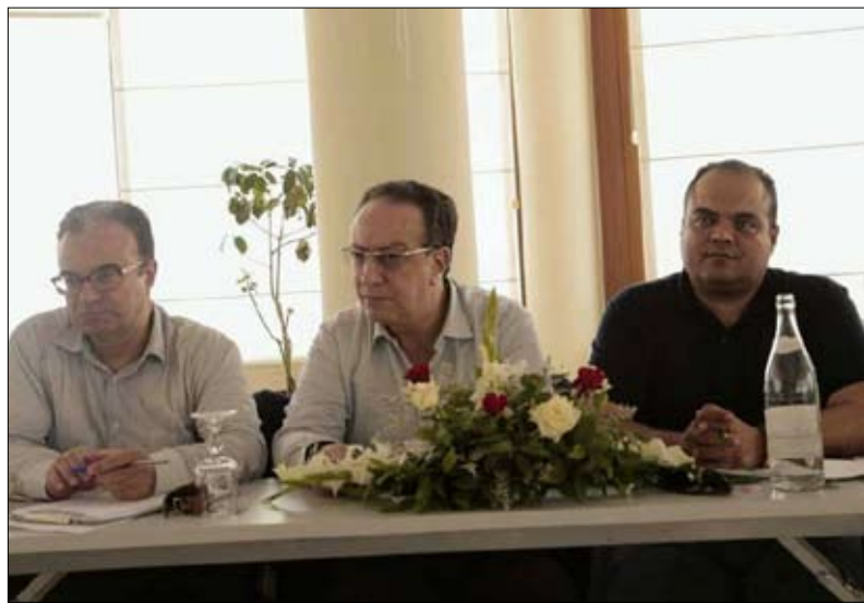
هل اصطف نداء تونس وراء النهضة

وأضاف: الشاهد غير معني سوى بإدارة الشأن العام في البلاد، والوصول بالبلاد إلى انتخابات 2019 في حين أكد الناطق الرسمي باسم