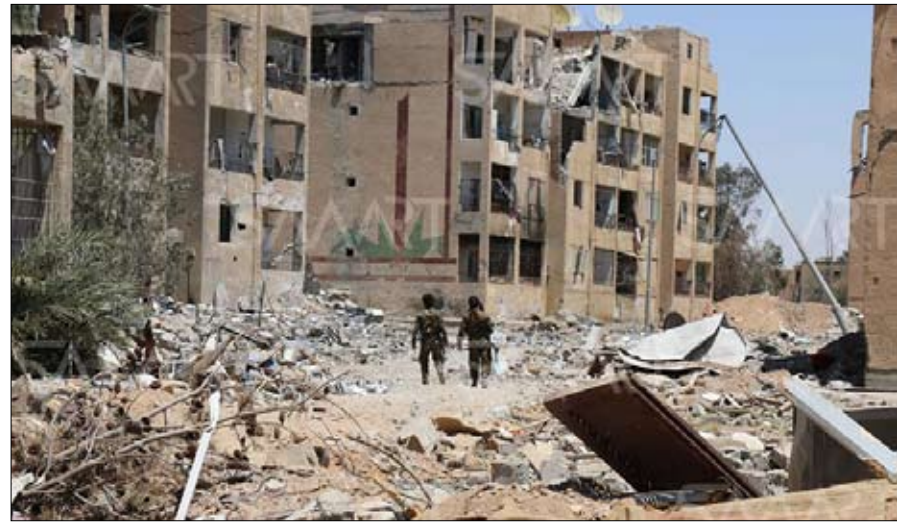
مخربين في مدينة الرقة بعد تعرض الأفران للقصف.

أصدر تنظيم داعش الإرهابي قراراً يفرض التجنيد الإجباري على الشبان في محافظة دير الزور، شرقي سوريا. وبحسب ما ذكرته "روسيا اليوم"، امس الجمعة، وزع التنظيم فيما يسميها "ولاية الخير" بيانا أعلن فيه أن التجنيد أصبح إجباريا على أصحاب الأعمار بين 20 - 30 عاماً، من دون أن يستثنى من ذلك إلا من وصفهم بأصحاب "الأعداء الشرعية".