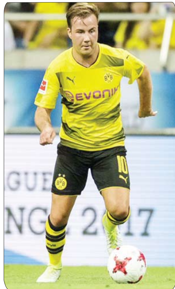
خمس أشهر من العلاج سأتاح الى مباريات وتمارين لأجد إيقاعي مجددا. هذا واضح بالنسبة لي، وأمل في ان يكون واضحا بالنسبة الى الجميع". وبرز غوتسه مع المنتخب الألماني في سن مبكرة نسبيا، إلا ان مكانه ضمن التشكيلة التي ستؤتي الدفاع عن اللقب العالمي في روسيا

الاستدعاء الى التشكيلة، مضيفا الأفضل فقط سيشاركون في كأس العالم، وعلى لوف ان يقرر.