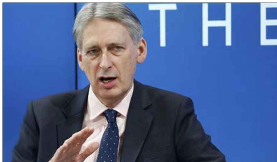
فيليب هاموند البريكسيت الناعم