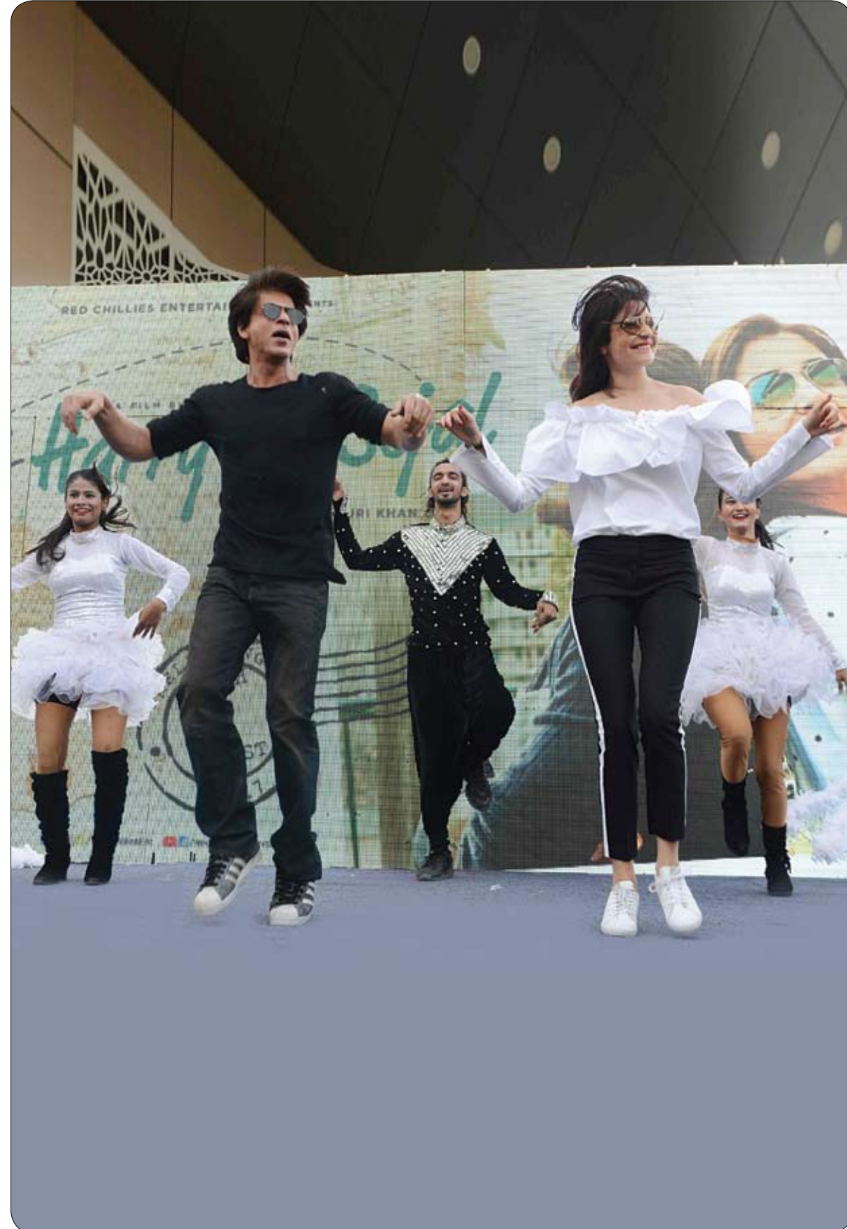
الممثلان الهنديان شارهوخ خان وأنوشكا شارما يرقصان خلال حدث ترويجي للفيلم القادم 'Jab Harry met Sejal' في غوروغرام.

بصوته المميز وأدائه القوي، أبهر نجم الروك الإيطالي زوكيرو الحاضرين في الدورة الثالثة والخمسين لمهرجان قرطاج الدولي لدى عودته لاعتلاء المسرح الأثري الروماني للمرة الثانية بعد غياب سنوات. وبدا زوكيرو بقبخته المعتادة في أوج عطائه على المسرح بلقطة عدد من أشهر العازفين الأوروبيين والأمريكيين وأبهر جمهوره بصوته الفريد وموسيقاه التي تمزج بين الروك والبلوز والجاز لأكثر من ساعتين. وقدم الغني الإيطالي الذي تميزت أعماله بمزج الروك بموسيقى الجاز والسول مجموعة من أشهر أغانيه ومنها قليلا من السكر والشيطان في داخله يقول لي ومن دون امرأة وأسودت الدنيا في عيني وأغان أخرى من ألبومه الجديد الصادر عام 2016 بعنوان القط الأسود. وبعد أن أنهى النجم حفله أعادته هاتفات الجمهور وتصفيقه إلى المسرح ليتمتع بمزيد من أغانيه بصوته القوي العذب على وقع موسيقى الروك الصاخبة. بدأت مسيرة زوكيرو الفنية وهو شاب يافع في منتج فورت دي مارمي الاستقراطي على ضفاف البحر المتوسط قبل أن يسافر إلى الولايات المتحدة عام 1984 حيث برز اسمه. واكتسحت أغاني زوكيرو الذي يوصف صوته بالسنديان العتيق أوروبا والولايات المتحدة وتجاوزت مبيعات أسطواناته 40 مليون نسخة.