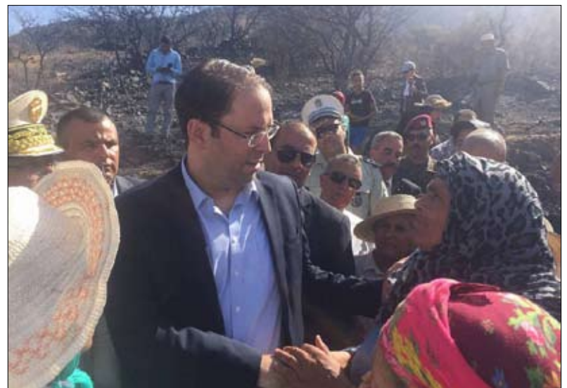
الشاهد ضحية البيع المشروط

الإقرار بحق الشاهد بان يكون له طموح سياسي وان يترشح في كل الاستحقاقات الانتخابية بما فيها الرئاسة في 2019 لكن في المقابل يطالبه بان يتعد عن رئاسة الحكومة ان كانت له النية في الترشح.