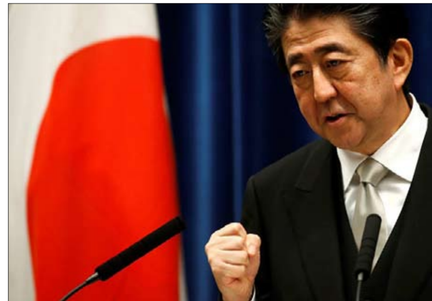
شينزو ابي يقدم حلا مغيبرا