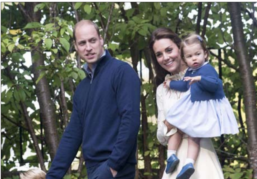
الاميرة شارلوت لن تحرم من عرش بريطانيا

في الاثناء، فإن المملكة المتحدة على وشك أن تدخل حيز التنفيذ تدبيرا لصالح المساواة الملكية بين الجنسين، وكان قصر كنسينغتون قد أعلن ان كيت ميدلتون حامل بطفها الثالث الذي يضيف وريثا اخر الى قائمة خلفاء الامير ويليام. في الماضي، كان الطفل الجديد من الذكور سيحل محل شقيقته الكبرى شارلوت، الطفل الثاني، في صف الخلافة غير ان القانون الذي صدر بعد انتماء ميدلتون الى الأسرة عام 2011 بوقت قصير، ضمن أن أي بنت ملك بريطانيا لديها فرصة مساوية لتأهل لاعتلاء العرش. ان الأسر الملكية في بريطانيا واليابان قد تمثل عبئا من عصر آخر على ميزانيات الحكومات، ولكن طالما ظلت موجودة، فانه لا يجوز ان ينتزع العرش من شارلوت أو ماكو من قبل شقيقهما الأصغر لجرد أنه ولد عن سلبت الفرنسية