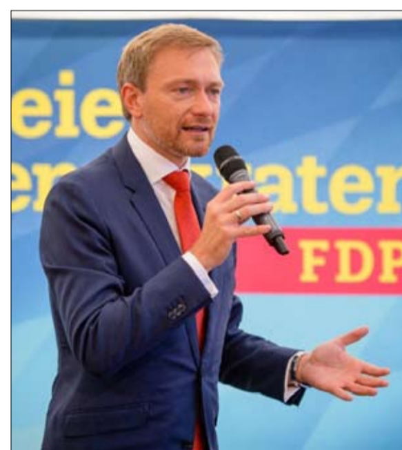
كريستيان ليندندر.. عودة الليبراليين الى البرلمان

التحالف الحزب المسيحي الديمقراطي، والحزب الاشتراكي الديمقراطي، والخضر، والحزب الديمقراطي الحر، وهي أحزاب تشكل ألوانها الأسود والأخضر والأصفر علم جامايكا. المؤكد: ترفض ميركل أي تحالف مع اليمين المتطرف، البديل من أجل ألمانيا، الذي تمنحه استطلاعات الراي حوالي 10 بالمائة من الأصوات، وكذلك مع يسار دي لينك.