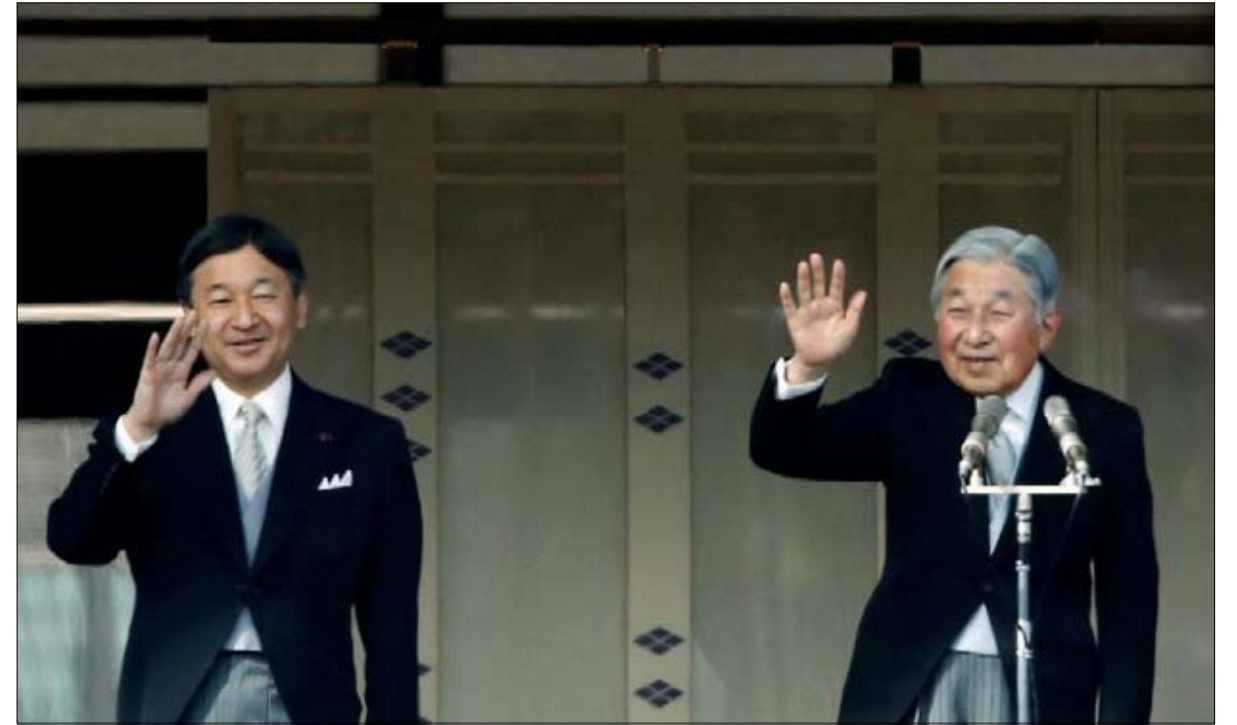
الامبراطور اكيهيتو وولي عهده