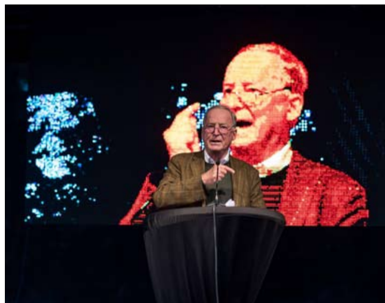
ألكسندر غولاند... اليمين المتطرف يربك المرحلة القادمة