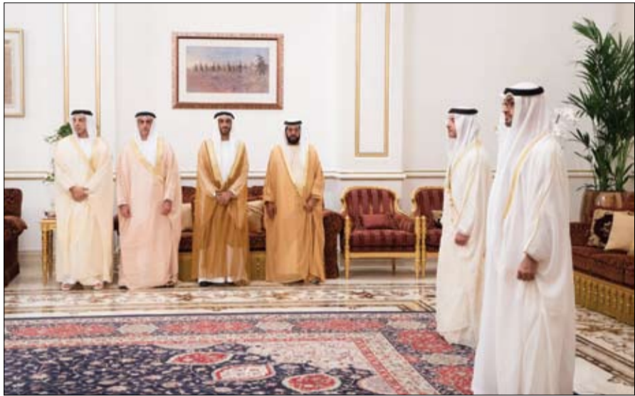
أمام محمد بن زايد... أعضاء المجلس التنفيذي الجدد يؤدون اليمين القانونية (وام)

أمام ولي عهد أبوظبي... أعضاء تنفيذي أبو ظبي الجدد يؤدون اليمين القانونية محمد بن زايد: المرحلة التنموية المقبلة تحتاج إلى رؤى مبتكرة ومبدعة