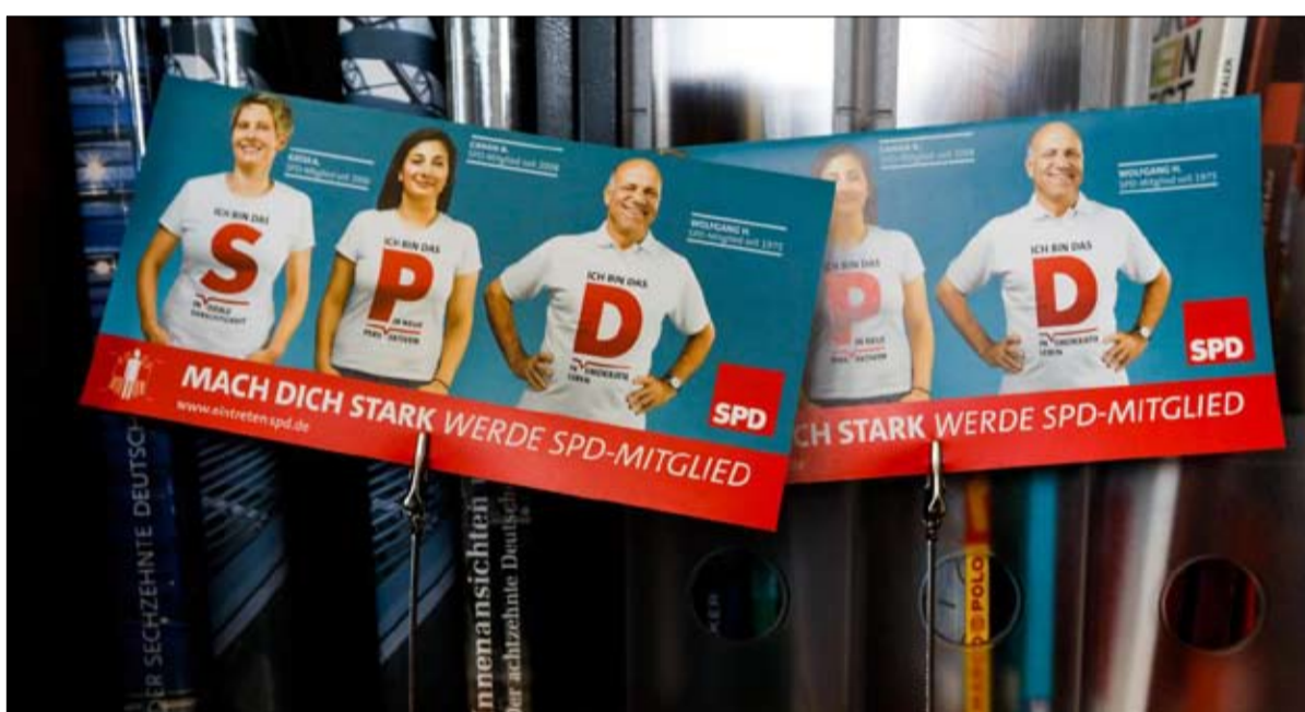
انتخابات لا تشويق فيها