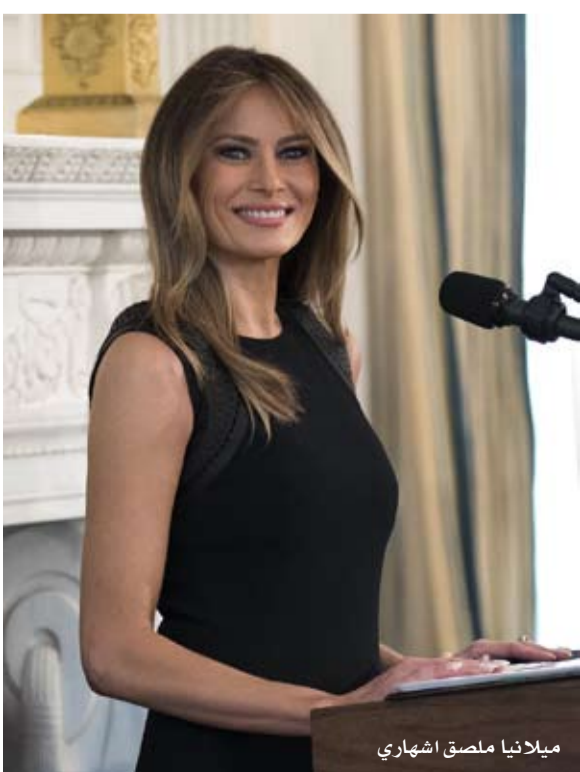
ميلانيا ملصق شهاري

الأصوات (آخر استطلاعات الراي تمنحه 37 بالمائة). وتجد الإشارة إلى أن الناخبين الألمان، في بلد ينخفض فيه معدل الولادة جداً، هم من كبار السن، وبالتالي محافظون تقليدياً. ولأول مرة في تاريخ الجمهورية الاتحادية، سيكون من أعمارهم تتوق 60 عاماً أكبر مجموعة انتخابية بنسبة 36 فاصل 1