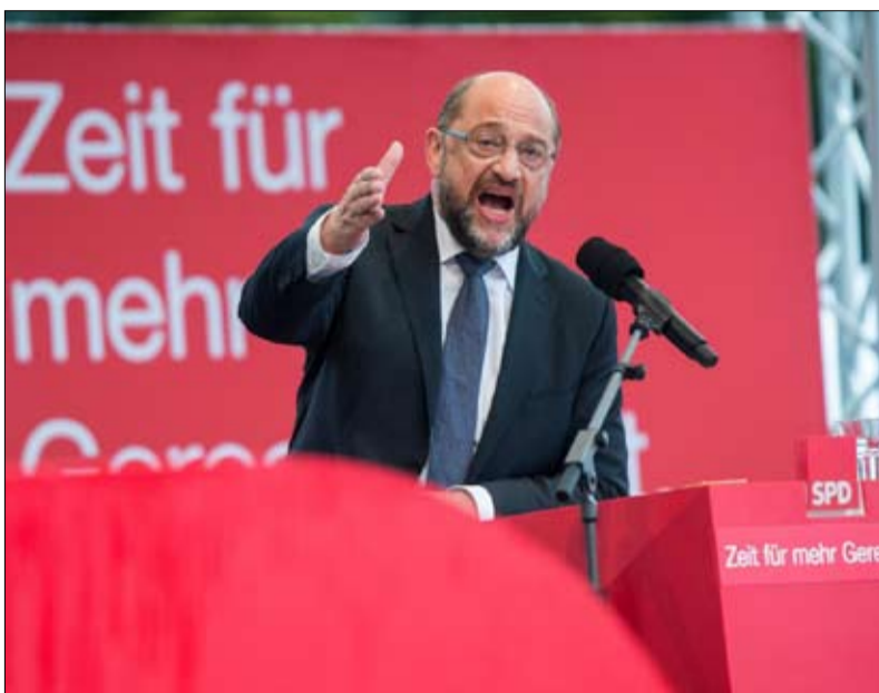
شولتز الرهان المستحيل