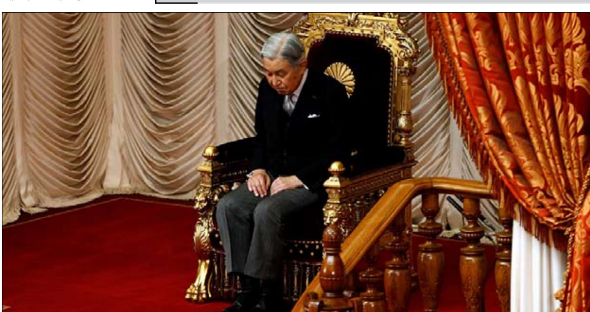
الامبراطور اكيهيتو يريد التنحي عن العرش

الرأي العام جاهز، وماذا عن الطبقة السياسية؟ ترى غالبية كبيرة من اليابانيين 86- بالمانعة، حسب استطلاع نشر في مايو 2017، أنه يجب فتح طريق اعتلاء العرش امام المرأة، ويعتقد 59 بالمانعة أن الأطفال من نساء العائلة ينبغي أيضا احتسابهم في قائمة