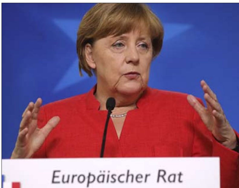
ميركل الانتصار ولكن