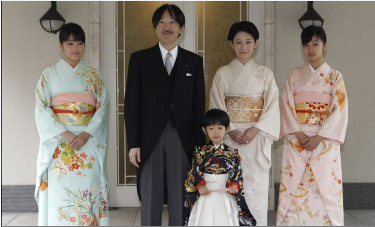
النساء ممنوعات من عرش اليابان