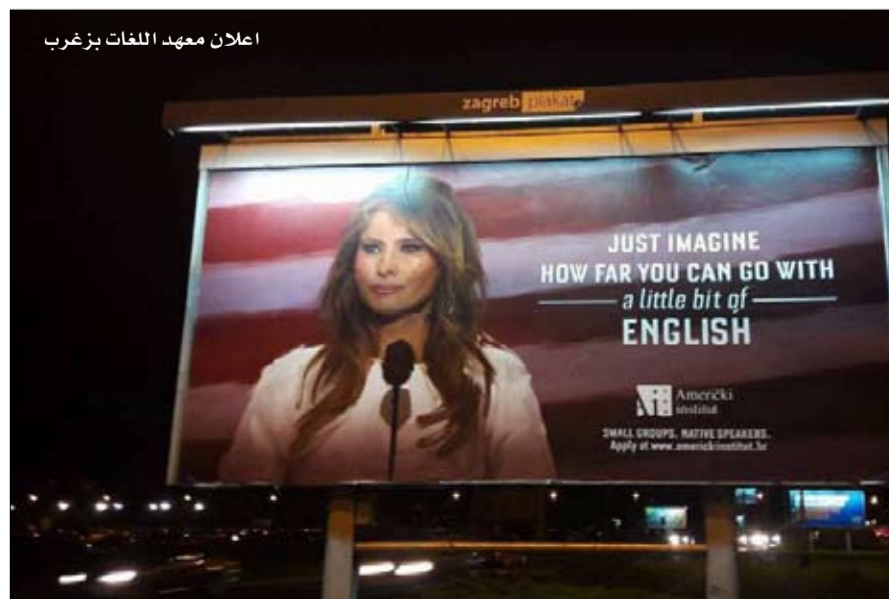
إعلان معهد اللغات بزغرب

عشر العهد الأمريكي بزغرب في كرواتيا على حجة لا يمكن دحضها لتشجيع الناس على تعلم اللغة الإنجليزية. ميلانيا ترامب. وقد أعدت مدرسة اللغات لحملتها التسويقية خمسة ملصقات مع صورة للسيدة الأولى الأمريكية يوحها التعليق التالي: تخيلوا ما يمكن أن تصبحوا إذا تحدثتم ولو النزر اليسير من الإنجليزية" ويمكن أن يُنظر إلى كتابه "التقليد من الإنجليزية" بدلا من "الإنجليزية" ككفد للمستوى الإنجليزي للسيدة الأمريكية، التي تطفئ لكتبتها السلوفانية. الفعرة الساهرة الأخرى تتمثل في أنه خارج مهاراتها اللغوية، وقليل كل شيء، كونها عارضة أزياء هو ما حدد صعود ميلانيا. فقد التقى الرئيس الأمريكي زوجته في حفل اسبوع الموضة في نيويورك عام 1998 وسُحر على الفور بجمالها قائلاً بخصوص ذلك اللقاء "لقد جُنت". ويؤكد إيفيس بورتيتش، الذي كان وراء فكرة هذا الإعلان، أن الملصق الإشهاري لا ينتقد السيدة الأولى. يمكن أن ينظر الناس إلى ميلانيا ترامب كما يشاؤون، ولكن لا يمكن إنكار أن إتقانها اللغة الإنجليزية لعب دوراً أساسياً في نجاحها.. أن تصيح أحد أقوى الأشخاص في العالم ليس في متناول الجميع. يشار إلى أن العهد الأمريكي بزغرب ليس المؤسسة الأولى في أوروبا الشرقية التي تستخدم صورة ميلانيا ترامب لبيع منتجها. ففي مسقط رأسها سفينكا في سلوفينيا، هناك اليوم نبذ "السيدة الأولى"، وكذلك حلويات وعسل "ميلانيا".