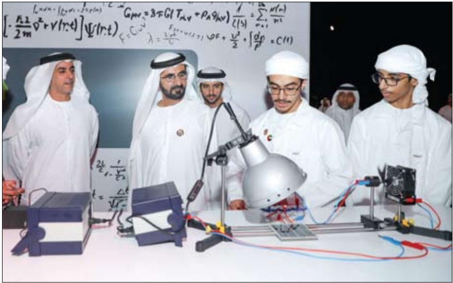
نائب رئيس الدولة خلال اطلاقه مشروع محمد بن راشد للتعليم الإلكتروني العربي (وام)

الحاكم في متقلبة العين و سمو الشيخ هزاع بن زايد آل نهيان نائب رئيس المجلس التنفيذي اليمين القانونية كل من سمو الشيخ ذياب بن محمد بن زايد آل نهيان رئيس دائرة النقل عضو المجلس التنفيذي و معالي سيف محمد الهاجري رئيس دائرة التنمية الاقتصادية عضو المجلس التنفيذي. (التفاصيل ص3)