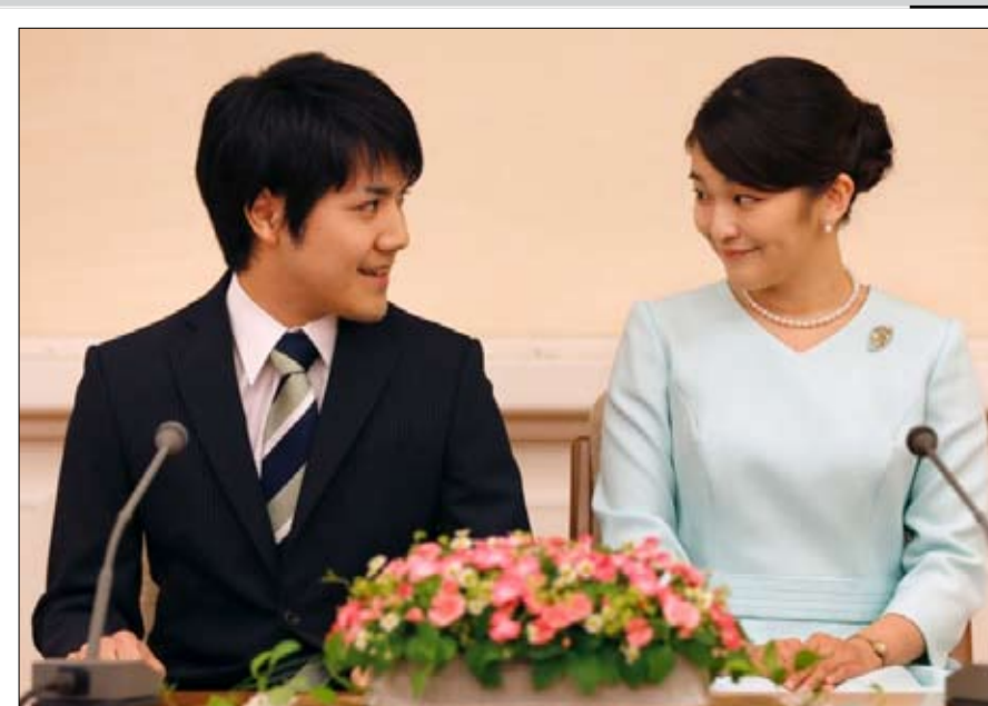
الاميرة ماكو وخطيبها سترحم من اللقب الامبراطوري

منعوا على الملوك، الذين كانوا يحكمون حتى وفاتهم. ويخشى الأعضاء الأكثر محافظة في الحزب الليبرالي الديمقراطي الحاكم بزعامة رئيس الوزراء شينزو آبي، أن يجبرهم النظر في مشروع قانون من هذا القبيل على فتح النقاش حول مسألة خلافة المرأة، التي تخضع لنفس احكام القانون