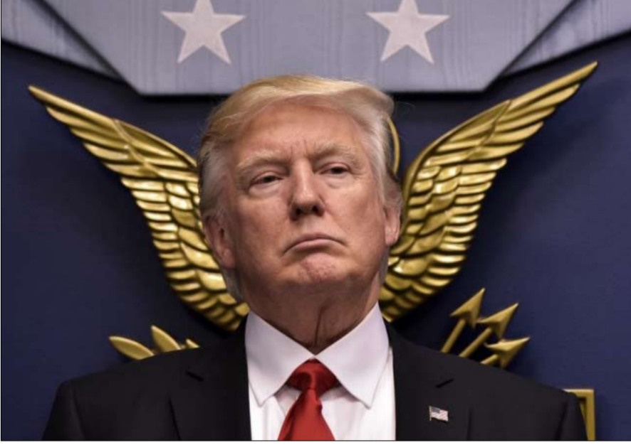
صاحب فن الصفة والاختيار الصعب