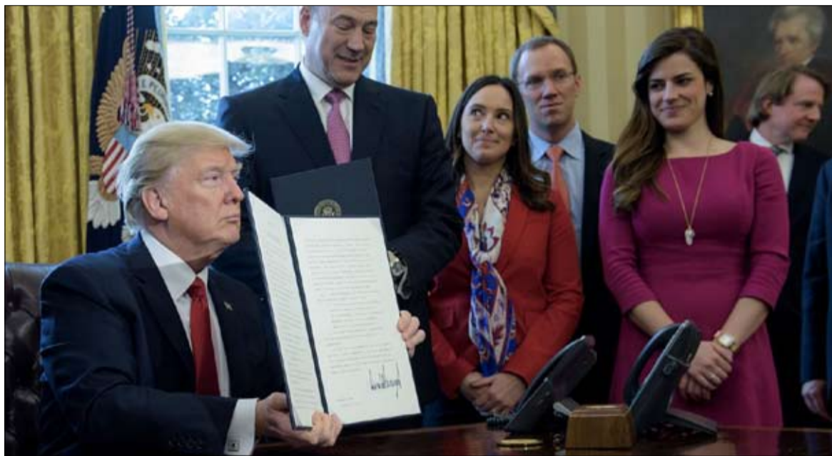
مراسم ترامب تحمل راحة انطون الرفض للاخ