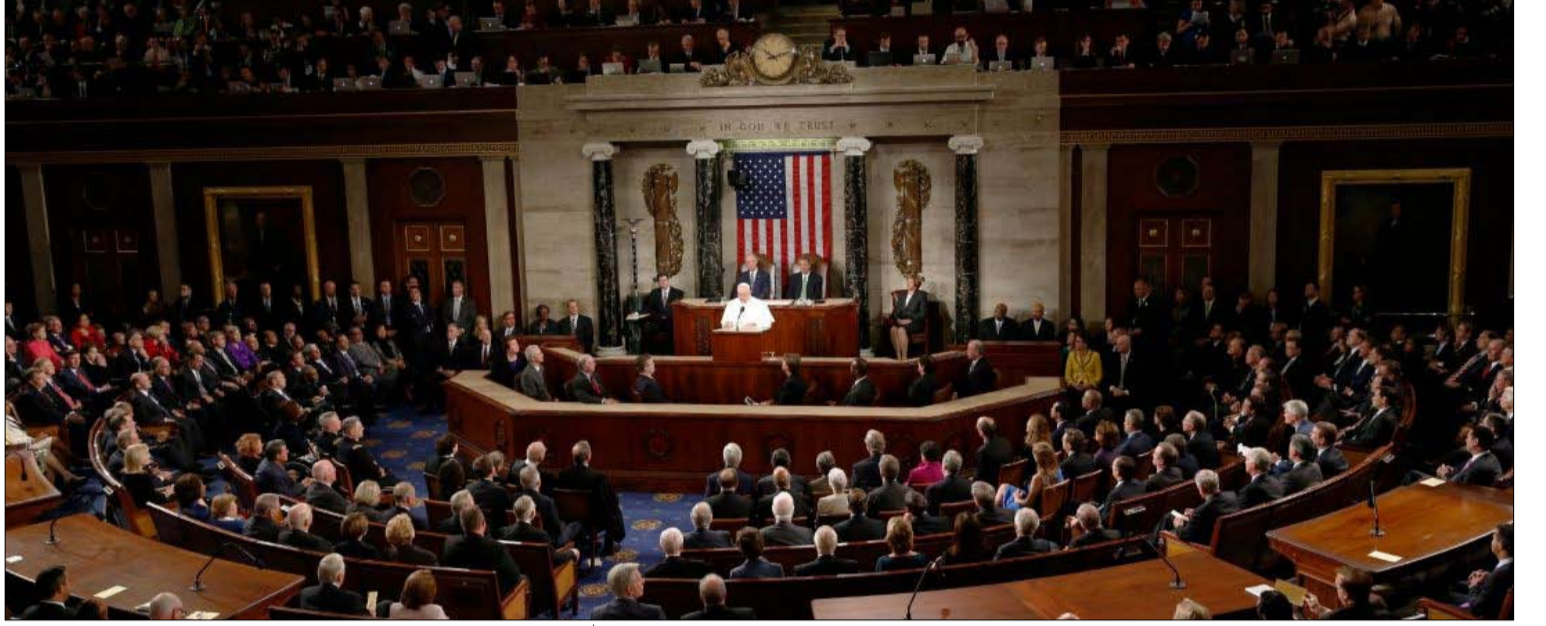
انتفاضة الكونغرس واردة

من المحامين، وتعزز التمييز حسب البلدان. وهكذا، سيتم فرض الضريبة على نفس المنتج المستورد من تايلاند أو بورما بشكل مختلف، حسب الاتفاقيات المبرمة مع كل بلد.