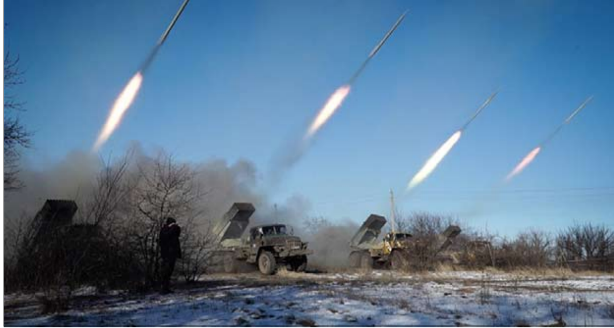
التصعيد ورقة كيبف لاختبار الإدارة الأمريكية الجديدة

دعم وزراء دفاع البرتغال وفرنسا وإيطاليا وإسبانيا دور حلف شمال الأطلسي خلال اجتماع لهم في مدينة بورتو البرتغالية. واجتمع الوزراء لبحث موقف موحد بشأن الحلف والعلاقات عبر الأطلسي بين أوروبا والولايات المتحدة قبل اجتماع مقرر في بروكسل يومي 15 و16 فبراير يجمع وزراء دفاع 28 دولة عضواً في حلف شمال الأطلسي ومنهم وزير الدفاع الأمريكي الجديد جيمس ماتيس. وقال وزير الدفاع الفرنسي جان إيف لو دريان خلال مؤتمر صحفي، إن لحلف شمال الأطلسي 3 مهام رئيسية: الأمن الجماعي وإدارة الأزمات والشراكة. هذه الدعام هي ركائزنا الرئيسية وهي ما زالت صالحة حتى يومنا هذا.