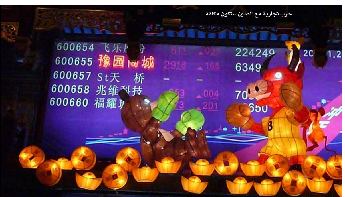
حرب تجارية مع الصين ستكون مكلفة