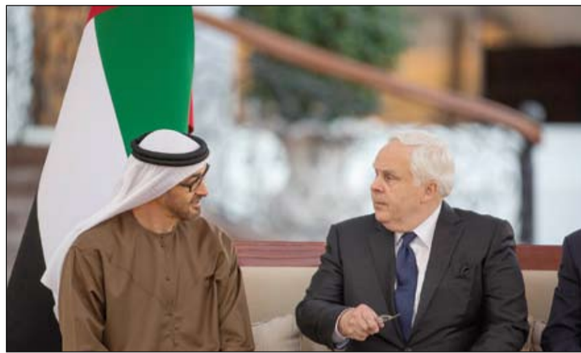
محمد بن زايد خلال استقباله رئيس شركة فيديكس

استقبل رئيس شركة فيديكس ورئيسة مجلس إدارة شركة آي بي إم