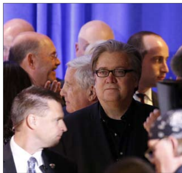
بانون وانطون لسان نظريات المؤامرة