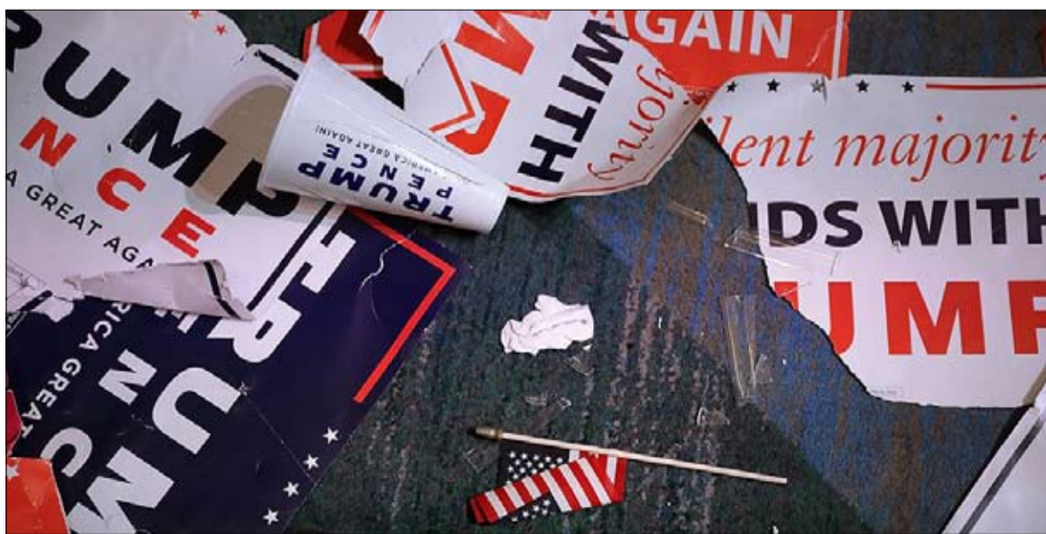
خلاص الجمهوريين في انتصار ترامب