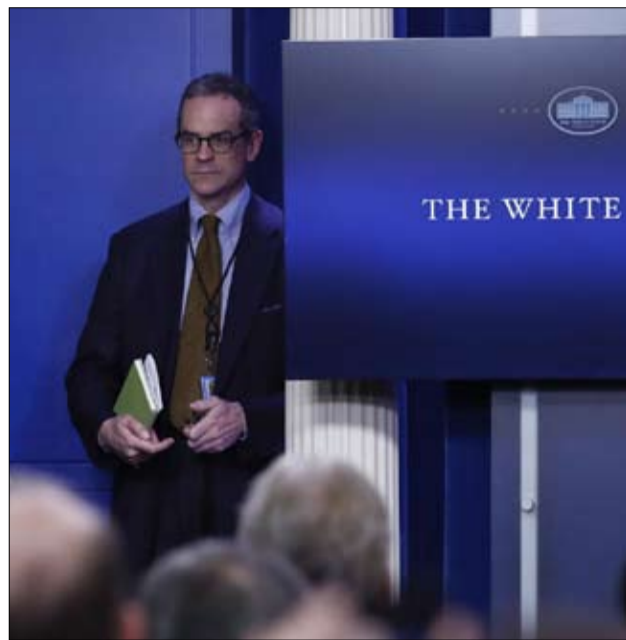
مايكل انطون..كشف المستور

ورفض آل تومكينز من معهد بوينتر للصحافة ومقره فلوريدا انتقادات ترامب. وقال التلميح بأن الصحفيين لا ينشرون لسبب أو آخر أخبار هجمات داعش أمر في غاية الغرابة.