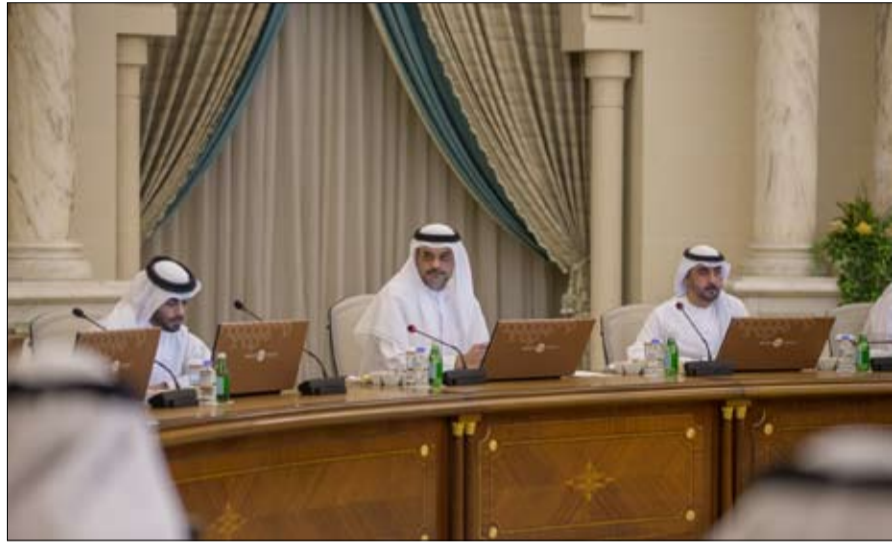
يتم تقديم أفضل الخدمات. ووجه المجلس بالأخذ بملاحظات السادة أعضائه.