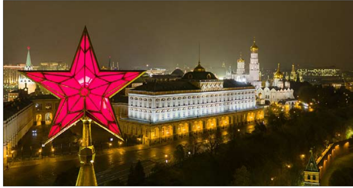
ليس من مصلحة روسيا زيادة منسوب التوتر