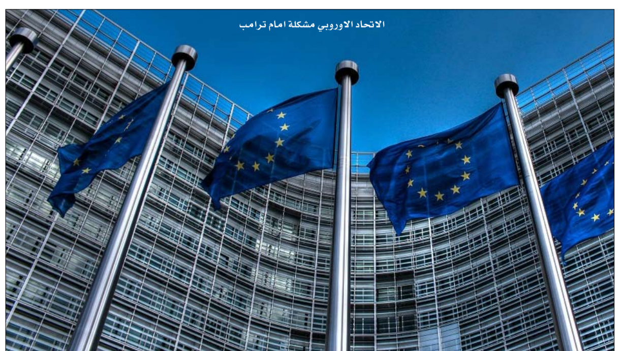
الاتحاد الأوروبي مشكلة ترامب