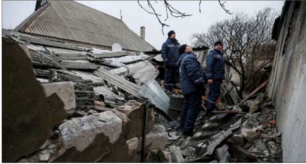
من اثار المناوشات الاخيرة