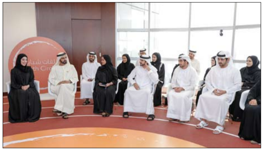
محمد بن راشد خلال لقائه شباب الإمارات

أبوظبي-وام: أصدر صاحب السمو الشيخ محمد بن زايد آل نهيان ولي عهد أبوظبي نائب القائد الأعلى للقوات المسلحة رئيس المجلس التنفيذي لإمارة أبوظبي قرارات بشأن رؤساء اللجان الفرعية التابعة للجنة التنفيذية بالمجلس التنفيذي. ية على سعيد آخر استقبال صاحب السمو الشيخ محمد بن زايد آل نهيان ولي عهد أبوظبي نائب القائد الأعلى للقوات المسلحة في قصر البحر وفد شركة فيديكس برئاسة فريدريك والاس المؤسس والرئيس التنفيذي للشركة. كما استقبل سموه في قصر الشاطئ مساء امس السيدة جيني روميتي رئيسة مجلس إدارة شركة آي بي إم العالمية والوفد المرافق. التفاصيل (ص2)