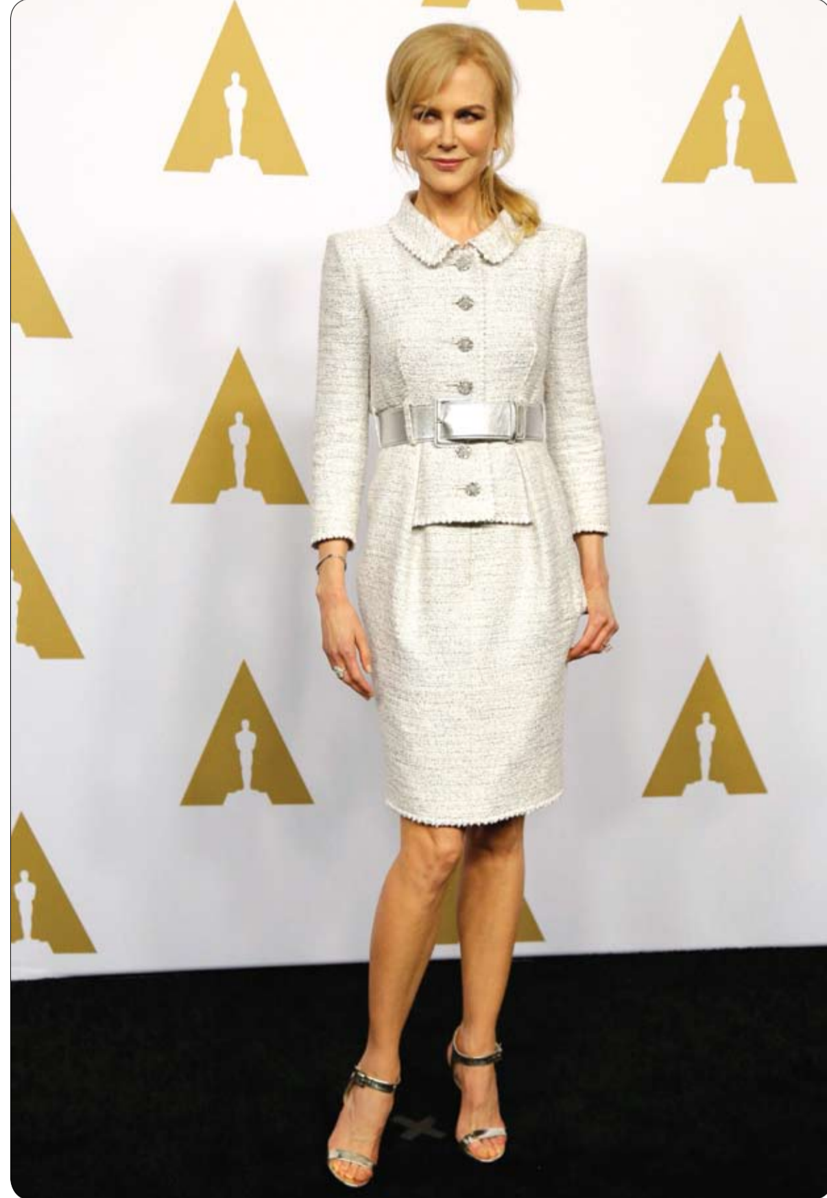
النجمة نيكول كيدمان لدى وصولها لحضور حفل الغداء السنوي الذي يضم جميع مرشحي جوائز الأوسكار في النسخة الـ 89 في بيفرلي هيلز بكاليفورنيا

وسيقول فريق متخصص من الصالة بالتنسيق مع شركة الطيران لشحن الحيوانات على متن الطائرات، الأمر الذي يقلص فترة الانتظار في بوابات المطار.