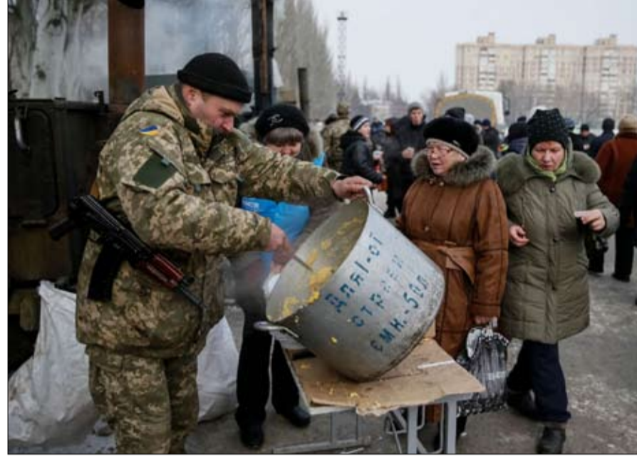
توزيع الغذاء مع عودة التوتر وانقطاع الكهرباء

فأي نصيب ودور تلعبه روسيا في اندلاع العنف؟ من دون إغفاء موسكو من مسؤولياتها في أصل الأزمة، فإن فلاديمير بوتين اليوم هو اقل المستفيدين من زيادة التوتر، تلاحظ الباحثة تاتيانا كاستويفا جون من المعهد الفرنسي للعلاقات الدولية، مشيرة إلى أن "العديد من الاتجاهات السياسية تتصارع في حاشية ترامب، وتصعيد التوتر قد يعزز أنصار الخط الأكثر عداء