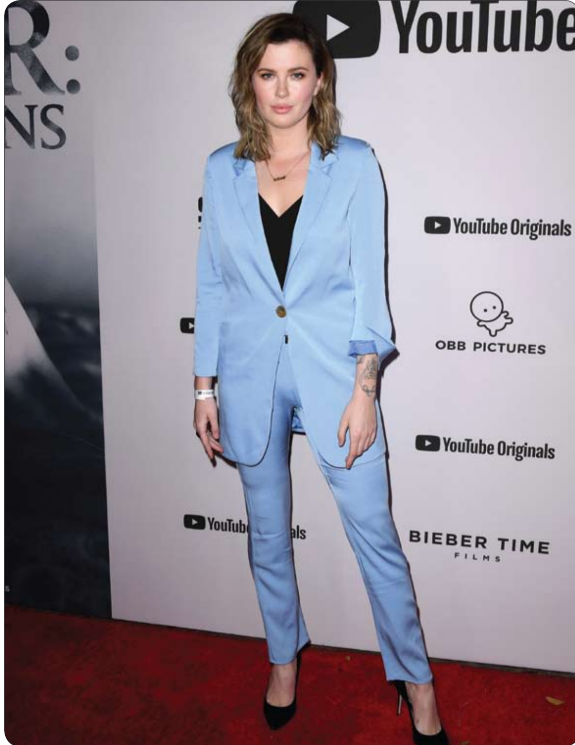
أيرلندا بالدوين خلال حضورها العرض الأول لفيلم «جوستين بيبر: موسم» في مسرح ريجنسي بروين بلوس أنجلوس، كاليفورنيا.