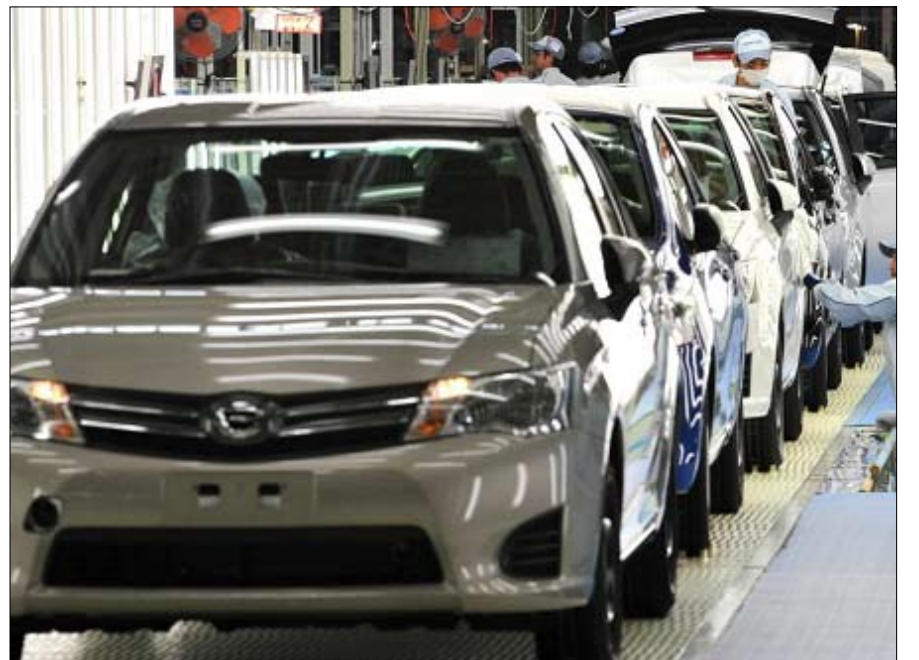
•• إسطنبول- وكالات:

أشار البيان أن تويوتا كورولا احتلت بهذا الرقم المركز الأول متفوقة على أكثر من 3 آلاف و500 طراز طرحته مختلف شركات تصنيع السيارات. وبدأت تويوتا كورولا، التابعة لشركة تويوتا للسيارات الإنتاج العام 1966 وما زالت حتى الآن، ومنذ العام 1997 أصبح طراز كورولا هو الأول عالمياً من حيث المبيعات. وتملك شركة تويوتا 16 مصنعاً لإنتاج السيارات، أحد تلك المصانع في تركيا، ولقيت منتجات الشركة رواجاً بسبب تصاميمها العملية، وجودة منتجاتها.