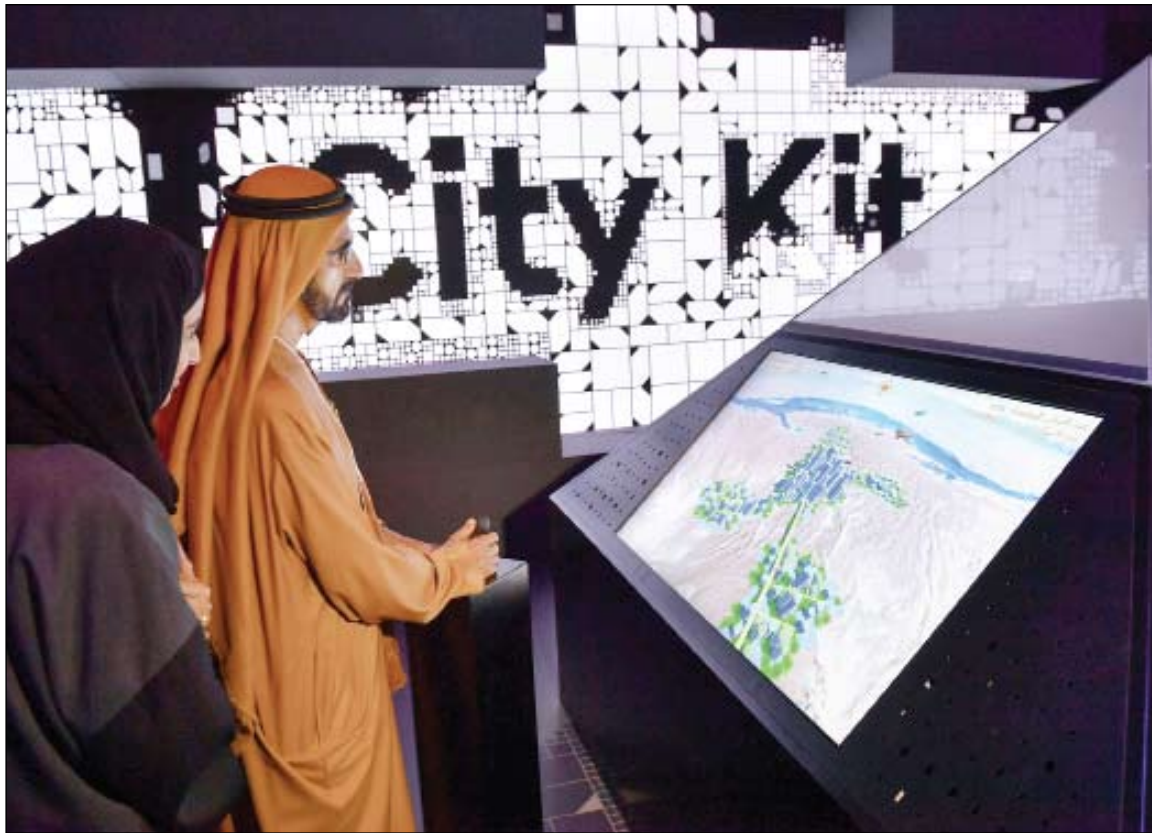
محمد بن راشد خلال افتتاحه متحف المستقبل المصاحب للقمة العالمية للحكومات