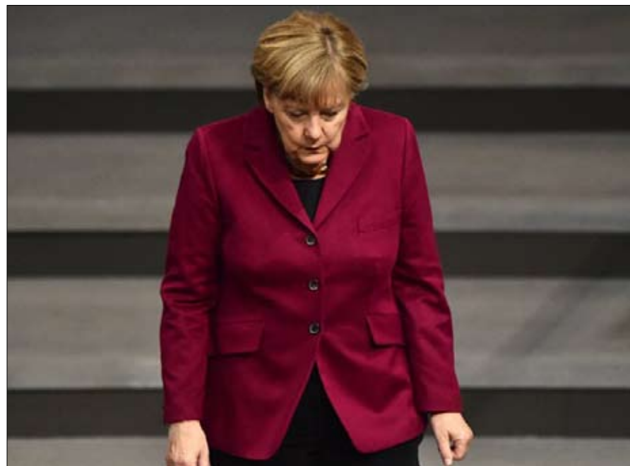
انجيليا ميركل.. على صفيح ساخن هذه المرة

في حياة هذا الأصلع الملتحي، والبدين، وصاحب النظارات الخالدة ذات الإطار الرقيق، والبالغ من العمر 61 عاما، يوم سابق في التاريخ، فاقت أهميته الأيام الأخرى، ليلة 26 يونيو 1980.