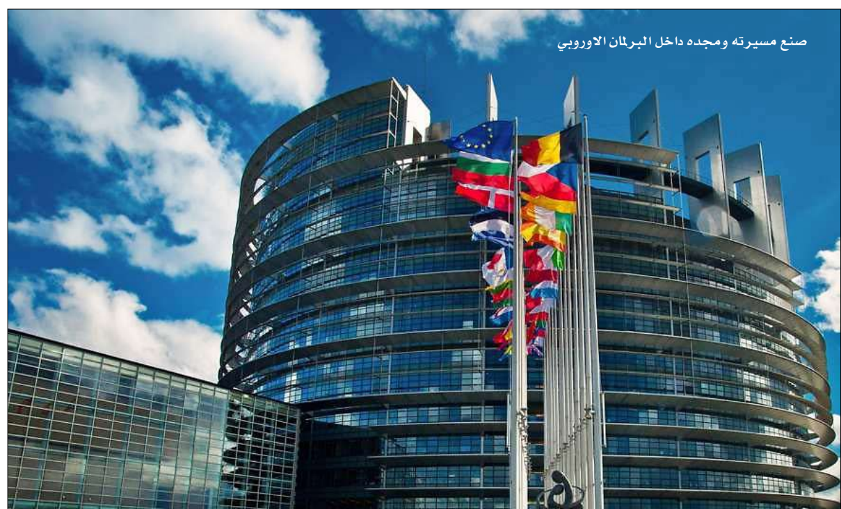
صنع مسيرته ومجده داخل البرلمان الأوروبي