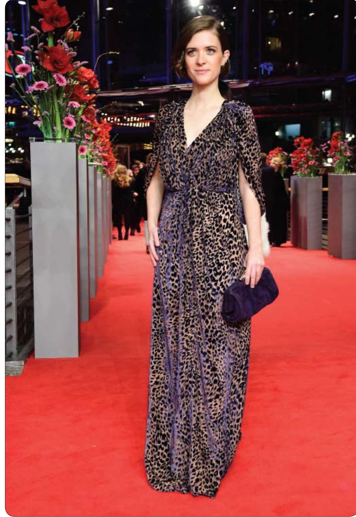
الممثلة الألمانية ليف-ليزا خلال حضورها افتتاح مهرجان برلين السينمائي مع العرض الأول لفيلم "Django". (أ ف ب)

قالت صحيفة جلوبال تايمز الصينية إن من المرجح أن تزيد الصين عدد الأفلام الأجنبية المسموح بعرضها في البلاد وهو خبر سار لمنتجي الأفلام الأمريكية الذين يتطلعون لدخول سوق السينما الصينية سريعة النمو. ونقلت الصحيفة الرسمية عن خبراء قولهم إنهم يتوقعون السماح بدخول نحو 12 فيلماً آخر لتصبح الحصص السنوية المسموح بها من الأفلام الأجنبية 34 فيلماً بينما سيحصل المنتجون الأجانب على نحو 40 في المئة من إيرادات شباك التذاكر مقارنة مع 20 بالمئة حالياً.