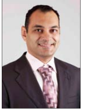
•• دبي- الفجر:

التقرير أن حجم السوق الإماراتي للمستحضرات الشخصية 7.6 مليار درهم، فيما بلغت حصة السوق العالمي للمستحضرات الشخصية 1.57 ترليون درهم حسب احصائيات 2015 ليورومونيتور. وقد تم تأسيس وإطلاق مجلس دبي الاستشاري لحماية الملكية الفكرية في نوفمبر 2015 بالشراكة بين القطاعين العام والخاص من أصحاب العلامات التجارية في إمارة دبي في قطاعات الأدوية وأجهزة الهاتف المتحركة والسيارات والملابس الرياضية والماكولات والبث التلفزيوني