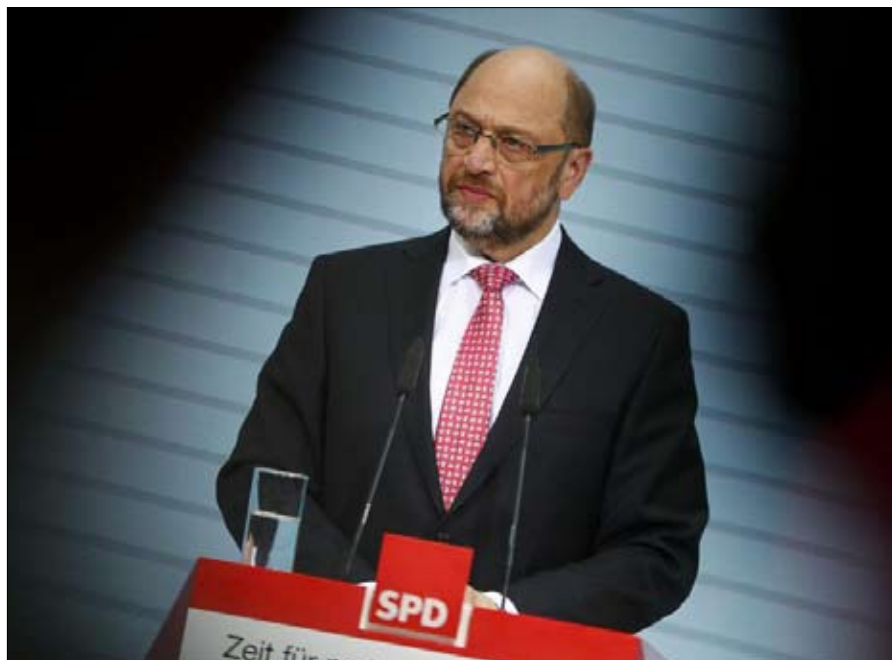
شولتز.. من التفكير في الانتحار.. الى حلم المستشارية

انجيليا ميركل دون أن يحتاج إلى إضافة المزيد.