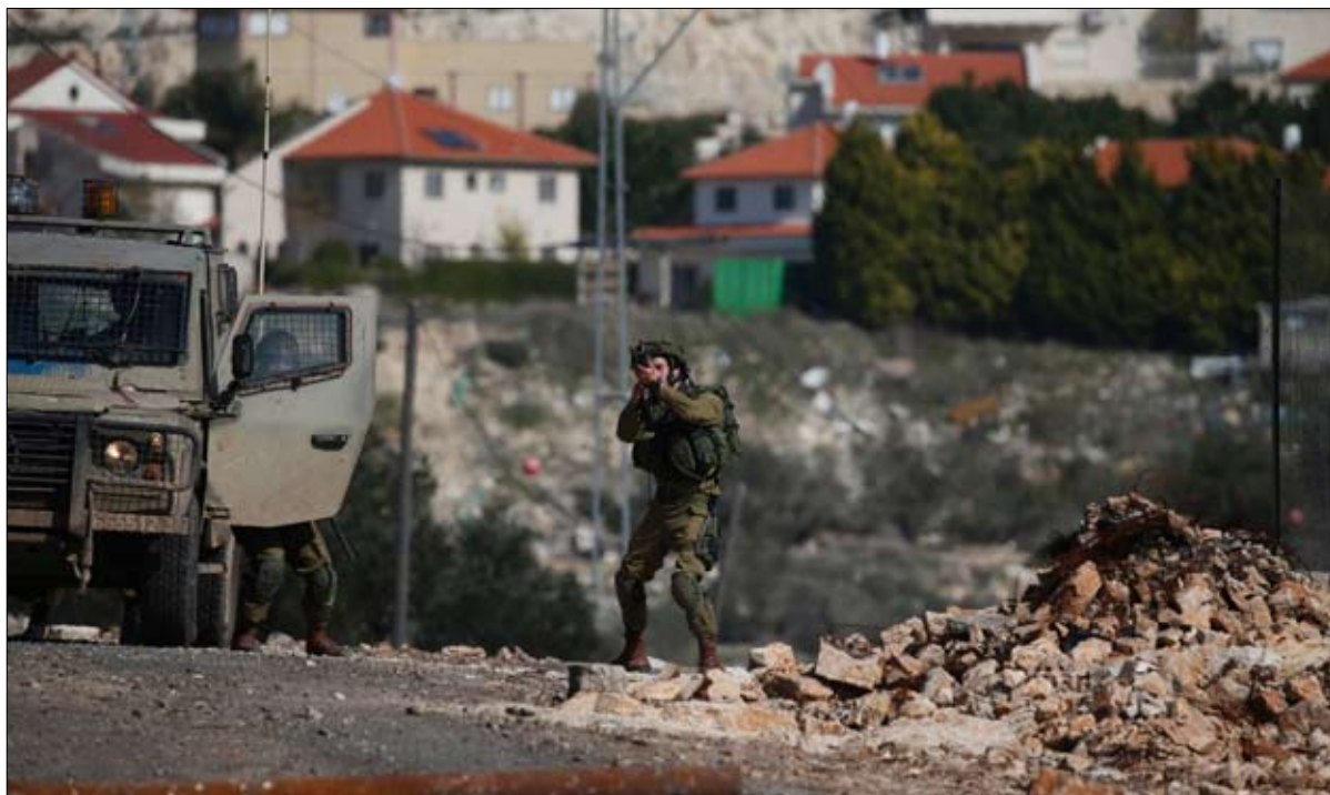
•• فلسطين المحتلة-وكالات: