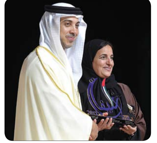
أسرة جامعة زايد تعرب عن اعتزازها