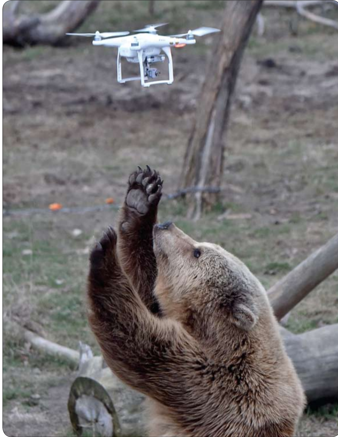
دب بني يتفاعل مع طائرة بدون طيار أطلقها زائر في محمية للدببة الذين تم انقاذهم من السيرك والمطاعم الخاصة في أوكرانيا، بالقرب من زيتومير، على بعد 150 كم غرب كييف.