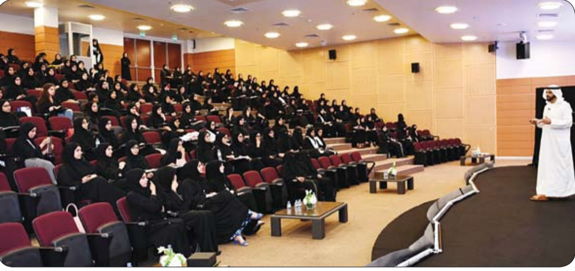
لتعزيز ثقافة السعادة