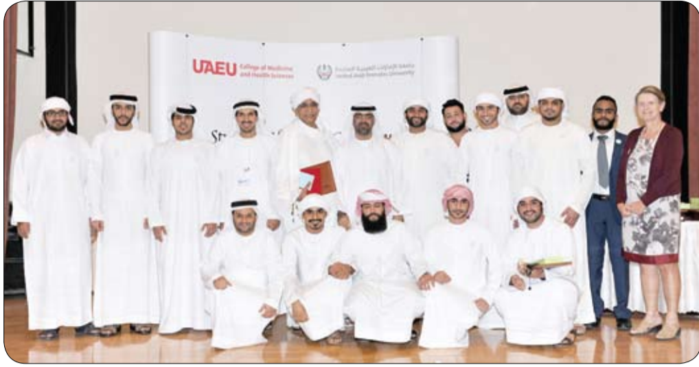
بحضور مدير الجامعة

أطلقت الشبيخة الدكتورة شما بنت محمد بن خالد آل نهيان رئيس مجلس إدارة مؤسسات الشيخ محمد بن خالد آل نهيان الثقافية والتعليمية سلسلة محاضراتها تحت عنوان الأخلاق وبناء المستقبل والتي بادرت بتقديمها لطلاب المدارس الحفلات الثانية والثالثة توجيهاً لمبادرة صاحب سمو الشيخ محمد بن زايد آل نهيان ولي عهد أبوظبي نائب القائد الأعلى للقوات المسلحة والتي أقر فيها سموه بتدريس مادة التربية الأخلاقية في المدارس. قدمت الشبيخة شما محاضرتها الأولى بمدارس أم الإمارات بمدينة العين والتي كان اختيارها لتكون نقطة انطلاق لما لإسم المدرسة من رمزية تشير لسما الشبيخة فاطمة بنت مبارك وما تتمتع من قيمة عظيمة في بناء حاضر ومستقبل دولة الإمارات العربية المتحدة. وكانت المحاضرة تحت عنوان (الأخلاق روح الهوية الوطنية) وقد قدمت الشبيخة الدكتورة شما للمحاضرة قائلة (وأنا قادمة إليكم شعرت بالسعادة، لأنني سألتقي ببنات ولحمي اللاتي سيكون بين أيديهم المستقبل، لأنظلكم خبرتي التي تربيت عليها على أرضنا الطيبة، وطن الخير والسعادة، وطن التسامح والسلام، وطني دولة الإمارات العربية المتحدة.)