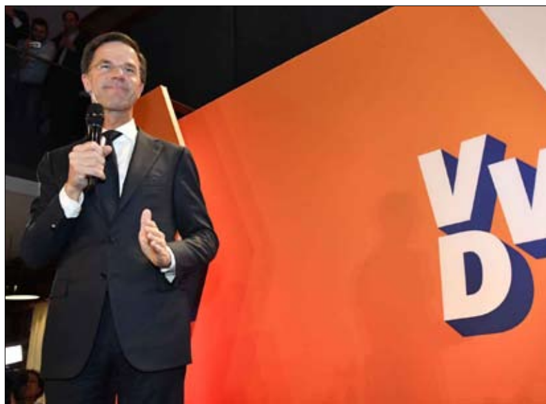
مارك روت قطع الطريق و اجضض صعود الشعبويين