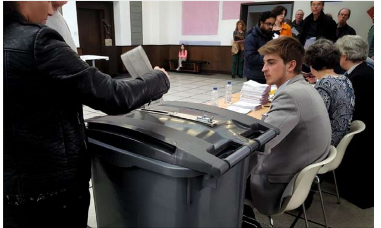
صناديق الاقتراع كذبت استطلاعات الراي