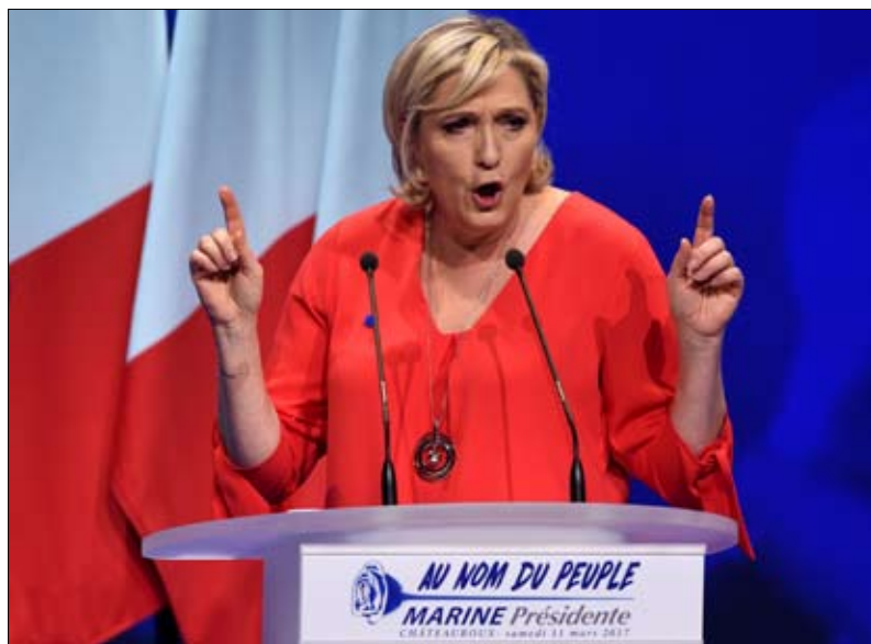
مارين لوبان والحسابات المغلوطة