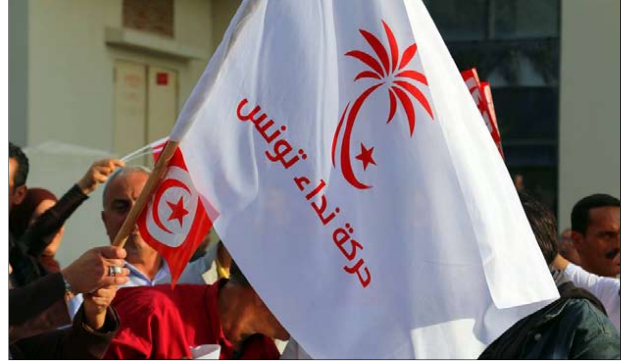
راية نداء تونس هل تنتكس من جديد؟

ونبه إلى أن هذه التسريبات من شأنها أن "تمس مباشرة من هيبة الدولة واستقرارها وتنعكس سلبا على مؤسساتها