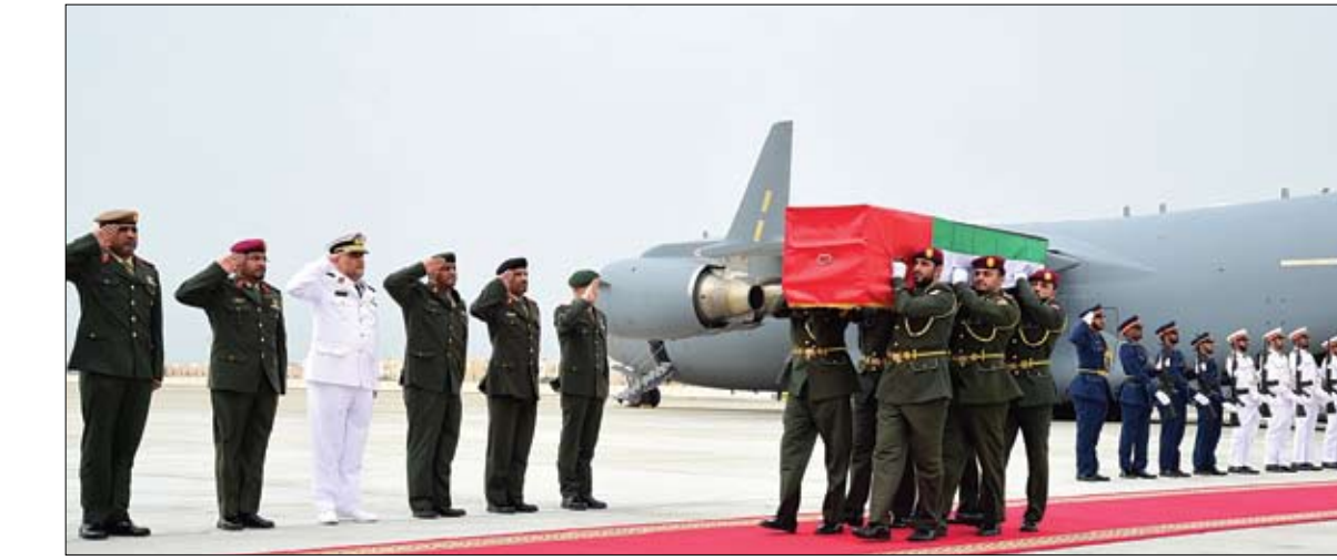
المراسم العسكرية الخاصة باستقبال جثمان الشهيد في مطار البطين الخاص (وام)

ورد وزير الخارجية الأمريكي على سؤال عن عمل عسكري بالقول إذا صدقوا تهديد برنامج أسلحتهم إلى مستوى تعتقد أنه يستدعي التحرك فذلك الخيار مطروح على الطاولة. ودعا تيلرسون الصين إلى تطبيق عقوبات على كوريا الشمالية وذكر أنه ليس هناك حاجة لأن تعاقب كوريا الشمالية على نشر منظومة صواريخ على كوريا الشمالية وتهدف أمريكية مضادة للصواريخ تهدف من خلالها إلى الدفاع عن نفسها في مواجهة كوريا الشمالية. وتعتبر الصين الرادار القوي للمنظومة الصاروخية الأمريكية الشمالية.