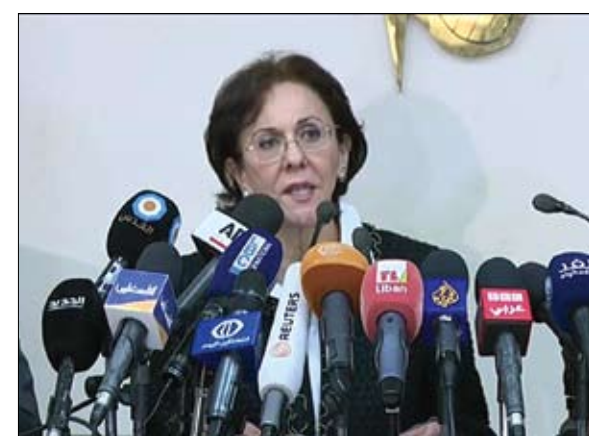
ريما خلف تتحدث الى الصحفيين

المتحدة أن نظاما ما يمارس الفصل العنصري أو الأبارتايد. وأشارت إلى أنه خلال السنوات الماضية، وصفت بعض ممارسات إسرائيل وسياساتها بالعنصرية، بينما حذر البعض من أن تصبح إسرائيل في المستقبل دولة فصل عنصري. مضيفة أن قلة هم من طرح السؤال عما إذا كان نظام الفصل العنصري واقعا مثلما في تعامل إسرائيل مع الفلسطينيين اليوم. وطلبت الأمانة العامة للأمم المتحدة سحب التقرير الصادر عنها قبل يومين، والذي يدين إسرائيل باعتماد سياسة الفصل العنصري تجاه الفلسطينيين. كما طالبت أميركا بسحب التقرير وهددت باتخاذ إجراءات. وكانت الإسكوا أعدت تقريرا عن الممارسات الإسرائيلية تجاه الشعب الفلسطيني ومسألة الفصل العنصري (الأبارتايد). يمكن الاطلاع عليه باللغة العربية من هذا الرابط، وبالإنجليزية من هذا الرابط. وكان المتحدث باسم الأمم المتحدة ستيفان دوجاريك قال إن التقرير الذي قدمته لجنة الأمم المتحدة الاقتصادية والاجتماعية لغرب آسيا (إسكوا)، نشر دون أي مشاور مسبق مع أمانة الأمم المتحدة، ولا يعكس وجهة نظر الأمين العام أنطونيو غوتيريش. وطالبت السفارة الأمريكية في الأمم المتحدة نيكى هالي بسحب التقرير، قائلة إن سكرتارية الأمم المتحدة كانت محقة في النأي بنفسها عن هذا التقرير، ولكن يجب أن تخطو خطوة أخرى وتسحبه بأكمله. وكان وزير الخارجية الأمريكي ريكس تيلرسون أعلن في رسالة وجهها إلى ثماني منظمات للدفاع عن حقوق الإنسان، أن الولايات المتحدة ستسحب من مجلس حقوق الإنسان في الأمم المتحدة ما لم يجر إصلاحات كبيرة داخله.