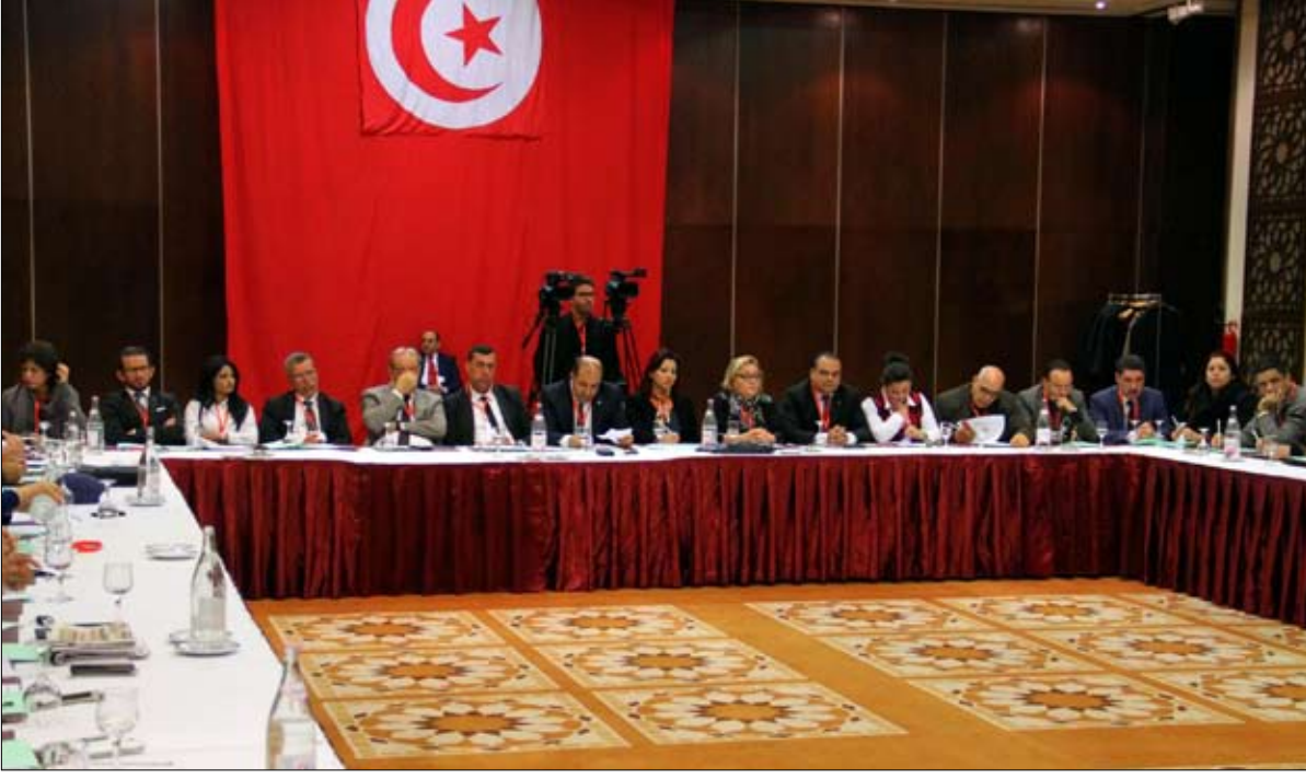
صراع داخلي في اسفل درجاته

وصورتها في الخارج، لافتا إلى أن مثل هذه التجاوزات تستدعي إجراءات حازمة وجادة في الدول التي تحترم شعبيها وتحترم مبادئ الديمقراطية..