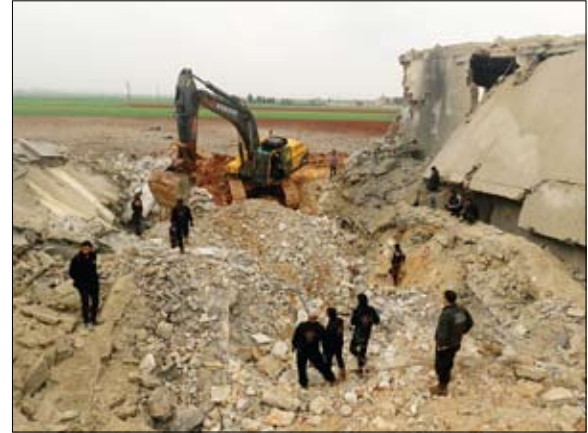
رجال الاقفايشتون عن ناجين تحت الاقفاش عقب قصف المسجد في حلب

من جهة أخرى، أعلن جيش النظام السوري أمس أنه أسقط طائرة حربية إسرائيلية وأصاب أخرى، بعد غارة جوية إسرائيلية استهدفت موقعا عسكريا على طريق تدمر وسط سوريا، بعد أن أقرت إسرائيل للمرة الأولى بشن غارات فيها. ونقلت وكالة الأنباء السورية التابعة للنظام (سانا)، عن بيان القيادة العامة للجيش والقوات المسلحة التابعة للنظام، القول إن طائرات للعدو الإسرائيلي أهدمت فجر أمس على اختراق مجالنا الجوي في منطقة البريج عبر الأراضي اللبنانية، واستهدفت أحد المواقع العسكرية على اتجاه تدمر في ريف حمص الشرقي.