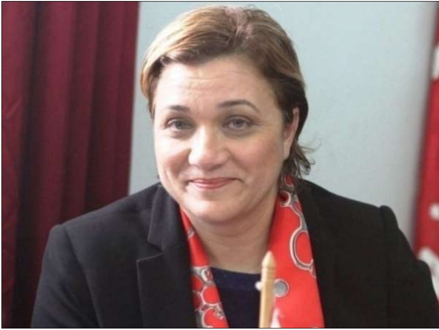
متهمة حتى اشعار اخر