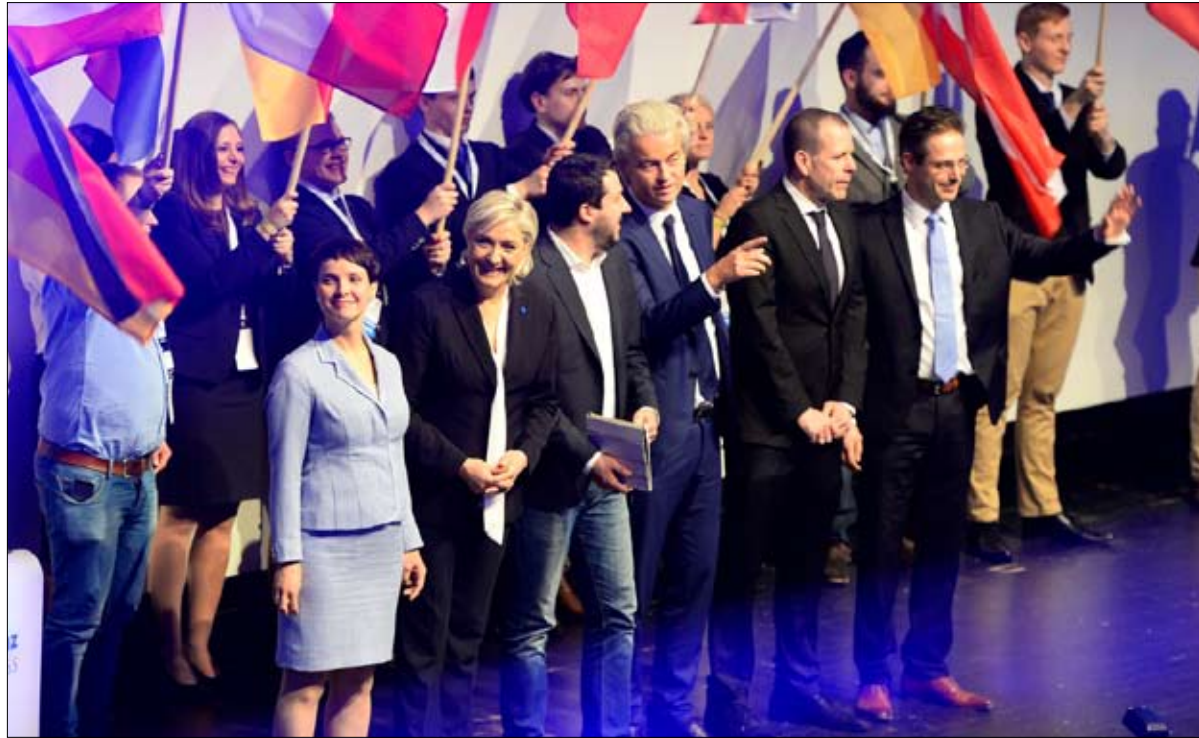
أوروبا الشعبية لم تنضج بعد