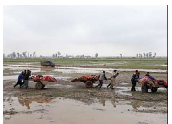
عراقيون ينقلون جثامين ضحايا احدى الغارات على الموصل

أعلنت القوات العراقية أنها سيطرت على نقاط داخل المدينة القديمة غربي الموصل، لكنها تواجه مقاومة عنيفة من تنظيم داعش الإرهابي الذي يحاول إعاقتها، خاصة باستخدام العريبات الملغمة. وقال متحدث باسم الشرطة الاتحادية إن الشرطة وقوات الرد السريع سيطرت بالكامل على جامع الأباشا وضارح العدالة وسوق باب السراي داخل المدينة القديمة وسط الموصل على الضفة الغربية من نهر دجلة.