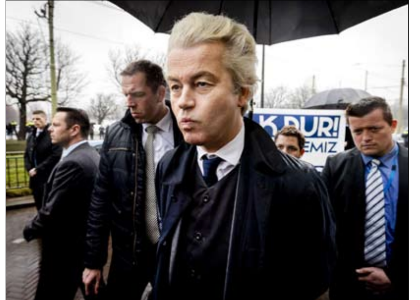
حلم فيلدرز لم يتحقق