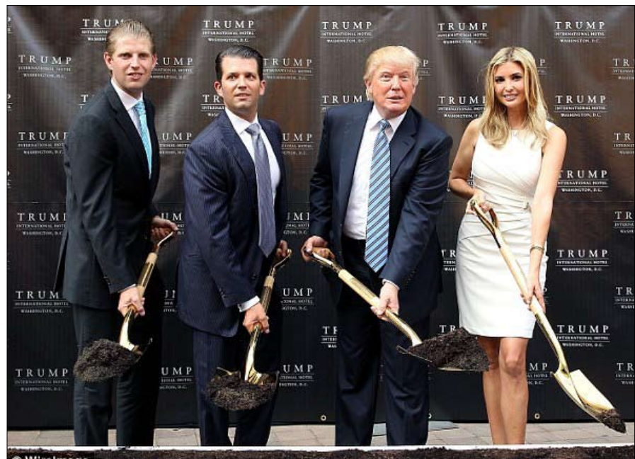
الابناء الثلاثة في انتظار كتاب الام