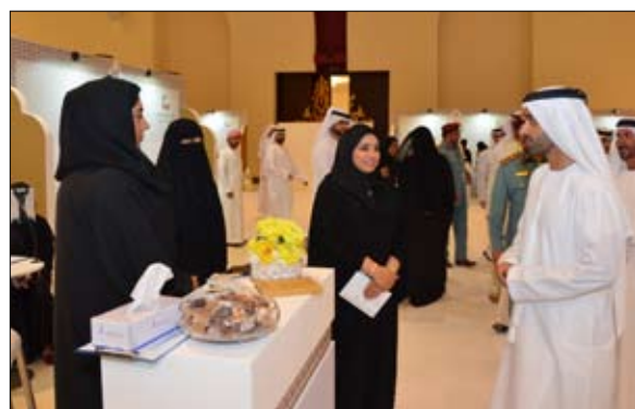
عمل جاذبة للمواطنين في مختلف

عمل للمواطنين، وتعريف شباب الخريجين بمتطلبات سوق العمل، فضلا عن توفير الوقت والجهد في البحث عن العمل، خصوصا مع مشاركة مثل هذا العدد من المؤسسات الحكومية ومؤسسات القطاع الخاص في العرض، وهو ما يساعد بدوره هذه المؤسسات على اختيار ما يناسبها من المتقدمين لفرص العمل التي تلائمهم. وشهد المعرض هذا العام مشاركة عدد كبير من مختلف الدوائر والمؤسسات المحلية والاقتصادية الحكومية ومؤسسات القطاع الخاص والمؤسسات المصرفية في الدولة، والتي عرضت فرص عمل متنوعة في إطار جهودها لتعزيز التوطين. وتعد معارض التوظيف منصة استراتيجية لتسهيل التواصل والتفاعل الناتج بين مؤسسات القطاعين الحكومي والخاص من جهة، والشباب المواطنين الباحث عن عمل من جهة أخرى.