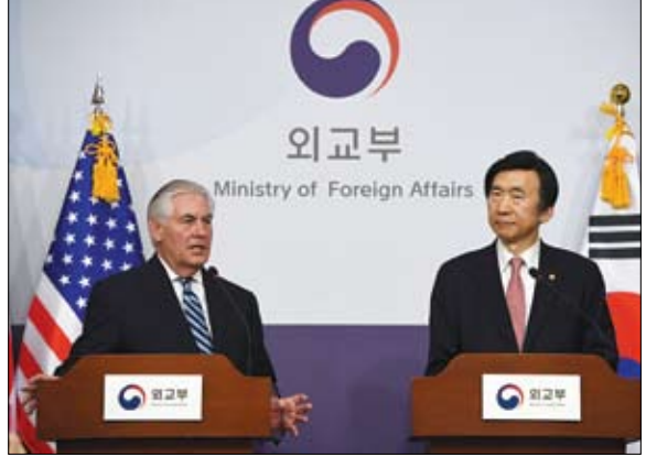
وزيرا خارجية امريكا وكوريا الجنوبية خلال مؤتمرهما الصحفي

ورد وزير الخارجية الأمريكي على سؤال عن عمل عسكري بالقول إذا صدقوا تهديد برنامج أسلحتهم إلى مستوى تعتقد أنه يستدعي التحرك فذلك الخيار مطروح على الطاولة. ودعا تيلرسون الصين إلى تطبيق عقوبات على كوريا الشمالية وذكر أنه ليس هناك حاجة لأن تعاقب كوريا الشمالية على نشر منظومة صواريخ على كوريا الشمالية وتهدف أمريكية مضادة للصواريخ تهدف من خلالها إلى الدفاع عن نفسها في مواجهة كوريا الشمالية. وتعتبر الصين الرادار القوي للمنظومة الصاروخية الأمريكية الشمالية.