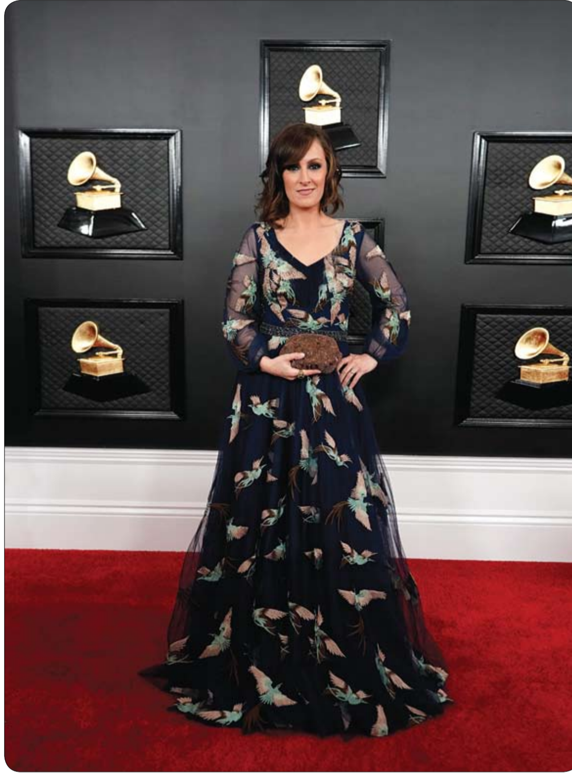
سارة جزارك خلال حضورها مهرجان جوائز جرامي في لوس أنجلوس، كاليفورنيا.