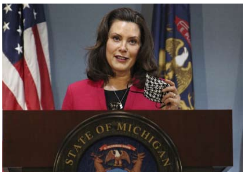
جريتشن ويتمان... مستعدة لانها بيضاء