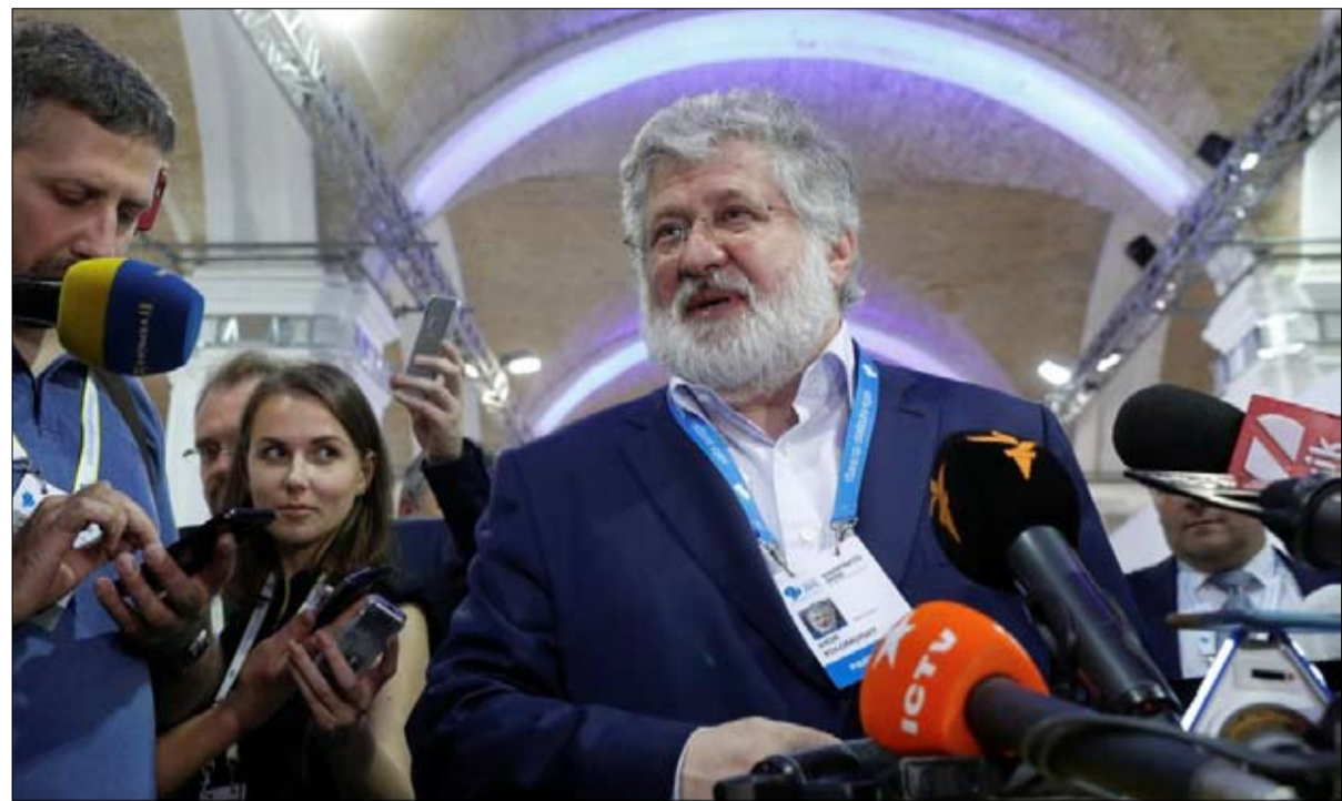
إيهور كولوموسيكي مناضل اخر