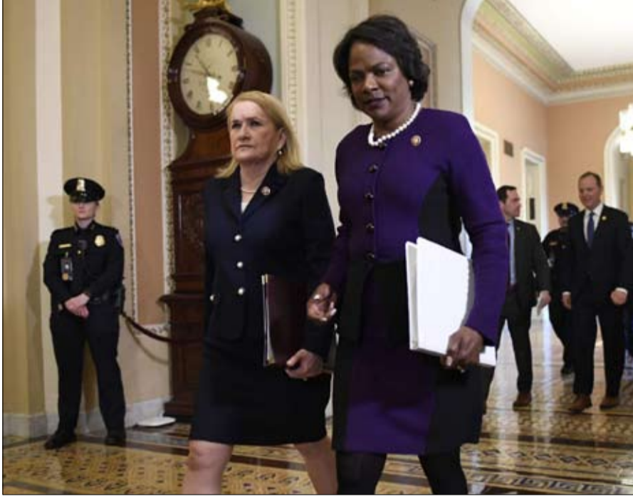
فال ديمينغز على القائمة ابيض