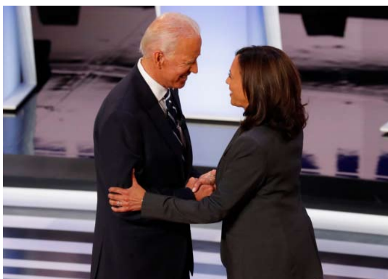
كامالا هاريس تظل الأوفر حظاً