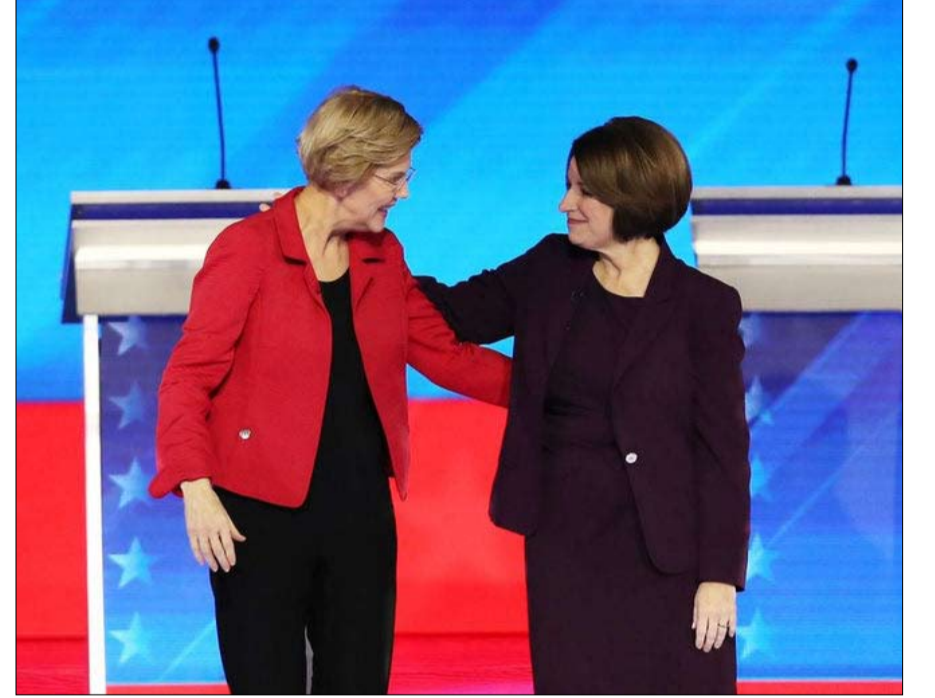
المنطق المتبع سيستبعد إيمي كلوبوشار واليزابيث وارن

كامالا هاريس، الأوفر حظاً ولكن ربما من جهة أقلية أخرى، علينا أن نبحث عن اللؤلؤ النادرة المستقبلي. لأن الأوفر حظاً تبقى كامالا هاريس، وهي ابنة مهاجرين من جامايكا ومن الهند، كاريزمية، شابة (55 عاماً)، من ذوي الخبرة (مدعية عامة سابقة وحالياً عضو مجلس الشيوخ في كاليفورنيا)، تقدمية معتدلة، نسوية، تضع علامة على جميع المربعات... باستثناء أن هجماتها ضد بايدن في بداية الانتخابات التمهيدية بشأن المسألة العرقية، قد تكلفها المنصب، حتى وإن عادت المياه إلى مجاريها بينهما منذئذ. أخيراً وليس آخراً، يراهن جان إريك برانا على منافس من الدرجة الثانية من "لاتينا"، ميشيل لوجان غريشام، 60 عاماً، حاكمة ولاية نيو مكسيكو بعد ست سنوات في الكونغرس، بالتأكيد أقل شهرة من كامالا هاريس، فإن لهذه السياسية المتمرس، المعتادة على كواليس واشنطن، فضيلة هائلة، مساعدة بايدن على استقطاب تصويت اللاتينوس الذي يفترق إليه جزئياً، وإقامة "جدار" رمزي ضد ترامب، الذي بنى حملته عام 2016 على وعد بإقامة حاجز ضخم لمنع "الرجال القذرين" المكسيكيين من دخول الولايات المتحدة.