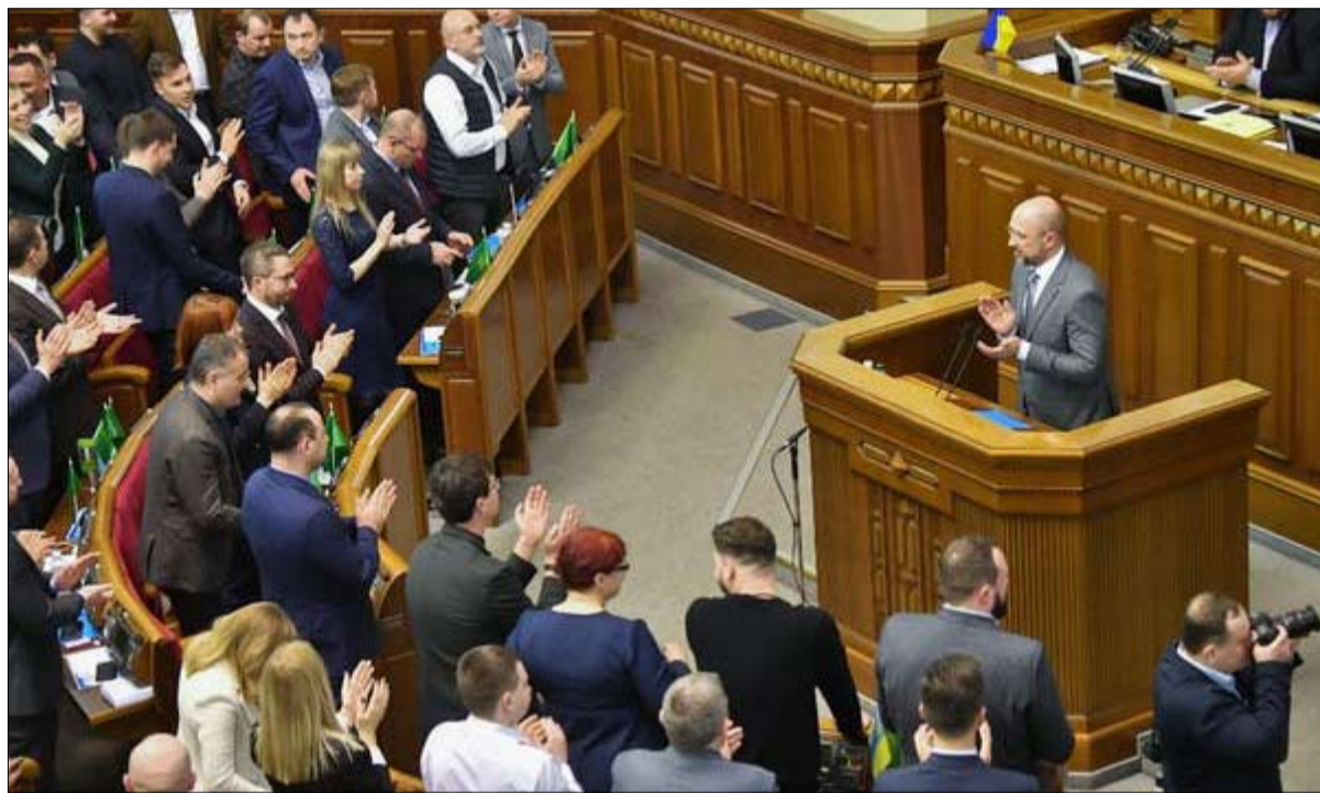
رئيس الوزراء الجديد