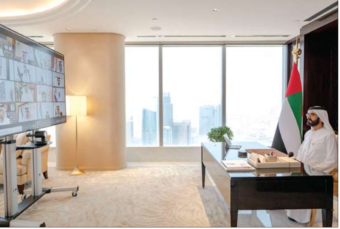
محمد بن راشد خلال ترؤسه اجتماع مجلس الوزراء بتقنية الاتصال المرئي عن بعد (وام)

•• دبي- وام: أكد صاحب السمو الشيخ محمد بن راشد آل مكتوم نائب رئيس الدولة رئيس مجلس الوزراء حاكم دبي رعاه الله على فخره بمجتمع الإمارات بمختلف فئاته من مواطنين ومقيمين، والذي استطاع أن يمضي يدا بيد مع الحكومة بمختلف جهاتها، وأن يكون داعما لجهودها وأجرائها، وأن يساهم بأدوار مختلفة نحو تحقيق هدف واحد، وهو أن تكون دولة الإمارات الأفضل تعافيا بعد انتهاء أزمة فيروس كورونا المستجد. كما أكد سموه أن حكومة الإمارات أثبتت مع عودة الأعمال والأنشطة الاقتصادية في مختلف القطاعات أنها حكومة مستقبلية، تستطيع بفضل أبنائها وكوادرها أن تواكب كافة المستجدات، وقادرة بفضل أنظمتها وبنيتها التحتية أن تتأقلم مع مختلف التحديات. جاء ذلك خلال ترأس سموه صباح أمس - الأحد - اجتماع مجلس الوزراء الذي عقد بتقنية الاتصال المرئي عن بعد، حيث شد سموه في بداية الاجتماع على أن كل فرد في الإمارات بلا استثناء لديه اليوم دور داعم للجهود الوطنية وفرق العمل في مختلف القطاعات، حيث قال سموه: في الإمارات تطلعاتنا كبيرة.. وهممنا عالية.. والأهم من ذلك أن حكومتنا مرنة واستباقية.. وكفاءتنا وفرق عملنا على قدر المسؤوليّة. كما قال سموه: فريق حكومة الإمارات في مقدمة الصفوف.. قريب من المواطن والمقيم.. يحسن من خدماته.. ويجدد في قراراته.. والهدف هو بناء مستقبل يليق بأجيالنا القادمة بإذن الله. وأضاف سموه: العمل في حكومة الإمارات مستمر من الميدان.. وعن بعد.. بأسلوب جديد.. وأدوات مستقبلية.. ولا مكان للطرق القديمة في منظومتنا. (التفاصيل ص2)