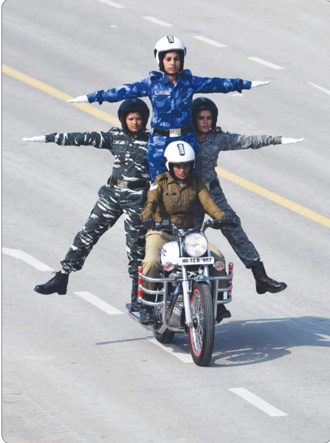
أعضاء من فريق الشرطة الاحتياطية النسائية التابع لقوة الاحتياط المركزي (CRPF) يقمن بعرض أثناء الاحتفال بيوم الجمهورية في نيودلهي.

بدأت إنجلترا مرحلة الحريات العامة عندما اقر البرلمان البريطاني تبني ميثاق الحقوق في 231-9861.