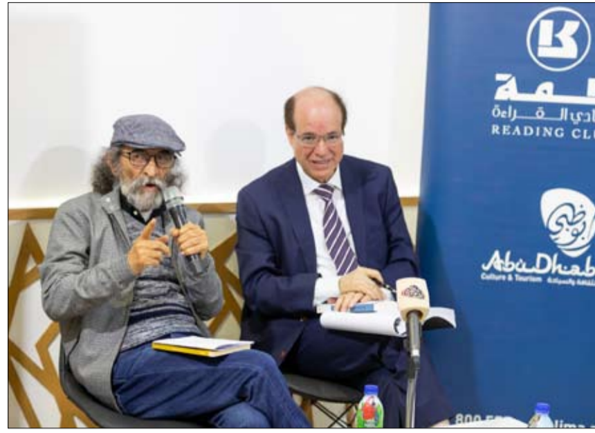
ضمن مشاركتها في معرض القاهرة الدولي للكتاب