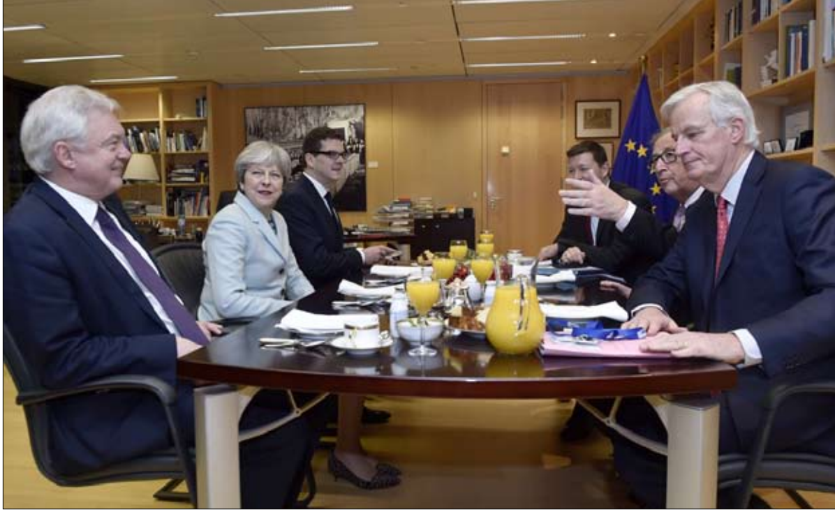
الاتفاق.. بعد طول انتظار