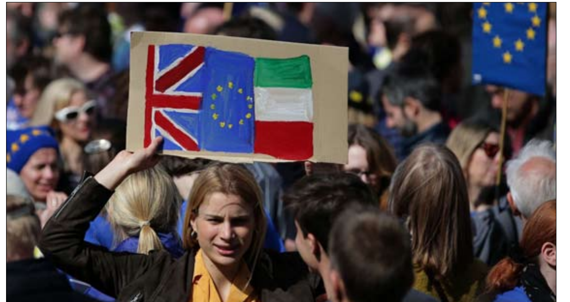
الحدود الإيرلندية شوكة اخرى في خاصرة البريكسيت