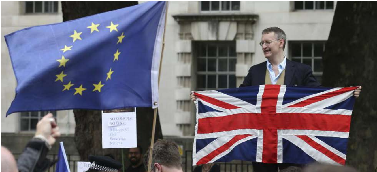
لطلاق فاتورته ومناعبه ومفاجاته