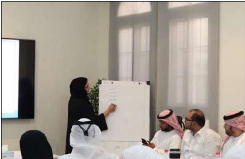
ضمن برامج الجائزة لإعداد المؤسسات على العمل التطوعي