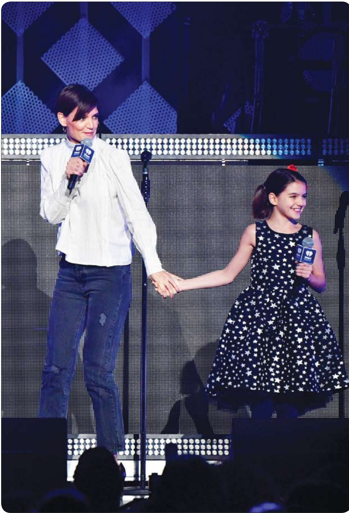
كاتي هولمز وسوري كروز يتحدثان إلى الجمهور على خشبة المسرح في مدينة نيويورك.