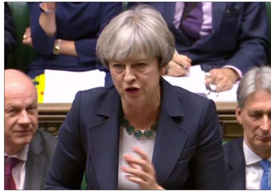
تيريزا ماي.. ليس بالامكان احسن مما كان

إيرلندا. وقد خلق هذا المشروع توترات يمكن أن تقوض السلام الذي تحقق بشق الأنفس. وهنا أيضا، يسجل الاتفاق المبدئي تنازل السيدة ماي. ومع ذلك، تبقى الحاجة لاختراع الحل، اذ يجب اقامة حدود جمركية، ويجب مراقبة الأشخاص الذين سيتنقلون بين المنطقتين. «لا يمكن الاحتفاظ بحدود