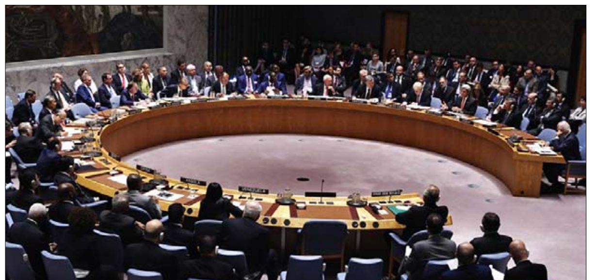
لا تأخير لعقوبات مجلس الامن على بيونغ يانغ