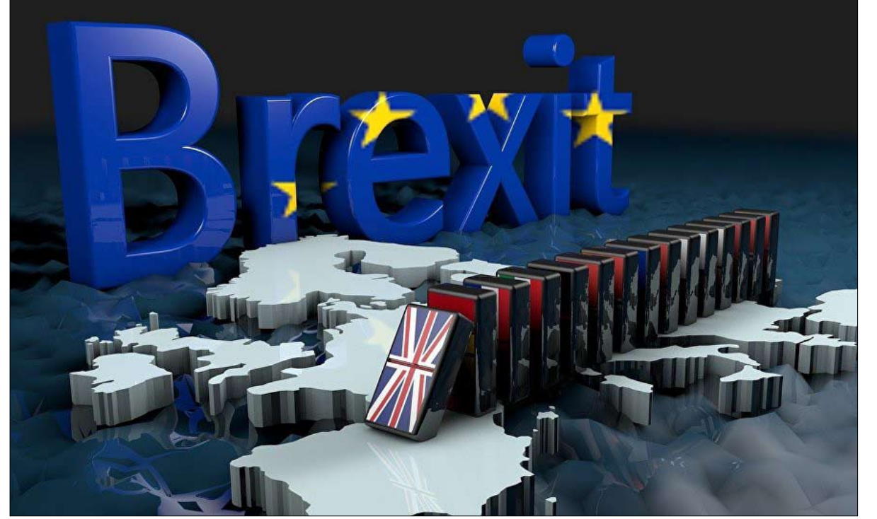
البريكسيت.. الصحوة المرة لانصاره

التي لا تتطلب مهارات، والتي يشغلها مهاجرون من الكومنولث أو وسط وشرق أوروبا.. والتخلص منهم سيخلق صدمة للاقتصاد البريطاني. وهذا ينطبق أيضا على عالم المال والأعمال، الذي يوظف عددا كبيرا من الأجانب، أو ايضا الجامعات - المملكة المتحدة اقتصاد حقيقي للتعليم العالي، وتستضيف اعدادا كبيرة من الطلاب والاساتذة والباحثين.