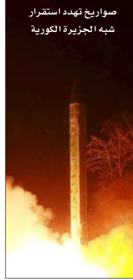
صواريخ تهدد استقرار شبه الجزيرة الكورية

وصل وزير الخارجية البريطاني بوريس جونسون إلى إيران أمس حيث من المتوقع أن يضغط على نظيره الإيراني محمد جواد ظريف في سبيل إطلاق سراح المواطنة البريطانية إيرانية الأصل نازارين زاغاري-راكليف. والزيارة هي الثالثة التي يقوم بها وزير خارجية بريطاني لإيران خلال الأربعة عشر عاما الأخيرة وتأتي وسط توترات ثنائية وإقليمية ومشهد معقد في المنطقة. وقالت وكالة الجمهورية الإيرانية للأنباء عن تقريرها عن الزيارة اليوم السبت