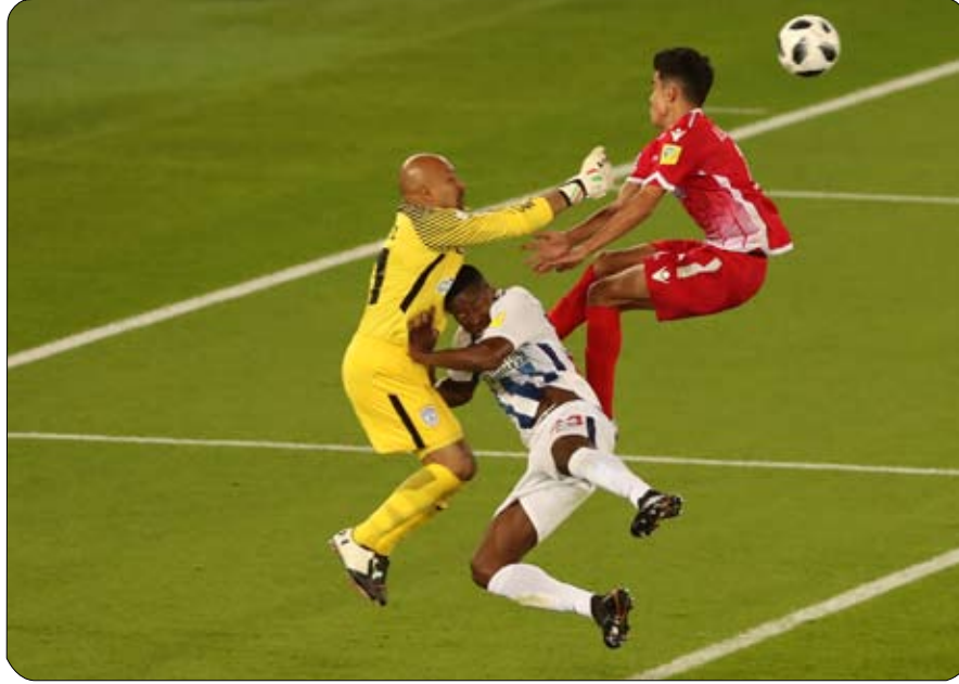
بعد تغلبه على فريق الوداد المغربي بهدف