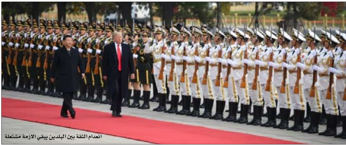
انعدام الثقة بين البلدين يبقي الازمة مشتعلة

لا تخطنوا.. كوريا الشمالية، دولة معزولة تملك ميزانية دفاع تقل ما يقارب المائة مرة عن ميزانية الولايات المتحدة، ولم تصبح قادرة على الحاق الضرر باستقرار شرق آسيا إلا لأن التنافس الإقليمي بين واشنطن وبكين سمح لها بذلك.