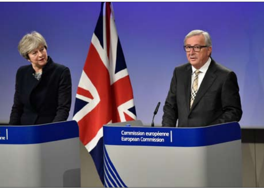
حزم جان كلود يونكر دفع البريطانيين للتنازل