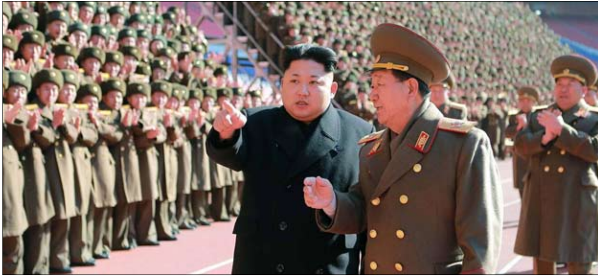
أي حل للغز الكوري الشمالي

مدير تحرير مجلة لئونفال اوبسرفاتور الفرنسية