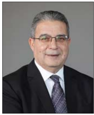
والذي سيسلط الضوء على الإمكانيات الهائلة لعالم تقنيات الكم.

الذي سيسلط الضوء على الإمكانيات الهائلة لعالم تقنيات الكم.