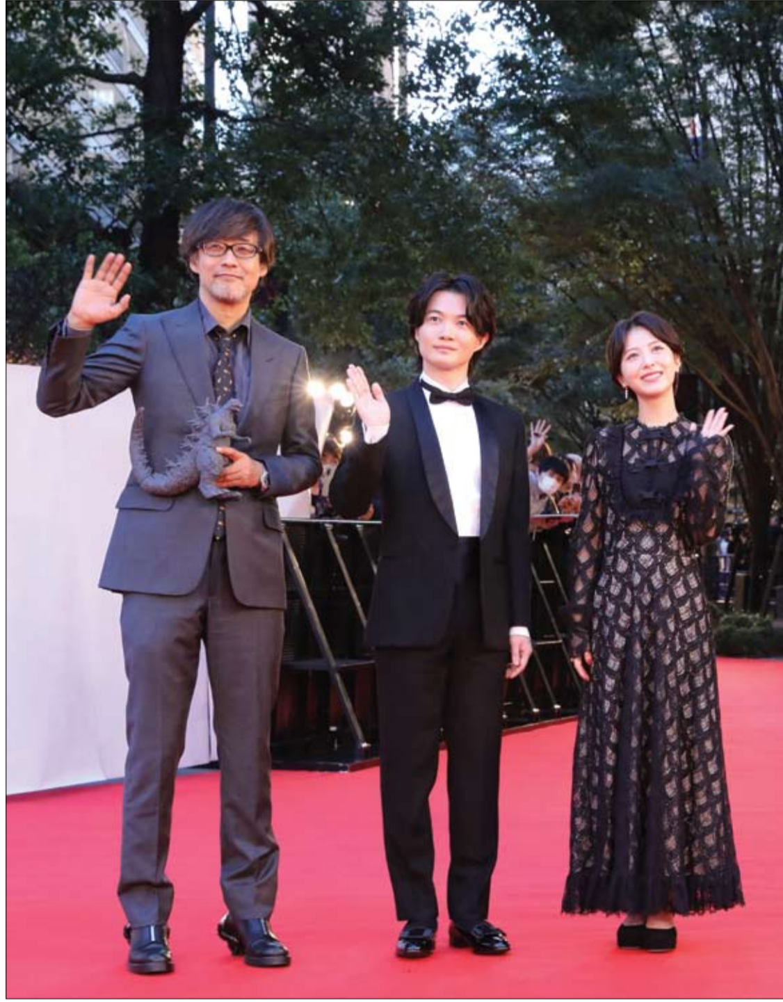
الممثل رينوسوكي كاميكومي والممثلة مينامي هاماجي، والمخرج تاكاشي يامازاكي في صورة تذكارية لفيلمهم Godzilla Minus One، والذي سيتم عرضه باعتباره الفيلم الختامي لمهرجان طوكيو السينمائي.

أعلن الدكتور ميخائيل بولكوف أخصائي أمراض المناعة، أن داء كثرة الوحيدات يشكل خطورة للأشخاص الذين يعانون من مشكلات في منظومة المناعة. ويشير الطبيب إلى أن داء كثرة الوحيدات يعتبر من الأمراض الفيروسية الخفيفة، ويشبه بمساره التهاب الحلق، ولكن يمكن أن يشكل خطورة على من يعاني من مشكلات في منظومة المناعة. ويقول: «السبب للمرض هو فيروس ابشتاين بار، ومسار المرض يشبه مسار التهاب الحلق، بيد أنه لا يعالج باستخدام مضادات الحيوية، بل بأدوية مضادة للفيروسات. يؤدي المرض عند تطوره إلى تضخم العقد اللمفاوية والكبد والطحال وترتفع درجة حرارة الجسم، وهذه الأعراض ليست سوى تعبير عن العدوى». ووفقاً له، هذا المرض يمكن أن يشكل خطورة على من يعاني من مشكلات في منظومة المناعة. ويقول: «ينتقل المرض كعدوى فيروسية اعتيادية عن طريق رذاذ التنفس والكلام، وأنه يشبه التهاب الجهاز التنفسي الحاد. ولكن قد تكون لياقة البدنية خصائص مميزة وقت الإصابة بالعدوى».