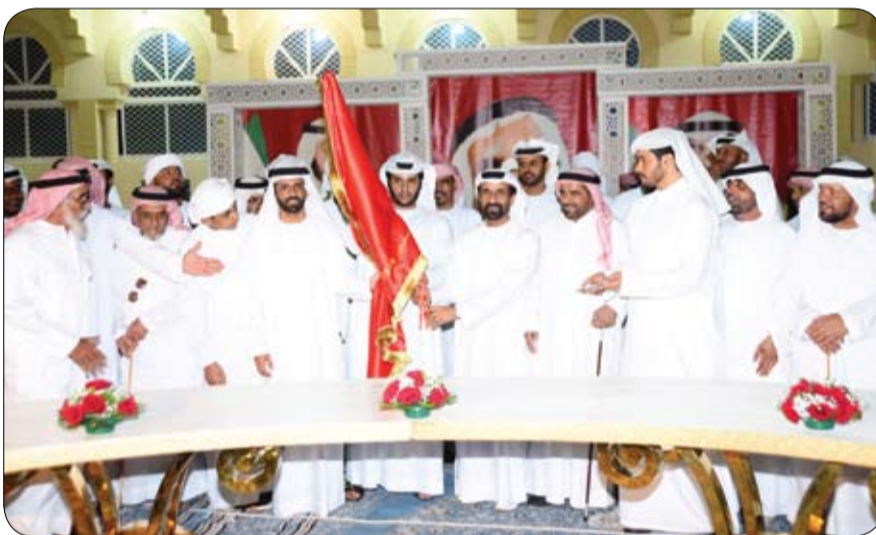
في موسمه الأول