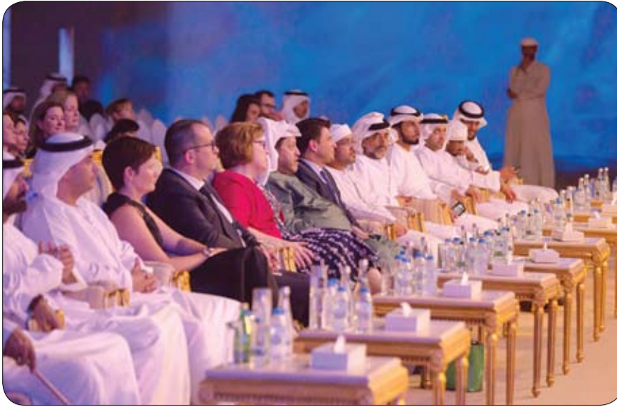
مع انطلاق موسم موسيقى أبوظبي الكلاسيكية