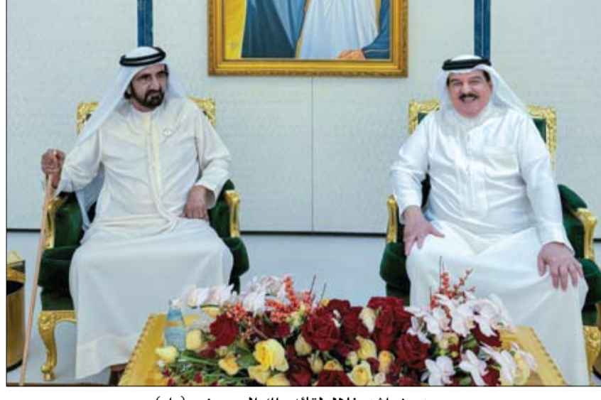
محمد بن راشد خلال لقائه ملك البحرين

بمناسبة اليوم العالمي لشلل الأطفال ذياب بن محمد بن زايد يتواصل عبر الاتصال المرئي مع الفرق الصحية لمكافحة شلل الأطفال في باكستان ويشيد بجهودهم •• أبوظبي-وام: أجرى سمو الشيخ ذياب بن محمد بن زايد آل نهيان، رئيس مكتب الشؤون التنموية في ديوان الرئاسة، اتصالاً مرئياً مع عدد من المتخصصين في القطاع الصحي العاملين في الخطوط الأمامية لحملة الإمارات للتطعيم ضد شلل الأطفال في باكستان. وأعرب سموه، خلال الاتصال الذي جاء بمناسبة اليوم العالمي لشلل الأطفال عن شكره وتقديره لجميع العاملين في حملة الإمارات للتطعيم ضد شلل الأطفال في باكستان وأثنى على جهودهم المتواصلة من أجل مكافحة شلل الأطفال. وأكد سموه أن الفرق العاملة في الميدان في الخطوط الأمامية هي العنصر الأساس في إنجاح مثل هذه الحملات الصحية، وبشكل خاص في الظروف البيئية والتضاريس الصعبة. (التفاصيل ص 7)