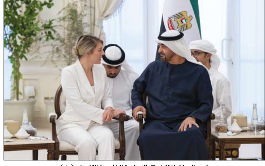
رئيس الدولة خلال استقباله وزيرة الخارجية الكندية

•• أبوظبي - وام: التقى صاحب السمو الشيخ محمد بن راشد آل مكتوم نائب رئيس الدولة رئيس مجلس الوزراء حاكم دبي، رعاه الله، أمس الثلاثاء أخاه صاحب الجلالة الملك حمد بن عيسى آل خليفة، ملك مملكة البحرين الشقيقة، في مقر إقامة جلالته في أبوظبي. ورحب صاحب السمو الشيخ محمد بن راشد آل مكتوم خلال اللقاء بزيارة جلالته الملك حمد بن عيسى آل خليفة إلى بلده الثاني الإمارات، مؤكداً سموه عمق الروابط الأخوية بين الدولتين، وما تشهد من تطور مستمر يتجسد في أطر الشراكة والتعاون في العديد من القطاعات الحيوية، وبما يخدم تطورات البلدين والشعبين الشقيقين. (التفاصيل ص 2)