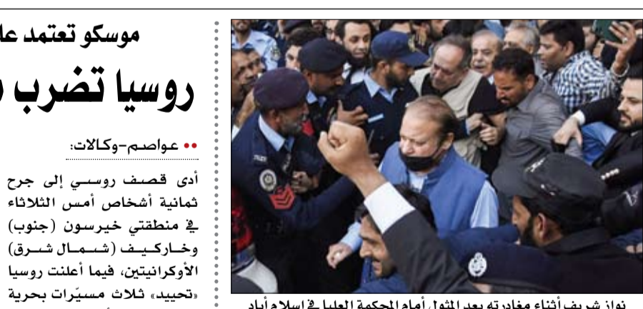
نواز شريف أثناء مغادرته بعد التناول أمام المحكمة العليا في إسلام آباد

•• عواصم-وكالات: أدى قصف روسي إلى جرح ثمانية أشخاص أمس الثلاثاء في منطقتي خيرسون (جنوب) وخاركيف (شمال شرق) الأوكرانيين، فيما أعلنت روسيا «تحبيد» ثلاث مسيرات بحرية تابعة للقوات الأوكرانية في البحر الأسود. وكتب وزير الدفاع الأوكراني إيغور كليمنكو على تلغرام أن أربعة أشخاص بينهم طفل يبلغ 12 عاماً، جرحوا خلال قصف «بذخائر حارقة» على قرية بيلوزيركا شرق مدينة خيرسون. وأضاف أن «عشرين منزلاً وشبكة للغاز وعدداً من السيارات والمباني التجارية تضررت». في منطقة خاركيف، جرح أربعة أشخاص أيضاً ونقلوا إلى المستشفى بعد غارة على قرية بوروفا، حسب وزير الدفاع. إلى ذلك، أشارت القوات الجوية الأوكرانية إلى أنها أسقطت خلال الليل ست طائرات مسيرة متفجرة من نوع «شاهد»، انطلقت من شبه جزيرة القرم التي ضمّتها روسيا في 2014.