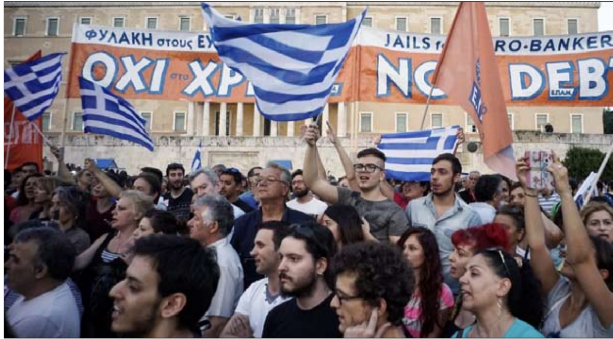
اليونانيون دهموا ثمن الأخطاء الأوروبية