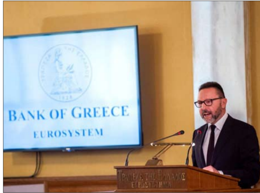
محافظ بنك اليونان يانيس ستورناراس

لأنيس ستورناراس، محافظ البنك المركزي اليوناني تعبير لطيف يُردد عنه، بالنسبة لأوروبا، كانت اليونان بمثابة قابلة التاريخ. و من هذه العبارة نفهم أنه بسبب الأزمة اليونانية، اضطر الاتحاد الأوروبي، وخاصة منطقة اليورو، إلى إجراء إصلاحات عميقة على مؤسساته المالية.