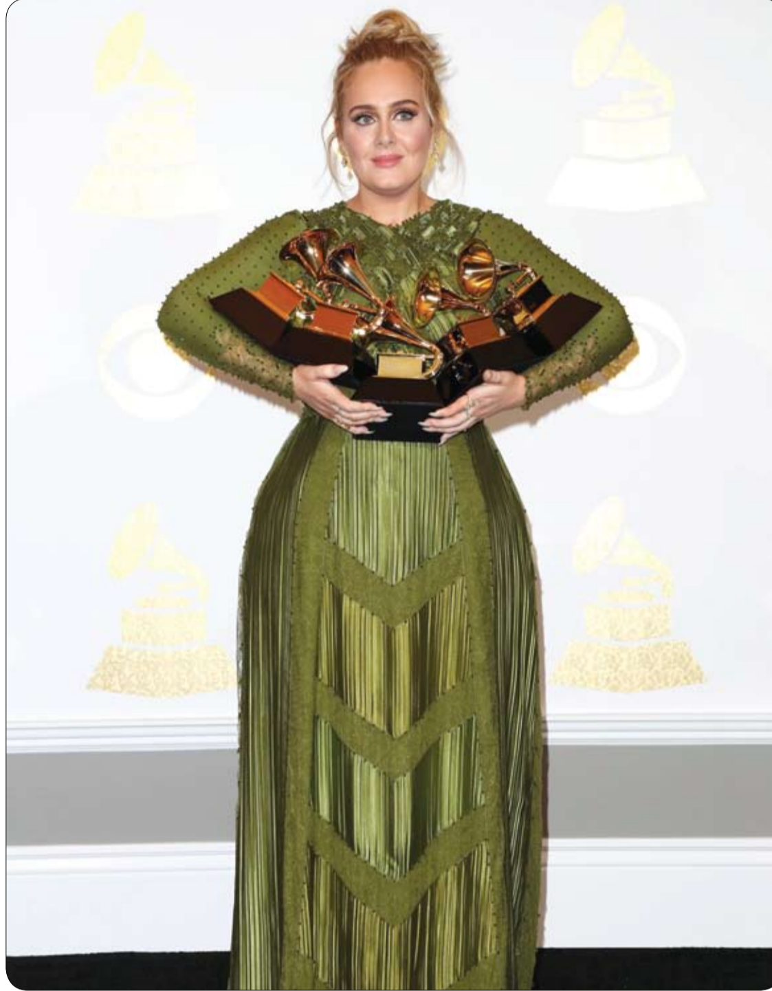
المغنية أديل، الفائزة بجائزة ألبوم العام وأفضل ألبوم بوب صوتي وأغنية السنة، أفضل تسجيل وأفضل أداء منفرد لموسيقى البوب خلال حفل توزيع جوائز جرامي في لوس أنجلوس.