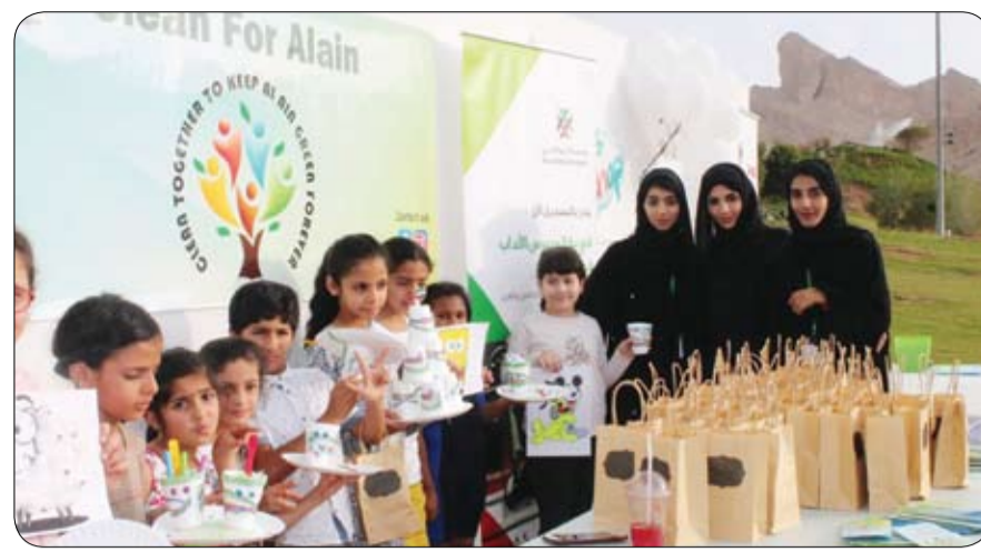
"معاً حتى تظل العين خضراء"