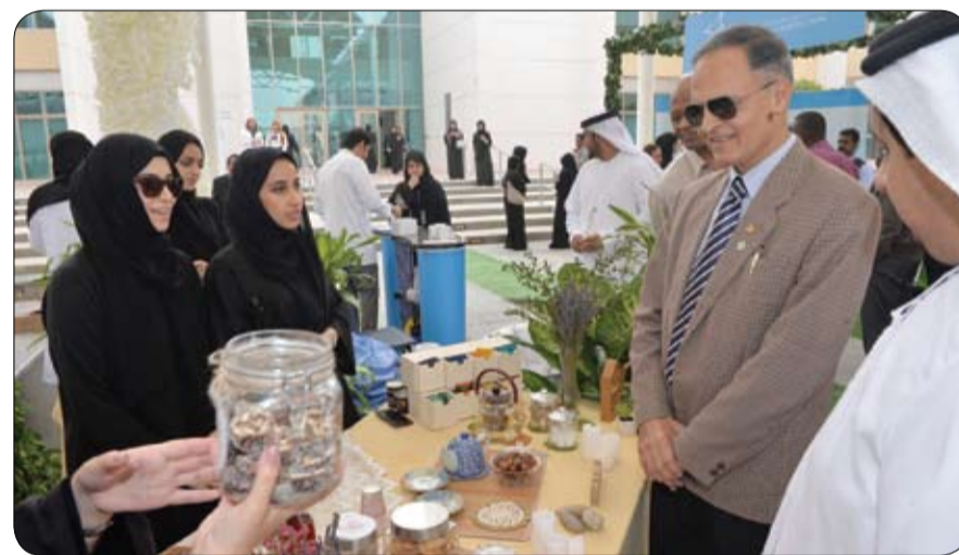
تحت شعار "الابتكار للسعادة"