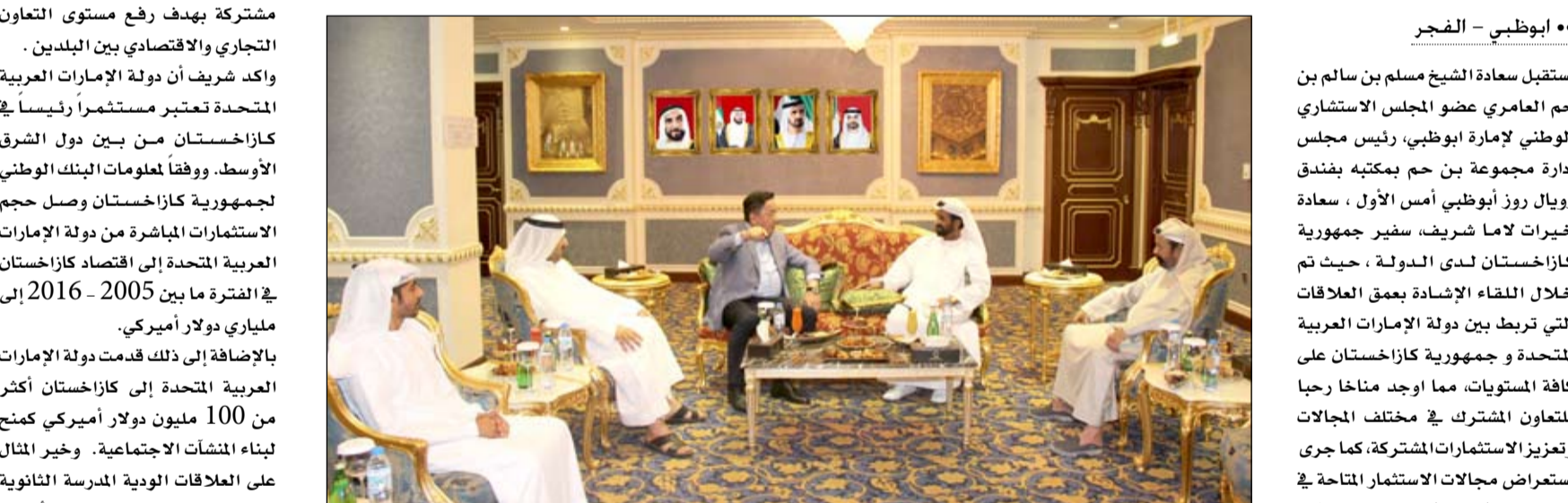
الشيخ خليفة بن زايد آل نهيان رئيس الدولة خليفة بن زايد آل نهيان نائب رئيس مجلس الوزراء حاكم دبي رعاه الله وصاحب السمو الشيخ محمد بن زايد آل نهيان ولي عهد أبوظبي نائب القائد الأعلى للقوات المسلحة، حريصة على تطوير العلاقات مع جمهورية كازاخستان وخلق فرص استثمارية بين البلدين. وأكد بن حم على اهتمام المجموعة بدراسة فرص الاستثمار المتاحة في كازاخستان وإمكانية تنفيذ مشاريع استثمارية هناك خاصة في مجال السياحة والصحة. من جانبه أشاد خيرت شريف، بتجربة الإمارات في مجال التنمية الاقتصادية والاجتماعية معتبرا أنها تقدم نموذجا يحتذى به للدول الأخرى، بفضل السياسة الحكيمه لصاحب السمو