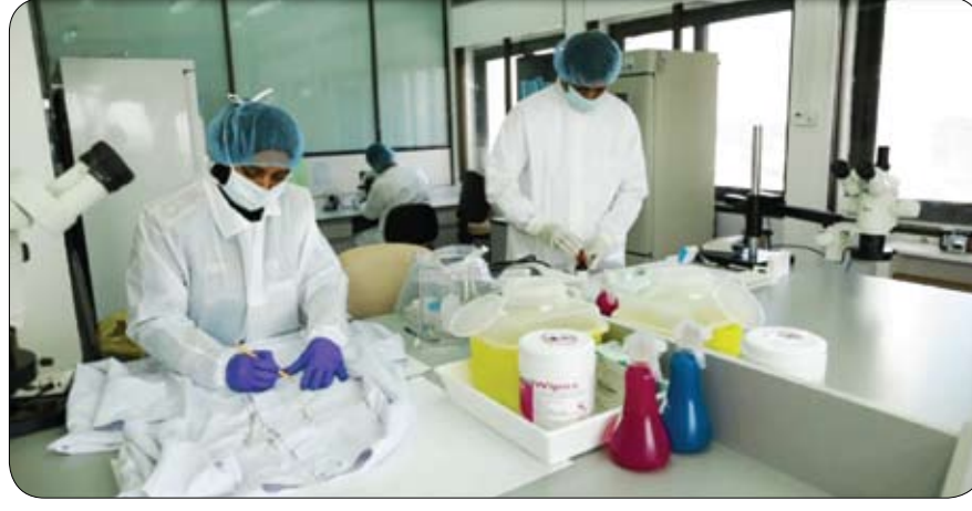
بتوجيهات محمد بن طحنون آل نهيان