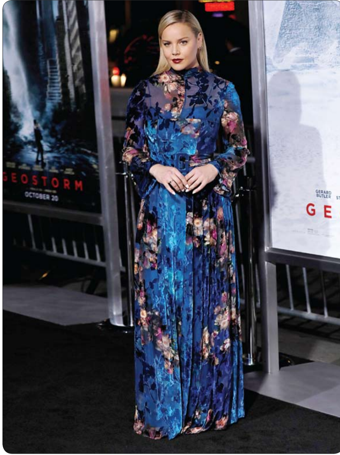
آبي كورنيس لدى حضورها العرض الأول لفيلم "جيوستورم" في لوس أنجلوس، كاليفورنيا.

ويشير الموقع إلى أن زيت جوز الهند من الأحماض الدهنية التي تعمل كمضادات للأكسدة وتساعد في سرعة التئام الجلد وإصلاح الضرر الناتج عن الجروح أو الحروق وحب الشباب، ويفضل استعماله دافئاً مع التدليك برفق لحين تشرب الجلد له وتكرار العملية عدة مرات لحين الحصول على نتائج مرضية. وأخيراً ينصح بعصير الليمون الذي يساعد على إزالة الجلد الميت وتفتيح أماكن الندبات وإخفاء آثارها وينصح بعدم تركه على الجلد أكثر من 10 دقائق والدوام على وضعه لحين التحسن؛ حيث يستغرق علاج المشاكل الجلدية عادة وقتاً طويلاً وهو ما يستلزم الصبر والدوام على الوصفات.